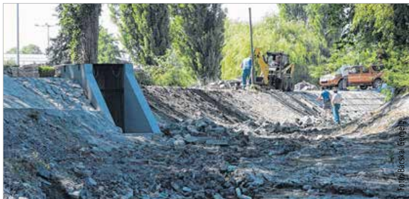
A mederkotrás mellett a partfalat is megerősítik

Augusztus elejéig elkészül a kivitelező a mederkotrással és a partfal megerősítésével, ezzel párhuzamosan pedig a Városgondnokság elvégzi a Deák-kút medencéjének kiépítését a szigeten. A Sóstó Természetvédelmi Terület rehabilitációjához kapcsolódva állami támogatással végzik a Csónakázó-tó megújításához tartozó munkálatokat. A több évtized után leengedett víz alatti mederrendbetétele és a partfal megerősítése mellett a tó környékét is érinti a beruházás. Sétány fut majd körbe, a kis szigeten elhelyezik a Deák-kutat és a csónakázás lehetőségét