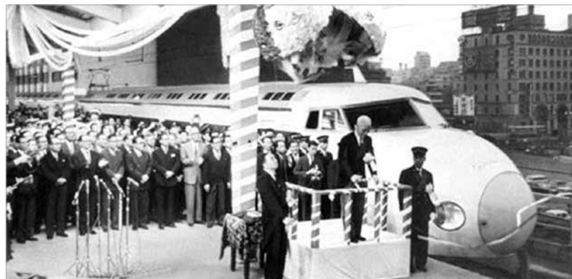
Az olimpiára időzítették a 300 kilométeres sebességre képes szupervasút, a Sinkansen első, Tokió és Oszaka közötti vonalának átadását

Nekünk magyaroknak több babér temett a távoli Ázsiában, mint Rómában. Kardozóink csodás hagyományát Pézsa Tibor ápolta tovább – igaz, csapatban 1928 óta először nem mi örülhettünk. Egyéb csapataink viszont remekeltek, hiszen női törben (ahol egyéniben Rejtő Ildikó nyert) és férfi párbajtörben is a magyar Himnuszot játszották el az eredményhirdetésnél. És vízilabdában valamint futballban is mi voltunk a császárok, bár Japánban ezzel nem így illett dicsekedni. Öttusában nem indulhatott a világbajnok Balczó András, de nélküle is született magyar arany, a későbbi sikerkapitány, Török Ferenc révén. A sportlövő Hammerl László ugyanezt a pályát járta be: olimpiai bajnokból bajnokok edzője lett. Birkózásban két nagy legendánk ért célba: az őstehetség Kozma István mellett végre aranyat akasztottak Polyák Imre nyakába. Ha valaki, ő megérdemelte: előzőleg három olimpián volt második.