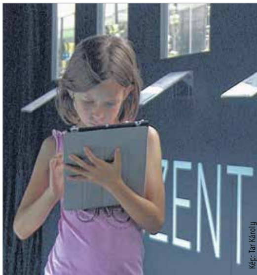
Kép: Tar Károly

„A gyerekek is könnyedén kezelik az alkalmazást. Magam is elcsodálkoztam, amikor teszteltük a rendszert, hogy egészen fiatal, alsó tagozatos