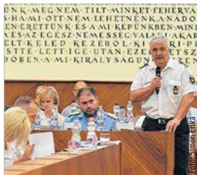
A városi rendőrfőkapitány elmondta: kiemelt feladatuk a drogterjesztők elleni küzdelem

A képviselők beszámolót hallhattak Székesfehérvár közrendjének és közbiztonságának tavalyi alakulásáról. 2015-ben a város területén a regisztrált bűncselekmények száma kis mértékben nőtt, de így is messze elmarad a 2011 és 2013 közötti adatoktól. Varga Péter megyei rendőrfőkapitány a közgyűlésen elmondta, hogy a városban élőknek nem a statisztikák, hanem saját, szubjektív biztonságérzetük a legfontosabb, így mindent megtesznek azért, hogy a lakosság számára is