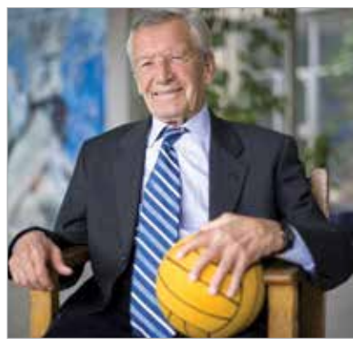
A vízilabda óriása: Gyarmati Dezső öt olimpián vett részt, három aranyérmeket nyert ezeken, a harmadikat Tokióban

technikával és épületekkel volt méltó egy olimpia megrendezésére. Tovább nőtt a résztvevő nemzetek száma, már közelített a százhoz: kilencvenhárom országból érkezett a versenyzősereg. Pedig a kommunista világ két erős bástyája, Kína és a Német Demokrati-