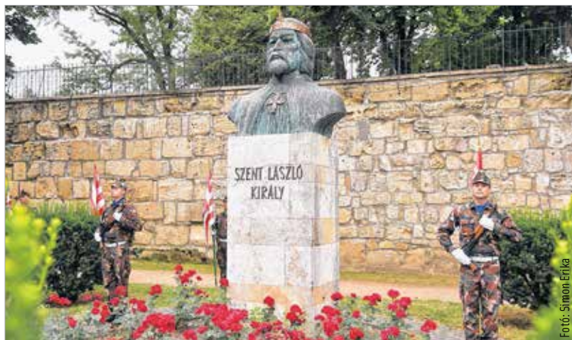
A hazáját védelmező Szent László dicső haditettei és emberi nagysága alapján az első világháború utáni időkben választották a lővérszek védőszentjévé