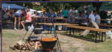
A halászlé és az első szerelem 9. oldal