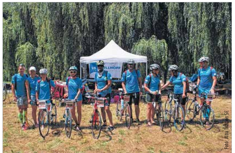
Rajtra készen! Igazán összetartó egyesület az Alba Triatlon: depózni is együtt megy a csapat.