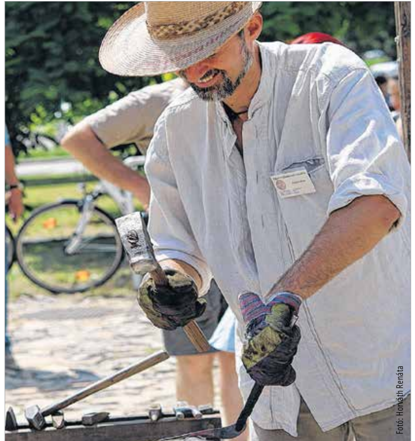
Ágyúdörgés, sólyomröptetés és fegyverbemutató is volt a 13. Tűzzel-Vassal Fesztiválon, melynek keretében a keses, kovács és fegyverműves szakma hazai és határon túli képviselői mutatkoztak be K.T.