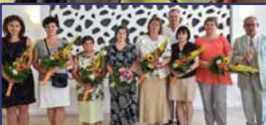
A magyar egészségügy napja 6. oldal