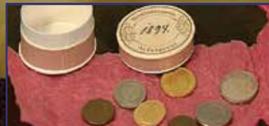
Időkapszulába zárt titok 12. oldal