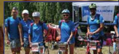
Fehérvári sikerek Kaposváron 15. oldal