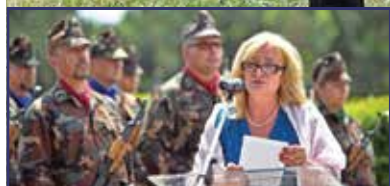
A Szentlélek temető negyedszázada 3. oldal