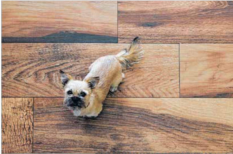
A fa vagy famintázatú burkolat otthonosságot kölcsönöz a teraszoknak

rajtuk elcsúszni. Ha a teraszt sokat süti nap, akkor a világosabb kerámiaburkolat mellett érdemes dönteni, mert a sötétebb válto-