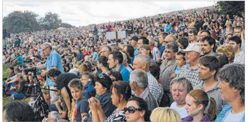
Az „újrajátszott” csatát több tízezer látogató kísérte figyelemmel a Hradec Králové melletti Chlum község határában

poroszok vagy az osztrákok vezetésével jön létre. A poroszok győzelmével az ún. „kisémet egység” valósult meg Bismarck elképzeléseinek megfelelően. Ehhez azonban a két birodalom és még több más állam tízezernyi áldozatán keresztül vezetett az út. Európa későbbi sorsa – nyugodtan mondhatjuk, hogy napjainkig – a százötven évvel ezelőtti háború, a königgrázi csata és az azt követő prágai béke nyomán alakult úgy, ahogy a történelemtényekből ismerjük és a mai napig megéljük.