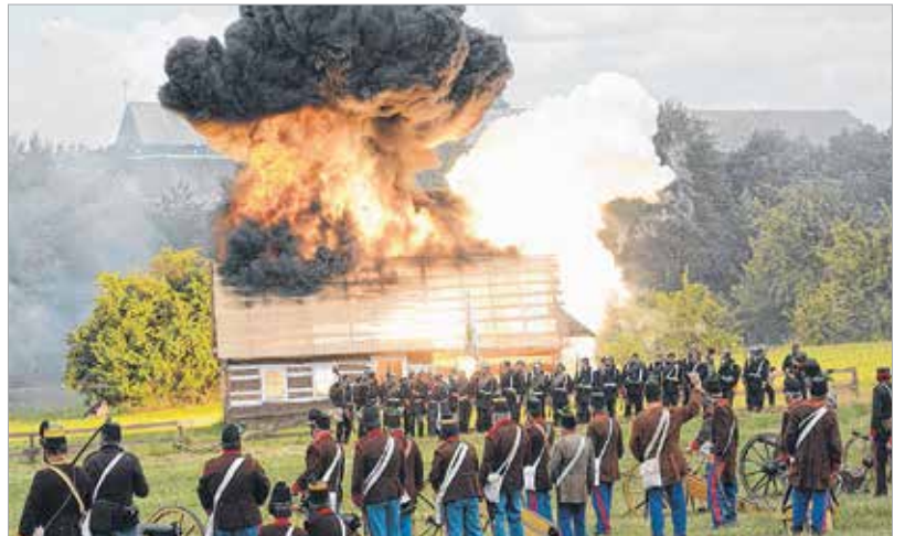
A tűz és a füst valódi: a csata ritkán látható hitelességgel pergett le a néző szeme előtt – közel két órán keresztül

Székesfehérvár polgármestere lapunknak a helyszínen elmondta: „A königgrázi csata százötven éves évfordulóján több ezer hagyományörzővel és látogatóval közösen emlékezünk erre az Európa számára meghatározó történelmi eseményre, mely mindig felhívja a figyelmünket a béke fontosságára.” Zdeněk Fink, Hradec Králové polgármestere szerint nagyon sok a hasonlóság a két település között. A kelet-cseh-