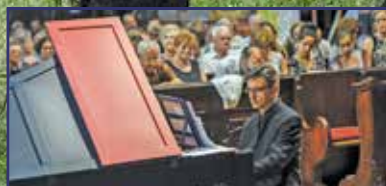
Da Vinci hangja 4. oldal