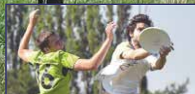
Tizenkét csapat frizbizett 14. oldal