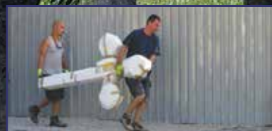
A kereszt üzenete 12. oldal