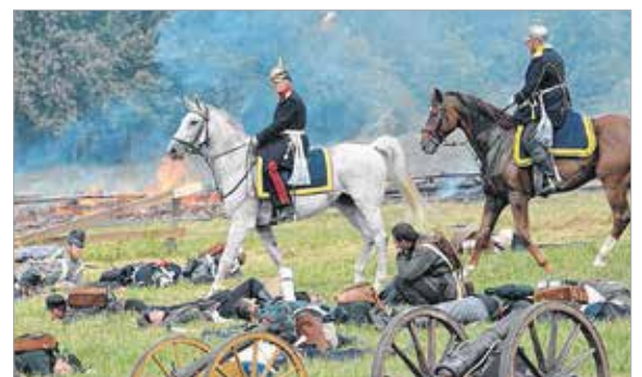
Helmuth von Moltke, a győztes porosz hadvezér

A helyszínen forgatott a Fehérvár TV stábjá. A csatát és testvérvárosunkat, Hradec Královét bemutató, hamarosan elkészülő filmet a következő hetekben többször is műsorára tűzi a Fehérvár Televízió.