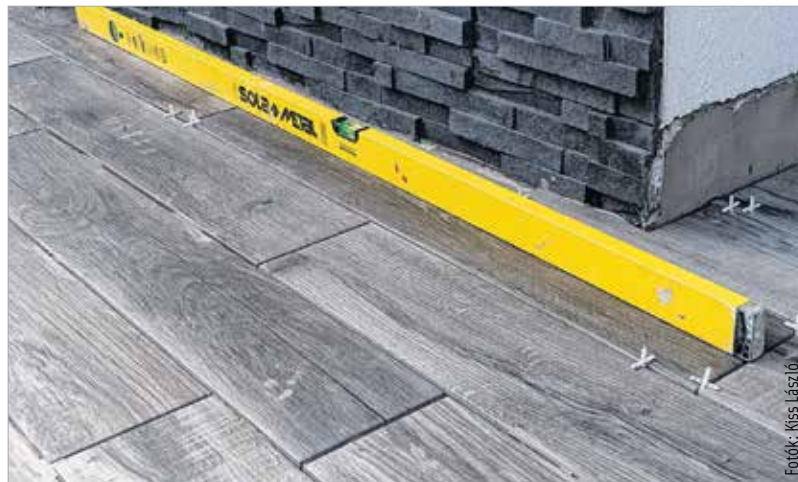
A sötét ötven árnyalata jól mutat kültéren is

A terasz alaphangulatát a burkolat határozza meg, amely lehet többek között fa, kerámia vagy éppenséggel kompozit műanyag. Kotroba Dénes üzletvezető és burkolattanácsadó kiemelte, hogy a fa igazi otthonos-ságot, meleget sugároz, viszont folyamatosan karban kell tartani, többek között olajozni, csiszolni kell, hogy ne keletkezzenek rajta repedések, színváltozások. A kompozit műanyagból készült WPC-burkolatok a teraszon vagy