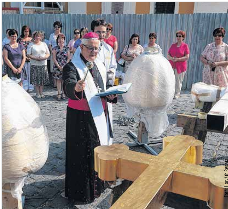
Áldás kíséri mindannyiunk keresztjét

Spányi Antal megyés püspök úgy fogalmazott, ünnepi pillanatnak érzi a mostanit és a templom felújításában egy jelentős állomásnak, amikor azt reméli, hogy a templom – melynek felújítása a város, a kormányzat illetve sok intézmény, sok ember összefogásával és az egyház erejének hozzájárulásával most megvalósult – sokáig éke és dísz lesz Székesfehérvár belvárosának. Köszönését fejezte ki, hogy elődeik nyomán ők is együttműködésben az önkormányzattal tudták ezt a felújítást megvalósítani, és most a polgármesterrel együtt tudják ellátni kézjegyükkel az emléklapot: „Egy nagyon szép emlék, amit megtaláltunk. Egy a miénket megelőző kor szeretetét mutatja a templom iránt, a közösség iránt, annak az épületnek a megbecsülését jelzi, ami azóta is a város egyik legszebb történelmi értéke. A kapszula egy elvégzett munkáról tudósítja azokat, akik majd egyszer megtalálják. Pontosan leírtuk, hogy milyen munkát és miért kellett elvégeznünk, milyen anyagi források segítettek bennünket, hogy a munka