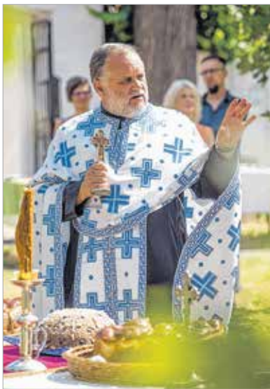
Az áldás, mely ünnepivé teszi a napot

Vasárnap tartotta a Székesfehérvári Szerb Nemzetiségi Önkormányzat és a Szerb Ortodox Egyház közösség a hagyományos Iván-napi búcsút a Rác utcában. Az ünnep délelőtt püspöki szentmisével kezdődött, amit délután a kalács- és koljivószen-telés illetve színpadi program követett.