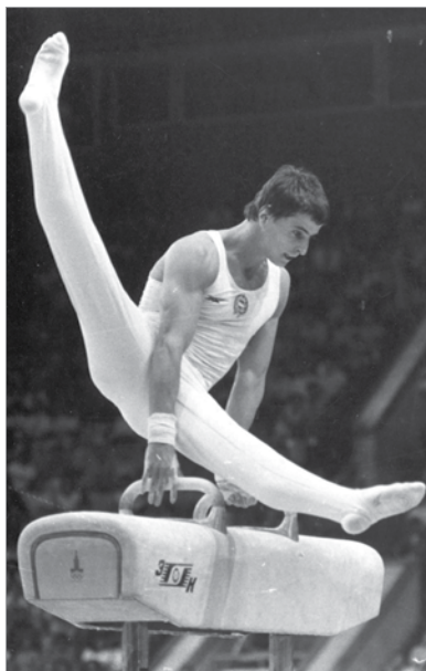
Montreal és Moszkva közös nevezője: magyar arany, pontosabban Magyar-arany lólengésben

lehetett. Az NDK atlétikában, úszásban és evezésben halmozta az aranyakat, az éremtáblázaton összesen tíz ország neve volt olvasható, a Szovjetunió sikerét további hat „szövetséges” tette