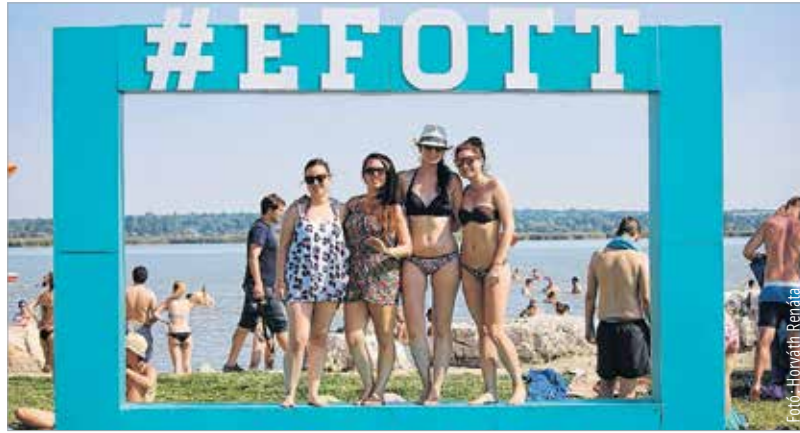
Az EFOTT felhőtlen kikapcsolódást és számtalan programot ígér a fiataloknak