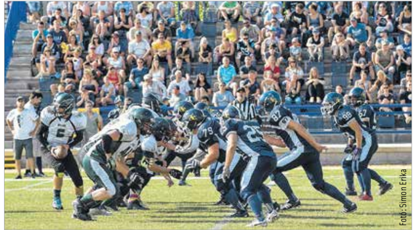
Ezüstérmesként zárt a Fehérvár Enthroners amerikaifutball-csapata a FEZEN Divízió II-ben, miután a sorozat döntőjében 35-13-as vereséget szenvedett a Budapest Eagles gardájától. A fehérváriak ősszel még kivívhatják a feljutást a Divízió I-be, az osztályozón a Tatabánya Mustangs lesz az ellenfél.