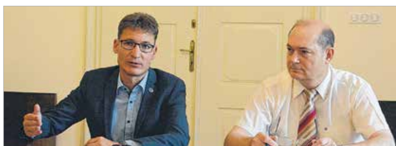
„Olyannyira népszerű a program, hogy az ideiglenes igények kielégítésére már most biztosítja a város a következő évre tervezett forrást.” – mondta Cser-Palkovics András

joga van tudnia mindenkinek, hogy ezzel mi történik.” – mondta Cser-Palkovics András. – „Nagyon fontos a mikro- és kisvállalkozások világa, és helyes az a törekvés, hogy ne az önkormányzat döntson a finanszírozásról, hanem a város szakmai partnerei.” A város polgármestere beszélt arról is, hogy még egy hasonló programot hirdet meg Fehérvár: egy nagyvárosnak kell, hogy legyen forrása arra, hogy a jövő iparágainak is segítsen vállalkozások indításában. Ahogy összeáll és dönt a startup programról a közgyűlés, tájékoztatni fogják a közvéleményt. A konstrukció legkedvezőbb eleme a két és fél százalékos kamatláb – az önkormányzat hitelenkénti négy százalékos kamattámogatásának köszönhetően. Ezekhez a hitelkonstrukciókhoz a nem helybeli vállalkozások 6,5-9,9% kamattal juthatnak hozzá. A hitel összege egy és tizmillió forint között lehet, ami három-öt éves futamidővel vehető igénybe – hívta fel a figyelmet Székfű Tibor, az RVA ügyvezetője. Az első hét hónapban több mint 97 millió forint értékben kötöttek hitelszerződést, ez közel kilencmillió forint kamatkedvezményt jelent az érintetteknek a futamidő végéig.