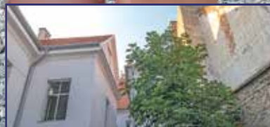
A belváros rejtett arca 8. oldal