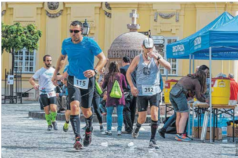
Vasárnap délután ötkor rajtol a félmaraton

Az időjósok szelet ezúttal is ígérnek, de nem olyat, mint amilyen az eredeti időpontban volt. Az előrejelzés szerint sok napsütés mellett 28-29 fok várható. Az augusztusi időpont miatt a szervezők egyébként is úgy döntöttek, hogy délelőttől délutánra, egészen pontosan 17 órára teszik a rajtot, hogy a napközbeni kánikulától megóvják a futókat. De a folyamatos folyadékpótlás és a megfelelő, könnyű, légáteresztő ruházat viselése így is kiemelten fontos!