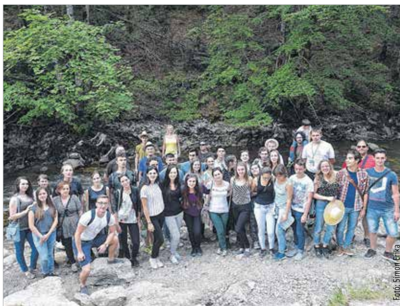
Csíkszászban is otthon, a Kárpát-medencei fiatalok körében

Annak a szabadságtudatnak, amit a fiatalok ma átélnek, komoly ára volt az elmúlt évszázadokban. Ezt hangsúlyozni kell mindenkor. El kell mondani, meg kell mutatni, hogy elődeink mi mindent áldoztak fel azért, hogy mi szabadon