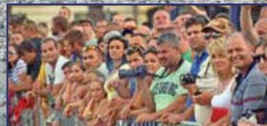
Bajnokavatás a Bajnokok városában 29. oldal