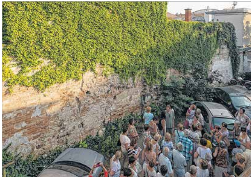
Ez a fal két alagutat is rejt

A csapat ezután az Oskola utcában az egyik legrégebbi fehérvári ház udvarába kukkantott be, ahol a gótikus kapu mellett egy ülőfülke volt vájva a falba. Igaz, csak a fele látszott ki, mert néhány évszázaddal korábban lejjebb volt a földszint, de így is vígan el lehetett képzelni a kocsisokat, akik beálltak a fülkébe, amíg az urukat vagy épp az asszonyukat várták. idegenvezető mellékesen megjegyezte, hogy