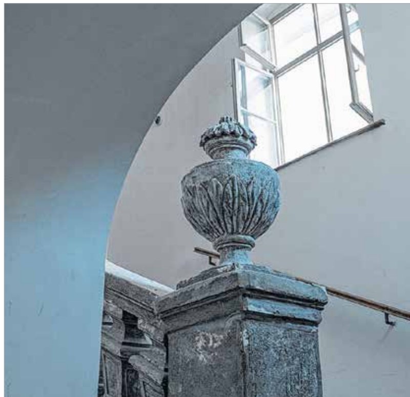
Ilyen egy „hétköznapi” barokk lépcső

„A pletykaerkélyeket leginkább nők használták. Kiültek, beszélgettek, kézimunkáztak és közben ki-kipillantottak az utcára. Akik meg elmentek alattuk,