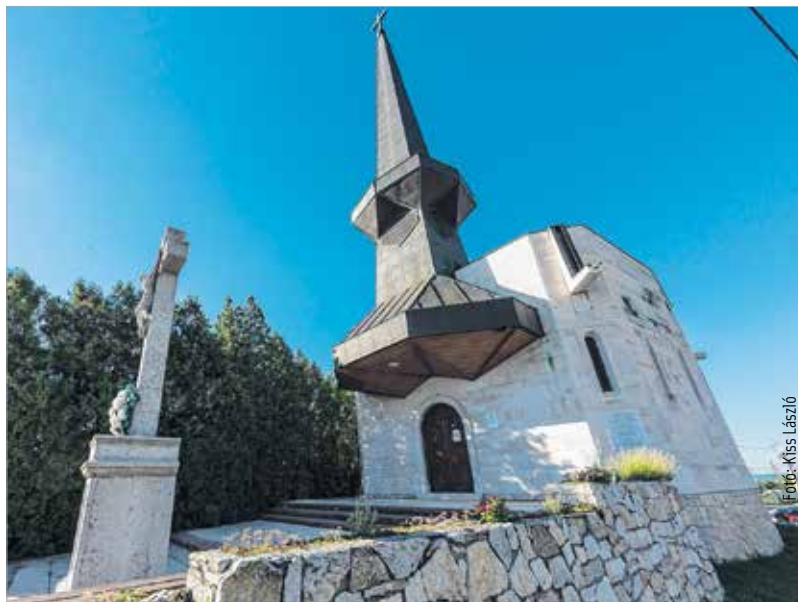
Itt a második világháború előtt egy kétszáz éves barokk kápolna állt. Szent Donát búcsúját a kápolna újjáépítése óta újra megtartják a fehérváriak.

Hazánkban is sok helyen van e szentnek kultusza: Budán 1724-ben Szent Donátot választották a város védőszentjévé, Egerben a jégeső és a mennydörgés elkerülése érdekében fohászkodnak hozzá, Székesfehérváron a szőlőművelő polgárság kérelmezte, hogy a középkor óta