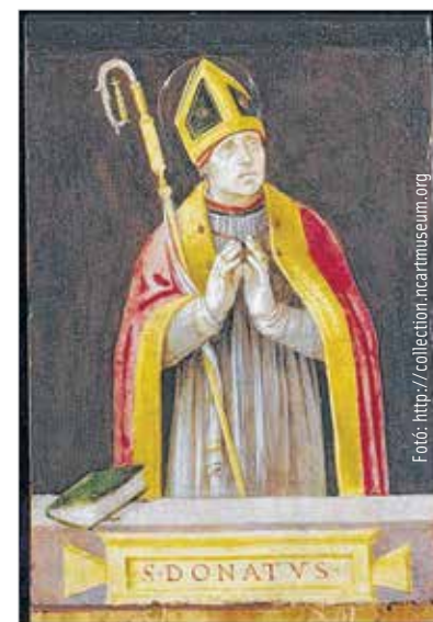
Szent Donát, kinek kezében összeforrta a széttört kehely

és bővült ez a terület. Egy 1660-as években készült összeírásban olvasható, hogy a külváros keleti részén több mint kétezer szőlőskert volt, száz évvel később pedig már nagy prészázokról szólnak a hírek. Sőt, itt volt nyaralója a püspöknek és természetesen – ahogy ma is – itt állt a kápolna. A hivatalos rendtartást 1897-ben hozták létre, ekkor rögzítették a Székesfehérvári Öreghegy Hegyközség belső működési szabályzatát. Aztán jött a filoxéra, ami szinte teljesen elpusztította a szőlőkerteket, de ez sem tántorította el a gazdákat: a régi szőlőtőkék helyére új, ellenálló fajokat ültettek. A századelőn kezdett változni Öreghegy szerepe: ebben az időszakban divatba jött a kirándulás, és a hegy kellemes természeti környezetével, hűvös pincéivel kiránduló és hétvégi szórakozóhelyé vált. Majd amikor a harmincas években felépült a Bory-vár, még ismertebb, kedveltebb hely lett Fehérvár szőlőkertje. Egyre többen lettek, akik nemcsak kirándulni, de lakni is itt szerettek volna. A huszadik század második felétől sorra vásárolták fel az akkor még megfizethető árú telkeket,