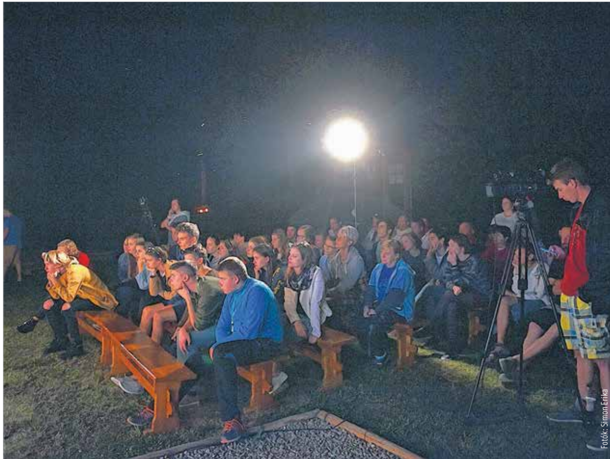
A fiatalok számára a legfontosabb, hogy megértsék a mában 56 üzenetét