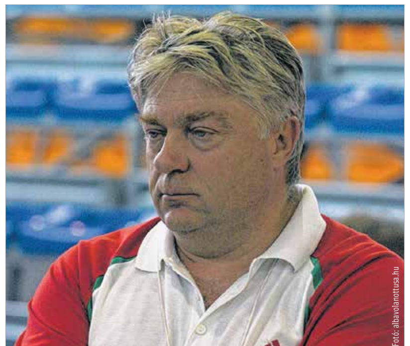
A tavaly elhunyt nagyszerű mesteredző, Kulcsár Antal az első fehérvári olimpiai bajnok klubedzője és szövetségi kapitánya is volt

„Abban az évben a tíz előző nemzetközi versenyből kilencen dobogón voltam, a legrosszabb esetben is második, mindenki tudta, hogy esélyes vagyok. Mégsem mondhatom, hogy simán ment, bár a vége sima lett. A döntő előtti napon, bár ez szinte sosem