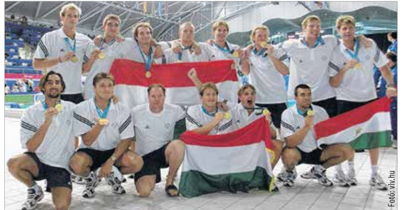
Újabb magyar hegemonia kezdődött Sydneyben, hiszen vízilabda-válogatottunk nemcsak ezt, hanem a következő két olimpiát is megnyerte

Nyolc évvel a centenárium után az újkori olimpia mégis visszatért a bölcsőhöz, és 1896-ot követően másodszor Athénba hívta a sportolókat. Mindent áthatott az ókori játékok szelleme, s ha voltak is zökkenők, nagyszerű hangulat jellemezte az olimpiát. Más kérdés, mire jutott vele (de aligha csak emiatt) Görögország. Ambivalens lehet az is, ahogy a magyar sportbarátok visszagondolnak rá, hiszen a játékok