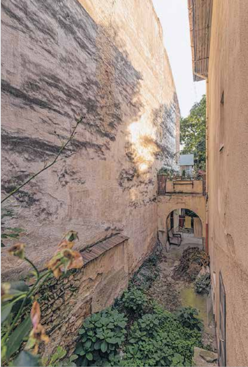
Egy eldugott belső sikátor a pihenéshez