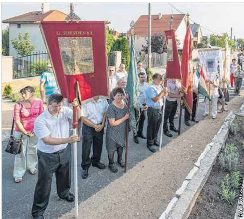
A búcsújárók ma is hagyományos zászlókkal, énekekkel vonulnak a kápolnához