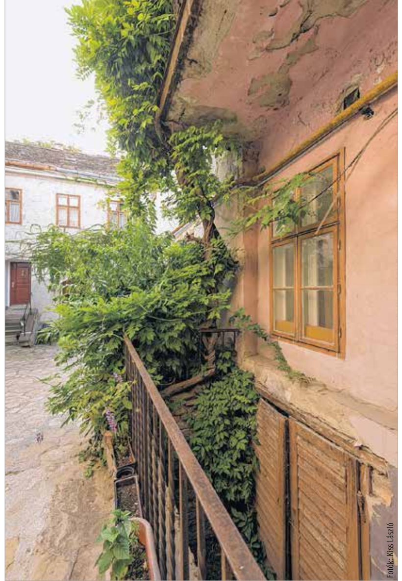
Mintha valamelyik mediterrán országban járnánk

felkiabáltak, hogy no mi van, már megint pletykáltak?" A sarokerkélyek közül az egyik legszebb a Hiemer-házé és a Jókai utca 5. szám alatti épületé, de sajnos vagy szerencsére ez utóbbi pletykaerkélyt nem lehetett közelebről is szemügyre venni, mert éppen felújítják.