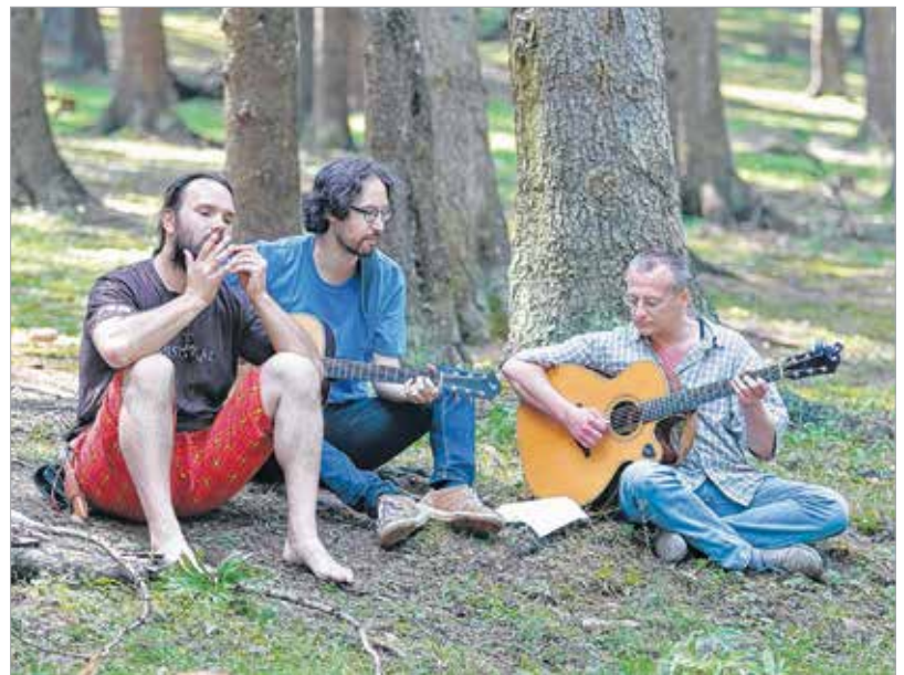
Erdély fenyőfái alatt megszólalni is nehéz, ott csak a zene segíthet, de az nagyon...

csupán az emlékezés?”. Tettük ezt azért, mert mi sem éltük meg '56-ot, de a szüleink, nagyszüleink igen. Ők meséltek erről, illetve művészbárataink is sokat segítettek. Elkezdtük olvasni azokat a verseket, amelyek a forradalom napjaiban illetve előtte és utána születtek, ezt követően indulhattott el a műhelymunka, melynek már részese volt Tolcsvay Béla és Kobzos Kiss Tamás is. Eredendően egy olyan anyagot szerettünk volna összeállítani, amely nem része a politikának,