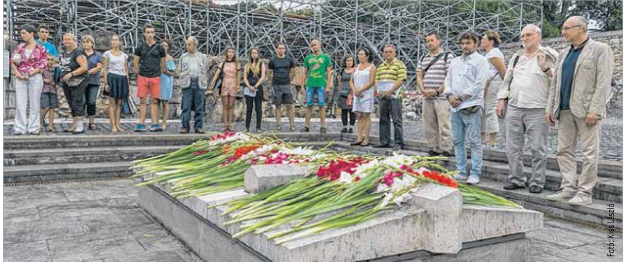
Az is hagyomány már, hogy az olvasópróbát követően az alkotócsapat kísértál a Nemzeti Emlékhelyre, és mindenki elhelyez egy szál virágot az osszáriumon. Idén sem volt ez másképp.

A látványvilágot a folytonosság jellemzi, tovább bővül a színpadkép. Idén felépül mindkét harangtorony négy haranggal, megjelenik a koronázási palást, lesz egy nagy ledrács, lesz egy függönyrendszer, amin belül és kívül is zajlanak az események, illetve idén megválnak a nagy, világító koronától, de sok mindent megtartanak a régi hagyományokból is – magyarázta Szikora János az olvasópróbán. A liturgikus játék rendezője itt mutatta be a stábot is, és beszélt az idej előadás újdonságairól, majd elolvasták az előadás szövegkönyvét.