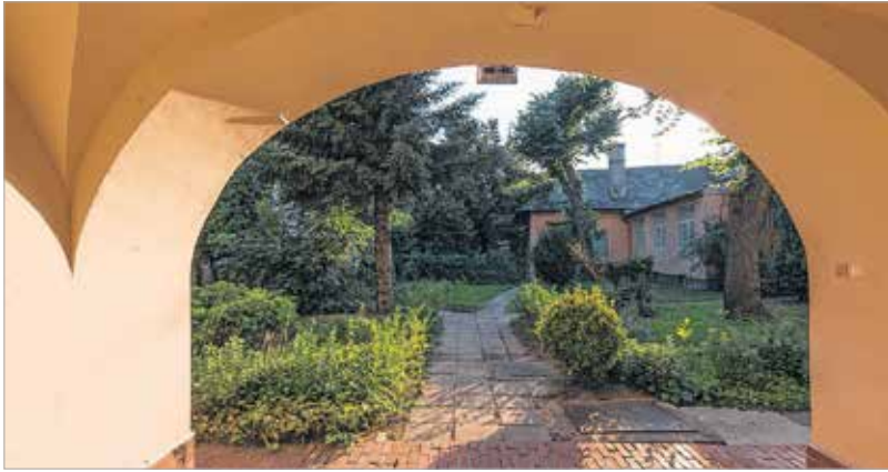
Az udvar egy igazi kis miniarborétumot rejtett

„A Kapun innen és kapun túl” könnyed nyáresti, a fehérvári Tourinform által szervezett séta előtt közel százan váraoztak az Országalmá előtt. Senki sem gondolta volna, hogy ennyien lesznek kíváncsiak a régi házak belső kertjeire.