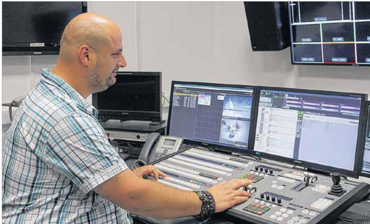
A televízió háttérében zajló adáslebonnyítás az egyik legnagyobb figyelmet kívánó munkafolyamat

Az egyik kollégám segített abban, hogy megszeressem a kerékpározást. Korábban rettentő hosszú túrákra vitt el. Valahogy a sok kín és szenvedés a hosszú utakon – főleg a hegyekben – egy idő után átváltott a biciklizés szeretetébe. Remélem, hogy erre és a családra is több időm marad majd a tévés munkám mellett.