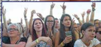
Ez a fesztivál nagyon elkezdődött 7. oldal