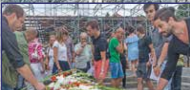
Koronázási szertartásjátékra hangolva 5. oldal