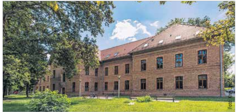
A pótfelvételeire – a Corvinus fehérvári képzésére is – augusztus 7-ig lehet jelentkezni, a ponthatárokat augusztus 25-én hirdetik ki

A Budapesti Corvinus Egyetem székesfehérvári campusán két szakra hirdettek pótfelvételt: a gazdálkodás és menedzsment szakon húsz, pénzügyi és számviteli szakon harmincöt diák tanulhat tovább, mindkét szakon lehetőség van duális képzési formára is. „A gazdálkodás-menedzsment általános üzleti és vezetői ismereteket ad, a képzés három és fél éves, amely a végén szakmai gyakorlattal zárul. A pénzügyi-számviteli szak jóval specializáltabb,