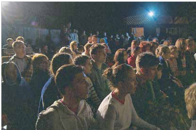
A tábor udvara megtelt – a táborlakókon kívül Csomortán apraja-nagyja is meghallgatta a zajos sikert aratott koncertet

azokat a fiatalokat szólítja meg, akiknek feladatuk lesz a történelem alakítása velünk együtt. Ahhoz, hogy ne vitrinben tartsuk az eleinktől kapottakat, és hogy maradjunk hitelesek és elkötelezettek. Arra hív, hogy legyünk jelen a saját életünkben, nyissunk a történelmünkről egy saját dossziét, és gyűjtsünk bele szépet és szomorút, jót és gonoszt. Adjunk esélyt magunknak és gyermekeinknek, hogy megismerjük a múltunkat, a maga felmagasztosult egyszerűségében!