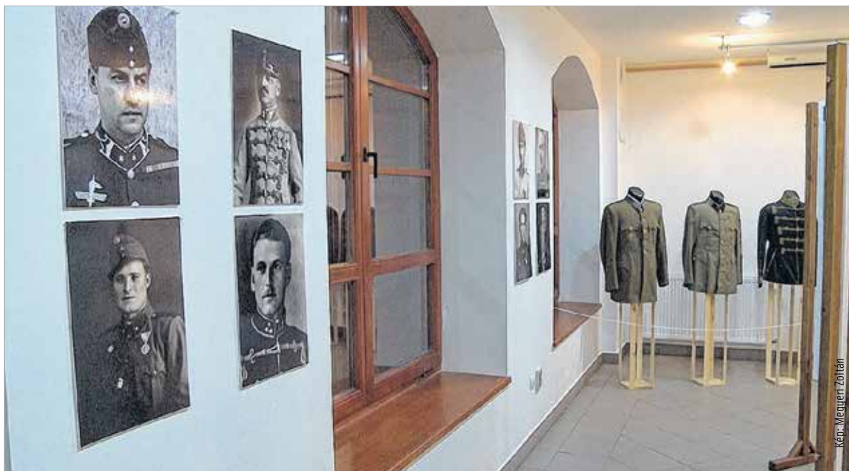
A világháborús egyenruhák és arcok üzennek a mának