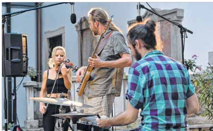
A Santa Diver számára a siker mércéje a közönség szeretete

be. Figyeltünk arra, hogy csak azokat hívjuk, akik mögött ott van a munka. Az alkalmi zenekarokat mellőztük, hiszen a közönségnek is fontos, hogy professzionális, színvonalas műsorokat hallhasson.”