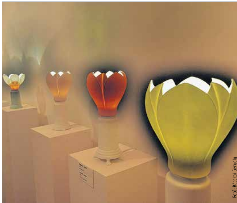
A friss és stílusos alkotások a fiatalabb generációt közelebb hozzák a herendi porcelánhoz

Az egyedüli, hártavékonyaságú, áttetsző szíromtálak, színes intarziás vázák, organikus dísz tárgyak, lámpák hamar népszerűek lettek főként Olaszországban, Görögországban és Svájcban, de eljutottak Londontól Izraelen és Hong-Kongon át egészen Új-Zélandig. Friss szemléletű, stílussteremtő műveivel célzottan a fiatalabb generáció érdeklődését szeretné a herendi porcelán felé fordítani.