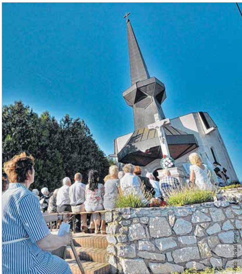
Megtelt a Kápolna tér a Szent Donát-kápolna búcsúján, melyen Spányi Antal megyés püspök celebrált szentmisét. Öreghegyen, a város legmagasabb pontján 1733-ban építettek Donát tiszteletére kápolnát a szőlőművelő polgárság kérésére. A megyés püspök a szentmisén imádkozott a szőlőskertek és szőlősgazdák védőszentjéhez, kérve közbenjárását a bő és jó termésért.