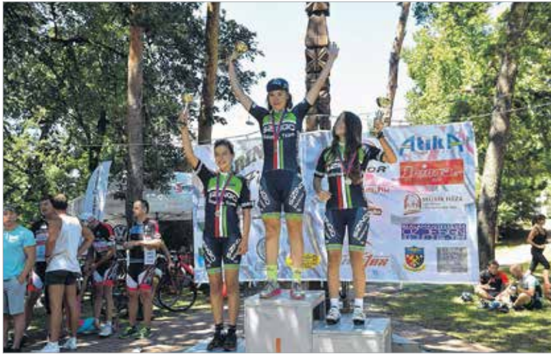
A lányok versenyében taroltak a Szingo Balaton Team bringásai

kiváló atmoszféra és a magyar kerékpársport krémjének izgalmas küzdelme jellemezte a Kincsesháza-Gúttamási-Fehérvárcsurgó útvonalú, 17,4 km-es, 166 méter szintkülönbségű pályán megrendezett megmérettetést. Az esemény rangját emelte, hogy ez évben is ezen a versenyen dőlt el, ki viselheti a magyar bajnoki trikót a Senior kategóriákban. A győzelmet – tavalyi sikerét megismételve –