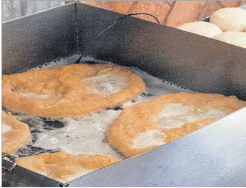
A lángos az olcsóbb utcai étkek közé tartozik, mégis jól lehet lakni vele

A skálás lángos friss illata a sejtjeinkig hatolt. Törtünk, haraptunk, kóstoltunk és megállapítottuk: a széle ropogós, de nem annyira,