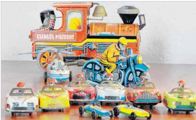
A lemezárugyári játékokat még ma is sokan féltve őrzik

Túlzás lenne kijelenteni, hogy a gyerekek ma már nem játszanak, hiszen már babakorban is azt teszik, csak éppen máshogy és mással, mint elődeik tették. Abban azonban biztosan igazuk van a régi idők játékaikat visszakiadván embernek, hogy az egyik legfontosabb játéktevékenység, a mozgásos játékok kikoptak az életünkben, és ez valóban káros és egészségtelen.