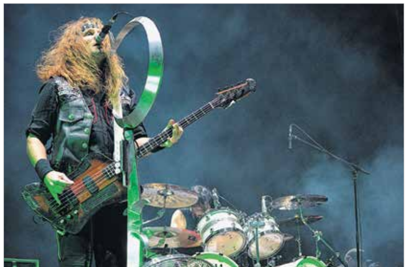
A pénteki vihar ellenére a Tankcsapda vállalta a fellépést