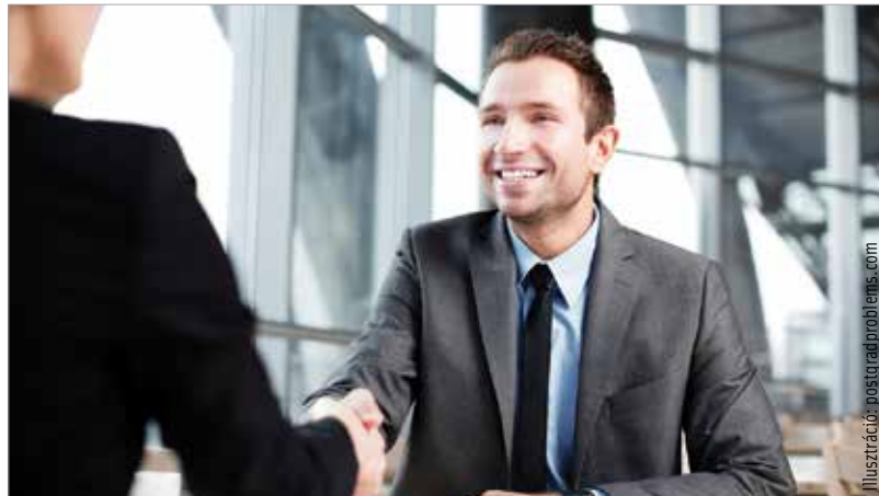
Kézfogásnál nézzünk mindig a HR-es szemébe!

Következő lépésként nézzük át a közösségi médiában megtalálható adatlapjainkat! A magyar DGS Global Research kutatócég felméréséből kiderült, a személyzetiek közel negyven százaléka a közösségi oldalakon is rákeres a pályázókra. Néhány féktelenül bulizós fénykép vagy az önéletrajznak teljesen ellentmondó információ pedig nem segít abban, hogy miénk legyen az állás! A ruhát is érdemes jól megválasztani. A férfiak lehetőleg inget, nyakkendő és öltöny nadrágot, a hölgyek pedig kiskosztümöt válasszanak az interjú-