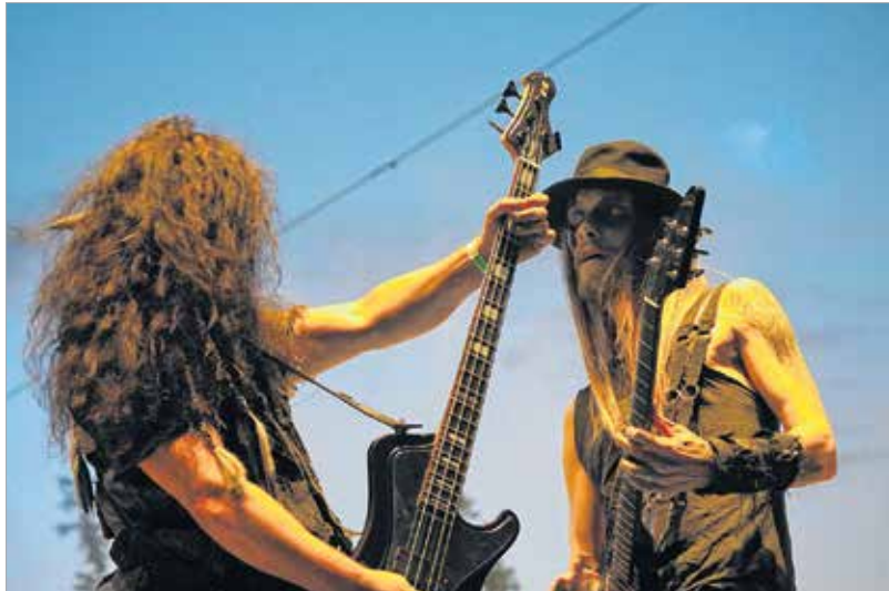
A Finnroll az egyik legjobban zúzó rockzenekar volt