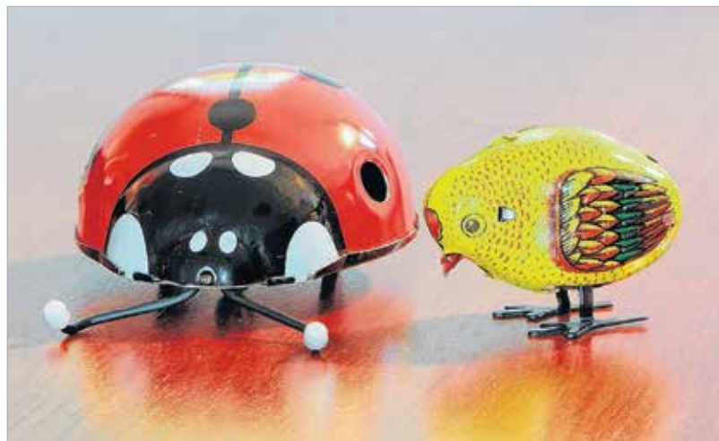
A felhúzható állatfigurák pusztá megjelenésükkel megidézik egy letűnt kor szellemét

tagozatos tanár, majd hozzátette: „Szerencsére még mindig népszerűek a gondolkodtató, fejlesztő játékok, a legó, a babák, az autók. Nagyon szeretnek focizni, kosarazni, kidobózni, fogócskázni, és mivel a gyerekek fantáziája