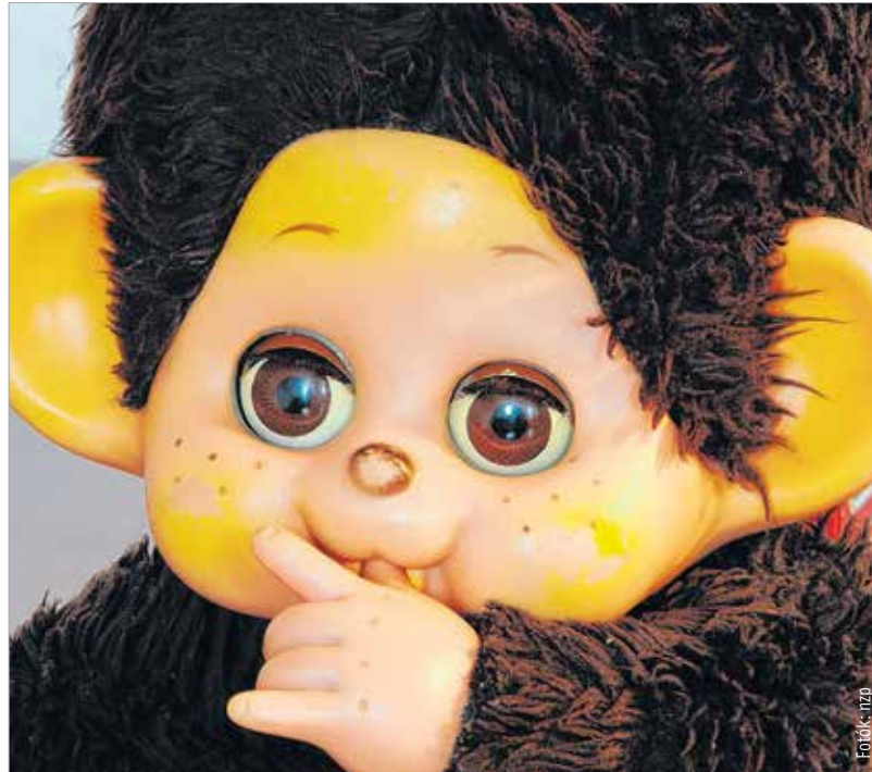
A majmot formáló, japán eredetű moncsicsi a nyolcvanas években tört be a hazai piacra

A közös játék élménye azonban a mai kor eszközeivel is megvalósítható, éppen ezért érdemes nagyobb nyitottsággal körülnézni napjaink színes játékpiacon. Még akkor is, ha ma már arányaiban talán túlzó módon kínál virtuális játékokat. Vajon a részleteiben gazdag programok megtörik-e a fantázia szárnyalását? Esetleg az interaktív játékok