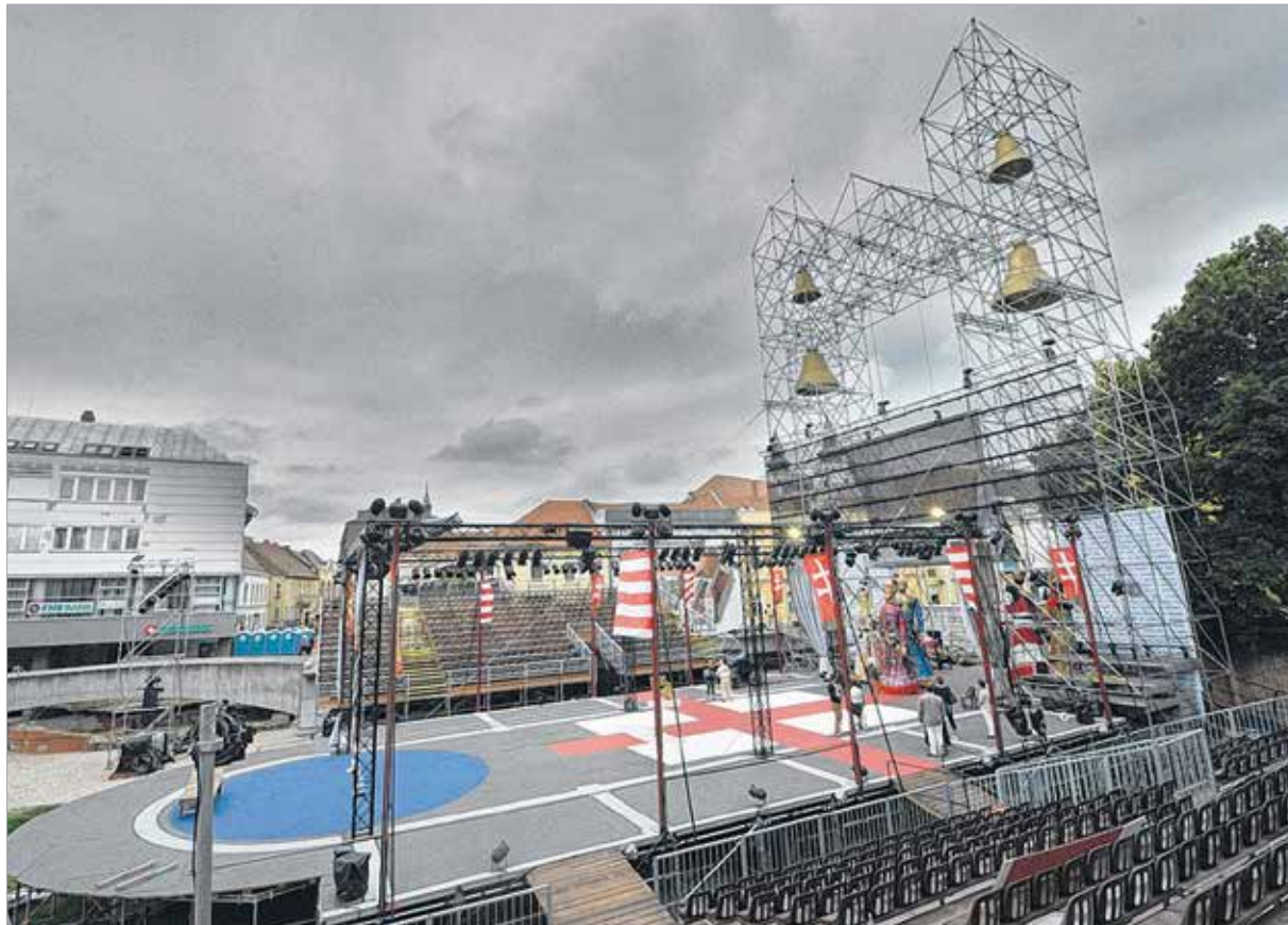
A koronázási szertartásjátékra felépült a bazilika két tornya