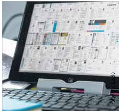
Egy jó sablont is meg kell tudni tölteni tartalommal!

Érdemes olyan állásportálon keresgélni, amely ismert és gyakran látogatott, és amelyen kategóriánként akár több száz ajánlat közül válogathatunk. Ma már alap, hogy ha valaki naprakész szeretne lenni adott témában, feliratkozik a hírlevélre, esetleg letölt egy applikációt, amelynek segítségével az állandóan frissülő álláspiaci kínálatról azonnal értesülhet.