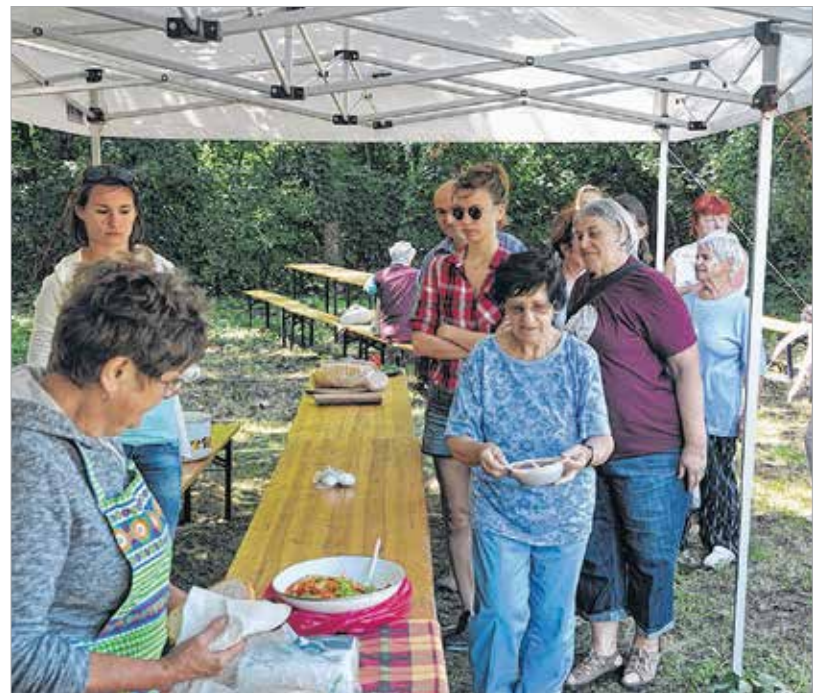
A gulyás idén is rendkívül finomra sikeredett

A szombati programon különböző egészségügyi szűréseket is szerveztek a Vöröskereszt munkatársainak jóvoltából. Az eseményen ezen kívül aláírásgyűjtést is tartottak, amit Székesfehérvár Önkormányzata hirdetett meg a koronázási palást hazahozataláért és Székesfehérváron történő kiállításáért.