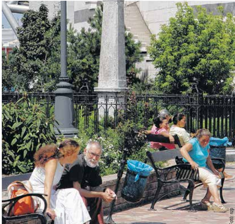
A Máriáról készült szobrot 1700-ban állították fel arra a területre, ahol Szapolyai János eltemették. E helyet mára elnyomja a bevásárlóközpont fala, de Szűz Mária szobrának hiteles másolata ma is áll az eredeti posztamenten. Az 1700-ban felállított eredeti szobor a városháza első emeletén látható.

ünnepét is más magyarázatot kap, hiszen számukra nincsenek a Földről felköltöző szentek. Az egyház-erősítés viszont a protestáns egyházaknak is fontos volt, azért István földi érdemeit elfogadják, amely az őskeresztény elveken alapult, amihez a reformációt követően a protestánsok is igyekeztek visszatérni. Ezért Szent István ünnepét a reformátusoknak, evangélikusoknak és baptistáknak is.