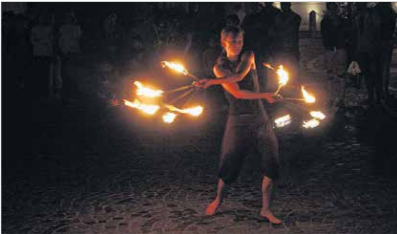
A Prometheus Project a Fő utca több pontján is bemutatót tartott

közönség. A Prometheus Project a székesfehérvári tűzszonglőrök által indított kezdeményezés a környékbeli zonglőrök összefogására. A tűzszonglőrök tárházában olyan mutatványok szerepeltek, mint a hosszú bot, a poi, az angyalszárny, a virágpálca, a tüzes legyező, a mazorettpálca, a tüzes hulahopp vagy a kéztűz. A Prometheus Project az Országalmától indult, majd a csapat a Fő utca több pontján is bemutatót tartott.