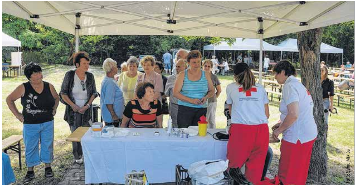
A szűrővizsgálatokon sokan vettek részt

„Nagy öröm, hogy immár tizenkettedik alkalommal lehet együtt Alsóváros, Sóstó, az Órhalmi szőlők, az utóbbi hat évben pedig Tóváros