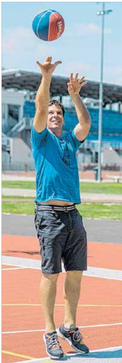
Óvodás kora óta sportol