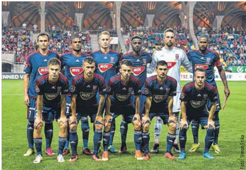
A Videoton gyirmóti sikerével elmozdult a tabella aljától, az élmezőnyhöz történő felzárkózás azonban a Mezőkövesd elleni három pontot is be kellene gyűjteni!

Az alap tehát megvan a jó folytatáshoz, mely egyben a szezon első hazai sikerét jelentené a magyar bajnokságban. Az Európa Liga selejtezőjében a Zaria Bálfi és a Csukaricski is behódolt Felcsúton a Vidinek, a bajnokságban azonban a DVTK és a Vasas is nyerni tudott a Pancho Arénában, így a cél nem lehet más a piros-kékek számára, mint a szintén újonc, négy forduló alatt öt pontot szerző Mezőkövesd legyőzése a szombat 18 órakor kezdődő találkozón.