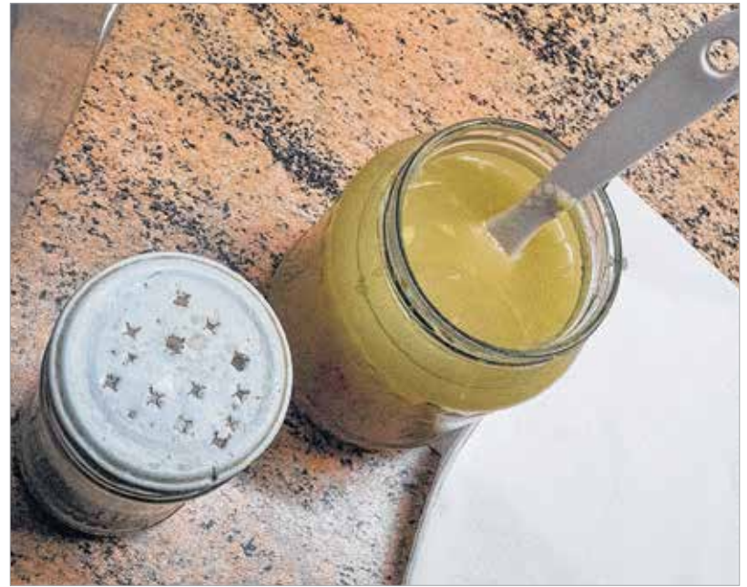
Fokhagymából rengeteg fogy

mint a piacos változaté, és belül omlós, de nem annyira puha, mint a parkolóban kapható. Igazi arany középut, amiben mindenki megtalálhatja azt, amit egy lángosban a legjobban szeret. Külön jó pont, hogy gondoltak a madárétkű vagy éppen a kilókkal harcoló lángosimádókra is, hiszen mindegyik fajtából lehet kis adagot kérni. Mire delet ütött a bazilika harangja, úgy elteltünk lángossal, hogy