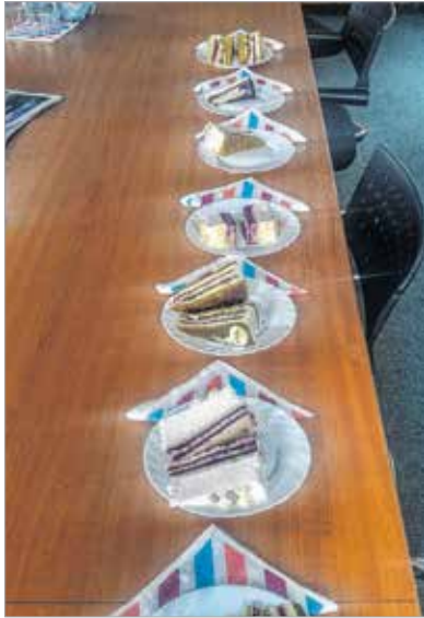
A hét torta a zsűrizés előtt

Augusztus első napjaiban már kiderült, melyik lett az ország tortája és az ország cukormentes tortája az idei évben, de csak múlt szombat óta lehet az ország több mint száz cukrászdájában is megvásárolni a győzteseket. Úgy döntöttünk, körbejárjuk a várost, és ahol csak lehet, beszerezük az ország tortáját: az Őrség zöld aranyát és a cukormentes nyertest, az Áfonya hercegnő tortáját – és alaposan teszteljük is őket.