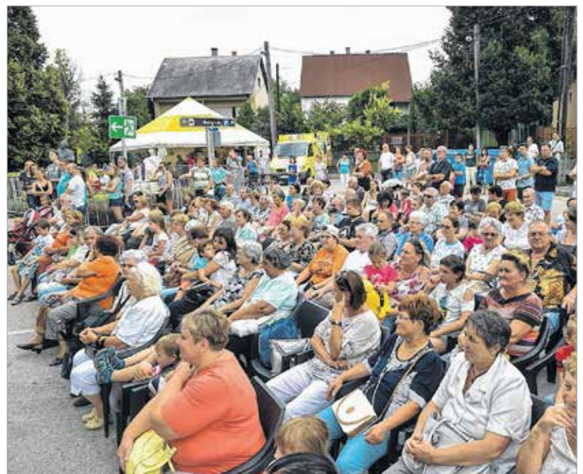
Az ünnepség népszerűsége vetekszik a belvárosi rendezvényekével