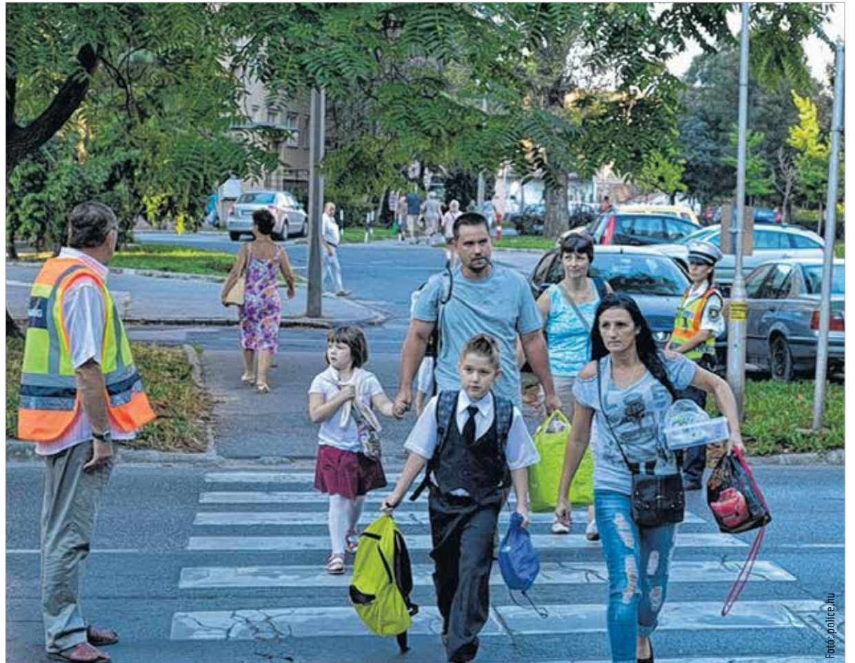
Az iskolakezdés első hónapjában rendőrök és polgárőrök segítik a közlekedést a be- és kicsengetés idején

A szóvivő hozzátette, érdemes a gyalogosok mellett a kerékpárosokra és a motorosokra is odafigyelni, hiszen baleset esetén őket semmi sem védi meg a sérüléstől. A balesetmegelőzés a főkapitányság számára kiemelt cél, ezért rengeteg prevenció programot tartanak az óvodásoknak és az iskolásoknak is, emellett rendszeresen ellenőrzik az utakon is. Jelenleg az európai sebességellenőrző akció, a TISPOL keretében razziáznak meggyekben is. Az akciót az egész országban meghirdette a rendőrség. A rendőrök elsősorban a gyorsforgalmi utakon, a főutak lakott területen kívüli szakaszain illetve a lakott területek közöttjain mérik az autók sebességét. Kedden az M7-es autópályán több helyszínen is mérték a rendőrök az autósok sebességét. Nem csak azt nézték, mennyivel halad a kocsik, más szabályta-