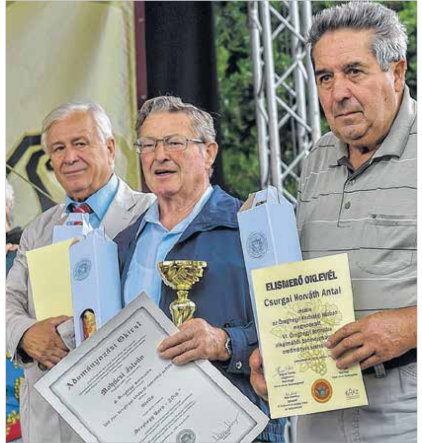
Idén is átadták „Az Öreghegy bora” kitüntető címet

Nagy Feró és Bach Szilvia. A felhőtlen szórakozást utcából biztosította, majd következhetett a tűzijáték!