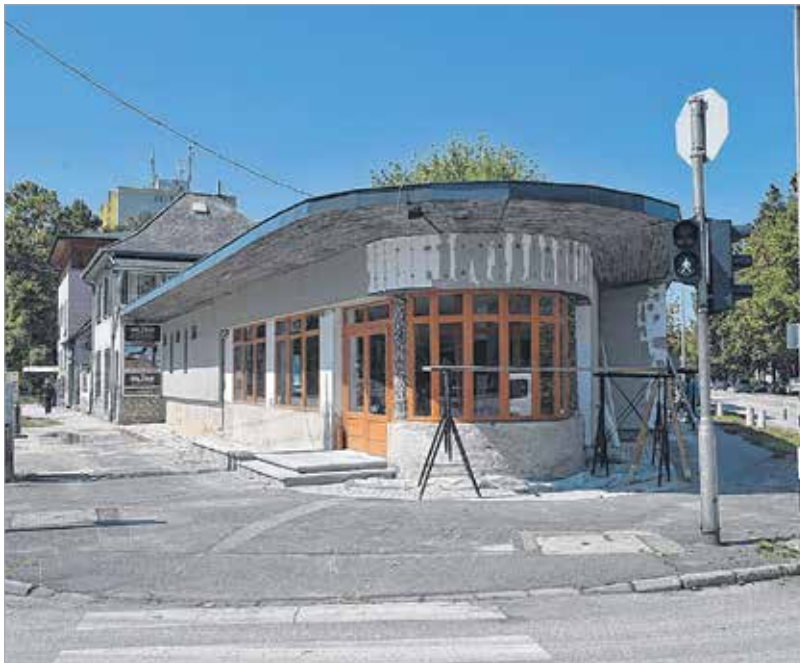
Az épületet szigetelték, már csak a festés van hátra: szürke színt kap