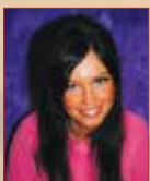
Hexina jónó www.holdfenyek.hu