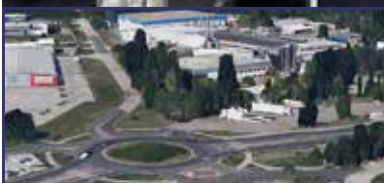
Milliárdos fejlesztések Fehérváron 2. oldal