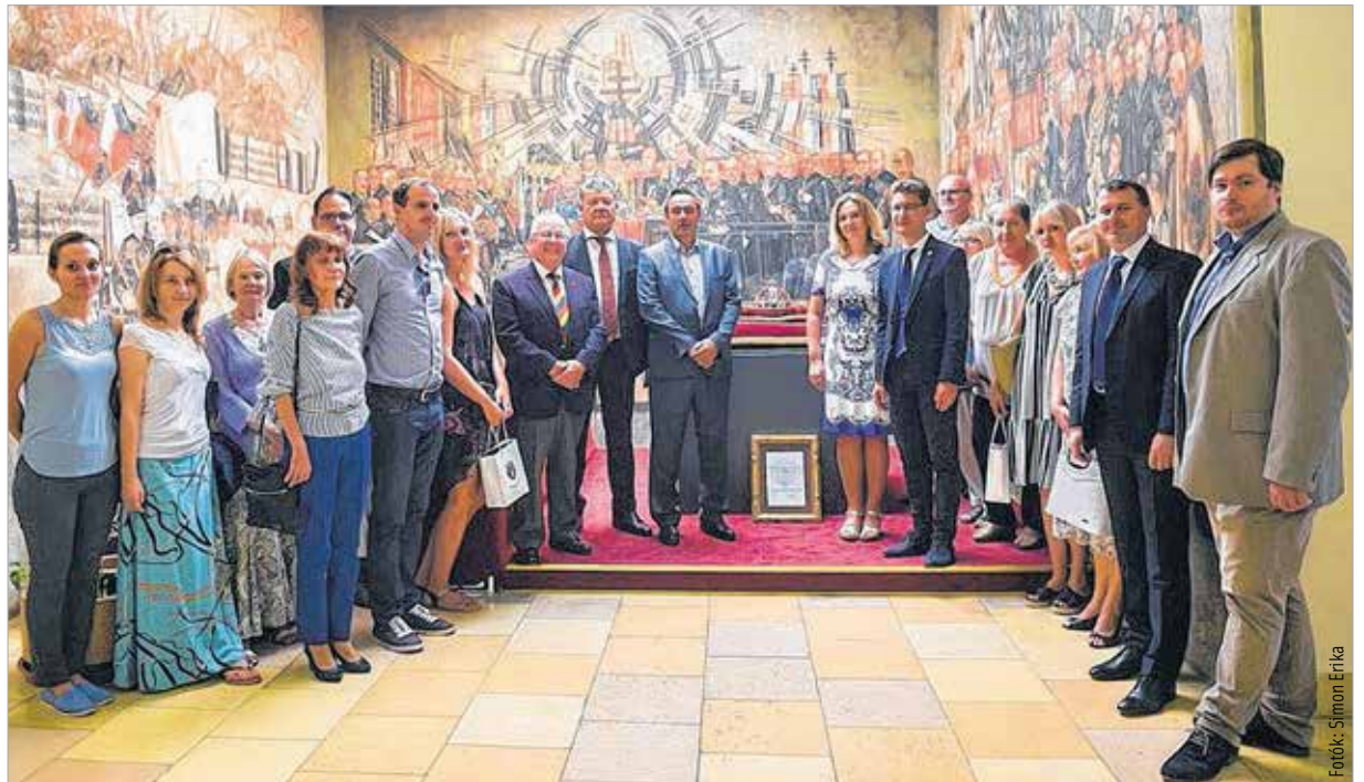
Az idei esztendőben a második legtöbb magyar királyt koronázó Pozsonyból, két Fehérvárról – az erdélyi Gyulafehérvárról és a dalmáciai Tengerfehérvárról – valamint az angliai Chorley-ből jöttek küldöttségek a Királyi Napokra