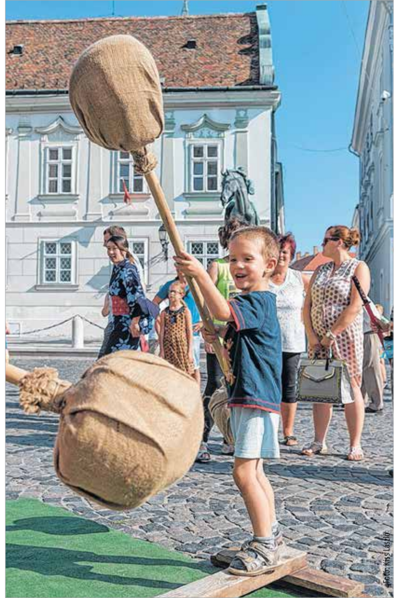
Egész nap a „Szent István városa – tele élettel!” elnevezésű program csalogatta az embereket a belvárosba. A Fő utca számos pontján játszótérrel, interaktív játékokkal, zenés fellépésekkel, lovagi bemutatókkal és számos egyéb érdekességgel várták a családokat.