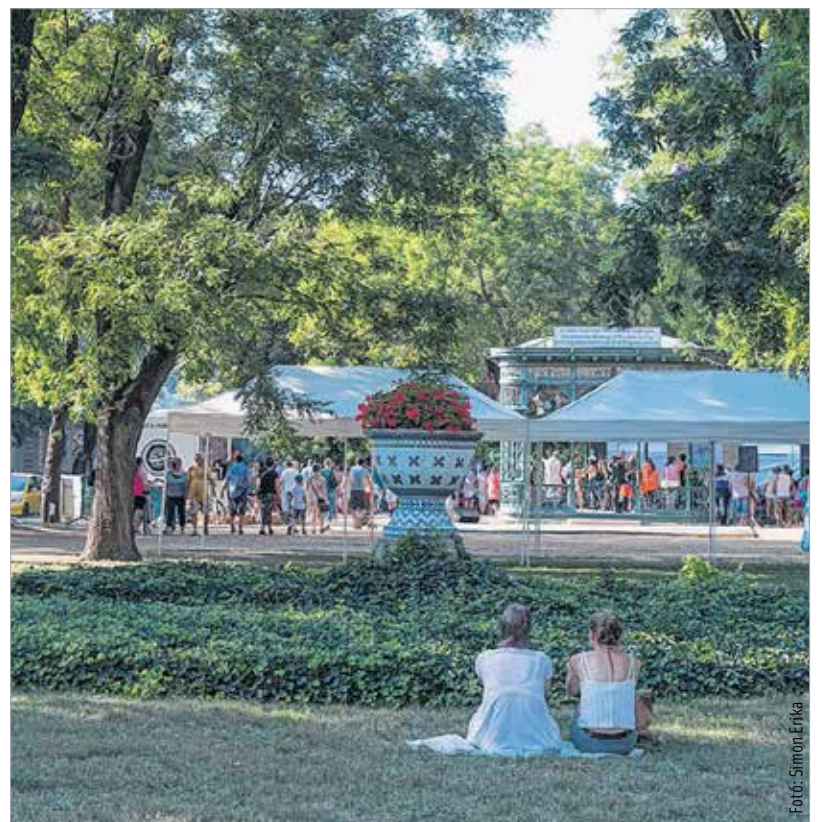
Aki a zöldbe vágyott, az is megtalálta a számítását a Zichy ligetben