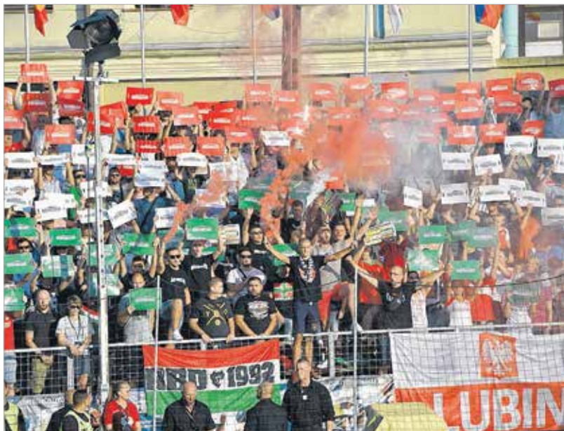
Még szerencse, hogy az Országos Minifutball Szövetségnek semmi köze az MLSZ-hez, mert most aztán jöhetne a milliós büntetés...

A vereség ellenére Magyarország bejutott a nyolcaddöntőbe. A csoport zárómeccsén Szlovénia 4-1-re legyőzte Törökországot, és ezzel megnyerte a csoportot. A magyar válogatott tehát másodikiként jutott tovább, és pénteken 15 órától Montenegróval vagy Kazahsztánnal játszik a legjobb nyolc közé jutásért.