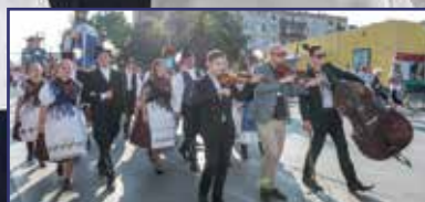
Az ünnep, mely Székesfehérváron kezdődött 4-5. oldal