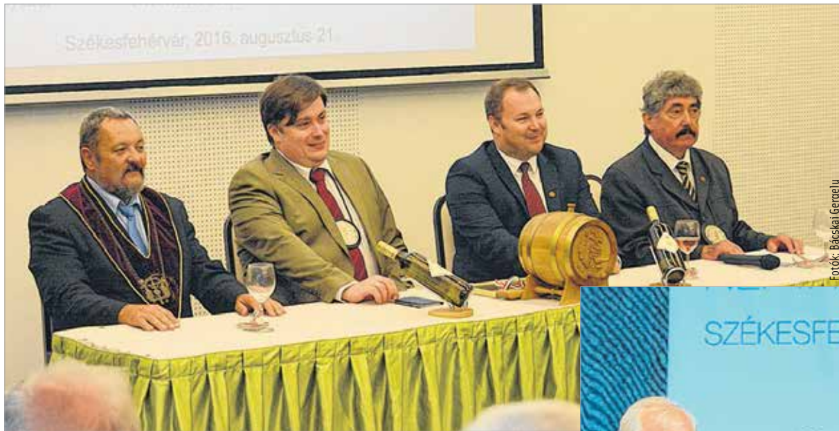
A borrendi találkozó az új nemzeti borstratégia megteremtését szolgálta

te ki, melynek eredményeként a magyar szőlő- és bortermelők előtt megnyílt a lehetőség a borturizmus fejlesztésére: „Ez a találkozó egyrészt a szőlő és borszakma, másrészt a borturizmus fejlesztését szolgálja. A szakmát jelenleg a magyar borstratégia kidolgozása foglalkoztatja, ami elengedhetetlen a következő lépcsőfok, az uniós piac eléréséhez.”