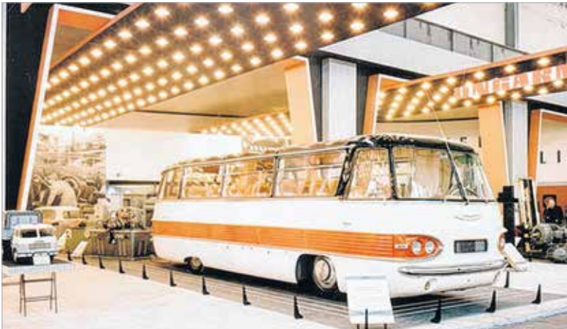
Ikarus 303 – az ötvenes, hatvanas évek szuperluxus autóbusza