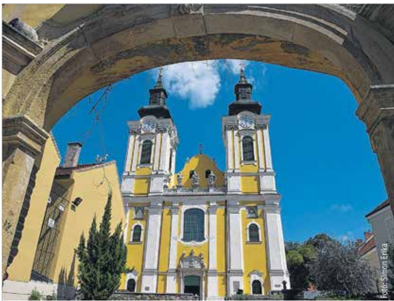
A megújult bazilika Fehérvár történelmét hirdeti

zati, városi és jelentős számú egyéni adománynak köszönhetően befejeződött a templom külső felújítása, amit egy nagyszabású ünnepség zár szeptember 3-án. A történelmi fényfestés ugyan ingyenes, de a nézőtér korlátozott férőhelye miatt jeggyel tekinthető meg. A belépőket a székesfehérvári egyházmegye kegytárgyboltjában, a püspökséggel szemben működő Barátok boltjában illetve a Székesfehérvári Egyházmegyei Múzeum pénztárában lehet átvenni augusztus 29-től.