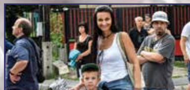
Öreghegyi Mulatságok – mindig magadabbra! 12-13. oldal