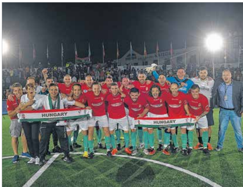
Van minek örülni: a magyar válogatott ismét ott van a legjobb tizenhat európai együttes között