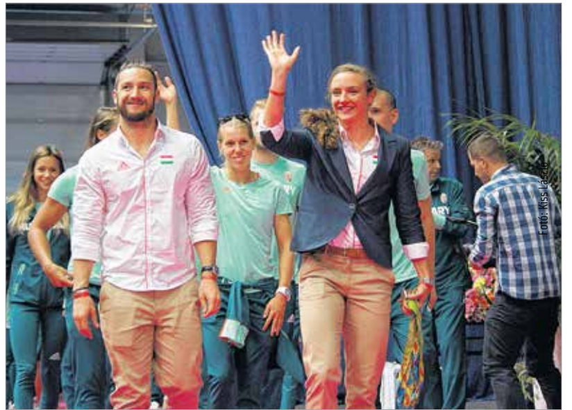
Hosszú Katinka, mint mindig, az élen: háromszoros riói bajnokunk vezette be a sportolókat az ünnepi fogadásra

Kovács Sarolta, a Volán Fehérvár öttusázó világbajnoka Londonban harmincadik, most tizenhetedik lett, de ezt az olimpiát sem sikerként könyvelte el. „Szerettem volna, ha jobban sikerül. Kis szomorúság van bennem, de az olimpia hangulata nagyon jó volt, egy jó magyar csapattal. Örültem a magyar érmeknek, érmeseknek, jó volt