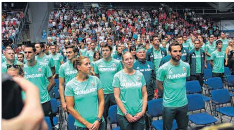
Elöl a bajnokok, hátul a hetekig miattuk virrasztó, nekik szurkoló honfitársak

A sportolók hosszú repülőúttal a hátuk mögött, fáradtsággal küzdve is vidáman integettek a budapesti Symba-csarnokban felállított színpadról, majd készségesen álltak az aláírásra és közös fotókra vágyó rajongók rendelkezésére. „Most tudjuk meghálálni azt a szurkolást, a sok virrasztást, amit miattunk vállaltak, akik itthonról nézték az olimpiát. Éreztük Rióban is a szeretetet!” – mondta Cseh László, aki ezüstéremmel tért haza talán utolsó olimpiájáról. Bár úszóklasszisunk kategorikusan nem jelentette ki, hogy nem indul négy év múlva Tokióban, csak annyit mondott, az most nagyon távolinak tűnik. Ellentétben a jövő évi, budapesti úszó világbajnoksággal. Nem ő volt az egyetlen, aki a következő nyári játékokat is szóba hozta, hiszen ahogy kialakult a láng Rióban, máris megkezdődött az újabb olimpiai ciklus. És aki volt már olimpián, az szeretne még egyszer, kétszer... Nemcsak a bajnokok, sőt! A tervezett sikerekről lemaradók még inkább vágnak rá, hogy újra megpróbálhassák.