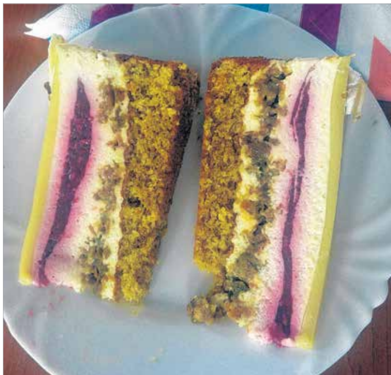
Az Őrség zöld aranya lett az ország tortája

nehezen tudta elképzelni, hogy tökmagból is lehet tortát készíteni, de végül kellemesen és pozitívan csalódott a különleges, piros-fehér-zöld színű őrsegi édességben. Újra bebizonyosodott, hogy mennyire nem a külső, hanem sokkal inkább a belső számít, hiszen jellemzően azok a torták kevesebb pontot kaptak a kóstolás után, melyek külseje elnyerte a hét zsűritag tetszését. A legtöbb pontot végül az a torta kapta, ahol az ízek a zsűri véleménye