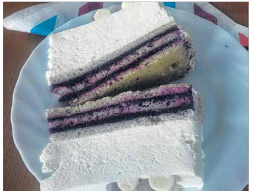
Az Áfonya hercegnő tortája lett az ország cukormentes tortája

szintén a legjobban harmonizáltak, amelyek nem volt túl édes, nem volt túlzó a tökmag vagy a málna íze, hanem kellemes, önmagát villára tűző egységet alkotott. Ennek megfelelően – a mi ízlésünk szerint legalábbis – harma-