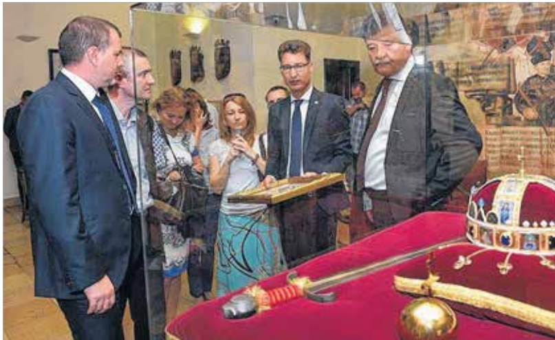
A vendégek megtekintették az ezeréves koronázóeszközök másolatát

éve összeköti városainkat a közös történelmi múlt. Nagyon sokat teszünk a testvérkapcsolatok megőrzéséért. Öt esztendővel ezelőtt itt találkoztam először Gyulafehérvár polgármesterével, s azóta aláírtuk a két város megállapodását. Ez jó példa arra, milyen fontos, hogy rendszeresítsük találkozásainkat. Itt az ideje, hogy a Fehérvár nevű városok – mint az Osztrák-Magyar Monarchia idején – szorosabb együttműködést alakítsunk ki!”