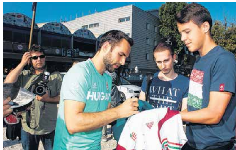
Rengeteget ér a szurkolói relikvia, amint rákerül a már kétszeres olimpiai bajnok Szilágyi Áron aláírása

visszanézni most a felvételeket. Kiráz a hideg látva a képeket! Szerettem volna én is köztük lenni... Tokióban