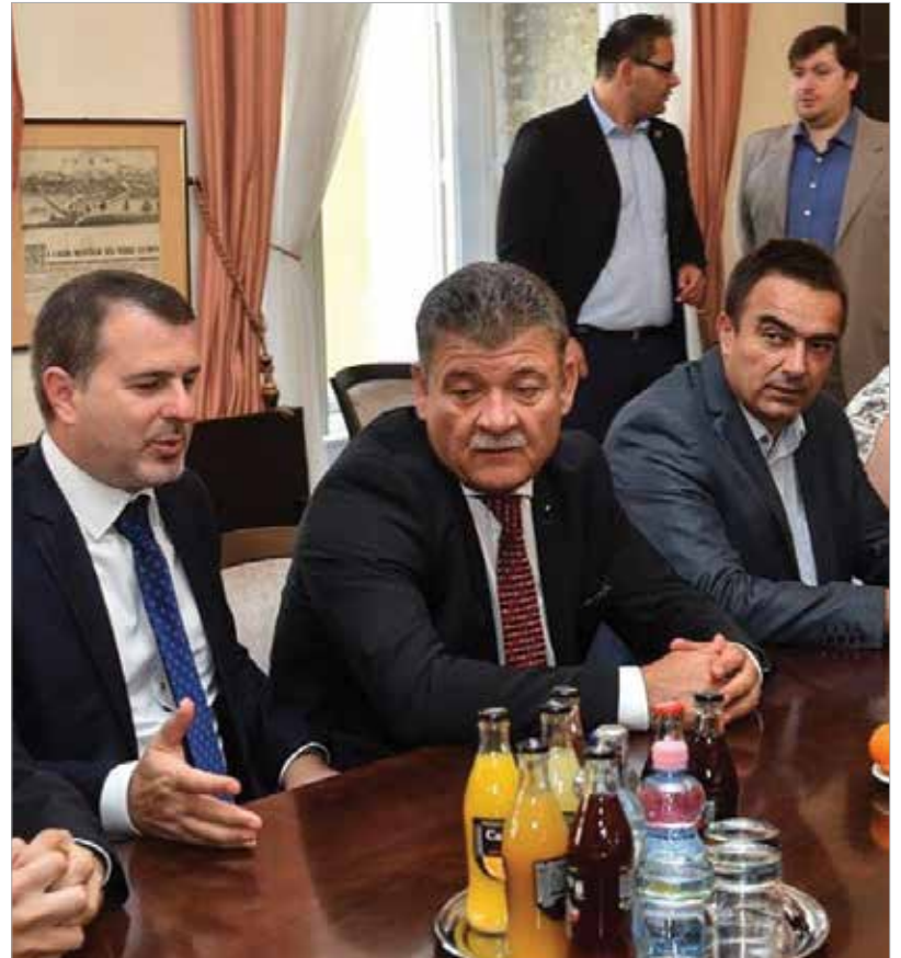
A testvérvárosokból rendszeresen jönnek vendégek Fehérvárra, legközelebb az őszi Lecsőfőző Vigasságra érkeznek

Pozsony főpolgármester-helyettese arra hívta fel a figyelmet, hogy még szorosabbra fűzhető a két város közös jövője: „A római kori történelmet még nem tárták fel, ezért ennek ismeretében talán még jobban össze lehet kötni a két város kapcsolatát. Nagyon jó érzéssel jöttünk Fehérvárra, hiszen mi is megrendezzük a koronázási ünnepeket, ezzel tudjuk felhívni a figyelmet a történelmi tradíciók, a múlt fontosságára.”