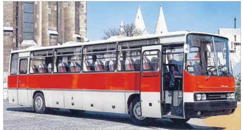
Ikarus 250 – a klasszikus forma. Feltehetően a többségnek ezek a stílusjegyek ugranak be az Ikarus márkanév említése kapcsán.