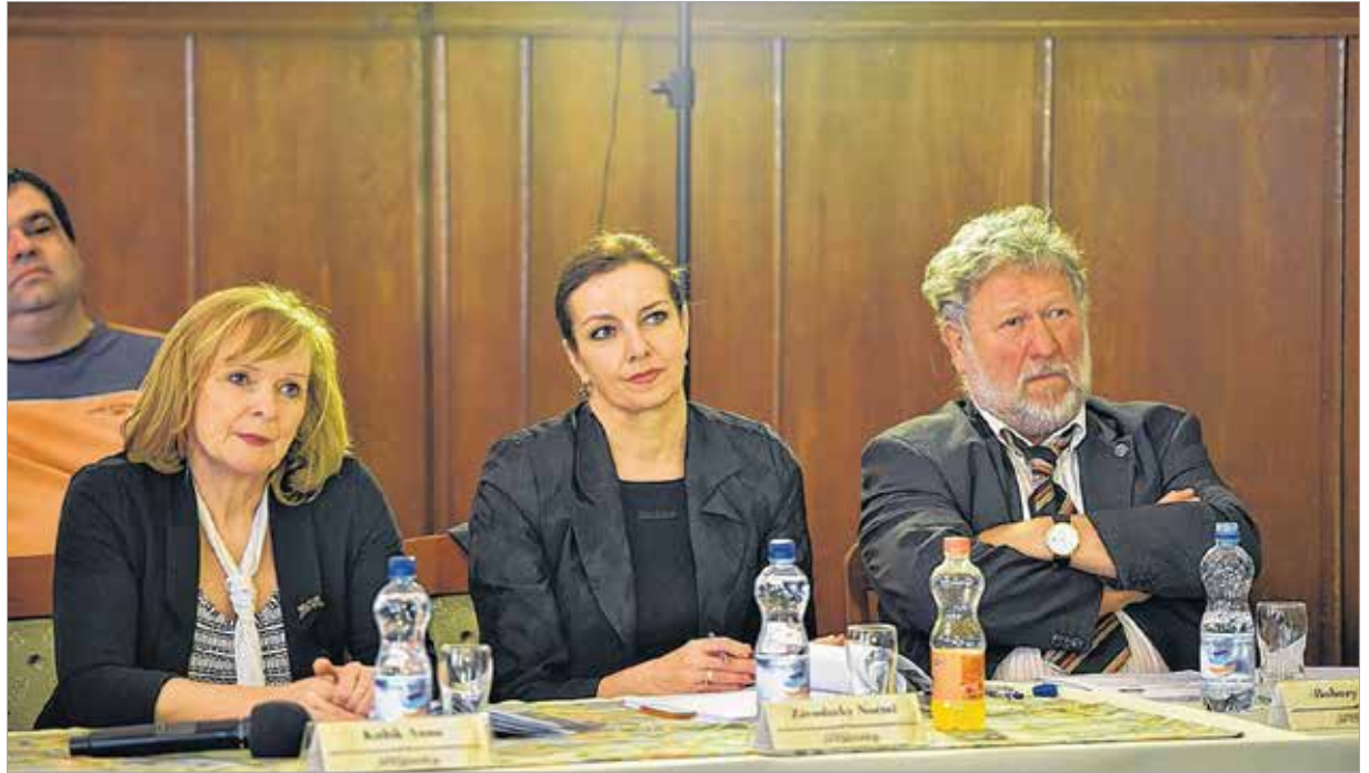
A költő-előadóművész állandó tagja a Fehérvári Versünnep zsűrijének is

Példát adtak nekem, nekünk. A ház a keresztény szellemiség ott-