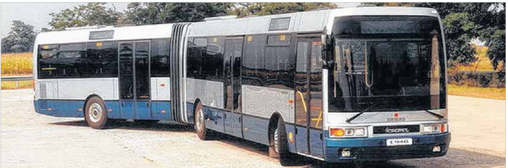
Ikarus EAG E94G – az igazi csuklós. Egyben ez volt a kisgyerekes szülők rémálma is, mert attól félték, hogy a gyerek beesik a csuklós rész mögé.