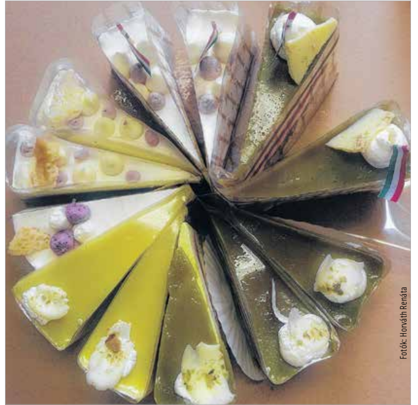
A tesztelt tortaszínek

A szabályok egyszerűek voltak: a zsűri tagjai nem ismerték, hogy melyik tortaszínt melyik cukrász-