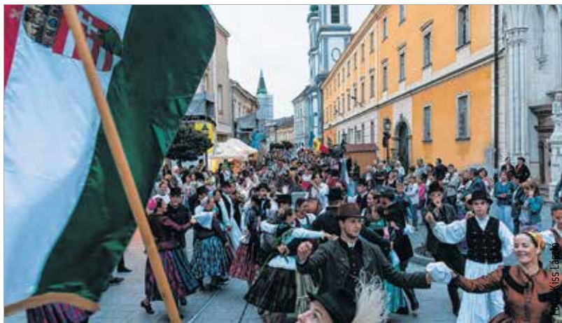
A néptáncfesztivál zárógálája előtt ismét láthattuk a táncosok felvonulását

„Nuestras Raíces” csoport tagjainak köszönhetően. A Baszkföldről hozzánk látogató Eraiki Dantza Taldea együttest is szívünkbe zárhattuk energikus produkcióikkal. Személy szerint nagy kedvencem lett a grúz csapat, akik látványos, elképesztő koreográfiáikkal varázsoltak el bennünket. A horvát Jedinstvo együttes táncosai és zenészei szintén izgalmas világot tártak elélnk. Az indonéz csoport az észak-szumátrai táncokat és tradíciókat hozta közel hozzánk. Moldávia különböző területeinek táncaival, népviseletével és szokásaival is megismerkedhettünk. A szlovák Háj néptáncgyüttes idén is nagy gonddal állította össze műsorát, amit dinamizmus és lendület jellemezett. A sepsiszentgyörgyi Háromszék Táncgyüttes előadásai az Erdélyben élő etnikumok népzene- és néptáncgyüttesének aktualitását vonultatta fel. Előadásai