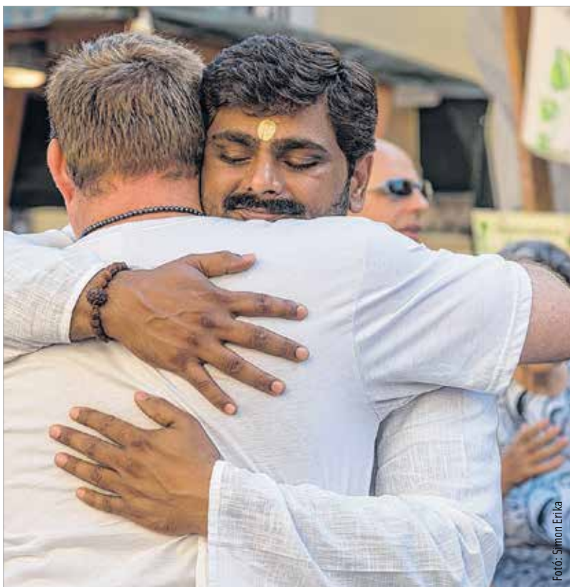
Külföldi vendégeink is velünk ünnepeltek