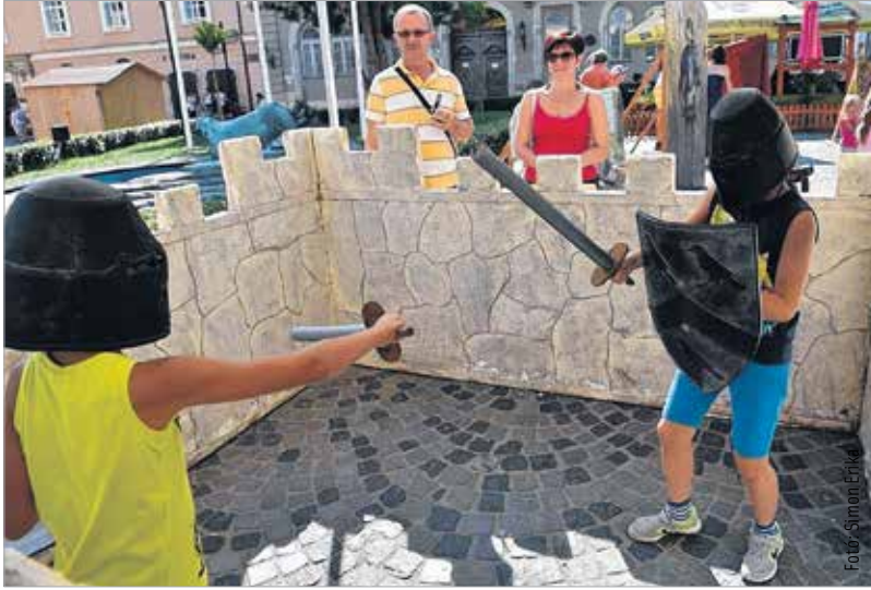
A játékos foglalkozások során a fiataloknak épített várban igazi lovagi tornán küzdhettek meg egymással kardvívásban az ifjú harcosok