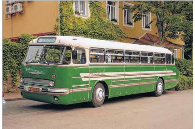
Ikarus 55 – becenevén a Faros. Nem kell magyarázni, hogy miért.

maradnak ki a mókából és kacagásból, csak éppen a kor szellemének megfelelő buszokon kell megtalálni azt, amivel ki lehet húzni a gyufát a sofőrnél vagy a többi utasnál. Ezzel senkit nem biztatnék semmire, de a fiatalság előbb-utóbb úgyis utat tör magának. Többek között azon az ezer új buszon is, amik osztálykirándulások kellékei lesznek majd, vagy éppen távolsági buszként teljesítenek szolgálatot. Az előzetesen tervezett évi háromezer, Székesfehérváron készülő busz várhatóan hozza az Ikarustól megszokott színvonalat: nemcsak minőségi, hanem valóban szép járművek is készülnek majd. A mérce mindenesetre magasan van: akár évtizedekre visszamenőleg is olyan buszok készültek az Ikarus üzemeiben, amik a mai napig szemet gyönyörködtetők. Képeinken ezek közül válogattunk!