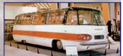
Melyik volt a legszebb Ikarus busz? 21. oldal