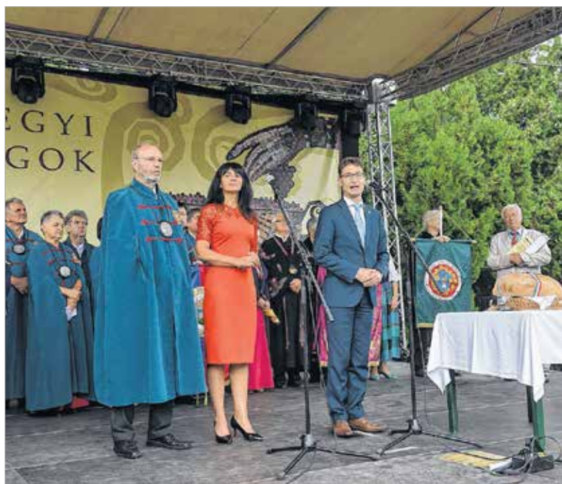
Az Öreghegyi Mulatságok a város egyik leginkább várt eseménye

zati képviselőjeként évről-évre segíti a szervezők munkáját, hogy a mulatságok vendégei szívesen emlékezzenek vissza erre a napra: „Székesfehérvár tele van élettel! Nagyon sok rendezvény van a város valamennyi részében. Büszke vagyok rá, hogy az Öreghegyi Mulatságok a második legnépszerűbb ezek közül. Mi egész évben készülünk erre, és igyekszünk színvonalas programokkal várni vendégeinket.”