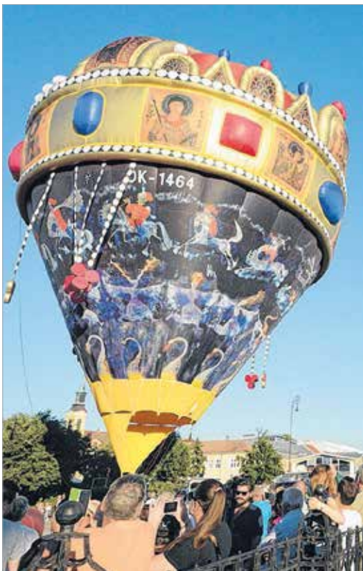
A Szent Korona ballon a pláza előtt emelkedett a magasba