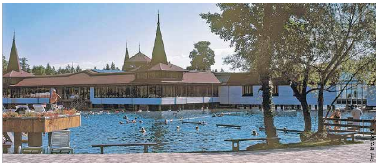
Ma a fizioterápia gazdag tárházából a gyógytorna és a gyógyvizek használata a legjelentősebb

Helyes alkalmazása esetén nincs semmi mellék- vagy utóhatása. Az is elmondható, hogy ma sincs olyan klinikai szakma, műtéti beavatkozás, megelőző tevékenység, amely nélkülözni tudná a fizioterápiát.