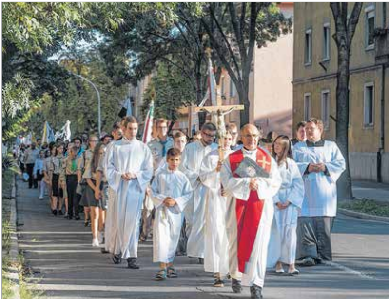
A körmenet az ünnep része volt, amin rengetegen vettek részt

„Fontos, hogy Isten számunkra nyújtott lehetőségeit elfogadjuk, befogadjuk!”