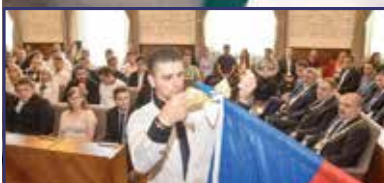
Hosszú távra terveznek 3. oldal