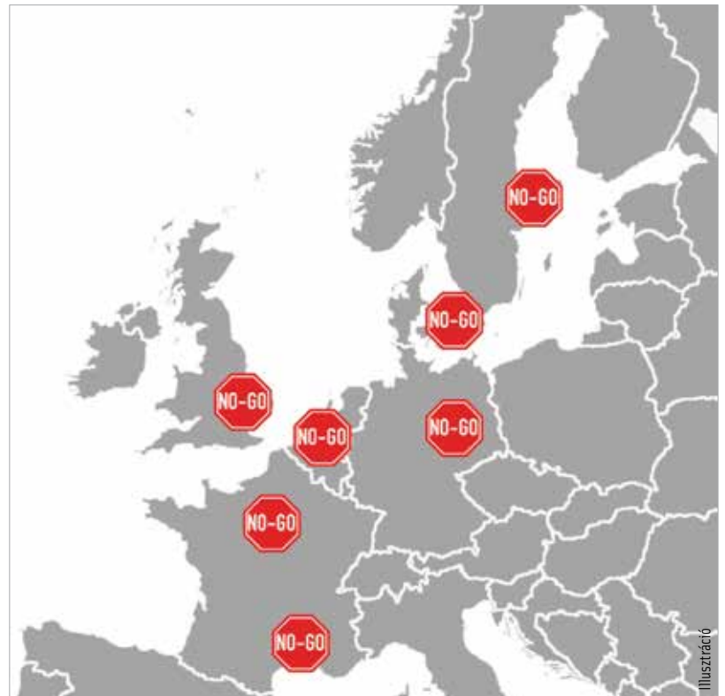
A „no-go” zónáknak nevezett területek olyan városrészek, amelyeket a hatóságok nem vagy nehezen képesek ellenőrzésük alatt tartani. Ilyen zónából már több mint kilencszáz van Európa nagyvárosaiban.

A magyar kormány a népességcsökkenést nem bevándorlással, hanem célzott családtámogatási eszközökkel kívánja orvosolni, szemben az unió elképzeléseivel. A kötelező betelepítéssel megváltozna Európa, így Magyarország etnikai, kulturális és vallási összetétele. A tapasztalatok azt mutatják, hogy az illegális bevándorlók nem tartják tiszteletben a törvényeinket, és nem akarnak osztozni közös kulturális értékeinkben – véli a magyar kormány.