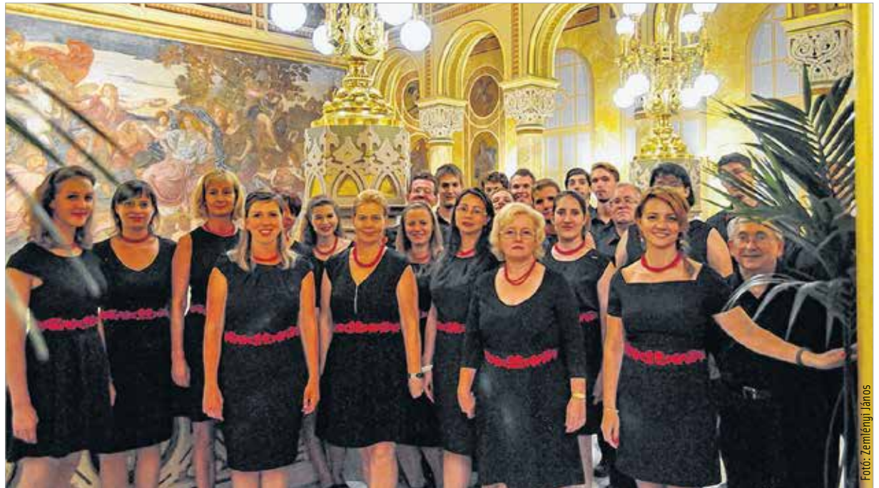
A Vox Mirabilis újra a csúcson

A karnagy szerint a Vox Mirabilis tagjai tudják, hogy olyan lehetőségek és képességek birtokában vannak, amelyekkel élniük kell ahhoz, hogy emelt fővel képviselhesék a Kodály-missziót: „Két évvel ezelőtt részt vettünk már ezen a kórusversenyen, és a felkészülés során volt bennünk némi izgalom, hiszen a múltkori sikerünket szeretnénk volna megismételni. Ugy építettem fel a repertoárt, hogy a reneszánsztól indulva