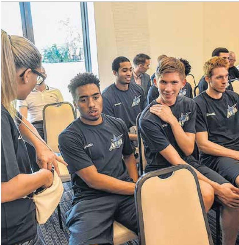
A fehérvári kosarasok a tájékoztató után kolozsvári tornára utaztak