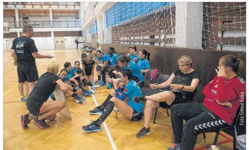
A győztes taktika még titok!

nebb orvosi eszközök segítik majd a gyorsabb regenerálódást, és azt a célt, hogy a magyar fiatalok fizikális felkészítése elérje a nemzetközi szintet, mert ebben jelentős lemaradás mutatkozik. Az Alnb Metodikai Központot Fehérvár összes sportolója használhatja majd.