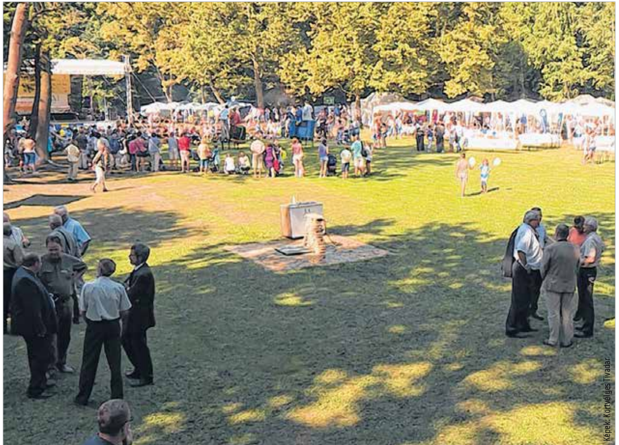
Ezen a napon Soponya a magyar vadgasztronómia fellelővára volt

A hagyományos találkozó megnyitóján Bitai Márton, a Földművelésügyi Minisztérium államtitkára megköszönte a magas színvonalú, komplex erdő- és vadgazdálkodási munkát, ami lehetővé teszi, hogy az ágazat évről évre méltó módon, büszkén ünnepelhesse: „Január elseje óta létezik az új vadgazdálkodási törvény, de számos eleme csak márciusban illetve júniusban lépett hatályba. Az biztos, hogy nagyot léptünk előre, és ezt nem a politikus és nem az államtitkár, hanem a vadász ember mondhatja velem. Nagyon sok olyan újítás van a törvényben, ami visszanyúl azokhoz a vad és a természet tisztelésére építő hagyományokra, ami elengedhetetlenül fontos a vadgazdálkodási ágazatban.” A házigazda VADEX Zrt. vezérigazgatója, Majoros Gábor számára ez a fesztivál a mérce, ahol kötetlen formában, egy gasztronómiai fesztivál keretében mutathatják be erdészek és vadászok, hogy a különböző prémiumtermékekből milyen fantasztikus ételek készíthetők el: „Nagyon fontos számunkra, hogy hivatásunkat bemutathassuk. Ezt a területet mindig valamiféle misztikum övezte, a vadászatnak kultikus hagyományai vannak. Ez a vadgasztronómiai fesztivál kiváló alkalom arra, hogy a látogatókhoz, a vendégekhez közelebb hozzuk az erdészek és a vadászok mindennapjait, akár a hasukon keresztül is. Egy ilyen találkozón azért a szakmáról is szó