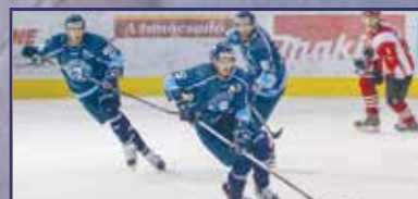
Visszahódították a kupát 28. oldal