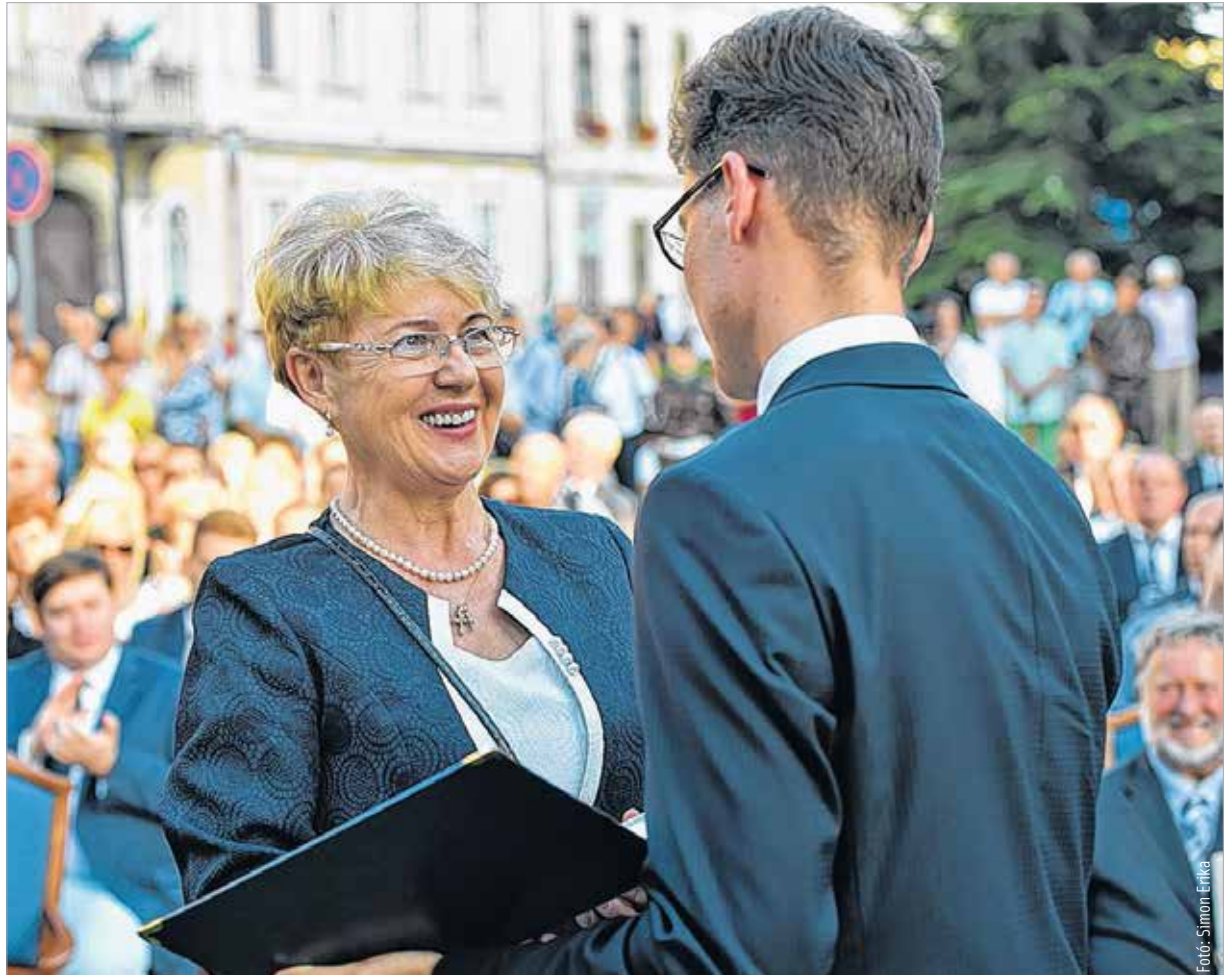
Szívből jövő mosoly Szent István napján

Ha hiteles személyiségnek tartanak, azt tisztelettel elfogadom. De nagyon örültem, hogy az unokáim a mamit nemcsak olvasás és matekozás közben látják!