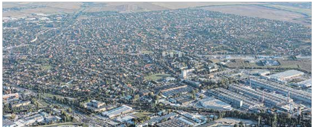
„... annak térkép e táj”