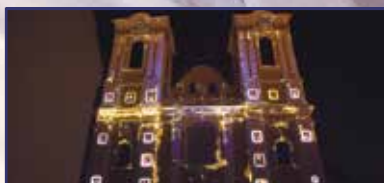
Az ország bölcsője 4. oldal