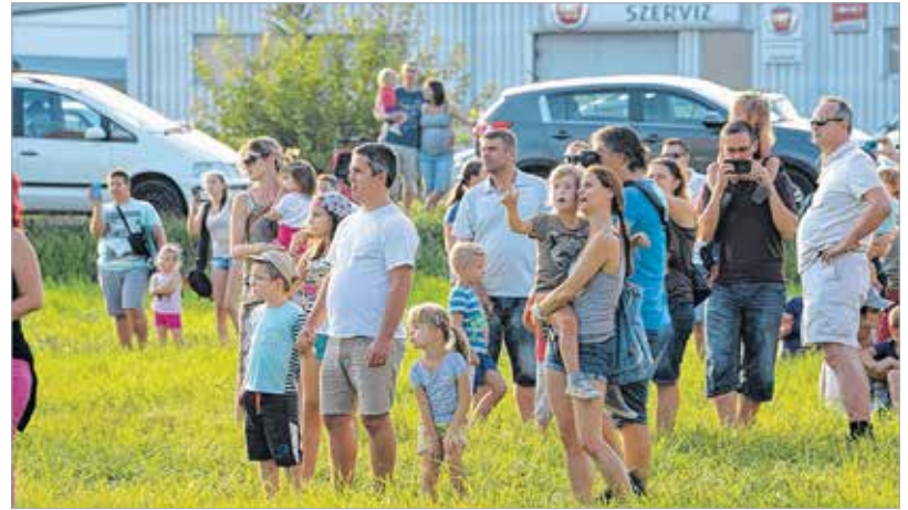
Fehérváron és az agárdi parkerdőből is szálltak fel hőlégballonok