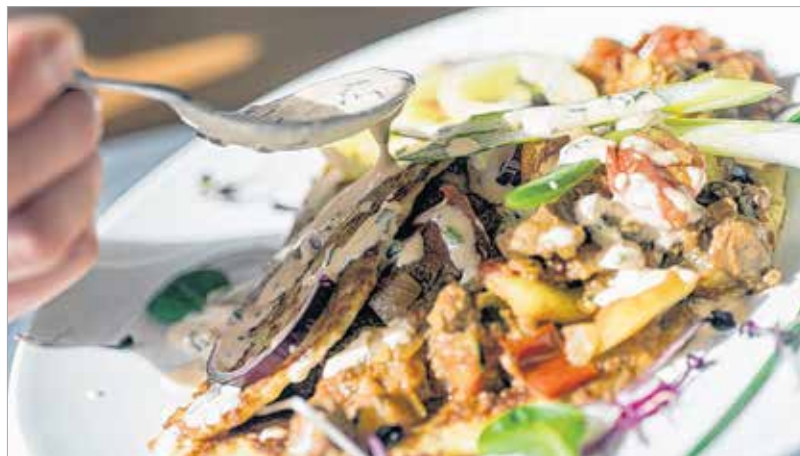
A fokhagymás-paprikás tejföl kiemeli az ízeket