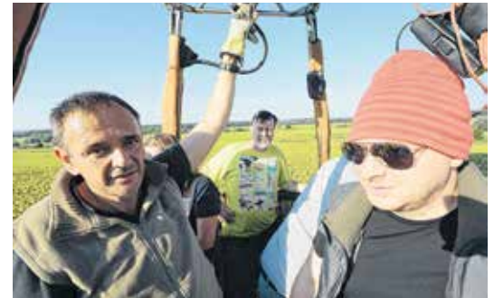
Kollégáink is kipróbálták, milyen a magaslati kilátás