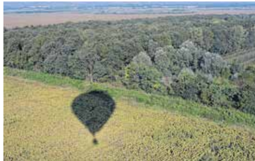
Fentről minden lenyűgöző