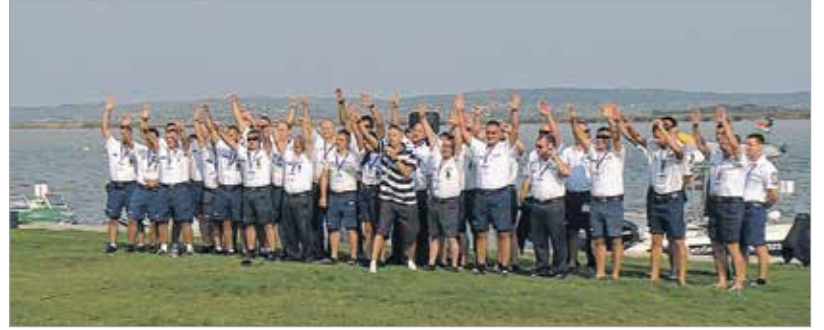
Az ország legjobb vízi rendőrei jókedvűen kezdtek neki a feladatoknak

A feltételezett szituáció szerint egy a csónakjában rosszul lett horgász miatt siettek a vízi rendőrök a Velencei-tóba, de közben két vízbe esett férfivel is találkoztak.