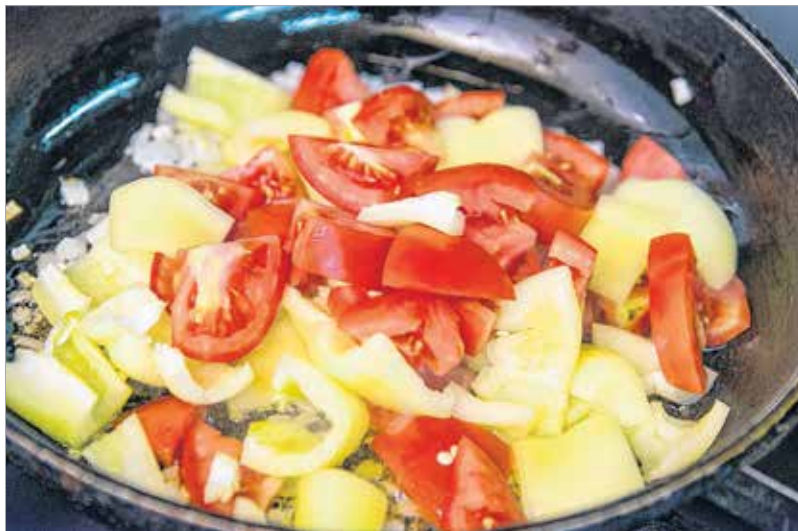
A jó paprika és az ízletes paradicsom a ragu alapja