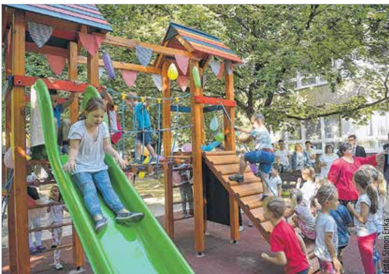
Enyém a vár!