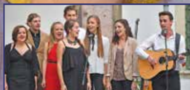
Vershúron pendülők 12. oldal