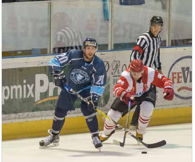
Meleg volt a csarnokban, de ez a Sofronékat buzdíró szurkolókat a legkevésbé sem zavarta