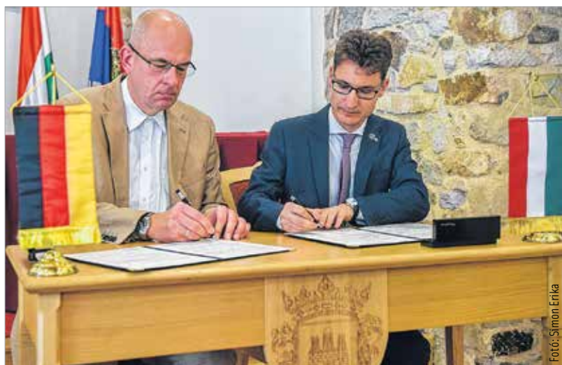
Az ünnepségen a kapcsolat megerősítését deklaráló dokumentumot is aláírták

köszönetet mondott a vendéglátásért és az élményekért, amiben a Lecsófózó Vigasságon és a börgöndi légi paradén volt részük. Elmondta, hogy jövőre hatvanéves lesz a két város közötti barátság, ami jelentős időszak mindkét város életében. Reményét fejezte ki, hogy a következő hatvan évben is folytatódik ez a szoros kapcsolat. A látogatás alkalmával a finn delegáció újabb meghívást tolmácsolt Székesfehérvár önkormányzatának abból az alkalomból, hogy jövőre fennállásának századik évfordulóját ünnepli a Finn Köztársaság.