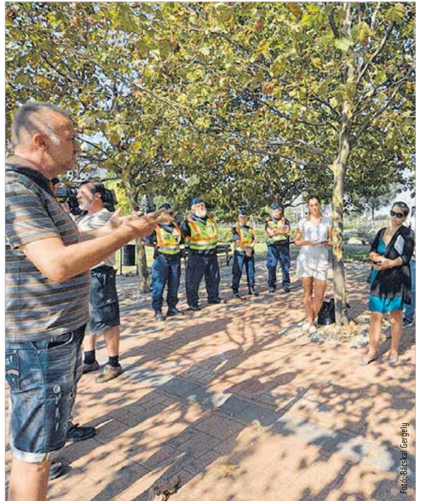
A Petőfi parkban találkoztak a szakemberek

parkban, mert a magasabb bokrok alá beköltözők a szemetük mellett az ürüléküket is otthagyták. A növényeknek a mostani visszametszéstől semmi bajuk nem lesz, jövő tavasszal sűrűbben kezdenek majd növekedni, ezzel is nehezítve azt, hogy beköltözzenek alájuk. Rendet szemetet, szétszórt ruhákat és emberi ürülékkel kellett takarítani a parkfenntartó szakembereknek és a Városgondnokság köztiszta-