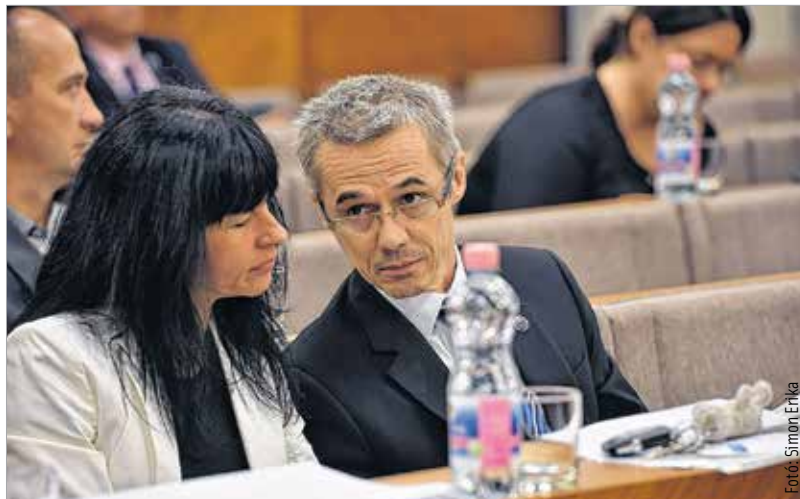
A képviselők arról is döntöttek, hogy a fehérvári diáksportot az idei tanévben összesen tizenöt millió forinttal támogatja a város

Támogatta a testület a Szent István-kultusz Rómában jelenleg is fellelhető értékeit bemutató kisfilm és az ahhoz kapcsolódó kiállítás megvalósítását. A Vatikáni Múzeum dísztermeinek Szent István-ábrázolásai mellett a Lateráni Szent János-bazilika Szent István-domborművét, az első királyunk által Rómában alapított Magyar Zarándokház emlékeit és a Szent Péter-bazilika altemplomához kapcsolódó Magyarok Nagyasszonya-kápolnát is bemutatja a kisfilm, melynek alkotója Vakler Lajos, a Fehérvár Médiacentrum szerkesztője. Korábban már kifejezte szándékát Székesfehérvár, hogy részt szeretne venni a 2024-es olimpiai és paralimpiai játékok megrendezésében, most azonban arról is döntöttek, hogy ha elnyeri Magyarország a rendezés jogát, akkor Székesfehérváron a labdarúgás selejtező mérkőzéseinek adna helyet a Sóstói Stadion.