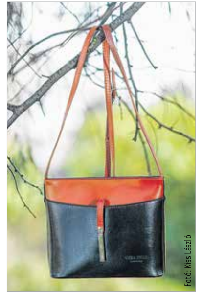
A klasszikus eleganciával nem lehet mellőzni

Nadrágban is nagy a választék, annak ellenére, hogy a nyáron egyre népszerűbb nadrágszoknyákat az őszi kollekció már nem tartalmazza. Van viszont helyette kövekkel díszített, alakkövető nadrág. Továbbra is hódít az egyenes szárú, és visszatérő divat lett a kissé bővülő trapézszárú nadrág. Jó hír, hogy ma már nemcsak szezon végi, de szezon eleji akciók is vannak, így aki kedvet kapott a vásárláshoz, nézzen körül az akciókat kínáló boltokban!