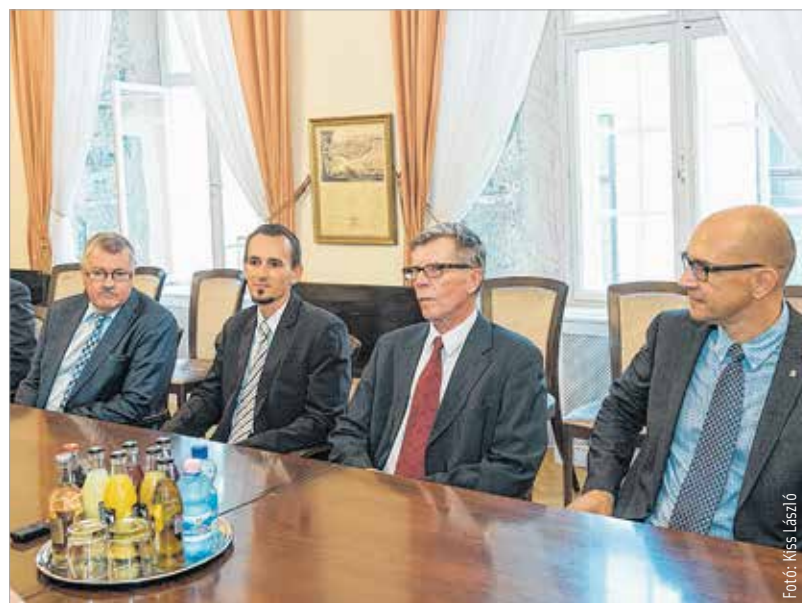
Jövőre lesz hatvanéves a testvérvárosi kapcsolat Kemi és Székesfehérvár között