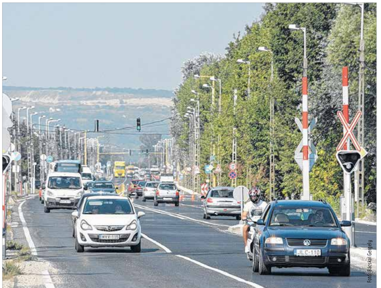
Az Új csóri út belső szakaszán mintegy harminc százalékkal csökkent a forgalom

Július közepén nyílt meg a nyugati elkerülő út III. üteme a forgalom előtt. A hét kilométer hosszú, új nyomvonalon megépült kétszer két sávú út a biztonságosabb és gyorsabb közlekedést szolgálja: csökkent a tranzitforgalom, mérséklődött a zajterhelés és a dugók. A Magyar Közút Nonprofit Zrt. Fejér Megyei Igazgatósága forgalomszámláló műszert telepített az új elkerülő Veszprém felőli csomópontjához az elkerülő forgalmi adatainak és az Új csóri út forgalomváltozásának elemzése céljából. Az Új csóri út belső szakaszán – az elkerülő forgalmi adataival összevetve – a forgalom mintegy harminc százalékkal csökkent, a külső, városhatáron kívüli szakaszon a forgalomcsökkenés ötvenhárom százalékos. Az utatadás óta jelentősen kevesebb a tehergépkocsi is: a forgalomcsökkenés a belső szakaszon negyven százalékos, a külsőn negyvenkilenc százalékos jelent. A Magyar Közút Nonprofit Zrt. tapasztalatai alapján a forgalomátrendeződéssel hosszabb időszak alatt történik meg, ezért hosszú távon még jobb eredmények várhatók.