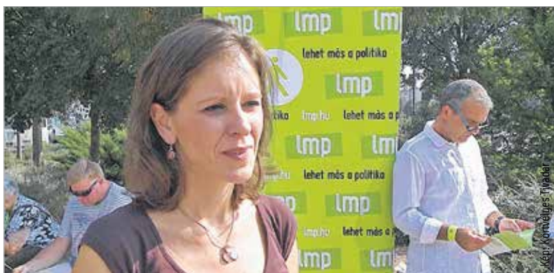
Az elmúlt huszonöt évben az oktatásra mindig fejőstehénként tekintettek, amiből pénzt lehet kivonni – véli Szél Bernadett

hogy a többkulcsos adórendszer bevezetésével huszonnégyezer forinttal többet keresnének, akik minimálbéren és harminchétezerrel többet, akik átlagbéren élnek, ezért az LMP mindent elkövet az adórendszer változtatásáért. Szél Bernadett úgy véli, hogy az oktatás és az egészségügy az a két szektor, ami a legjobb befektetés a 21. században, ennek ellenére az eddigi kormányok éppen e két szektortól vonták ki a legtöbb pénzt. „Amit pedig mérsékelni kellene, az a korrupció, a felesleges költsékezés, a luxusköltsékezés, különböző úri kegyeknek a gyakorlása szerte az országban, amit a kormány oldaláról látunk.” – mondta Szél Bernadett. Az LMP köztéri fórumán olyan országot vizionált, ahol minden fiatal megtalálja a számítását, és nem kell megélhetési kényszerből elvándorolnia.