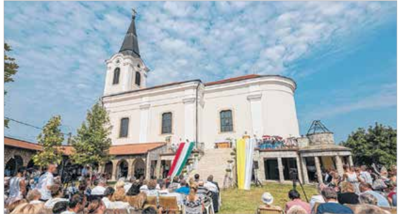
A Segítő Szűz Mária-kegytemplom minden évben több ezer zarándokot hív közös imádságra

Szűzanya tiszteletére. A király és fia, Imre herceg többször is elzarándokoltak ide, de járt Bodajkon Szent Gellért, sőt Szent László király is, aki 1090-ben az Al-Duna felé igyekvő, Székesfehérvárt ostromló pogány tatár csőcseléklet egy keresztvetéssel futamította meg. Legalábbis így emlegeti a legenda. II. Géza idején kereszties lovagok gondozták a kegyhelyet, majd a török megszállók – ahogy másutt – itt is mindent tönkretettek. A törökök kiverése után a kapucinus rend építette újjá a kegyhelyet, és