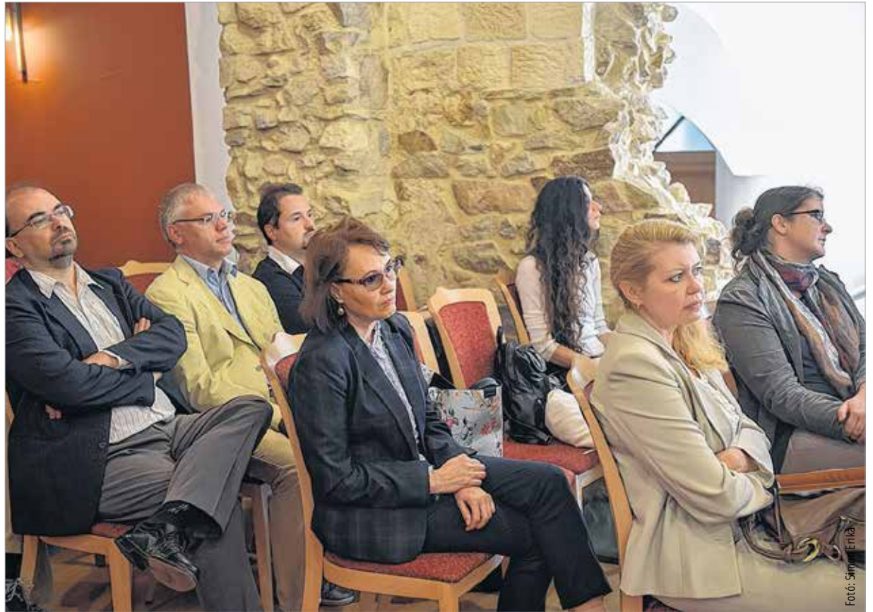
Rendkívüli érdeklődés kísérte a királynéről szóló konferenciát

bukkan fel a királyné, a 13. századiakban pedig többnyire a király mellett, mintegy kiegészítésként fordul elő a személyével vagy méltóságával összefüggésbe hozható utalás. Hozzátette, hogy az Árpádok időszakának törvényei ugyanakkor mégis csak értékelhető mennyiségben tartalmaznak információkat a nőkkel kapcsolatos különböző kérdésekről. Előadásában két erős pozíciójú és egyéniségű királynét emelt ki: Máriát (IV. Béla) és Erzsébetet (I. Károly). Mária királynéi méltóságához már kapcsolódtak a bárók, mint például Dárói „Kegyes” Miklós udvarispán személye. Erzsébet bárói között többen voltak, akik királyi tisztségeket is kaptak: Hahót nembeli (alsólendvai Bánfi) Miklós a királynéi lovászmester cím után többek között a szlavón és horvát báni címet is megkapta, vagy említhető például Széchenyi (Tamás fia) Kónya királynéi asztalnokmester királyi karrierje. Azonban Berzete Miklós vagy Akos nembeli Cselentfi Jánost egész pályája a királynéhoz köti – mindez az Árpád-kori modell fokozatos átalakulását jelzi. A királynék sorsában a megőrzésvégülés sajnálatosan gyakori konfliktusokhoz vezetett, akár Gizella és Péter, akár Beatrix és IV. Béla történetére gondolunk. A trónviszályokban rendszerint alulmaradnak. A kevés kivétel között említhető Ilona (II. Béla), akinek a fia került trónra.