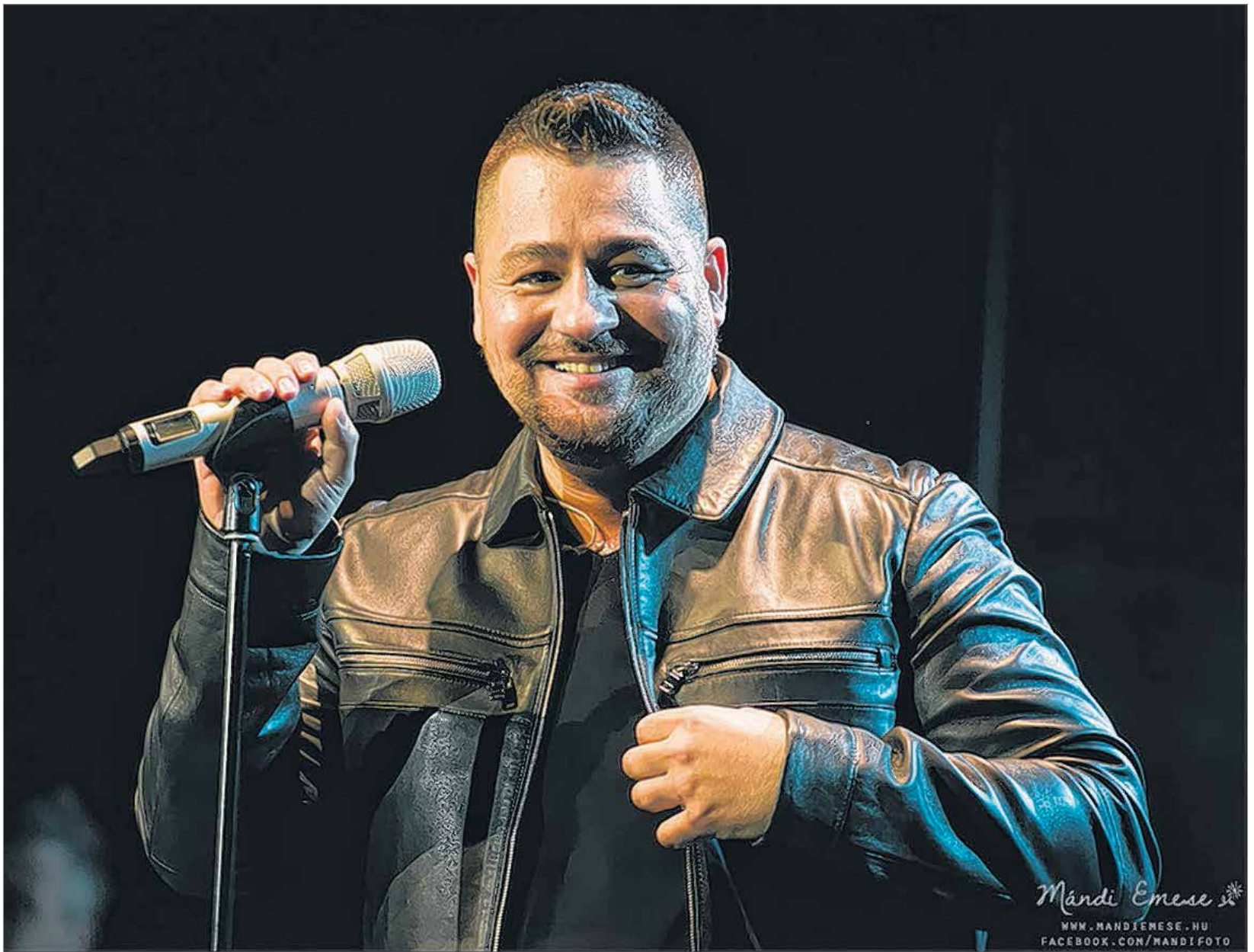
Caramel igazi zenei csemegével készül az októberi fehérvári koncertre

vannak beleépítve a dalszövegbe is. Ezt a vonalat szeretném kicsit továbbvinni úgy, hogy nemcsak a magyar népzene, de más etnikumok ízeit is szeretném megmutatni a dalaimban, más zenei kultúrákból is szeretnék felvonnatni elemeket. Természetesen ezek csak fűszerek, emellett saját dalaimat is áthangszereltük erre a koncertre. Jó pár olyan látványelemet is fogunk mutatni a közönségnek, ami eddig nem volt jellemző. Próbálunk minden érzékszervre hatást gyakorolni, igazi élményt adni amellest, hogy mi is jól érezzük magunkat. Amit ígérhetek: én minden alkalommal kicsit felrobbanok, megsemmisülök a színpadon – itt sem fogok spórolni!