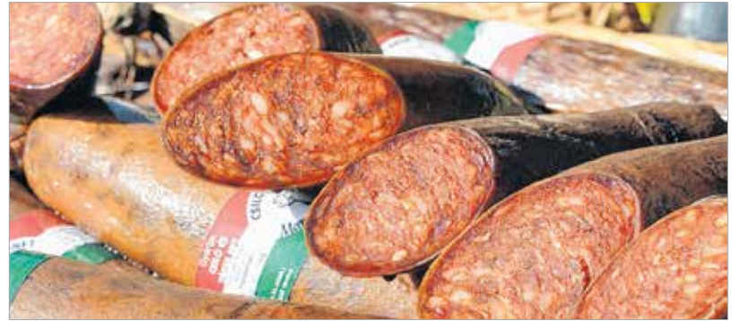
Csak ellenőrzött állományból származó termék vehetett részt a fesztiválon

A Mangalicafesztiválon a múlt és a jelen találkozott, hiszen a standokon hagyományos, minőségi mangalicaételeket, sonkát, szalonnát vagy éppenséggel disznósajtot vehettünk. A klasszikus sült kolbász-hurka-tarja-pörkölt