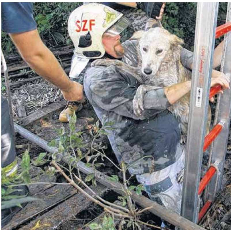
A tűzoltók az állatmentők segítségével hozták fel az ijedt ebet

úgy, hogy bejárja a környéket. Három házzal arrébb jutott csak, ott ugyanis beleesett egy használaton kívüli kútba. Az ott lakó asszony másnap figyelte fel a kutya síró hangjára. Amint észlelte, mi történt, azonnal hívta a tűzoltókat. Farkas Bozsik Gábor tűzoltó alezredest, megyei katasztrófavédelmi szóvivő azt mondta, a kutya nyolc métert zuhant, és a nagyjából negyven centis vízben várta a segítséget. A tűzoltók a FEMA állatmentőkkel és a gazdával közösen hozták fel a bajba jutott kutyát. Mollit kútba esett kalandja után újabb megpróbáltatás érte: nagyszabású tisztításon és szárításon kellett átesnie, de más traumát nem élt át a kiskutya, este már társával együtt őrizte a pákozdi birtokot.