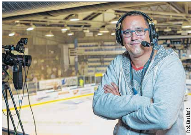
Itt éppen nem a kézilabda-, hanem a jégkorongcsarnokban

Egyenes út vezetett egy sportáruházba, amit nagyon szerettem. Egy