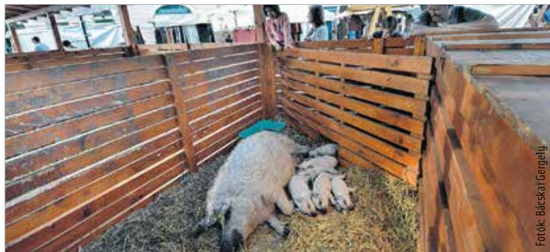
A szőke, a vörös és a fecskahasú mangalicákat élőben is meg lehetett nézni

tengelyen kívül az ínycsekek az ország legmenőbb street food truckjainak speciális mangalica-kínálatát is végigkóstolhatták. A „Zabáljcsak”-ban a „hagyományos” sertésalapocskából készült pulled pork mellett most próbát tettek a mangalicalapocskával is. A Piknik Utzabár kínálatában szerepelt mangalica carpaccio thai salátával, vagy az elsőre kicsit furcsának Angus marha kéksajtos-mangós burger formájában. Aki pedig egy-egy finomabb falat után megszomjazott, leöblíthette sörrrel, borral vagy a disznóságokhoz kiválóan passzoló pálinkával.