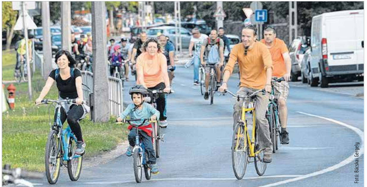
„Mi is itt vagyunk!” – szombaton a kerékpárosok uralták az utakat Fehérváron, újra felvonult a „kritikus tömeg”

A kerékpárosklub helyi szervezetének vezetője szerint van olyan szakasz, ahol a már korábban meglévő átvezetés került megszüntetésre, például a Deák Ferenc utca és a