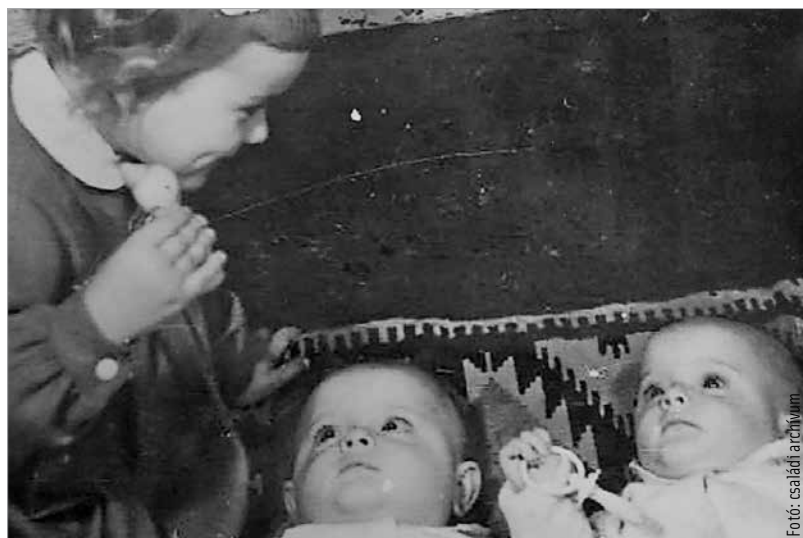
A kis Vali és az ikrek

idő: „A házhoz senki nem akart kijönni, mert mindenki félt. Olyan világ volt Fehérváron! Lövöldöztek össze-vissza, tankok jártak az utcákon. A férjem meg apukám biciklire pattant, és bement a kórházba. Egy mentős mondta neki, hogy behoz minket a kórházba, de csak akkor,