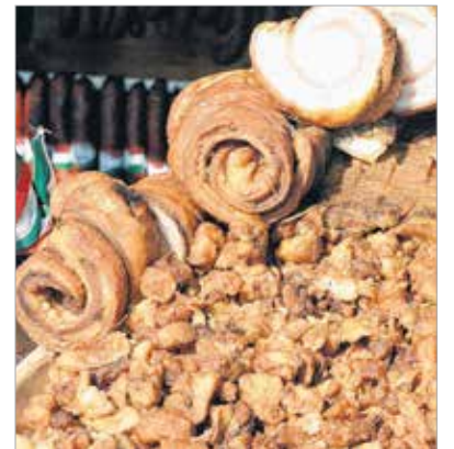
A virág húsból készült verziója

tengelyen kívül az ínycsekek az ország legmenőbb street food truckjainak speciális mangalica-kínálatát is végigkóstolhatták. A „Zabáljcsak”-ban a „hagyományos” sertésalapocskából készült pulled pork mellett most próbát tettek a mangalicalapocskával is. A Piknik Utzabár kínálatában szerepelt mangalica carpaccio thai salátával, vagy az elsőre kicsit furcsának Angus marha kéksajtos-mangós burger formájában. Aki pedig egy-egy finomabb falat után megszomjazott, leöblíthette sörrrel, borral vagy a disznóságokhoz kiválóan passzoló pálinkával.