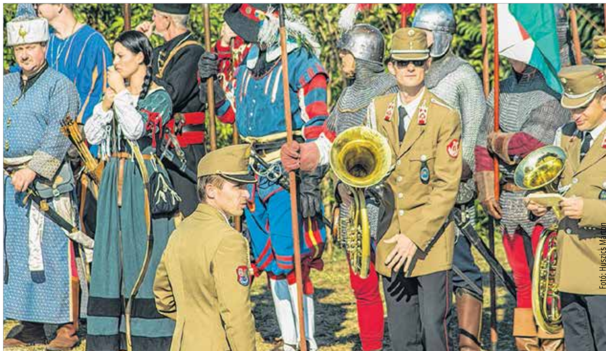
Katonai hagyományainkat idézték meg a pákozdi honvédfesztiválon

A Honvédfesztivál lehetőséget teremt arra, hogy a környező iskolák-