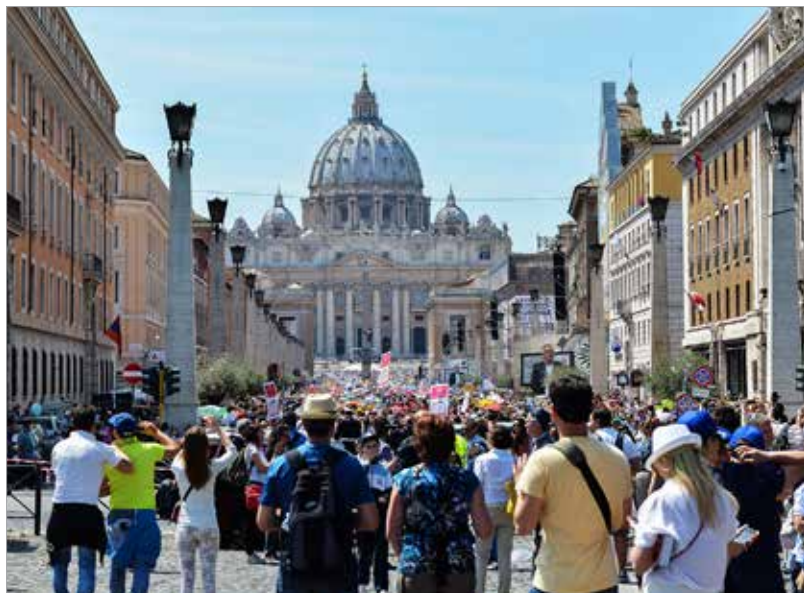
Róma vonzza az embereket, ugyanakkor még kisugárzik Európa-szerte, ahogy az Vajk átlénygéséből is kiderül

Kárpát-medencei lesz, sőt európai, de fehérvári is, mert a Szent István-émlékek – még ha rómaiak is – itt természetesebbek. Magyar azért, mert e király mégiscsak a magyar bölcső ringatója volt.