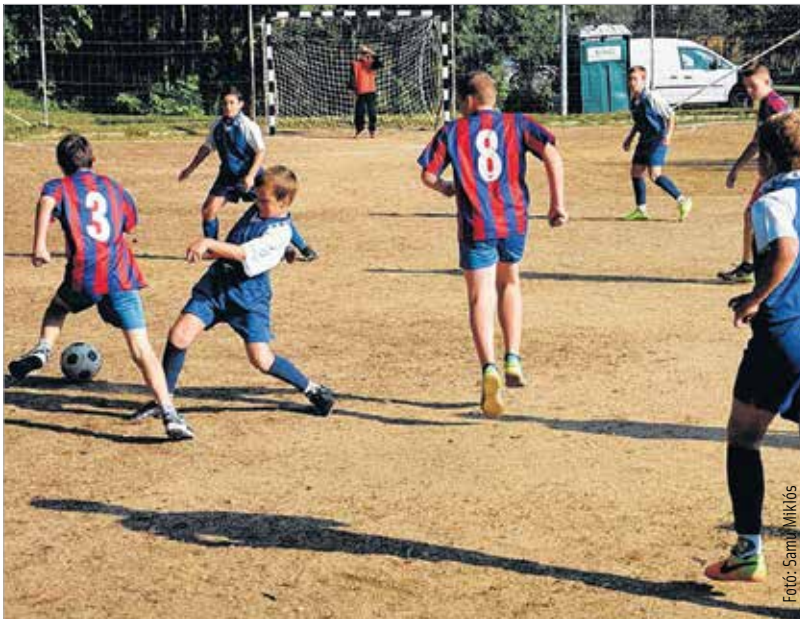
Hat iskola diákjai küzdöttek a kupáért

A Lehel utca mögötti sportpályára várták a gyerekeket valamint az őket kísérő családtagokat szombaton délelőtt. Hat székesfehérvári általános iskola ötödik osztályos válogatottja kapott meghívót az idei Aszalvölgyi Focikupára.