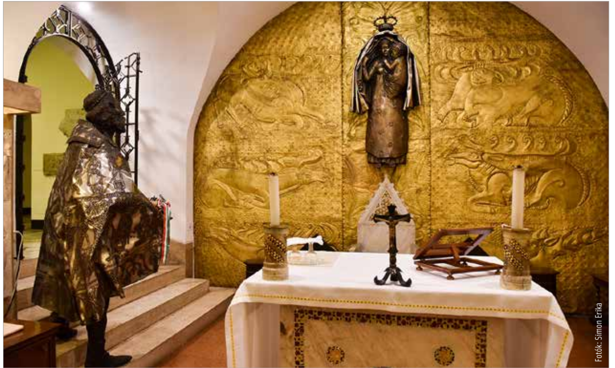
A Magyarok Nagyasszonya-kápolna zarándokhelye a magyarságnak. Október 8-án várhatóan több fehérvári is elmegy Rómába.

A Vatikáni Múzeum dísztermeit, ahol freskók és festmények ábrázolják, ahogy Szent István az apostoli keresztet tartva átveszi a Szent Koronát, illetve egy másik képen ugyanazt felajánlja. Hasonló képek találhatóak a Luteráni Szent János-bazilikában és II. Szilveszter pápa síremlékén is. Úti és forgatási célunk lesz a Szent István által alapított Magyar Zarándokház, amit ugyan 1776-ban lebontottak, de a Szent Péter-bazilika keresztfolyosójának külső falán egy hatalmas