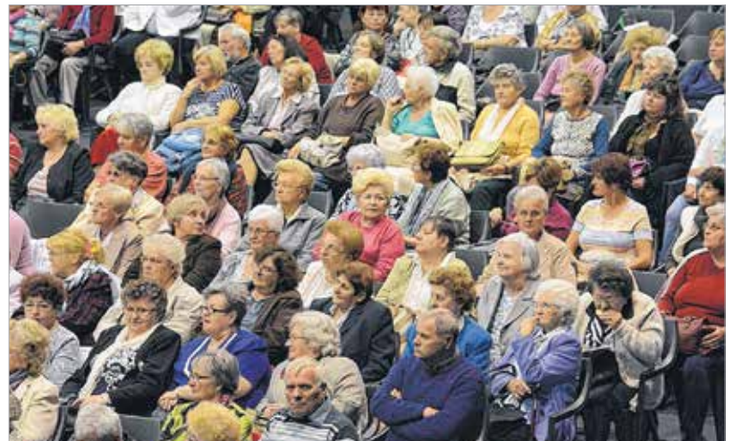
Mindenki nagyon jól érezte magát