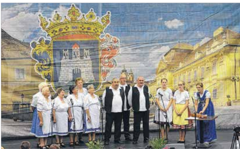
A nagylóki vegyeskar vidám műsort adott elő