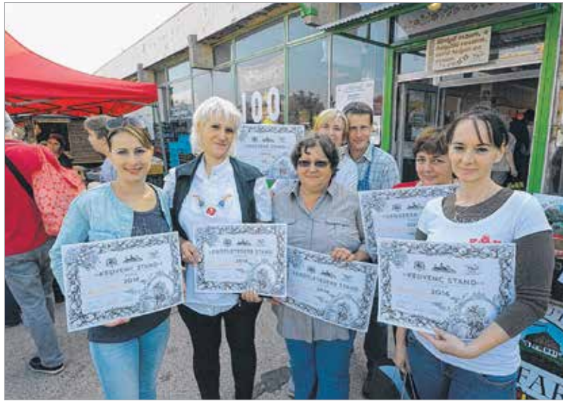
A legötletesebb, a legszebb és a kedvenc standok tulajdonosait idén is díjazták