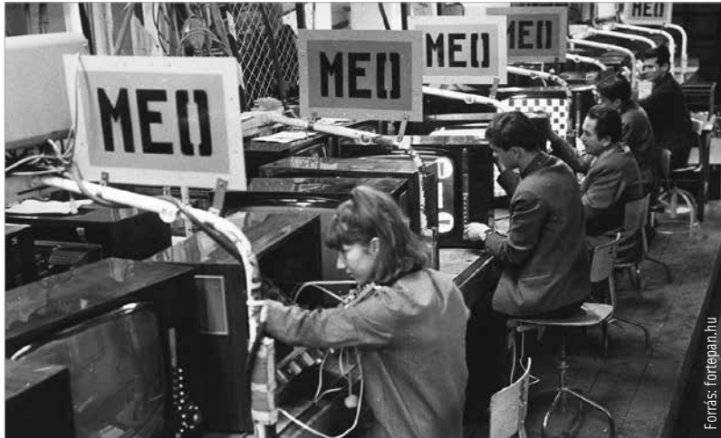
Az elkészített színes tévéket ellenőrzik

Aki legalább második generációs fehérvári, annak biztosan van minimum egy ismerőse, aki egykor a Videoton alkalmazottja volt. Nem nehéz az ügy, hiszen a hetvenes, nyolcvanas években Székesfehé-