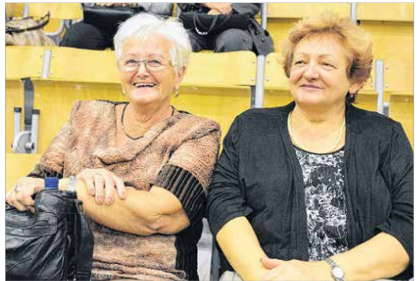
Jókedvből nem volt hiány