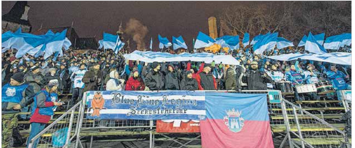
Három éve remek volt a hangulat a hideg pesti éjszakában, hála a Volán-szurkolóknak