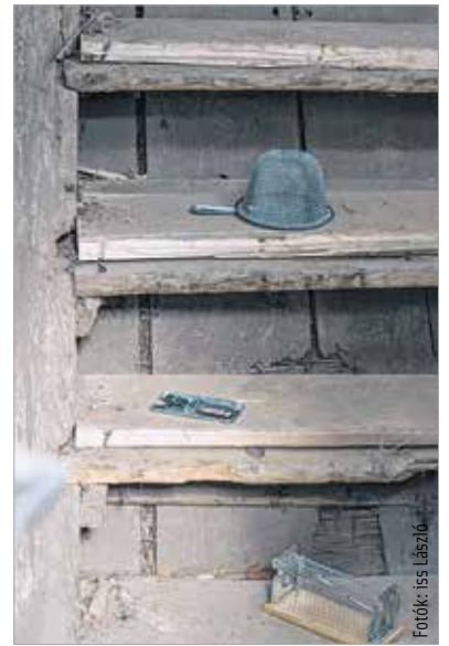
A rágcsálók a sötét helyeken közlekednek, tegyük ide a csapdát!

Azok is találhatnak megoldást a védekezésre, akik szeretnék megkímélni a rágcsálók életét. Vannak ugyanis olyan csapdák, amelyek útját állják a betolakodóknak, viszont életben hagyják őket. Ugyanígy állatbarát megoldás az ultrahangos rágcsálóirtó, ami a