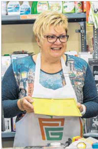
Fister Judit gazdabolt-tulajdonos szerint érdemes több eszközt bevetni a rágcsálóirtásra, de a kitartás is fontos

Jó hír, hogy egér ellen jól bevált védekezési módok léteznek, és ha