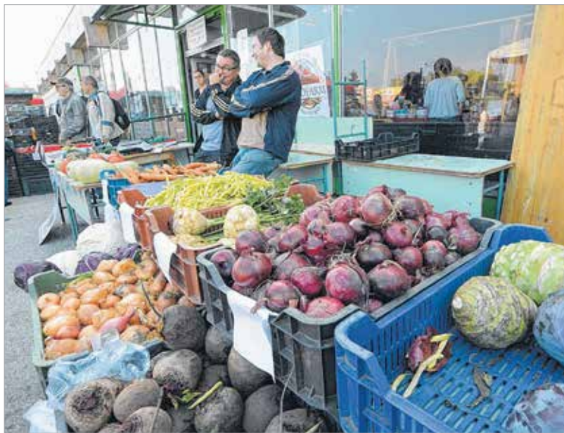
Az őstermelők szívesen beavatnak a kulisszatitkokba

A most már bionak nyilvánított farmon a védekezés helyett inkább a megelőzésre helyezik a hangsúlyt. Például Amerikából hoznak cukornád-alapanyagot, amin egy baktériumtenyésztet hoznak létre. Később ezzel locsolják, permetezik a növényeket, hogy ellenállóbbak legyenek a különböző betegségekkel szemben. De vannak egyéb trükkök is! A liszteske – egy apró, fehér rovar, a káposztafélek egyik gyakori kártevője – imádja a sárga színt, ezért a farm dolgozói sárga post-it lapokat helyeznek a veteményesbe, így könnyen és gyorsan össze tudják őket gyűjteni.