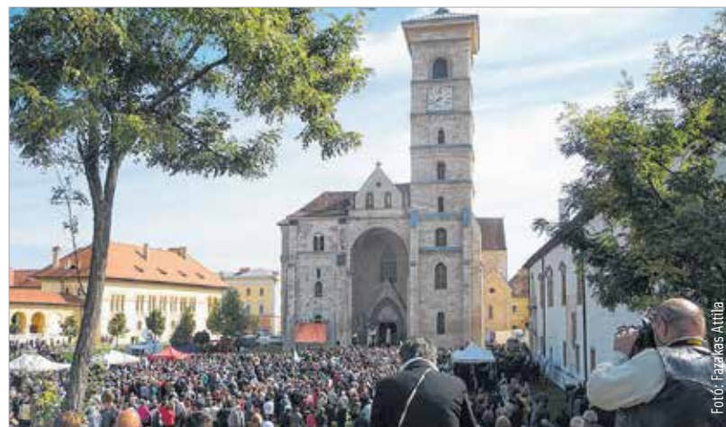
A gyulafehérvári székesegyház és az előtte lévő tér megtelt Márton Áron újratemetésén, akit II. János Pál pápa „az úr legteljesebb, legkifogástalanabb szolgájának” nevezett

A szeptemberi újratemetés a magyar kormány támogatásával jött létre, mely része volt a Nemzetpolitikai Allamtitkárság által 2016-ra meghirdetett Márton Áron-emlék-évknek.