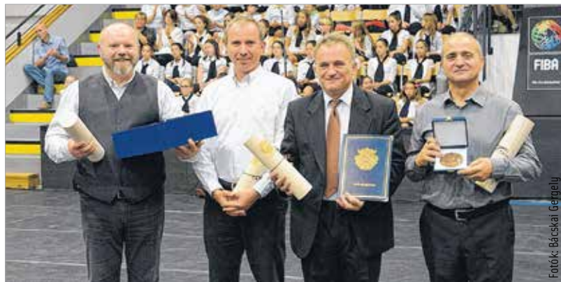
A Tilinkó együttes minden tagja elkötelezett a népi kultúra és a zene iránt

a Tilinkó Zenekar vehette át a nívós díjat Cser-Palkovics András polgármestertől. Az együttes az elmúlt évtizedekben beírta magát a város zenei életének történelmébe. A péntek esti rendezvény keretében nyújtották át az Éneklő ifjúság okleveleit. A Magyar Kórusok és Zenekarok Szövetsége Országos Dicséző Oklevéllel tüntette ki a Bárdos Lajos Gyermekkart Kneifel Imre vezetésével. Országos Dicséző Oklevelet ítéltek oda a Kodály Zoltán Iskola