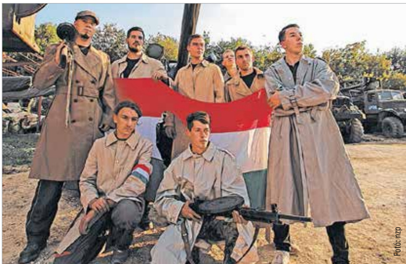
A fiatalok által megtisztított és újrafestett harckocsit tréleren szállítják október 19-én Székesfehérvárra, ahol október 24-én a harci eszközök segítségével utcaszínházi előadást rendez a hatvanadik évfordulóra a Vörösmarty Színház

Nem mindennapi látvány lesz a két Csepel teherautó, a már tavaly is kiállított páncéltörő ágyú, a két légvédelmi ágyú és a legnagyobb érdeklődéssel várt T54-es harckocsi a színház előtti téren.