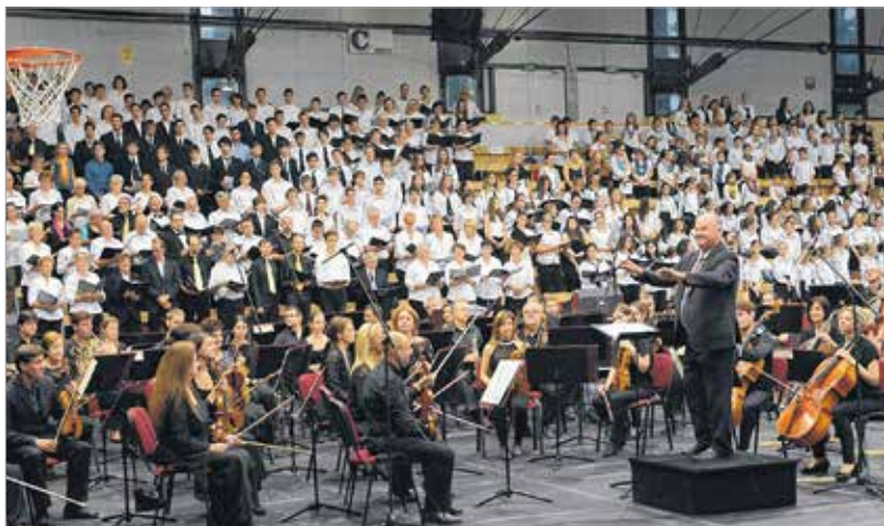
A világnapon a Fehérvár Fanfár is felcsendült

zenét szerető és értő emberek lehessünk. Véleménye szerint városunkban ehhez minden lehetőség adott, köszönhetően többek között a Fricsay Richárd által alapított zeneiskolának, a már intézménnyé nemesedett Alba Regia Szimfonikus Zenekarnak, a Kodály Zoltán iskolának illetve az elmúlt évtizedek ragyogó fehérvári zenészgenerációinak. A zenei világnapon a 2002-ben alapított Fricsay Richárd zenei díjat is átadták. Az elismerést azok az együttesek, előadóművészek, karnagyok, zenetanárok kaphatják, akik maradandót alkottak Székesfehérvár zenei életében. Az idei évben