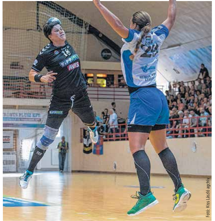
A célokért még jobban meg kell feszülni!