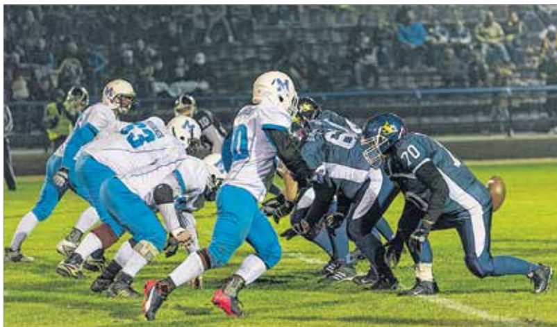
Villanyfényes, emlékeztető mérkőzésen győzte le a Fehérvár Enthroners a Tatabánya Mustangs csapatát a Takarodó úti First Fielden, ezzel feljutott a Divízió I-be a hazai amerikaifutball-bajnokságban