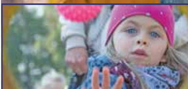
Ezrek bődörödtek a múlt hétvégén 4. oldal