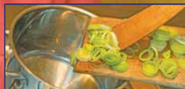
Sütőtök: főzve még finomabb! 24. oldal