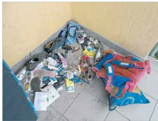
... marad is