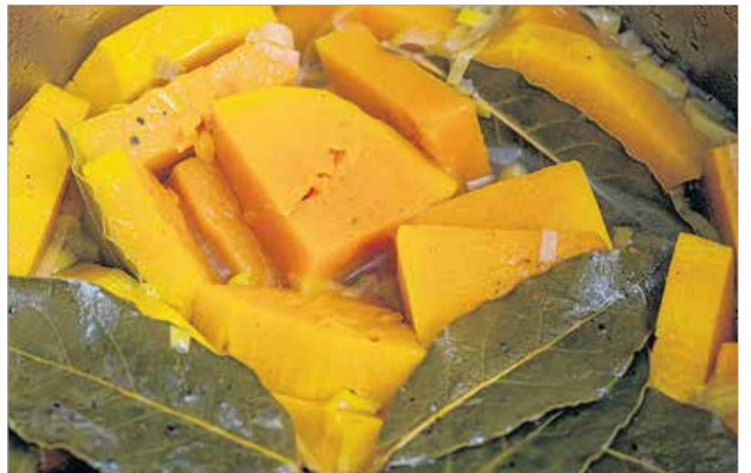
Nagyjából húsz perc alatt puhára fő