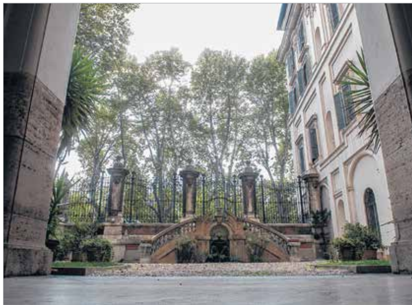
A Via Giulia legszebb épülete a magyarság művészeti fellekvára Rómában

lényeg, hogy „csak” kiállítsunk, hanem hogy vegyünk részt az adott ország vagy város kulturális körforgásában, vérkeringésében. Az elsődleges szempont az, hogy lépünk ki az épületekből. A nyilvánosság az utcán található. Szűk az utcánk, bár Róma egyik legrégebbi és legszebb utcájáról beszélünk. Ennek ellenére a magyar akadémia mellett elhaladó turisták nem állnak meg, elsiklanak mellette. Ezért olyan aktivitást kell mutatnunk, hogy magába az épületbe is be tudjuk csalogatni az embereket, hiszen a palota önmagában is komoly látnivaló. Ezen túl meggyőződésem, hogy a művészetet ki kell vinni az utcára, az emberek elé. Az elmúlt időszakban alkotóként is láttam, hogy az emberek egyre kevesebbet járnak múzeumokba, nem járnak a régi intenzitással galériákba, vagy csak ugyanazok: néhány művész és műkedvelő. Az a tapasztalatom, hogy a gazdasági válságnak köszönhetően a műgyűjtők is inkább elbújnak, abban reménykedve, hogy így kevesebb atrocitás éri őket. Viszont az új mozgalmakban látni lehet azt, hogy erőteljesek és populárisak. Egy városnak, egy urbánus közegnek most már ők is elengedhetetlen részei. Azt szeretném, hogy mi is kilépjünk Róma tereire, megmutassuk a