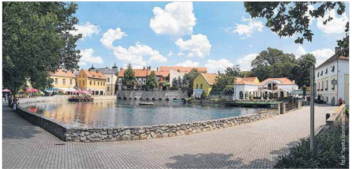
A Malom-tó romantikus hangulatot áraszt

A térségi székhely sok turista által keresett pihenőhely. A Templom-dombon található az egykori központ, a Romkert, ahol a templomot és a kápolnát várbástya vette körül, előtte farkasveremmel, ami felett felvonóhíd állt.