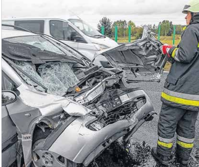
A személyautó eleje az ütközés ereje miatt szinte teljesen megsemmisült. Az autó vezetője a helyszínen életét veszítette.

Egy nappal később, október 12-én újabb súlyos baleset történt. Két személyautó ütközött össze a 81-es úton, a mohai elágazásnál. Az ütközés következtében mindkét jármű az árokba illetve bokros területre hajtott. A tűzoltók kiérkezése előtt a mentők egy könnyű és két súlyos sérültet emeltek ki, akik közül senki nem volt beszorulva. A helyszíni szemle és a műszaki mentés ideje alatt az érintett útszakasz forgalma rendőri irányítás mellett, felpályán haladt.