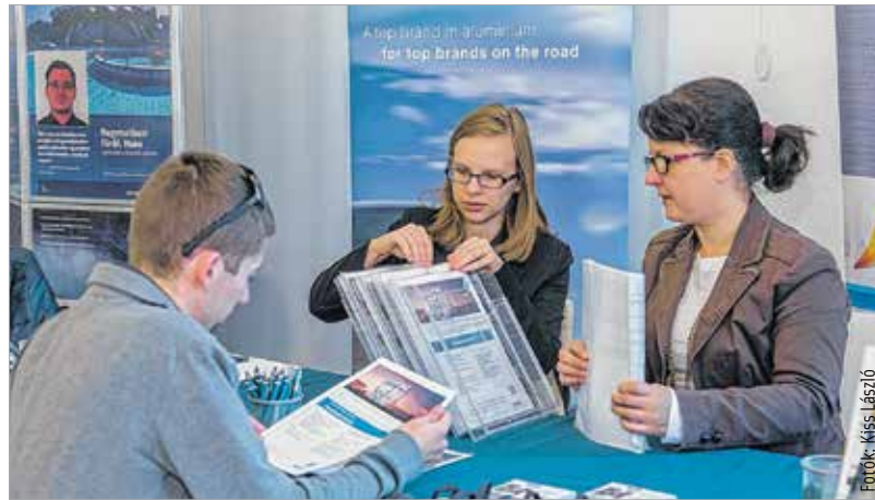
A Sapa közel harminc betöltetlen állást kínál – mérnököktől az IT-szakemberen keresztül a betanított munkásig