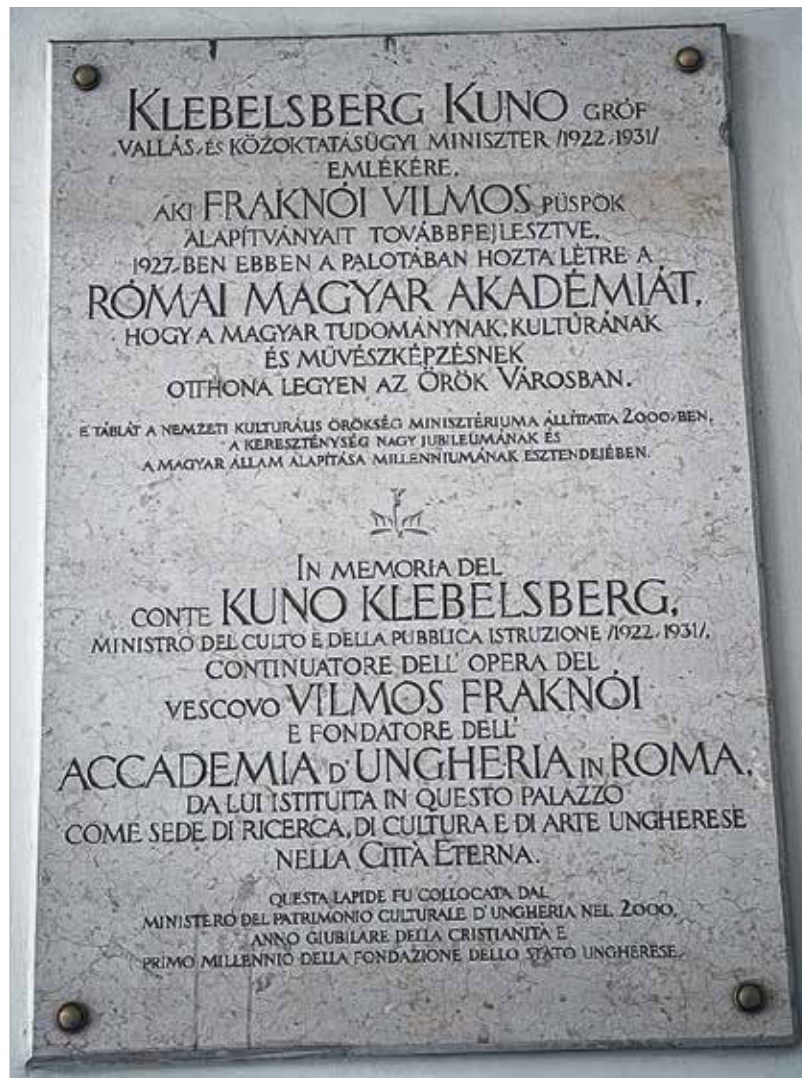
Klebelsberg Kunó mindenkinél többet tett a magyar alkotók európai elismertetéséért

Az ön pályafutását ismerve ezek a célok a továbblépést segítik majd, és most nem feltétlenül arra utalok, hogy csak a kortárs művészet beemelését szorgalmazza, hanem azt az elmozdulást, amely népszerű, színvonalas, ugyanakkor eltartja önmagát. Az én koncepcióm elég vad: az eddigi hagyományokat megpróbálja megtartani, de közben szakítani is vele. A tudományt mindenképpen meg kell hagyni a magyar akadé-