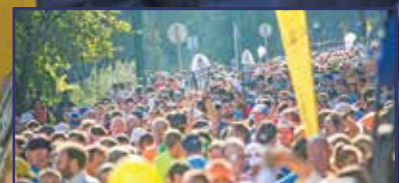
Futás és játékonyság 29. oldal