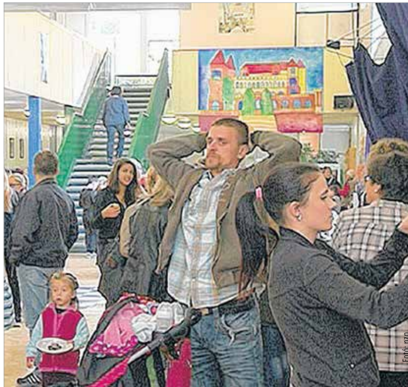
A Bory iskola családi napján rengeteg program várta az érdeklődőket, az iskola aulája vásári forgataggá változott

Az iskola fennállásának 35. évfordulója alkalmából nyitották ki szombaton az iskolát. Mint ahogy Sándorfy Gergely igazgató lapunknak elmondta, ötödik alkalommal rendezték meg a nyílt napot, csak eddig szüreti mulatságnak nevezték. Ahogy fogalmazott, ilyenkor össze, egy szombaton kinyitják az iskolát a gyerekek és a szülők számára, hogy együtt tölthessenek egy családi napot, a szülők belelássanak