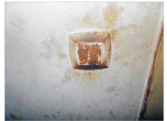
Az utolsó kapcsolja le a villanyt!