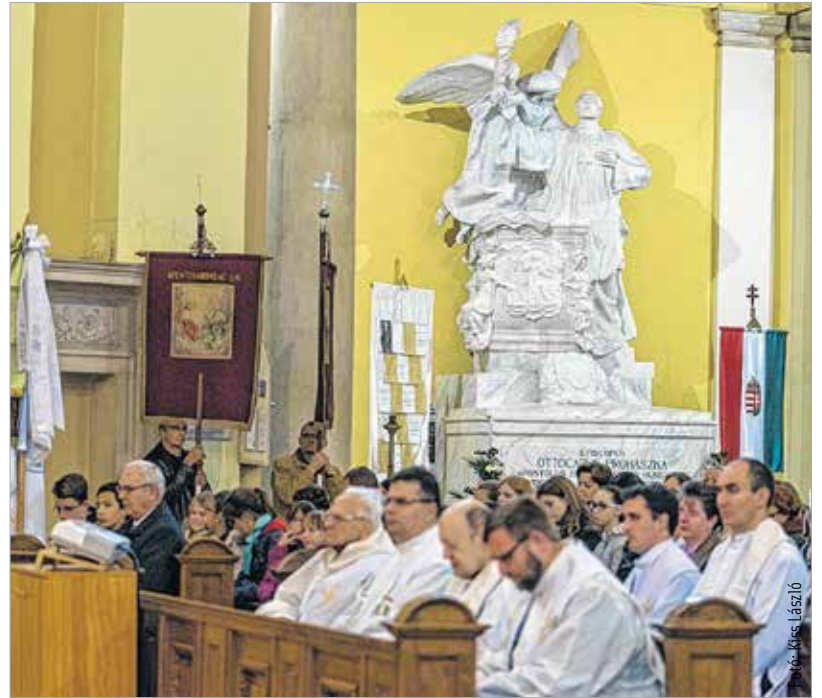
Zsúfolásig megtelt a templom Prohászka Ottokár püspök tiszteletére