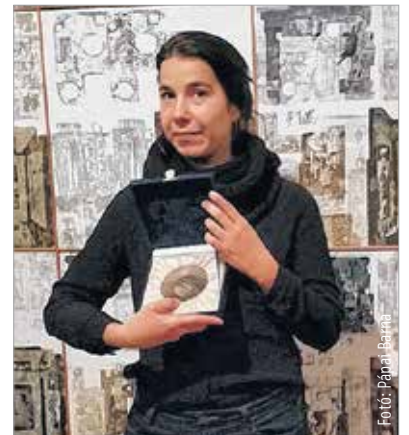
A díjazott képzőművész mozgófilmeket és térinstallációkat készít