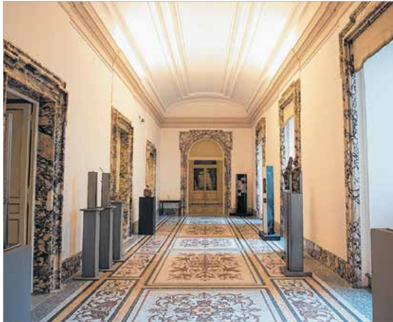
A külső és a belső méltósága a modern művészetek számára is elsődleges

Szimbiózisban élem meg ezt a változást. Nemrégiben voltam a szindikátus előtt, ahol volt egy meghallgatásunk egy új projektünkéről, mely az elmúlt néhány hónap munkájának eredménye Rómában, ami rendhagyó még az itteniek szemével nézve is. A beszélgetés végén azt mondtam, hogy szeretnénk jövőre is több olyan projekttel megjelenni, ami az utcán van. Jövőre lesz a Kodály-évforduló, aminek keretében szintén installációkat szeretnénk kirakni, hogy minél többen láthassák, hallhassák, ötvözze a vizualitást a hanghatásokkal is. Azt kérdezték tőlem, hogy annyi minden látnivaló van Rómában, miért kellene még ide pluszban. Erre azt mondtam, hogy Róma maga a csoda. Minden művész számára elengedhetetlen, hogy egyszer hosszú ideig itt tartózkodhasson, beszívassa a levegőjét, de ma már követnünk kell a huszonegyedik századot. Az akadémiának nagyon fontos feladata, hogy a művészeti élet-