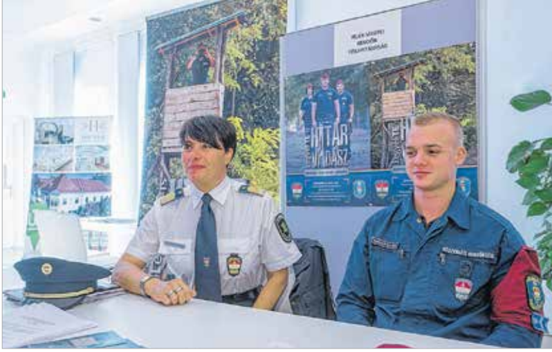
A Fejér Megyei Rendőr-főkapitányság a határvadász egységekhez várt jelentkezőket