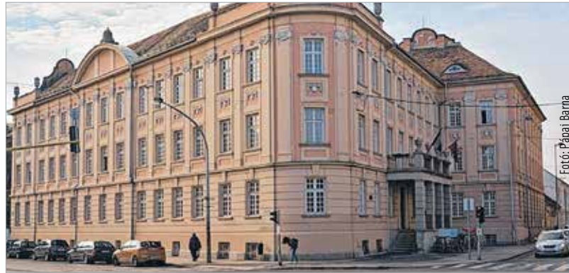
A Teleki Blanka Gimnázium és Általános Iskola

A HVG összeszedte a legjobb magyar gimnáziumokat, rangsorolta őket, és megnevezte az első száz helyezettet. Az első kérdés azonban, ami ilyenkor az olvasóban felvetődik, hogy mi alapján lehet rangsorolni az oktatási intézményeket? Azt a szerkesztők is megállapítják, hogy a szempontrendszer, amit felállítottak, csak egy a sok közül, mégis úgy tartják, hogy az általuk összeállított kiadvány a legmagasabb tudásszint elérését igazoló iskolákat igyekszik bemutatni. Az értékeket összesítve a székesfehérvári Teleki Blanka Gimnázium és Általános Iskola a 42. helyet tudta megszerezni a százas listán. Az elérhető adatok szerint az intézmény-