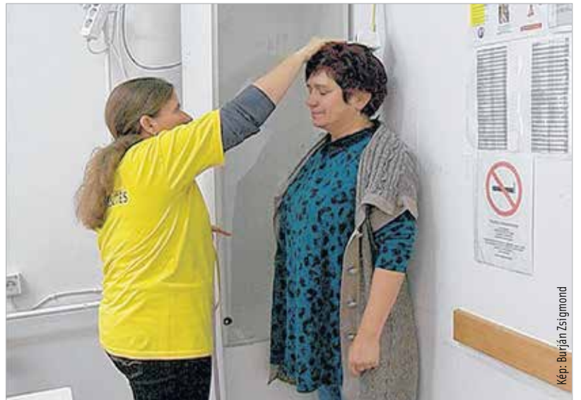
Kép: Burján Zsigmond

Szombaton a városban két helyen, a Család- és Nővédelmi Központban valamint Szárzréten folytatódott a városrészi egészségnapok sorozata. Mindkét helyszínen BMI és testzsírméréssel, különböző vizsgálatokkal várták az érdeklődőket. Östör Annamária egészségügyi és sporttanácsnok, aki reggel maga is ott volt az egészségnapon, elmondta, hogy a vizsgálatokat a Szent György Kórház és a Humán Szolgáltató Intézet szakemberei végezték. Az általános állapotfelmérésen túl EKG-vizsgálat, kardiológiai és bőrgyógyászati szűrés, dietetikai tanácsadás is volt, illetve látásvizsgálatot tartott a Pannónia Optika. Ruhabörzét is tartottak szombaton a Feketehegy-Szárzréti Községi Központ rendezvényátráiban, ahol helyi szülők fogtak össze, és közösen szervezik meg a programot havi egy-egy alkalommal.