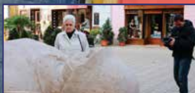
A történelmet mi írjuk 6-7-8. oldal