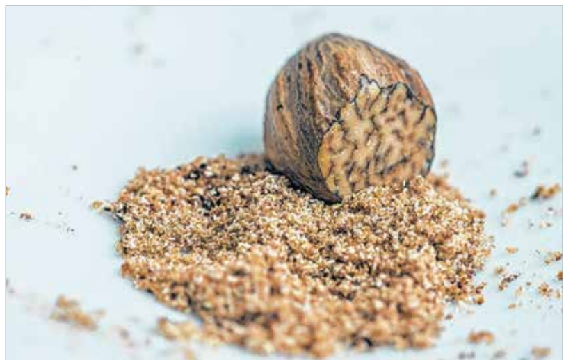
A szerecsendió nem túl hivalkodóan emeli ki a sütőtök édességét

diót is, hogy egy fokkal egzotikusabb legyen az íze. Amikor a tök annyira puha, hogy bele tudjuk szűrni a villát, átpakoljuk a tök- és póréahagymadarabokat egy levszűrő segítségével a turmixba. (A babérlevelet természetesen kivesszük, ha nem szeretnénk később evés közben a tálkából a kis zöld foszlányokat halászgatni.) Annyi főzőlevet csurgatunk rá, ami a háromnegyed részét lepi el, majd beleöntjük a tejszínt vagy az éppen otthon lévő növényi tejet. Összeturmixoljuk az egészet. Sózzuk, borsozzuk, és egy marék maggal illetve felkarikázott póréahagymával tálaljuk. Ha nagyon el vagyunk ereszelve idővel, akkor a magokat előtte egy serpenyőn megpiríthatjuk, de egy hétköznapi gyors ebédnél a natúr magok is remek levesbetétként funkcionálnak. A végeredmény kellően lágy és krémes, mely belülről felmelegít a legzordabb őszi napon is!