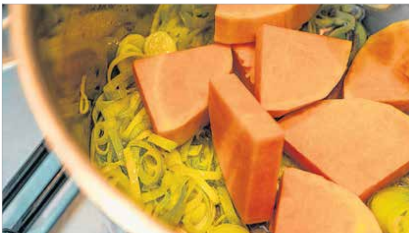
A póréahagyma remekül illik hozzá