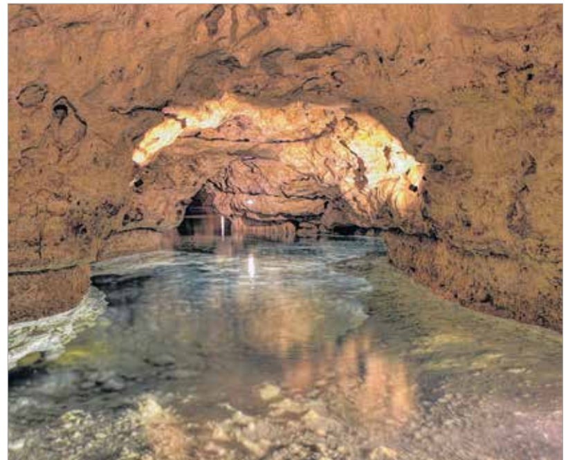
A tavasbarlang egy része csónakkal bejárható

karsztvíz által kialakított, háromszintű barlangrendszer nagy részét tizenkilenc fokos víz borítja. Mintegy háromszáz méteres