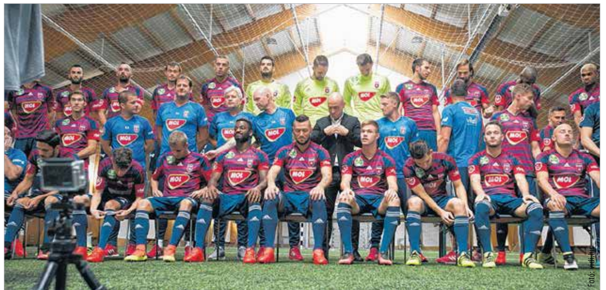
A hosszú szünetben a csapatfotózás is színes programnak számított