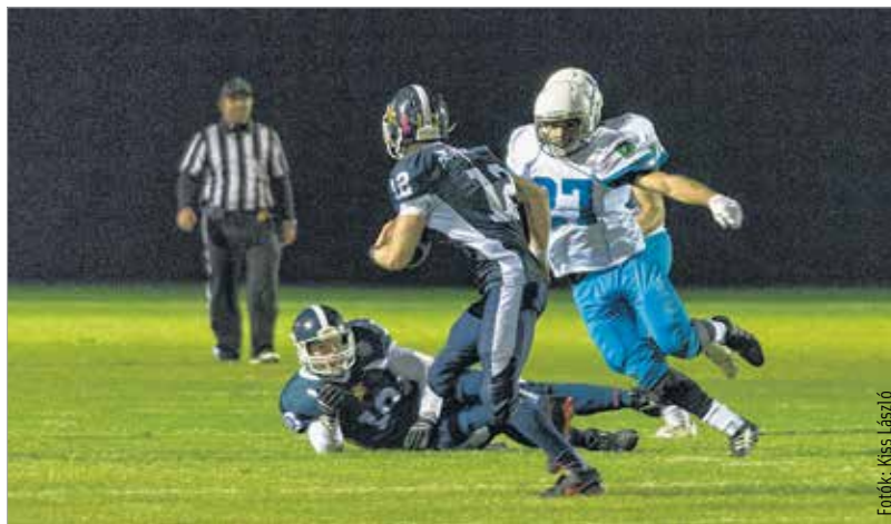
A 35-6-os győzelem mutatja, valóban magasabb szintre került a fehérvári csapat, jövőre pedig már légiósokkal megerősítve a másodosztályban vezethet hasonlóan pontos támadásokat