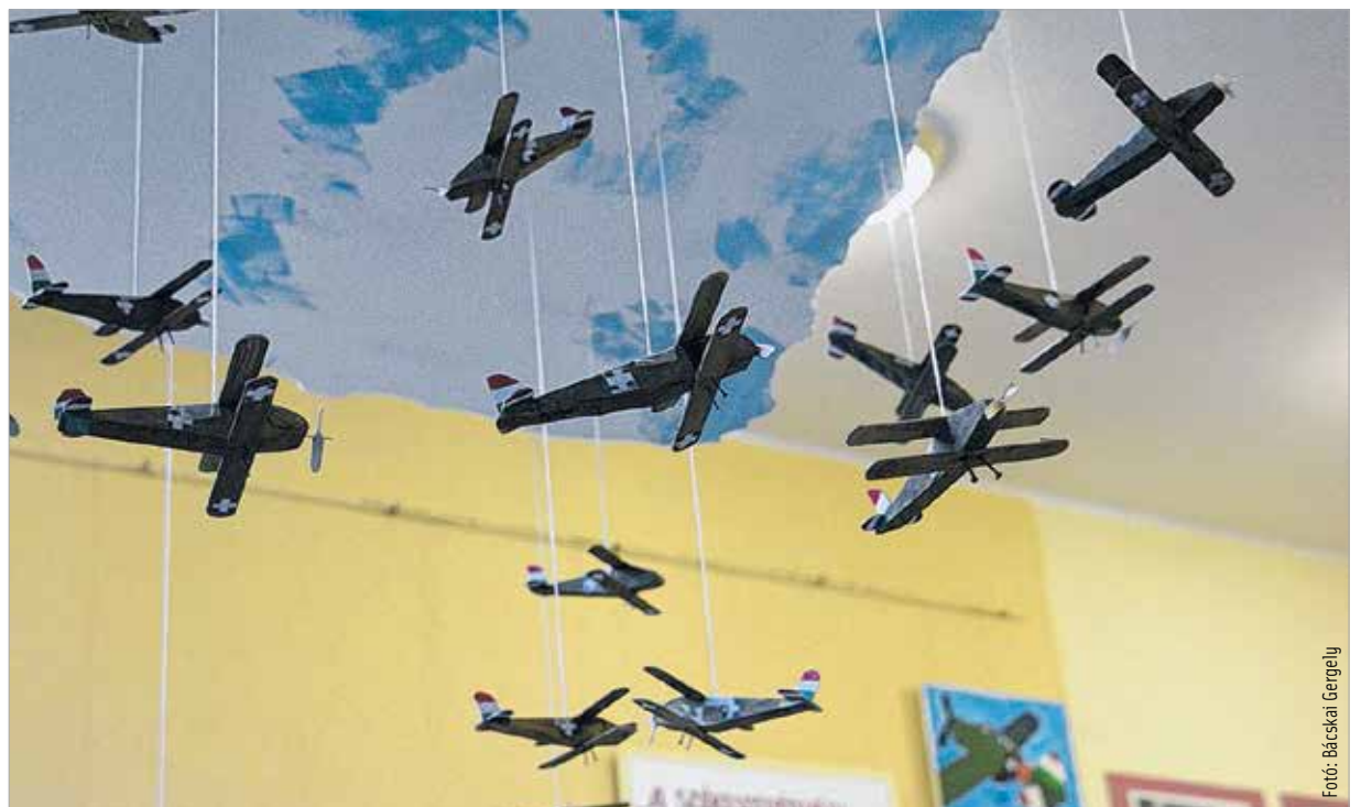
Rajzkiállítással csatlakozott a városi repülés századik évfordulójának tiszteletére szervezett emlékvéhez a Vasvári Pál Általános Iskola