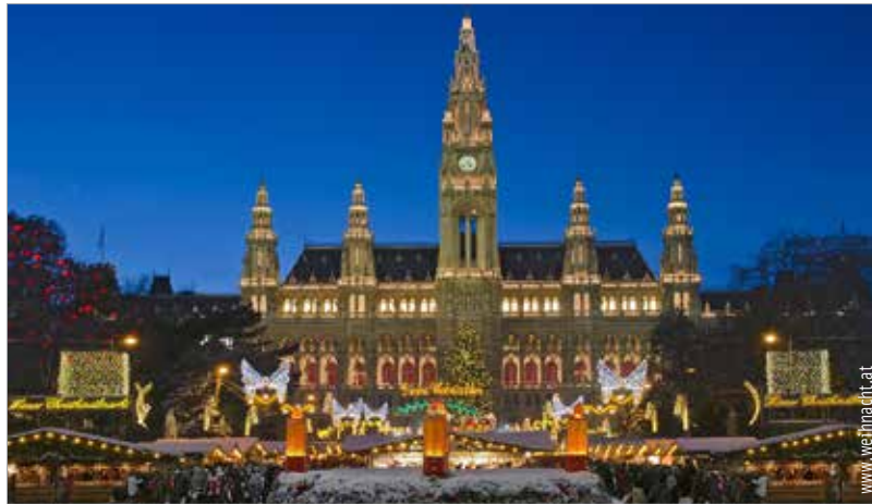
A Rathausplatz adventkor igazi mesevilággá változik

A nürnbergi karácsonyi vásárt tartják az egyik legfényesebbnek Európában, ami ebben az évben november 25-én nyitja meg kapuit. Az árusok a hagyományoknak megfelelően piros-fehér csíkos házikövekben árulják portékáikat. A városi legenda szerint itt lehet kapni a világ legkülönlegesebb formájú, illatú és színű gyertyáit. A színpadon keddtől péntekig délután háromkor kórusok, fúvószenekarok és gyerekeneszek lépnek fel. A gasztronómia szerelmeseinek a forralt boron és a sült kolbáson túl érdemes megkóstolni a híres nürnbergi mézeskalácsot!