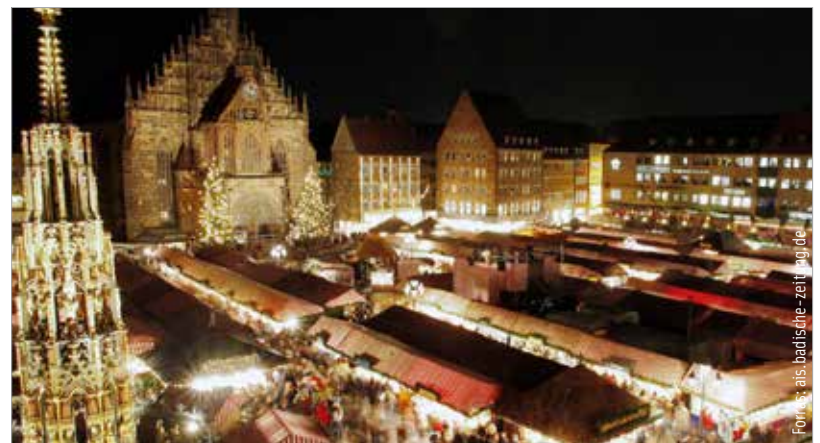
Ha szereti a különleges gyertyákat, akkor a nürnbergi karácsonyi vásárt ne hagyja ki!