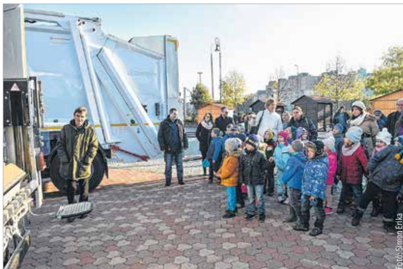
A szemléletformálás jegyében az új kukásautókat a gyerekek körében vette át a Depónia

A négy új kukásautó beszerzéséről a városi közgyűlés tavaly döntött. A százhetvenmillió forintos beruházást a város saját erőből finanszírozta. A polgármester szerint nagy szükség volt a fejlesztésre, hiszen Székesfehérvár egyik legfontosabb közszolgáltatása a hulladékszállítás. Cser-Palkovics András lapunknak elmondta: a gondos gazdálkodásnak köszönhetően sikerült olyan költségeket lefaragni, melyek lehetővé teszik a rezsicsökkentést és az esz-közfejlesztést. A Depónia Kft. összesen harminckét kukásautóval dolgozik a szemétszállításban, a járművek átlagéletkora tizenhárom év.