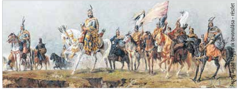
Az Árpád-ház-program a honfoglalás korától III. Andrásig foglalja magába történelmünket

Sokat hallhattunk róla, mégsem árt tisztába tenni: mi az Árpád-ház-program? Árpád fejedelem és az ő véreből származó Árpád-házi uralkodók több mint négyszáz éven keresztül játszottak rangos szerepet népünk honfoglalásában és a keresztény Magyarország kialakulásában. Az 1301-ig megépített Árpád-házi művet és honfoglaló fejedelmünk korát nemcsak a történelem viharai, hanem egyes korszakok emberi nemtörődömsége és politikai érdekei is pusztították. Magyarország kormánya 2016-ban arról döntött, hogy az Árpád-kort, az Árpád-házi királyok életművét, szellemi örökségét feltárja, rendszerezi, a megmaradt emlékeket, templomokat, emlékhelyeket felméri, ha kell, restaurálja, és kiállításokon bemutatja mindezt itthon és külföldön egyaránt. Azért valljuk meg, merész vállalkozásnak tűnik ez, amit nem lehet sebtiben megvalósítani. Nincs is szó erről! A megvalósítás több szakaszban történik 2038-ig, első keresztény királyunk halálának millenniumáig. Ebben a huszonkét