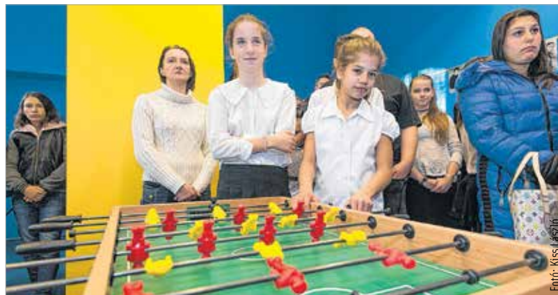
A legnagyobb kedvenc a csocsó lett

A közösségi tér kialakítása Székesfehérvár önkormányzata, a város polgármestere, a Fejér Megyei Esély Gyermekvédelmi és Gyermekmentő Alapítvány illetve a Pálfi-Tech Kft. támogatásával valósult meg kétfélmillió forintból. A város több mint 850 ezer forinttal támogatta az intézményt. Cser-Palkovics András polgármester úgy véli, látni kell, hogy egy nagyváros életében szükség van ilyen intézményre.