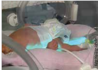
Húsz százalékkal csökkent a koraszülött-halandóság Magyarországon

Az elmúlt két évben húsz százalékkal csökkent a koraszülött-halandóság Magyarországon – mondta az M1 aktuális csatornán hétfőn este az emberi erőforrások minisztere. Balog Zoltán szerint az átfogó intézkedéseknek köszönhetően több száz millió forint jutott azokra az eszközökre, melyek a koraszülött csecsemők ápolására szolgálnak. Ezt kiegészítette a velük foglalkozó szakemberek képzése. A tendencia a Fejér megyei kórházban is tetten érhető.