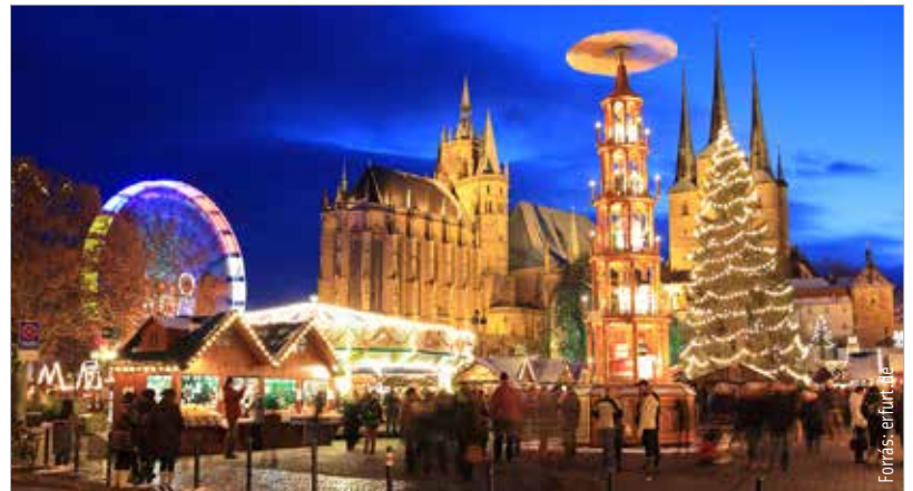
Az erfurti vásár különlegessége a karácsonyi piramis

valóságos mesevilággá varázsolja a Rathausplatzot. Idén körülbelül százötven standon lehet karácsonyi ajándékokat, például eredeti provance-i levendulatermékeket, fenyődíszeket és ünnepi finomságokat vásárolni. Egy tizenkét méter átmérőjű adventi koszorú valamint a karácsonyi díszbe öltöztetett fák borítják fényárba a környéket. A szervezők a legkisebbeknek külön programokkal készülnek: a gyerekek betekintést nyerhetnek a Jézuska-műhelybe, kipróbálhatják a Jézuska-expresszt, levelet adhatnak fel a Mennyei Postahivatalban. Esténként kórusok és