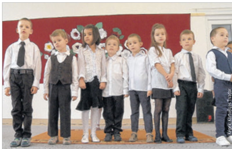
A gyerekek szeretik az óvodájukat

„Nemcsak a városrészben, de az intézmény falain belül is nagy változások történtek az elmúlt évtizedekben.” – kezdte gondolatait Brájer Éva alpolgármester. – „A gyermekekkel való bánásmód az intézményben dolgozóktól is merőben más hozzáállást kíván, mint negyven évvel ezelőtt. Ez nagy kihívás, éppen ezért tartozunk hatalmas köszönettel az óvónőknek, akik mindig mindent megtesznek annak érdekében, hogy a gyermekek érdekeit szolgálják.”