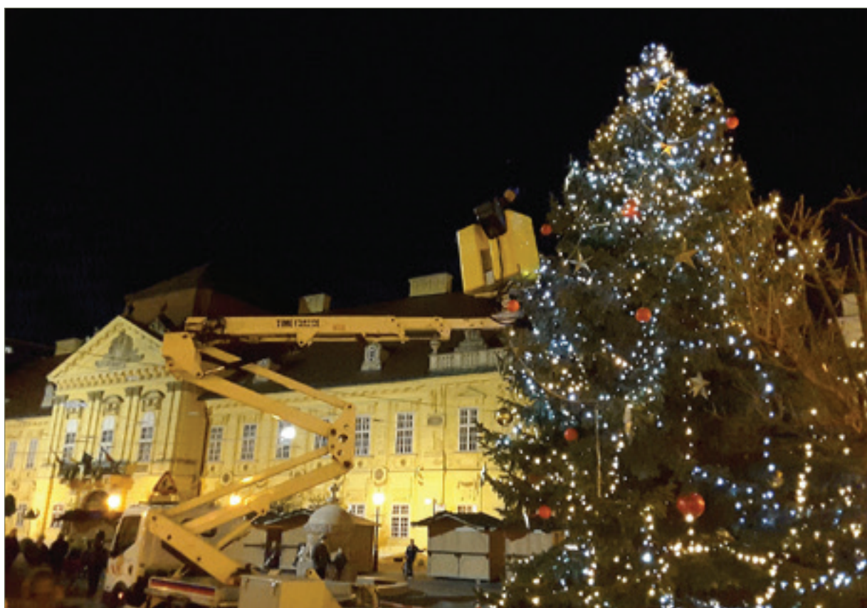
Már szerelik a fényeket