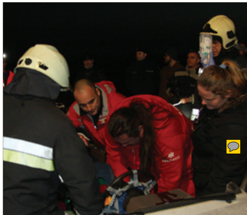
Tizenketten „sérültek meg” a balesetben, a tűzoltók vágták ki őket