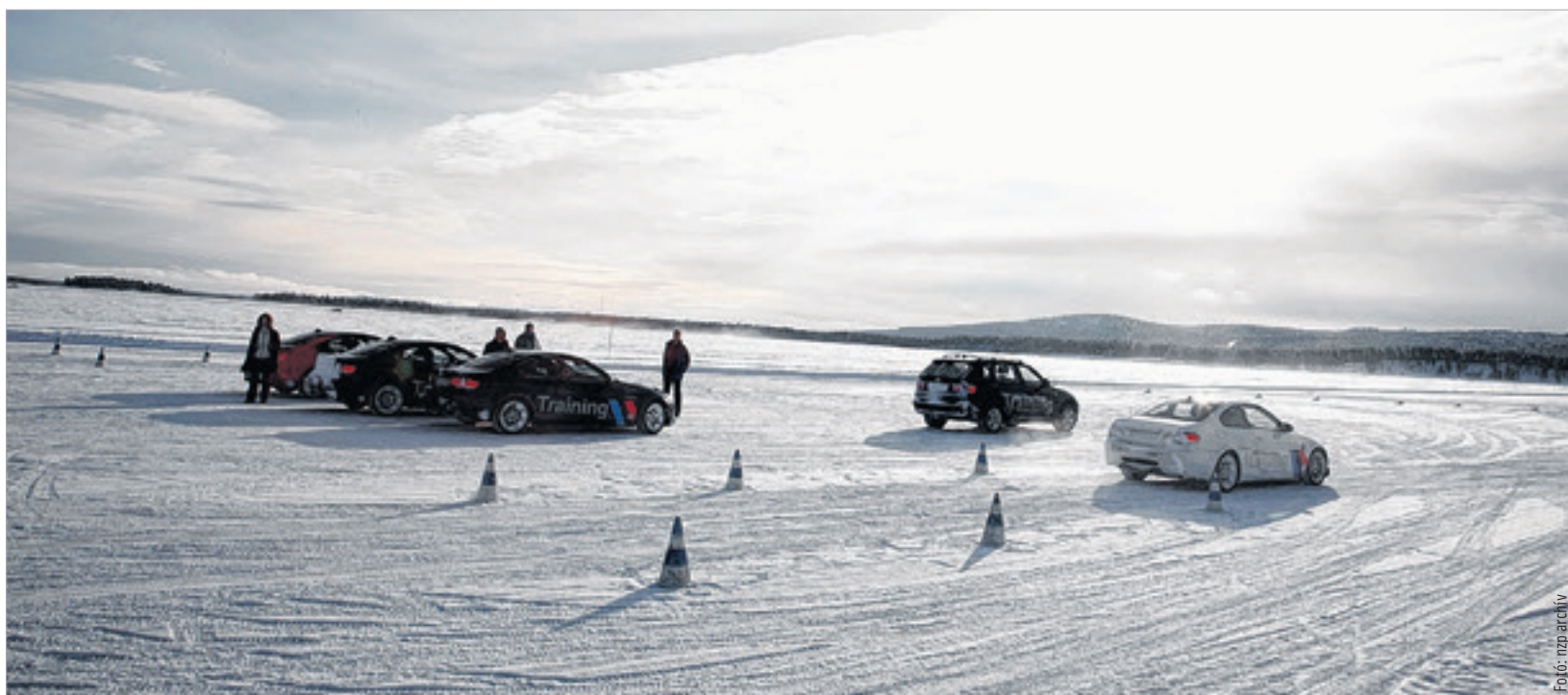
Egyre többen mennek úgynevezett teszt pályákra, hogy megismerjék, milyen csúszni az autóval és úrrá lenni a fizikai törvényeken

fel, hogy ilyen távolságról nyáron minden autó megállt... Ez a 25 méter többlet egy egytonnás autónál pokolt jelenthet! Mivel teljesen más a viselkedése az autónak havas, jeges úton, érdemes begyakorolni kijelölt tanpályákon, extrém körülmények között, miként reagál járművünk és mi magunk. Megdöbbentő tapasztalatokat gyűjthetünk össze, ami óvatosságra és bölcsességre inthet valamennyiünket, amikor másokkal közlekedünk egy úttesten. A rendőrök a vezetőtanpályák használatát javasolják, de