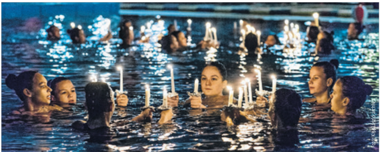
Idén is lesz Orka karácsonyi gála

Az orkások idén már nem versenyeznek, készülnek a hagyományos karácsonyi gálára, mely december 17-én, szombaton 18 órakor kezdődik. A gálán az összes versenyző bemutatja majd kúrtját, nagyjából hatvan sportolót ugrik vízbe. A gála előtt pedig 20-25-en vesznek részt az Orka kezdők számára kiírt karácsonyi házi versenyen. A jövő év első nagy versenye a fehérvári rendezésű XX. Orka Cup lesz. Tavasszal rendezik a Magyar Kupát, nyár elején a Hungarian Opent, mely versenyeken biztos résztvevő lesz az Orka.