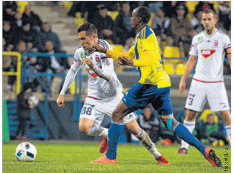
Nagy csatában, de alulmaradt a Vidi Mezőkövesden

A Vidi pedig szombaton nemcsak a három pontot gyűjtene be, de a klub játékosági játékgyűjtést szervez a találkozótól. A vidi.hu oldalon olvasható felhívás szerint a Videoton a Magyar Máltai Szeretetszolgálattal közösen ismét adománygyűjtést szervez a rászoruló székesfehérvári és környékbeli családok gyermekei részére. Már nem használt, de újszerű játékok felajánlását várják a gyűjtés során, amelyekkel örömet lehet szerezni a hátrányos helyzetű gyermekeknek. Az ajándékokat a Pancho Aréna 1C szektora előtt kialakított VidiShop mellett, a Máltai Szeretetszolgálat sátránál november 26-án, szombaton 16 órától egészen a mérkőzés kezdetéig várják.