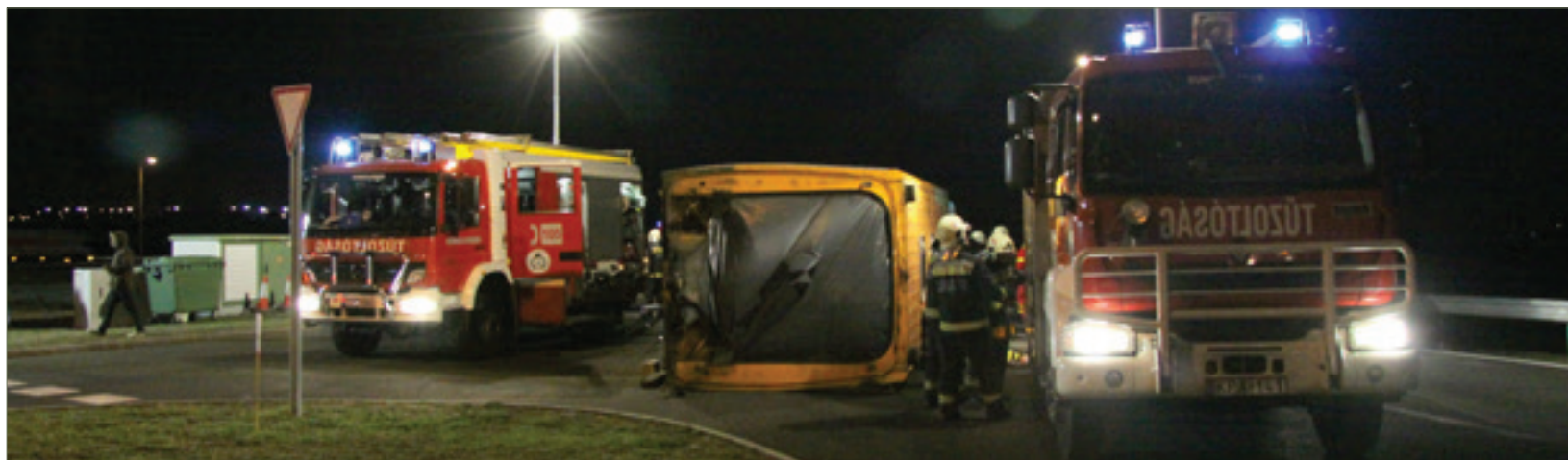
A busz a forgatókönyv szerint oldalára borult