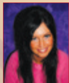
Hexina jónő www.holdfenyek.hu