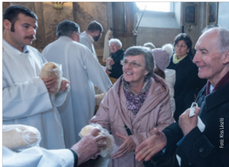
Szent Erzsébet ünnepén szentelt kenyeret kapott minden miselátogató