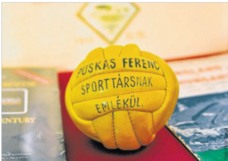
A labda volt a mindene

a Real Madrid csapatánál eltöltött időszakát felidéznek, sőt ritkán látható családi fényképeket is láthat a nagyközönség. Puskás Ferenc „Kiváló sportoló” igazolványa, a spanyol gólkirályi címért járó Pichichi trófea is látható lesz a tárlatban. Sőt Sebes Gusztáv szövetségi kapitány jegyzetfüzete is, melybe 1953-ban leírta hogyan lehet megverni a kilencven éve veretlen angolokat. A kiállítás éppen a legendás 6:3 évfordulóján, november 25-én, pénteken, a magyar labdarúgás napján nyílik meg. A tárlatot a Szent István Király Múzeumban december 18-ig lehet megtekinteni.