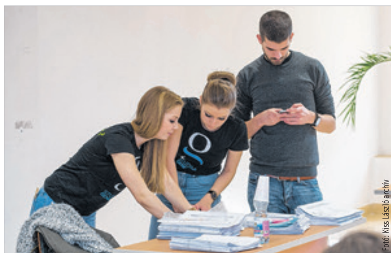
Újra felsőoktatási expóra várják a továbbtanulás előtt állókat

az Alba Regia Sportcsarnok lesz. A Corvinus Egyetem 2016-ban indította el első évfolyamát Székesfehérváron: gazdálkodás és menedzsment illetve pénzügy és számvitel szakon tanulhatnak duális és hagyományos képzésben is a hallgatók. A következő felvételi időszakban szintén ezeket a nappali alapszakokat választhatják a továbbtanulók, de a kínálat kiegészül a gazdaságinformatikus levelező alapképzéssel valamint a kommunikáció- és médiatudomány illetve a nemzetközi gazdaság és gazdálkodás levelező mesterképzésekkel. Szakirányú továbbképzéseket is kínálnak, ezek egy része várhatóan már februárban elindul.