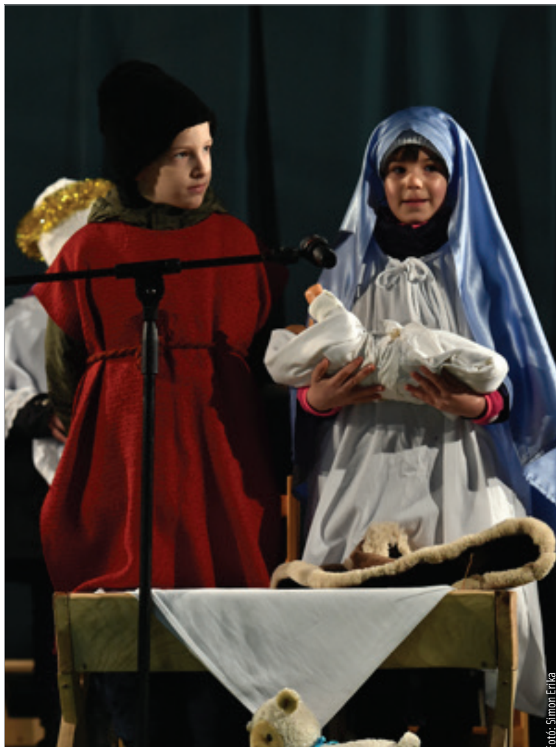
A város iskolásai és óvodásai adnak hétköznaponként műsort a Városház téren

Az első ünnepi hétvégén, november 26-án nyílik meg a Püspöki Palota kertjében a hagyományos Adventi udvar is, ahová várják mindazokat, akik szeretnének valódi csendes, békés, imádságban eltöltött karácsonyi készülődés részesei lenni. Szombat délutánonként négy óra imádságos gyertyagyújtásra is várják a híveket. A látogatás során igényes kézműves tárgyakat lehet vásárolni ajándékba és jótekonysági céllal is. December 3-án indul az Egymillió csillag a szegényekért jótekonysági akció.