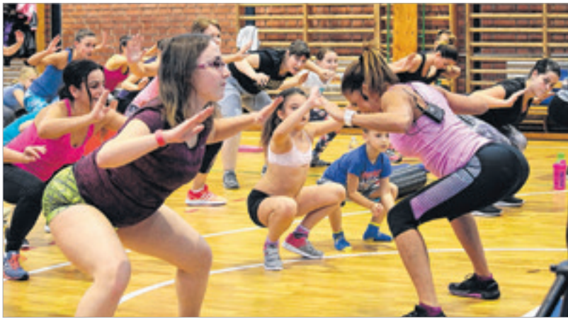
Rubint Réka a résztvevők között, őket bátorítva edzett végig

A kezdés előtt már fél órával megtelt az iskola tornaterme. A padlón edzéshez öltözve törölközőkön és fitnessmatracokon ültek a mozogni vágyó fehérváriak, akik Rubint Réka érkezéséig egymással beszélgettek, a telefonjukon szörföltek az interneten vagy éppen kiélvezték az izomláz előtti békés pillanatokat. A fitnesszedző nem sokat váratt magára, fél négy után nem sokkal pulcsijának ledobását és néhány köszöntő szót követően bele is vágott az egyórás kőkemény