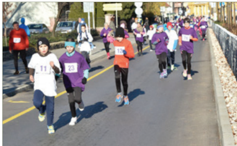
Idén is az a tizenkét év alatti gyermek gyűjthetja fel a belváros adventi fényeit, aki a legjobb helyezést éri el az Adventi jótékonyági futáson

3., 4., 10. és 11. számú választókerületek – szombatonként 15 és 20 óra között tartják közös karácsonyváró ünnepüket az iskola aulájában.