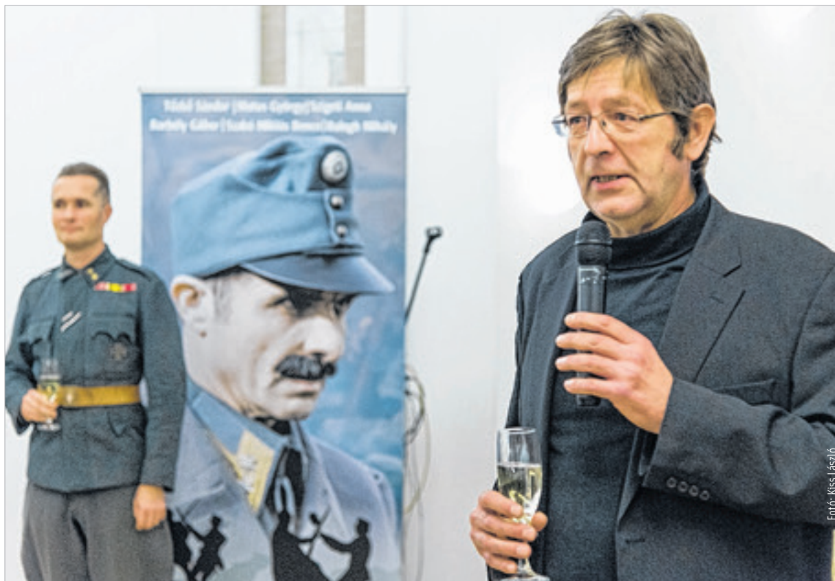
Burján Zsigmond rendezésében egy hiteles, hiánypótló mű született

A filmet a zárt körű bemutatót követően nyilvánosan is vetítik majd, elsőként november 30-án és december 7-én a Barátság moziban.