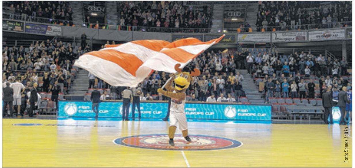
Nem légiós, de fontos szereplő Chalonban: Scott, a kabalaszarvas

„Biztos, hogy a franciákat fűti a visszavágás vágya a fehérvári vereségért, de nem ezzel foglalkozunk, hanem a saját játékunkkal. Sok mindennek rendben kell lennie, elvégre egy olyan