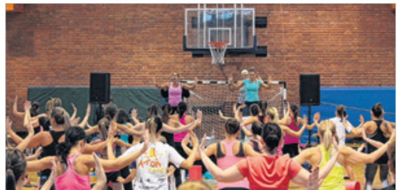
Mindegy, mikor edzünk, mindig valami pluszt hoz az életünkbe