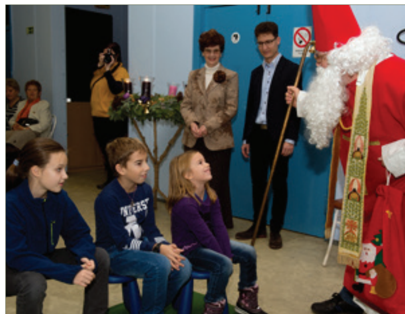
Tavaly a vízivárosi advent egyik csúcspontja volt a mikulás érkezése