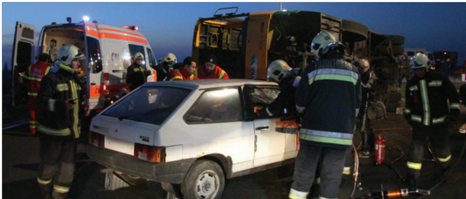
Minden olyan szervezet részt vett a mentésben, melyek valódi vészhelyzet esetén is bevethető