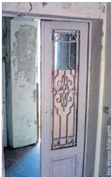
A Fekete Sas belülről

Ugyanazok a leletek fordulhatnak elő kint és bent is. Pontosán nem tudjuk, hogy a Fekete Sas Szálló