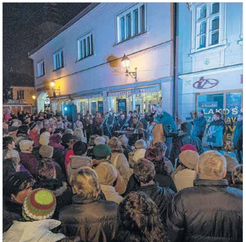
A város ünnepén a Tilinkó zenekar is köszönti a névnaposokat

A legismertebb Katalin-napi időjósítás, hogy ha Katalin kopog, a karácsony locsog – és fordítva, melyet mindenki ismer, és melyre általában figyelnek is az emberek. Ez azt jelenti, hogy amikor Katalin napján fagyos, télies idő van, akkor karácsonyra enyhébb időjárás várható. A mindenki által ismert mondás mellett mások is vannak, amelyek szintén a karácsonyi időjárásra utalnak. Ilyen a „ha Katalin szépen fénylik, a karácsony vízben úszik”, de közmondások is vannak az időjárással kapcsolatban: ha Katalinkor megállt a liba a jégen, akkor a karácsony sáros lesz. November 25-ét szerelemjósító napnak is tartották, amikor a lányok megálmodhatják, hogy ki lesz a jövőőbelijük. Emellett Katalin-napkor orgonaágot helyeztek vízbe, s amelyik lány ága karácsonyra kizöldült, az a következő évben férjhez ment. A katalinágakat a különböző vidékeken másként állították a lányok, volt, ahol kilenc különböző gallyat tettek vízbe, máshol pedig nem cserélték a vizet az ágon, és meleg helyen kellett tartani. A néphagyomány szerint ez a nap dologtiltó is, főként az asszonyoknak: nem szabad seperni és kenyeret sütni, de mulatni lehet, mivel ez a nap a kisfarsang utolsó napja, amikor Katalin-bált is tartottak.