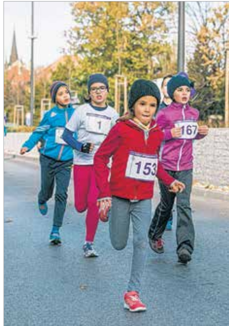
A legkisebbeknek nem okozott gondot az egy kilométeres táv leküzdése