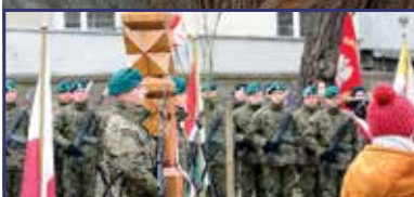
Ötvenhatos emlékoszlop Opolében 3. oldal