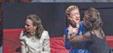
Sajtópróbán jártunk 11. oldal