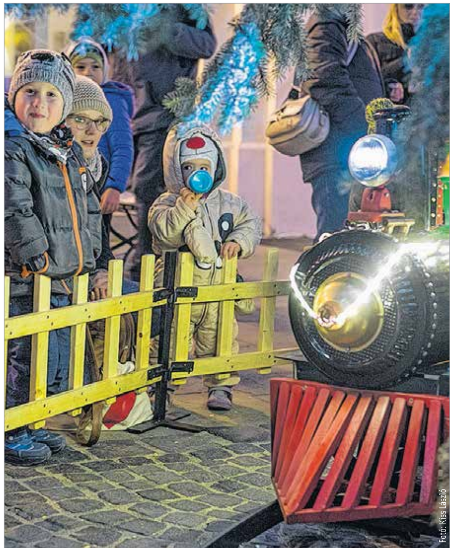
Újdonság a város karácsonyfája körül futó kisvonat, de emlékeztet fotók készülhetnek egy óriási játékmackóval, az éneklő családi kórossal és a kisangyalkákkal is