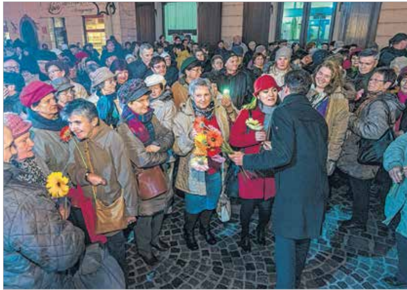
Ezen a napon minden Katalin mosolyog