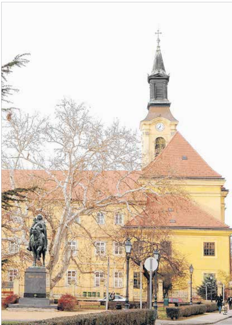
A Szent József-templom óráján jelenleg fél egy múlt hét perccel

A délutáni program része egy előadás a fiatalok munkavállalásáról, kerekasztal-beszélgetés a duális képzésről illetve három szekcióbeszélgetés különböző, a konferencia témájához kapcsolódó kérdésekről. A rendezvényen a részvétel mindenki számára ingyenes, de regisztrációhoz kötött, amelyre az alábbi oldalon van lehetőség: http://bit.ly/corvinus_konferencia1