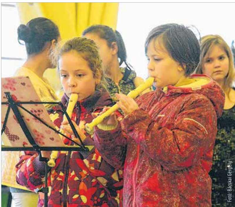
Adventi ünnep volt Feketehegy-Szárazréten is