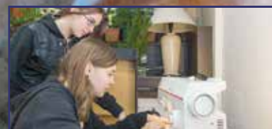
Semmi különös, egyszerűen csak működik 13. oldal