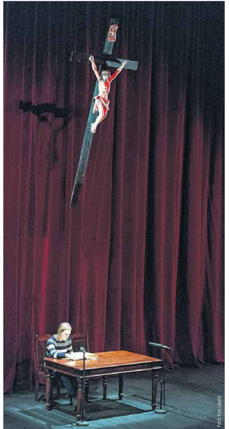
A felolvasó, a szent könyv és az Úr – százhuszan olvastak fel idén az Újszövetség-maratonon

Az Újszövetség-maraton alatt bárki belehallgathatott a felolvasásba. A program egyedülálló az országban, igazi fehérvári eseménnyé vált. És az idén újabb elemekkel bővült, hiszen zeneiskolások, gimnazisták készültek koncertekkel. Így az Újszövetség-maraton keretében a színház előterében zenei előadások várták az érdeklődőket.