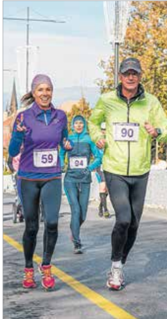
Idén is futott a világhírű énekesnő, Miklósa Erika, aki családjával érkezett a II. Adventi jótékonyági futásra

Egy esztendővel ezelőtt is nagy siker volt, így idén sem maradhatott el az Adventi jótékonyági futás. A Várkörúton rendezett futóversenyre több mint ötszázan neveztek, mellyel a kórház gyermekosztályának csecsemő- és gyermekágyvásárlását támogatták a résztvevők, akik az egy és az öt kilométeres távok közül választhattak.