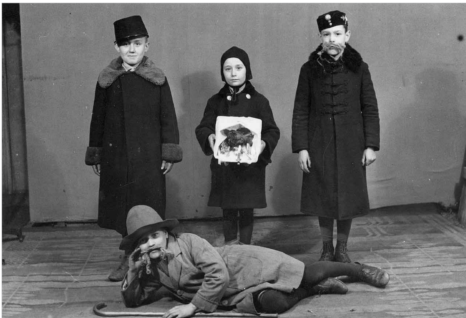
Betlehemesek Székesfehérváron, 1908-ban (Szent István Király Múzeum)

tő, adománygyűjtő pásztorok jártak házról házra. Felsővárosban aprószentek napján a legények fűzfavesszőből font korbáccsal megvirgácsoltak mindenkit, de főleg az eladósorban lévő lányokat. Közben ezt mondták: „Egészséges légy, keléses ne légy, Jövő évben még frissebb légy!” Ha valamegyik lányt nagyon megütötték, azt dióval, almával engesztelték meg.