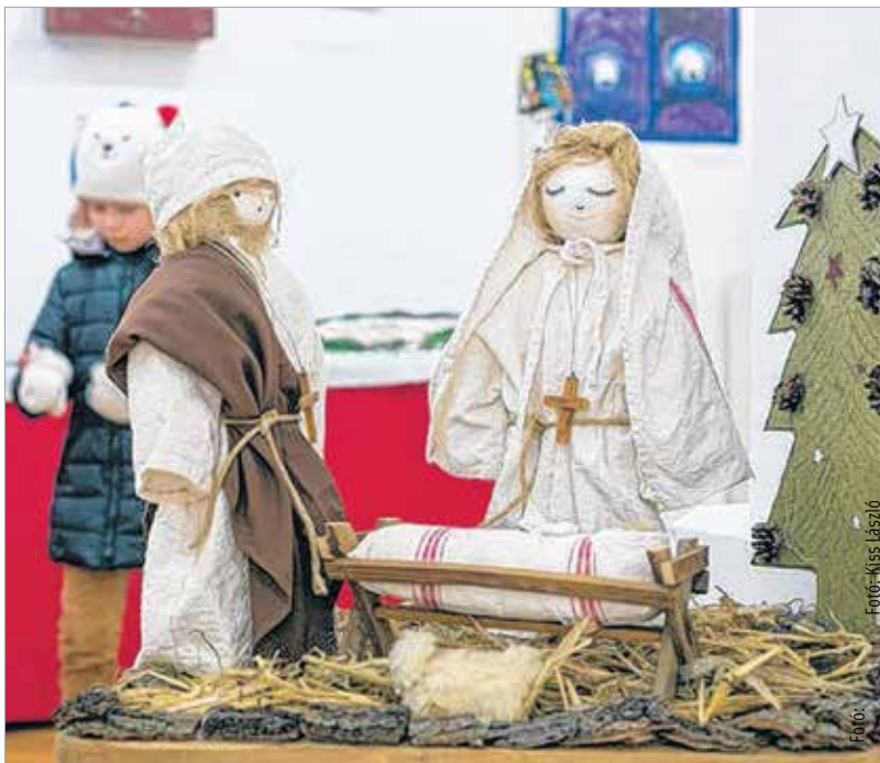
Újra megnyílt a Betlehemi Szép Csillag kiállítás a Szent István Múvelődési Házban