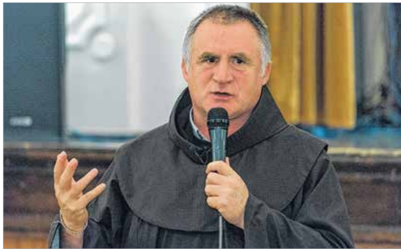
„Advent idején próbáljunk meg párbeszéddel közeledni egymáshoz!”

éves Jézust a templomban keresni, így csak három nap után talált rá. Mégsem a szidás volt az első, amellyel fogadta, hanem párbeszédet kezdeményezett fiával, vagyis úgy kezelte a benne felgyülemelő feszültséget, hogy megkérdezte, hol volt, hiszen Józseffel együtt borzasztóan aggódott érte. Elképzelhető, hogy nem is értette egészen Jézus választát – „atyám dolgaiban kellett járnom” – mégis el tudta fogadni, és örülni annak, hogy megtalálta szeretett gyermekét.” – magyarázta előadásában a ferences szerzetes.