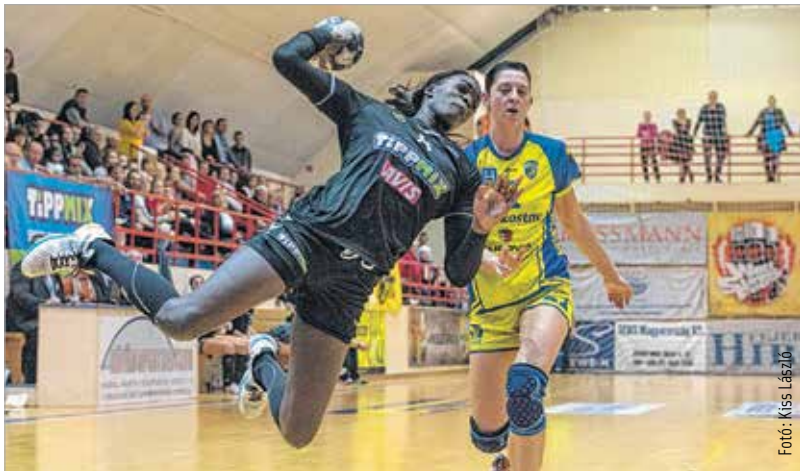
Az Alba Fehérvár KC az EHF-kupában eddig hatból hatot nyert, így szinte berepült a csoportkörbe

Az Alba Fehérvár KC a január 7-i hétfőn Krasznodarban kezdi a csoportkört.