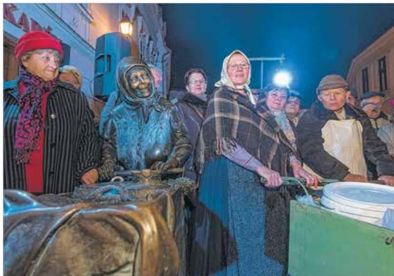
A felsővárosi fertályos asszonyok hagyománya örök

nemcsak szeretné megérinteni a legendás felsővárosi asszony orrát – a jószerence reményében – hanem már a tisztelettel fényes orr mellett a kezeket is megszorogatják. Cser-Palkovics András polgármester ünnepi köszöntőjében úgy fogalmazott, napról napra szembesül azzal, hogy a Liszt Fe-