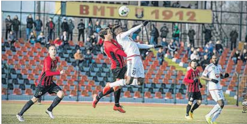
Mint Stopira, a Vidi is elszállt az NB III-as ellenfél otthonában

Megszületett a kormányzati döntés: a még szükséges 3,3 milliárd forintot is a központi költségvetésből biztosítják a beruházáshoz, így elmondható, hogy a Sóstói Stadion és a hozzá kapcsolódó fejlesztések teljes egészében állami forrásból valósulnak meg. A város közgyűlése november 11-én zárta le a közbeszerzési eljárást, azóta már a munkaterület-átadás és a kivitelezés is megkezdődött Sóstón.