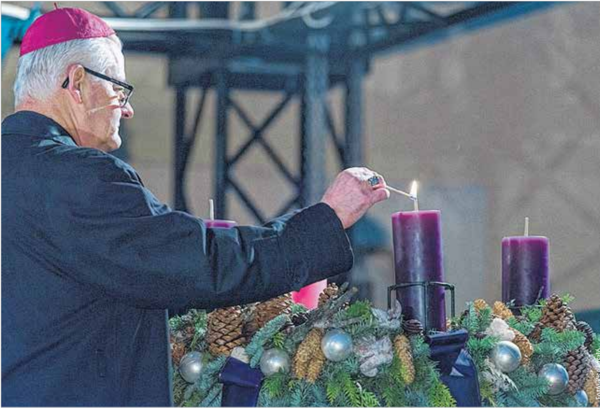
Az adventi gyertyának van a legkülönlegesebb fénye

A Püspöki Udvar is ünnepi díszbe öltözött, és megtelt családokkal, akik az imádságos gyertyagyújtásra és a diákok műsorára érkeztek. „Advent a várakozás megszentelése. Rokona annak a gyönyörű gondolatnak, hogy meg kell tanulnunk vágyakozni az után, ami a miénk.” – hangzottak el Pilinszky János költő sorai a fiatalok műsorában. „A karácsony a kis Jézus születésének megünneplése, az örömhír továbbadása meghitt együttletben. Az ünnepi asztal, az ajándékozás, a családi szokások és a békés hangulat hozzátartozik az ünnephez. Sok család számára azonban a körülmények, az anyagi nehézségek, a családi viszonyok, a nélkülözés megnehezíti, sokszor ellehetetleníti a karácsony igazi örömeinek megélését. Ami nekünk a karácsonyi asztalra kerül, számukra csak távoli vágy, ami nekünk egy hétköznapi bevásárlólista, nekik a karácsonyi kívánságuk, ami nekünk elképzelhetetlen tragédia, nekik a hétköznapijaik.” – emelte ki megnyitóbeszédében Spányi Antal a megyéspüspök, a Karitásznak elnöke, majd felhívta a Figyelmet a „Tárjátok ki a szíveteket!” karitatív gyűjtésre. (A gyűjtésről részletek a 12. oldalon olvashatók.)