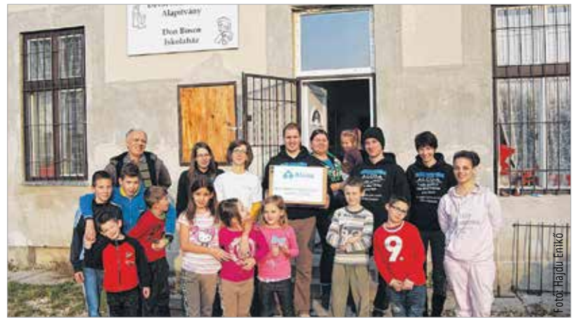
Az iskolaház lakói, dolgozói és az Alcoa önkéntesei

A résztvevők jól érezték magukat, kellemes időtöltés volt a gyerekekkel, akik nagyon lelkesen vettek részt a programban.