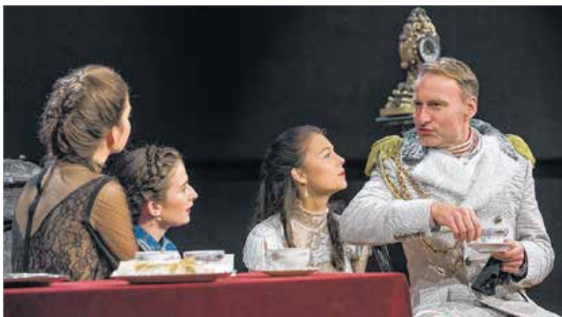
Az előadás mindvégig olyan kérdésekre keres választ, hogy mi az élet értelme, érdemes-e egyáltalán élni. Szikora János rendezése végül egy lehetséges választ is ad a dráma végén a kérdésekre.