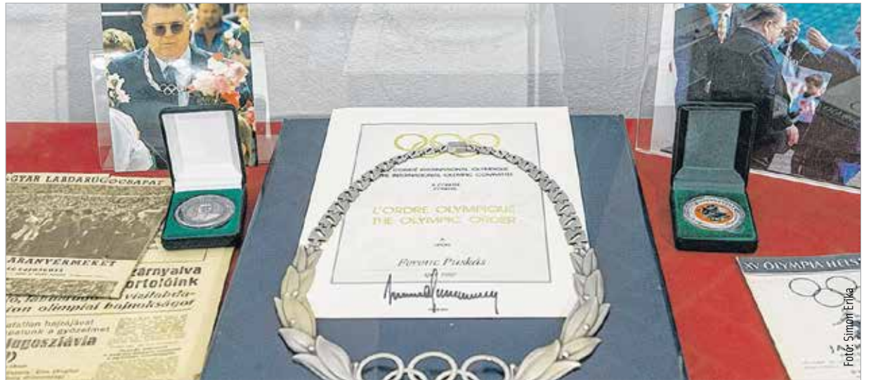
A legenda relikviái december 18-ig láthatók a Szent István Király Múzeumban

Az eseményen Cser-Palkovics András, Székesfehérvár polgármestere úgy fogalmazott, a tárlat méltó emléket állít minden sportot és labdarúgást kedvelő magyar számára: „Nincs olyan magyar család, amelyikben ne lenne személyes élménye valakinek a korszakkal, a sporttal, az Aranycsappal és természetesen Puskás Ferencel kapcsolatban. Az én családomban is vannak ilyenek, nekem talán a legszebb emlék, mikor nyaranta, nagypapám üdülőjében esténként mesélt az Aranycsapatról, a rádió előtti kuporgásról. Ezeket az élményeket csak azok adhatták át hitelesen, akik tudták, hogy azokban az időkben mit jelentett ez Magyarországnak, a magyar embereknek. Mi gyermekfővel azt láttuk, azt érzékeljük, hogy ez mekkora dolog lehetett, hiszen generációknak adott élményt, megerősítést a pályán nyújtott teljesítményével, emberként pedig azzal, hogy soha nem feledte, honnét indulva lett a világ egyik legkiválóbb labdarúgója. Amikor felmerült, hogy a vándorkiállítást adott esetben befogadjuk-e, nem