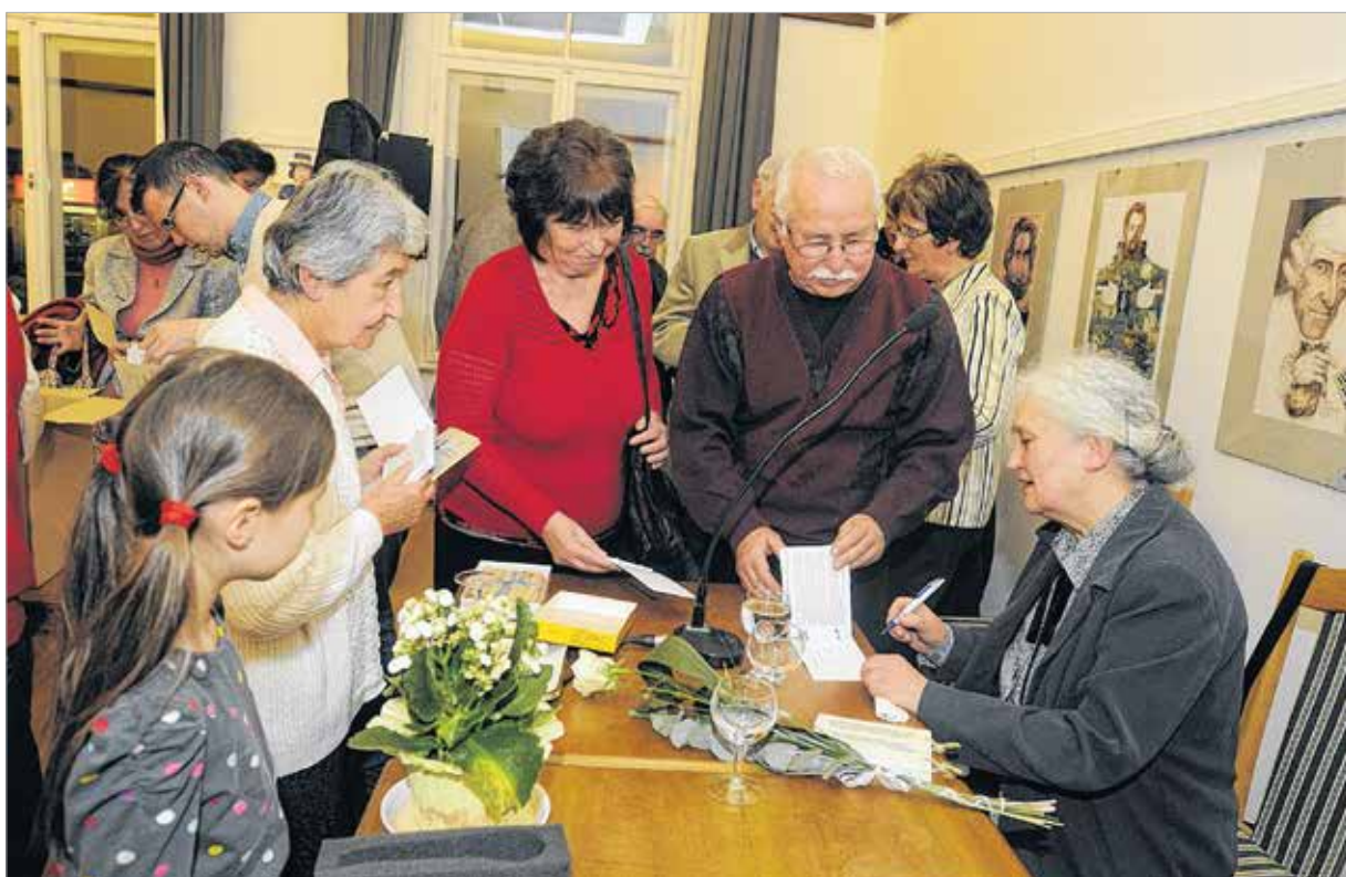
A „Fehérvár köszöntése”, a könyvbarátok becses ereklyéje lesz

Lettem hajlék, üres és kongó. Csöndje: örökkön- zúgó dongó Sírni szeretnék: meg nem érétt. Kétrét görnyeszt nem-várt ítélet Csalódtam. Győztek émyeledni. Hogy is bírnám nem - mentegetni? Anyám! anyám! - jajongnám egyre- hol vagy? fuss hozzám! vonj öledre! Rám ismernél - e? Árva lettem. Idegen ég hűl-hűl felettem. 1945, Berdicsev