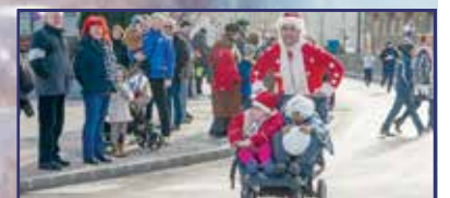
Félezren futottak, játékonykodtak 31. oldal