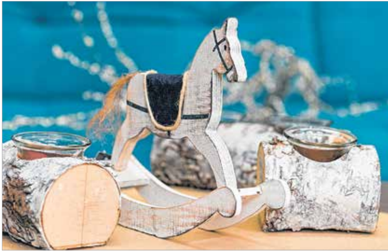
Néhány fehérre festett faág már ünnepi hangulatot teremt

különböző árnyalatai köszönnek vissza, amelyek egy-egy erőteljes színnel, például a tűzpirossal, padlizsánnal és az arannyal még különlegesebb hatást keltenek: „Nem kell az összes meglévő karácsonyi díszet kipakolni! A lényeg, hogy a dekoráció egységes legyen! Egy-egy fényes izzószorral, a komódon néhány fehérre fújt ággal és néhány színben vagy mintában ezekhez illő díszpárnával könnyen, gyorsan és olcsón teremthe-