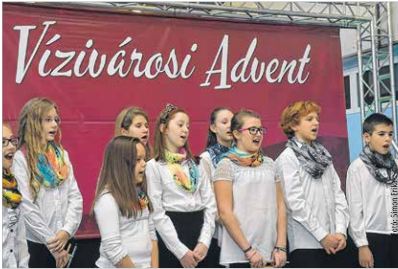
Gyermekhangokkal telt meg a Vízivárosi advent színpada