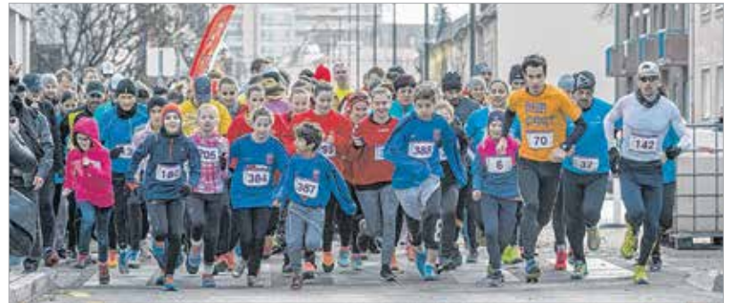
Több mint ötszázan futottak a Várkörúton vasárnap