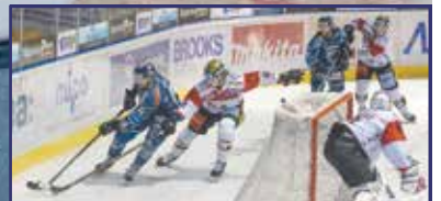
Indul a hokibuli 15. oldal

Áldott, békés karácsonyt és boldog új esztendőt kíván Székesfehérvár Önkormányzata!