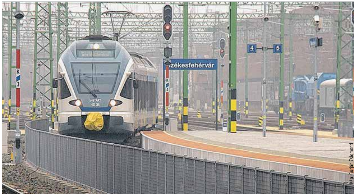
Az állomáson új felsővezeték létesült, a Mártírok útján zajvédő fal épült, és új tengelyszámálós vonatérzékelésű elektronikus állomási biztosítóberendezést létesítettek nyolcvankilenc központi állítású váltóval. Moha és Börgönd felé pedig ellenmenetet és vonatutolérést kizáró berendezést telepítettek.

meg az állomáson. Az intermodális csomópont várhatóan két-három éven belül kialakulhat, aminek következtében az állomás előtti tér az autóbussz-megállóval együtt megszépülhet, valamint a parkoló is bővíthet, hogy egy tel-