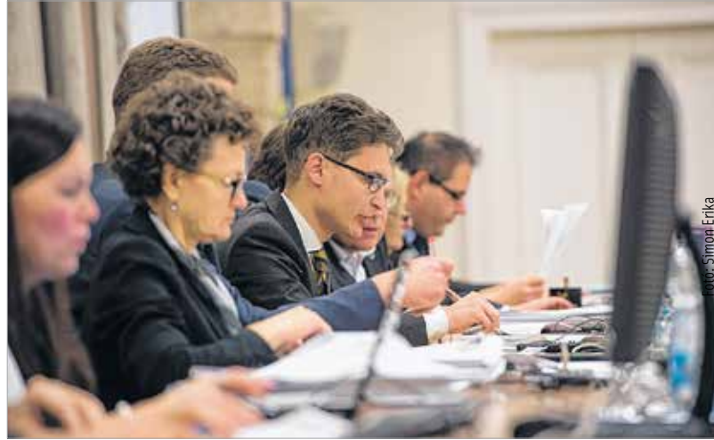
Jövőre áttekinti a testület a parkolási rendszert