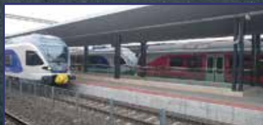
A vasútállomás már az utasoké 3. oldal