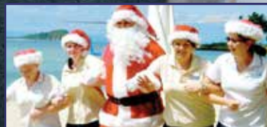
Így ünneplik a karácsonyt a világban 8-9. oldal