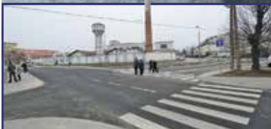
Befejeződött a Varga-csatorna felújítása 2. oldal