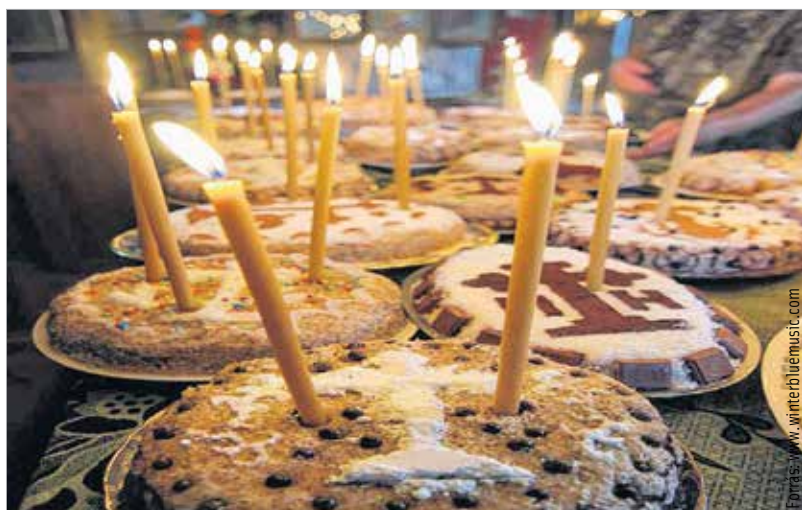
Nincs görög karácsony díszes kenyér nélkül

Afrikában is karácsonyoznak a keresztények. A templomokat szalagokkal, virágokkal, zöld növényekkel és lufikkal díszítik fel. A családok a vacsorát hagyomá-