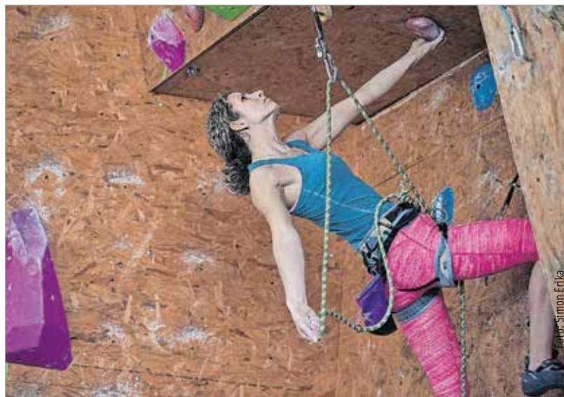
Aki nem fél a magasban és szereti a kihívásokat, annak irány a falmászóterem!