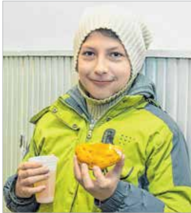
A fiataloknak is ünnep a Szent Sebestyén-templom búcsúja

Nem volt ez másképpen az idén sem, és ahogy farsang idején szokás, az ünnepet agapé kísérte: fánkkal és forró teával ülték meg a búcsút a felsővárosiak. A Szent Sebestyén-nap régen is nagy ünnep volt. Aznap senki nem dolgozott, az emberek templomba mentek, majd utána az egész család együtt ebédelte. Az asztalról nem hiányozhatott a szalagos fánk. Ezt a hagyományt elevenítették fel a fogadalmi mise után a Felsővárosi Közösségi Házban, ahol forralt borral és fánkkal várták a vendégeket.