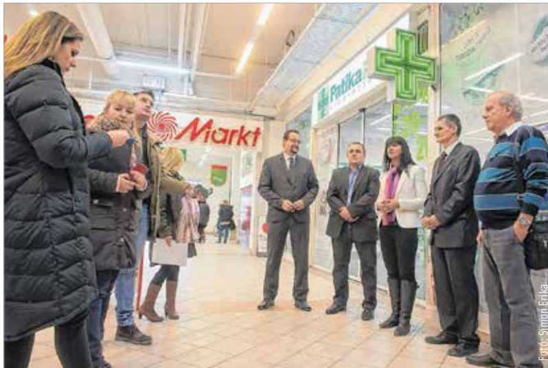
Székesfehérvár élen jár a méhnyakrák elleni küzdelemben

Mindennél fontosabb tehát a megelőzés, melynek két pillére van: a védőoltás és a rendszeres szűrés. Székesfehérvár ezért figyelemfelhívó programmal csatlakozik a XI. Európai méhnyakrák-megelőzési héthez. Január 27-én, pénteken délután a Fehér Palota Üzletközpontban az életmentéshez kulcsfontosságú prevencióról, a HPV elleni védőoltásról és a szűrővizsgálatokról tájékozódhatnak az érdeklődők. Az üzletközpont földszintjén a Fejér Megyei Kormányhivatal Népegészségügyi Főosztálya egészségfejlesztői várják az érdeklődőket. Lesz beszélgetéssel egybekötött gyöngyfűzés, karkötőkészítés, ahol minden egyes felfűzött gyöngy a reményt és a védelmet szimbolizálja. Az így elkészült ékszerek pedig a szűrés és a védőoltás fontosságára emlékeztetik viselőiket.