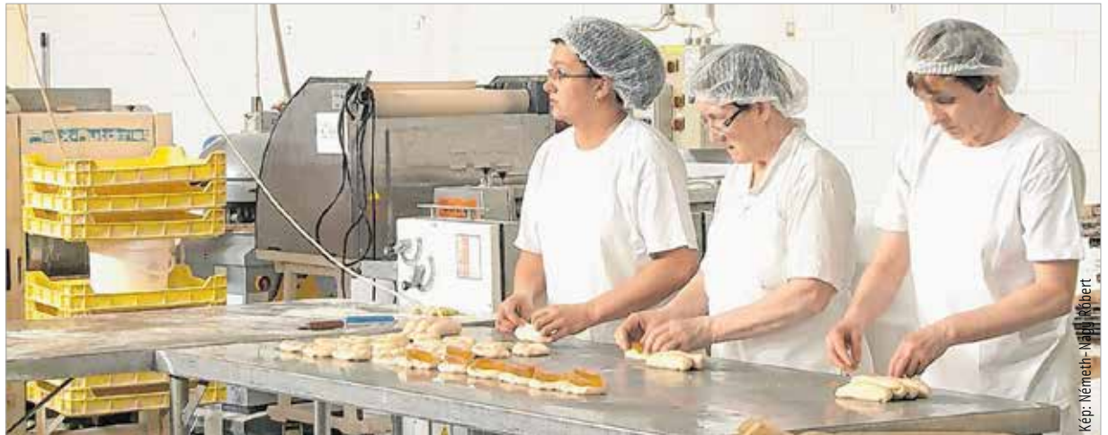
A fehérvári pékség dolgozói is megéreztek a jelentős béremelés hatását

Mostanra a családok is érezhetik a tavaly novemberi hatéves bérmegállapodás hatását. Az átlagkeresetek tíz százalékkal, 273.800 forintra emelkedtek januárban. Hétfőn Budapesten tartott tájékoztatóján Varga Mihály nemzetgazdasági miniszter kijelentette: a mérsékelt inflációt figyelembe véve kimagaslóan, hét és fél százalékkal emelkedtek a reálkeresetek, ezzel 2013 eleje óta, azaz negyvenkilenc