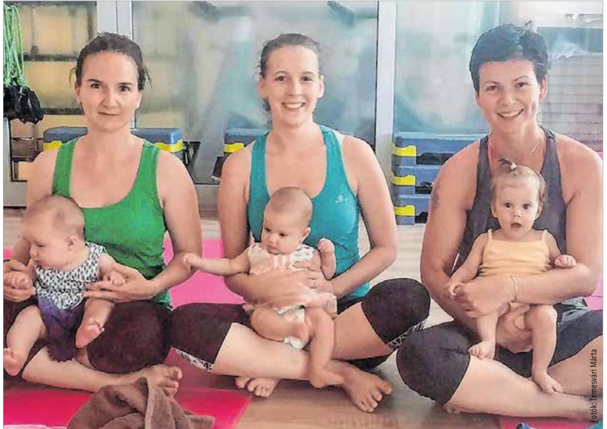
Az anyukák szeretik, ha mindig velük van a gyermekük – és így van ez jól!

A kilenc hónap alatt megnövekedett babaházikó nem fog sitty-sutty visszaolvadni eredeti állapotába. Azért bizony meg kell dolgozni: diétával és edzéssel. A legfontosabb kérdés először is az idő! A friss anyukák általában az első hetekben, hónapokban már annak is örülnek, ha pár órát alvással tudnak tölteni. És ez majd fokozódik később, de először még mindenki azt hiszi, hogy úgyis egyre könnyebb lesz, pedig nem, csak szimplán hozzászokunk a terheléshez, a kialvatlansághoz, a gereksíráshoz, a folyamatos rendrakáshoz, a felgyülemlett szennyeshöz, mosatlan edényhez, stb. A kimerültség általános probléma az anyukák körében a babák szoptatása, tisztába tétele, szórakoztatása, altatási körforgása miatt, miközben a házimunka is az anyukára hárul. Ilyenkor nem tudnak annyi időt szánni a személyes szükségleteik kielégítésére (legyen szó akár