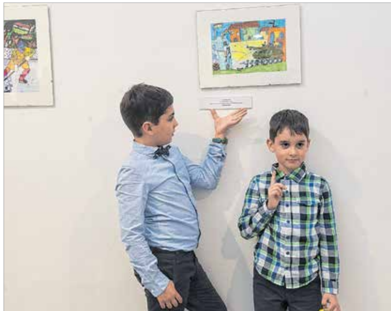
Kis alkotók és műveik