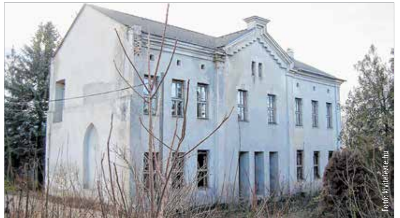
...és ez maradt Ybl nagyhörcsöki munkájából

nem látogatható, tehetős gazdára és felújításra vár. Ma is izgalmas parkját érdemes körbejárni! Főleg tavasz táján jó elsétálni a Ludovika-forráshoz. Térdig margarétában, vadvirágban gázolni a több hektáros területen, az összegömbölyödött köveken napozó siklók között pipiskedve. A kastéllal átellenben, az utca túlsó partján, a Nádor- és Malom-csatorna mentén beléphetünk a fácános és a vadaskert világába, a messze földön híres vadászpáradicsomba, ahol még ma is ropognak a vadászpuskák. Soponya megőrizte nekünk főúri miliójét.