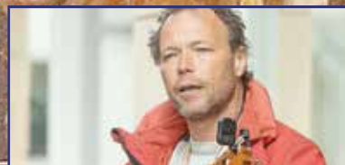
Mindegy, csak húrja legyen! 18. oldal