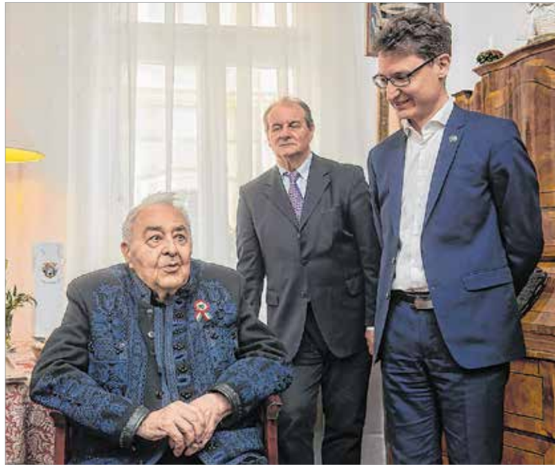
Tiszteletadás a választói legendának