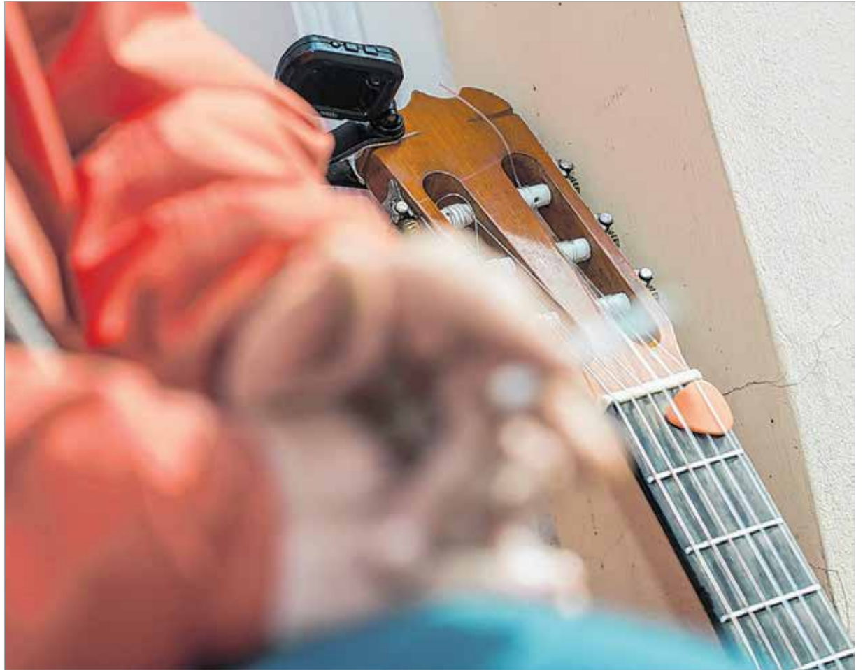
A zenész és a gitár is alkotói szüneten

Szolnokon játszottam éppen, amikor odajött hozzám egy fiatalasszony, a babakocsiban egy fél év körüli babával. „Elénekelné nekem a flórás dalt?” – kérdezte. Ez egy József Attila-vers Sebő Ferenc feldolgozásában. „Perse” – mondtam, és elénekeltem neki. Végigpityeregte az egésztest... Amikor befejeztem, megköszönte, majd elmesélte, hogy egy évvel korábban a férjével együtt hallgattak engem, akkor meg várandósan. Annyira megtetszett nekik a dalom, hogy a kislány neve ezért lett Flóra. Ennél szebb ajándékot nem is kaphattam volna. Kaposváron pedig egyszer leült velem szemben egy kislány a padra. Harmadikos lehetett: levette az iskolatáskáját, kivette belőle a tolltartót, és mivel hideg, novemberi nap volt, az iskola-