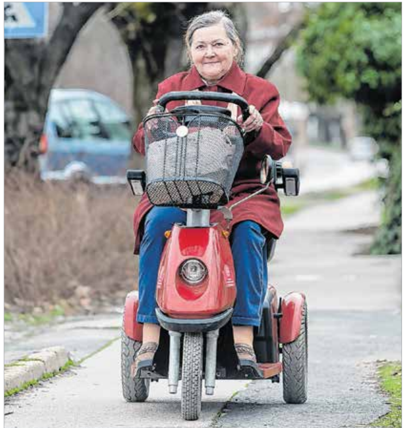
Az elektromoped megkönnyíti a mindennapokat