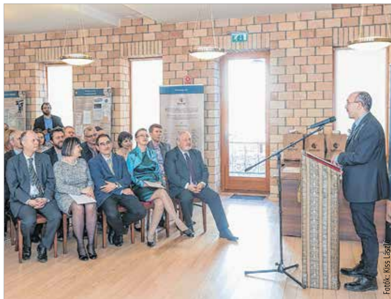
Az adatok és érdekességek gyűjteménye az ország összes levéltárának közös munkája

miközben párhuzamot vontak a magyar történelem fontos eseményeivel. A kiállítás létrehozói olyan személyeket, helyszíneket és eseményeket választottak vezérfonalnak, amik önmaguknál többet jelentenek, szimbolikusak és meghatároztak egy-egy korszakot, ugyanakkor a teljes anyagban egykeztek tematikus egységbe