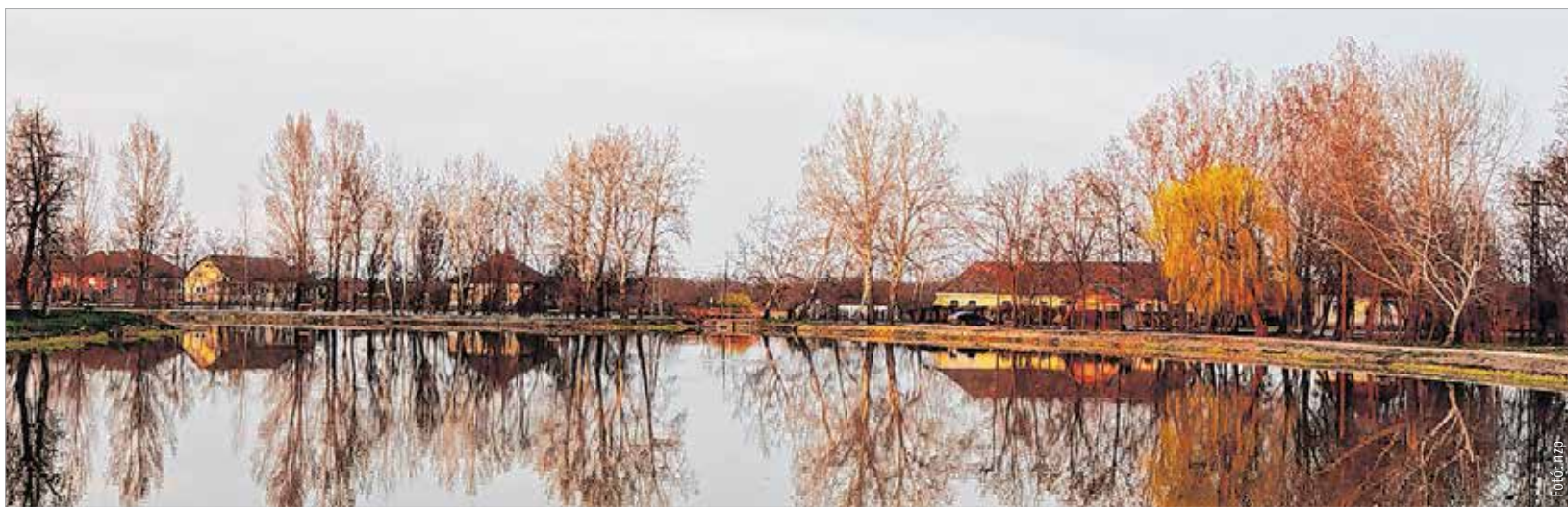
A kastély bejáratától napnyugtakor ilyen a kilátás az egykor ékes díszként tündökölt tóra, melynek környezetét szépen kialakították a soponyaiak