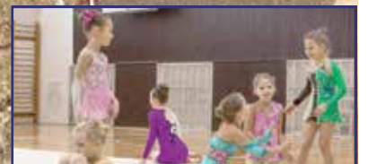
Nagy lépések előre 29. oldal