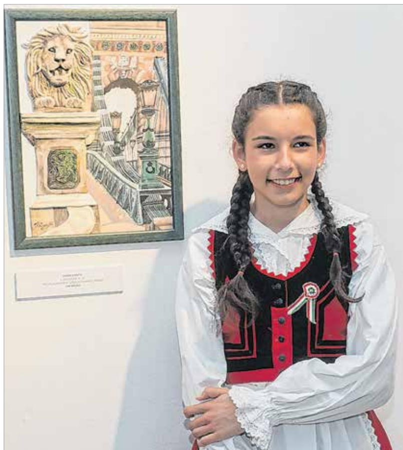
A határon túról is érkeztek nevezések