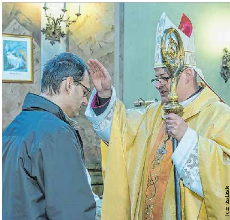
Az áldás az Isten útját követő Szent Józsefre emlékezett