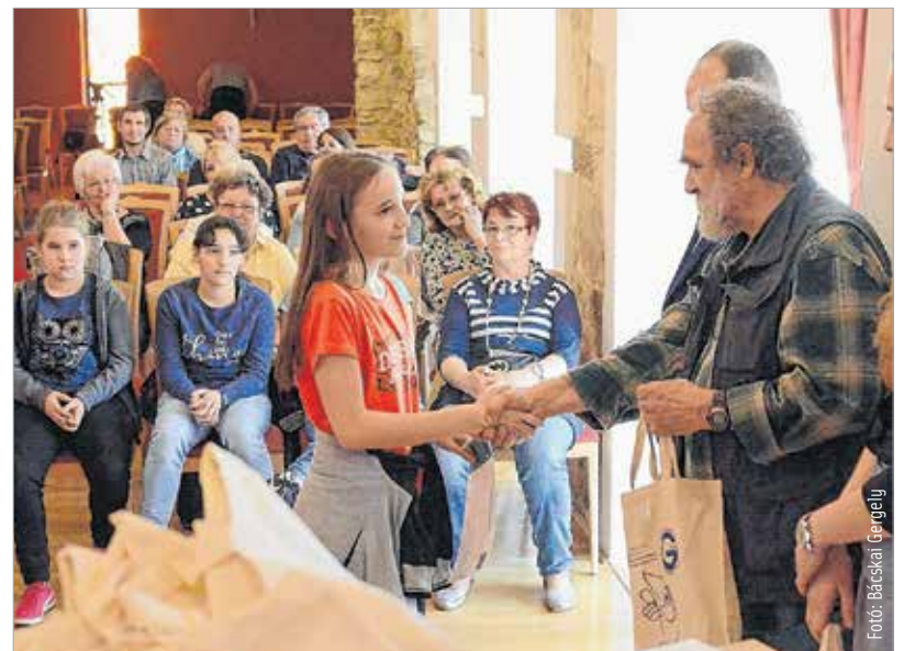
A Denso Gyártó Magyarország Kft. a felszámolási munkákban, jutalmak vásárlásában, a Depónia Kft. a hulladék-elhelyezési és szállítási költségek támogatásában vállalt jelentős szerepet. A Földművelésügyi Minisztérium, a Nemzeti Együttműködési Alap és Székesfehérvár önkormányzata a szervezési, felszámolási, értékelési munkálatokat segítette.

ba. 2016-ban közel 410 köbméter illegális hulladékot számolt fel több tucat cég, iskola és civilszervezet. Ha kiszámoljuk, hogy egy köbméter hulladék különböző helyekről történő összegyűjtése, konténerbe, tehergépkocsira felrakása, szállítása, legális elhelyezése tizenöt-húsz ezer forintot is kitéhet, megbecsülhető, hogy az önkéntes közösségek munkája 2016-ban a hat-hét millió forintot is elérte.