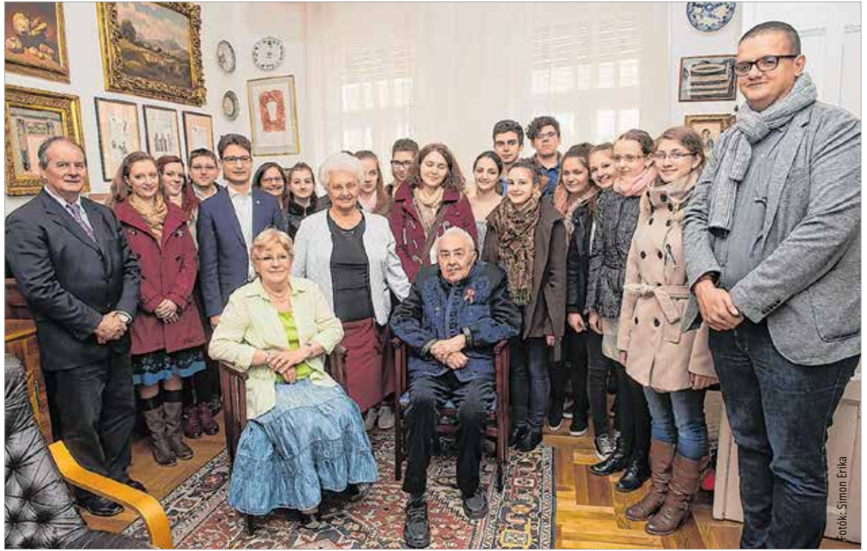
Együtt a népi kultúrát gondozók nagy családja

A Székesfehérvárhoz több szálal kötődő Kallós Zoltánt a város korábbi és jelenlegi polgármestere, Balsay István és Cser-Palkovics András, fehérvári barátai, a Hermann népzene tanszakának pedagógusai valamint növendékei köszöntötték. Cser-Palkovics András polgármester úgy fogalmazott, a díj a legjobb helyre került, és Székesfehérvár is tiszteleg Kallós Zoltán szakmai és emberi nagysága, évszázadon átívelő néprajzkutatói munkája előtt. Nagy öröm számunkra – mondta – hogy az ünnep után elsőként városunkban gratulálhatunk Zoli bácsinak, majd átadta a város ajándékát: egy festményt, melyen a székesfehérvári bazilika melletti tér látható. A fiatalok, Vakler Anna és Enyedi