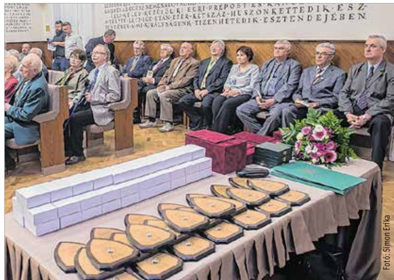
Az ünnepségen a résztvevők értékelték az elmúlt ötven évet, elismeréseket és emlékérmeket adtak át

és 95 éves egykori katonatiszt is van a tagok közt. A szervezet célja az alapítás óta változatlan: a nyugállományú katonák, tisztek és tiszthelyettesek összefogása, a közösség összetartása különböző programok segítségével – és a kapcsolattartás az egykori katonák családjával. Az évforduló kapcsán a színpadi programon túl több emlékérmét és plakettet is kiosztottak azon tagoknak, akik több évtizede részesei a klub mindennapjainak.