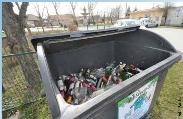
A hulladékgyűjtő edények oldalán elhelyezett matrica megmutatja, hova kell dobni a tisztára mosott üvegeket

Ahogy hazánkban, úgy Székesfehérváron is az elkülönítetten gyűjtött hulladékok közül a csomagolási üveghulladék gyűjtése okozhat problémát a környezettudatos lakosok számára. Ennek oka, hogy az üveghulladék nem gyűjthető házhoz menő rendszerben, így marad a szigetes gyűjtési megoldás, ami kevésbé kényelmes. Visszatérő kérdés a kétkukás gyűjtés esetén, hogy a szelektív új kukába mi kerülhet és mi nem. A gyűjtés a hasznosítható csomagolási hulladékokra irányul, mely a lakosságnál keletkező hulladéknak jelentős hányadát képezi. Tekintettel arra, hogy a szelektív anyagok kézi válogatáson esnek át, az üveghulladék nem helyezhető a kék kukába. A tavalyi év végén több helyszínrre helyeztek a szakemberek