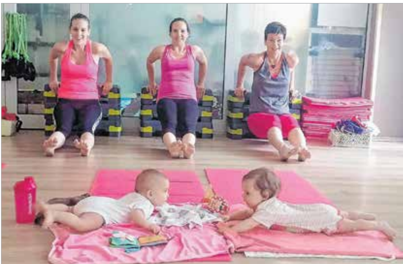
A babák ismerkednek egymással, amíg az anyukák edzenek

A fogyáshoz persze nemcsak mozgás szükséges, hanem megfelelő étrend is. Így legközelebb mi másról is ejthetnénk majd szót, mint a helyes táplálkozásról! És elővesszük a súlyzókat is, vagyis: diétára fel, vasakat elő!