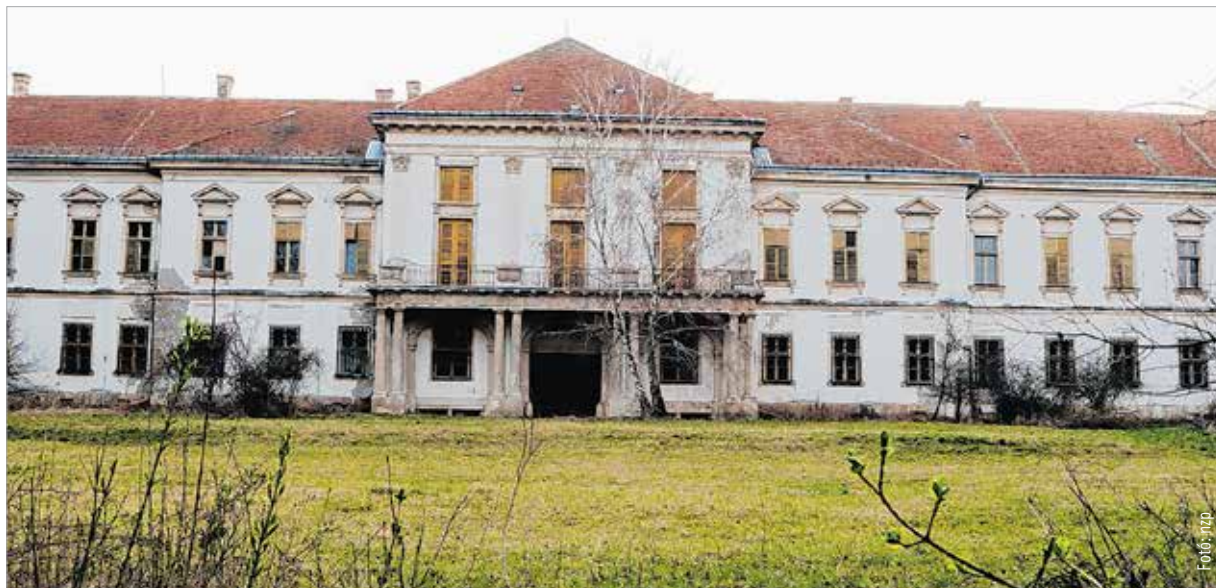
A szocializmus éveiben gyermekotthonként működtetett épület ma jobb sorsot érdemelne, egyelőre tulajdonos és felújító nélkül csak romlik az állapota

A tekintélyes méretű nagylángi-soponyai uradalom a Sárvíz mentén a Zichyek egyik legnagyobb birtokközpontja volt. Zichy II. János teremtette meg az első földszintes, L alakú barokk kúriát az 1700-as évek derekán, melynek jobb szárnya ma is áll. A kúriából egy emberöltővel később U alakú földszintes kastély kerekedett francia barokk kerttel körülvéve, majd Pollack Mihály tervei alapján ebből nőtte ki magát a kastély mai emeletes, klasszicista épülete, és gyönyörű angol parkot kapott üvegházzal, monogramos kőhidas patakkal, Ludovika-forrással, harminchat hektár hímes réttel.