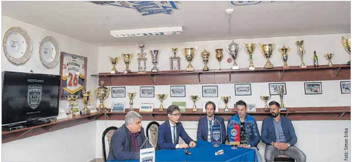
A serlegek mutatják, milyen komoly örökséget vesz át az új vezetés