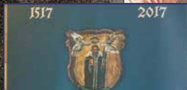
Vissza a forrásokhoz! 12. oldal