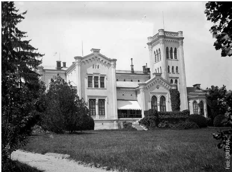
A nagyhörcsöki Zichy-kastély így festett fénykorában...

gazdája a hatalmas nagylángi-soponyai birtok jövendő örököse.