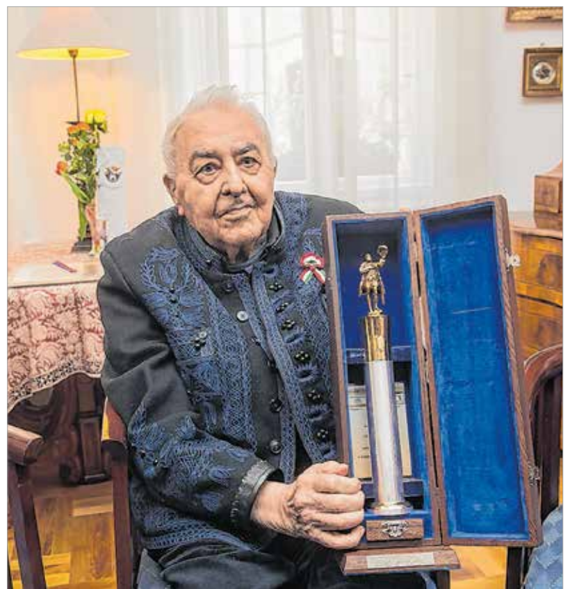
Kallós Zoltán a legmagasabb állami kitüntetést kapta a nemzeti ünnepen

zetes nyelvi kultúrából is. A kutatók sokáig elkerülték a Mezőséget, mind szellemi, mind tárgyi vonatkozásban, hiszen elfogadták, hogy ez a terület már szórványvidék. Ez megváltozott, de még nagyon sok találkozásra van szükség, mire célt érnek a segítők. Nincs különbség, a fontos, hogy tegyenek az ősi, magyar kultúra megőrzéséért.”