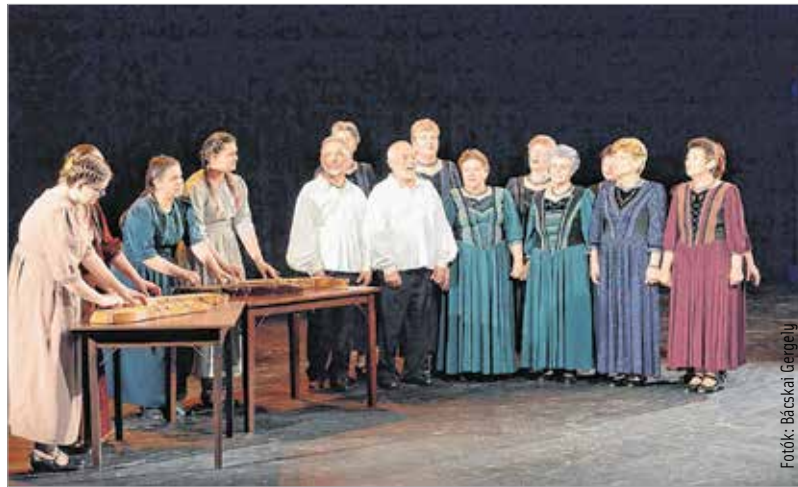
Énekszóval a legjobbak között

A több mint két évtizedes múltra visszatekintő, hagyományos versenysorozat záró eseményének ezúttal is a Vörösmarty Színház adott otthont. Cser-Palkovics András polgármester köszöntőjében úgy fogalmazott, a rendezvény egyszerre szép, ünneplés és tiszteletreméltó: „Ünnepélyes, hiszen itt vagyunk a színházban, kulturális programok következnek, nagyon sok szép dolog fog elhangozni. Tiszteletre méltó pedig azért, mert azok a szervezetek, klubok, baráti társaságok, melyek megmutatkoznak, régóta és sokat készültek erre a napra.”