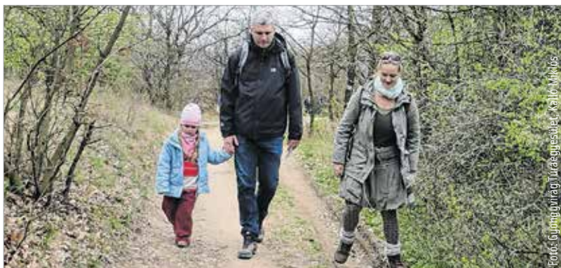
A Nyuszi túrán a legkisebbek is róják a kilométereket

megadott kilométert kell teljesíteni, amiben némi szintkülönbség is van. Az itt résztvevők között is akadnak bőven nyugdíjasok! Az idősebbekkel azért külön öröm túrázni, mert hatalmas példát jelent, hogy még hetven felett is úgy mennek, mint a nyúl!”