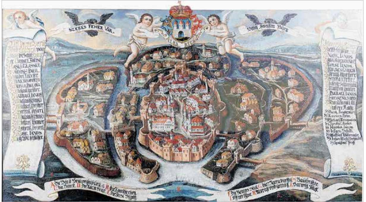
Bár soha nem volt ilyen a város, de erről a nézeti térképről jól kiderül, hogy az 18. század elején Székesfehérvár a vizek és szigetek városa volt

Lássuk a történelmét ennek a csatornának! A középkori királyi Székesfehérvár nagyon más képet mutatott a maihoz képest, és ez nemcsak az épületek homlokzatán látszott, hanem a város geológiai adottságain is. Európai léptékű királyi város nem emelkedett olyan helyen, ahol hiányzott a víz, így volt ez itt is. A köves, sziklás hegységek stabil fundamentumot kínálnak az épületeknek, ám a gyéren csörgedező patakok, források képtelenek egy fél százeres középkori várost kiszolgálni. Vízgűjtő helyre volt szüksége a honfoglaló magyaroknak is, ahol várost alapíthattak. Géza nagyfejedelem nem véletlenül választotta a Bakony, a Vértes és a Velencei-hegység lábainál elterülő mocsaras, vízben dúsuló területet. A láp, a víz védelmet nyújtott a toladókó népek ellen, miközben a lakosság kimeríthetetlennek tűnő vízkészlethez juthatott. A városok oltalmi rendszerének fejlődésével