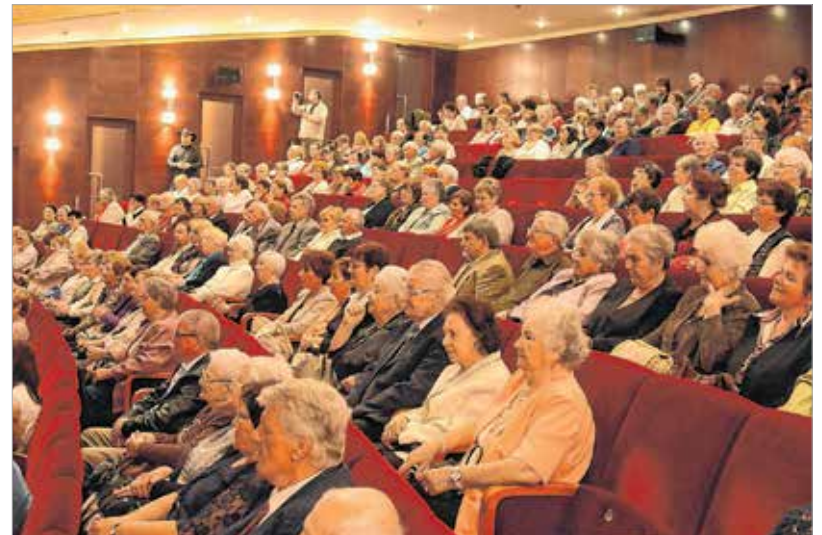
A nézők között versenyzők is ültek