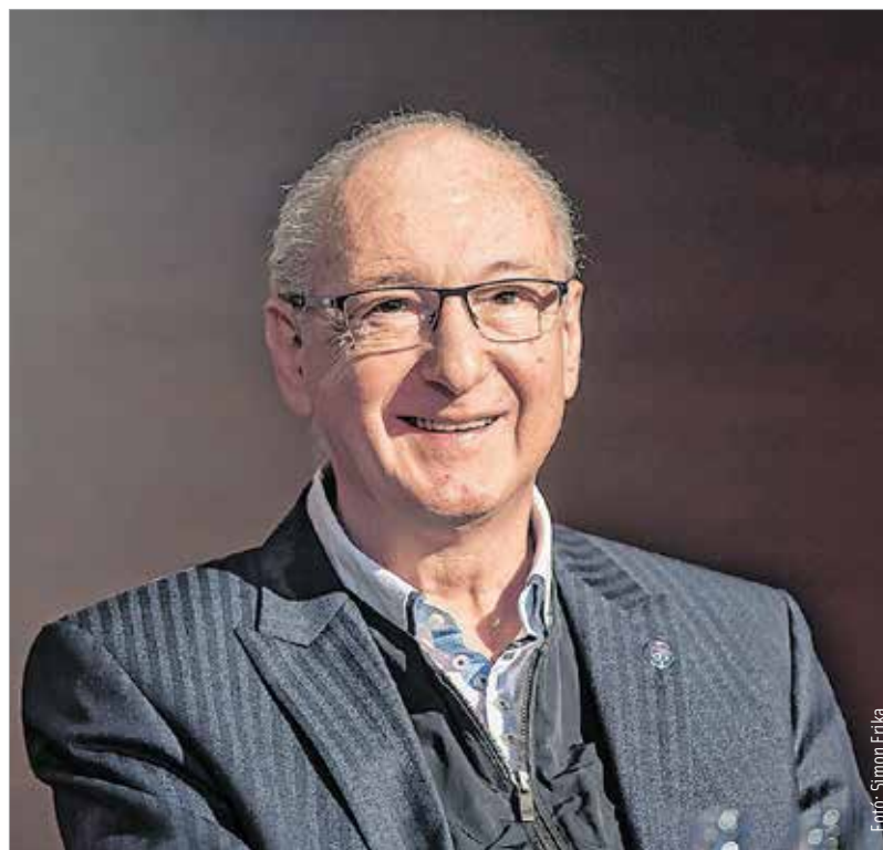
Az újraavasztott igazgató megbízatása 2022. júliusáig tart

találkozó keretében filmes, táncos, zenész- és színészpálinkák töltenének néhány napot a városban, és