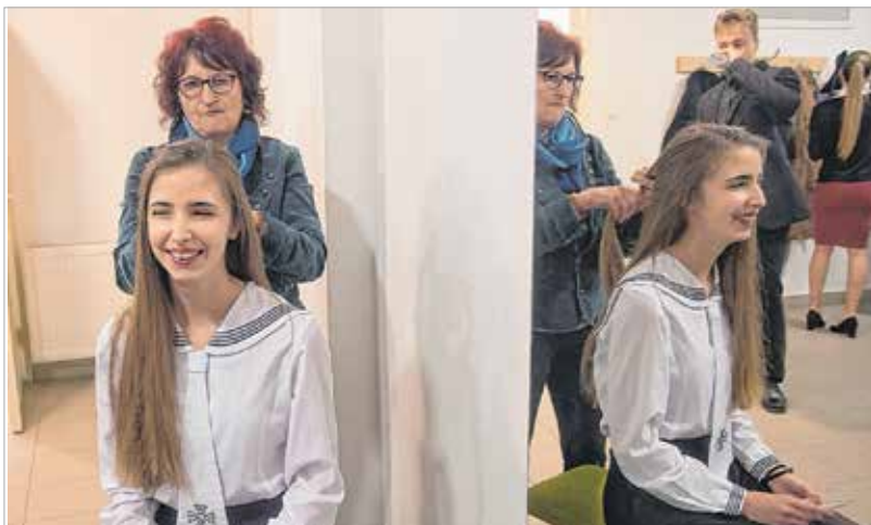
A felkészüléshez a szépítkezés is hozzátartozik

újra a már nem először színpadra lépő versmondókat: „A régiékről nagyon jó híreket hallottam tavaly óta, arról, hogyan vesznek részt a város