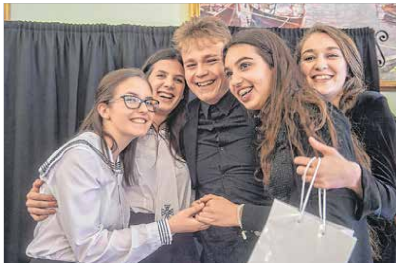
Az eredményhirdetés sokaknak volt örömmünep

életében, emelik a művészet tekintélyét versmondás terén is.” A versválasztás tekintetében egyre szélesedő palettának is őszintén örült: „Jó látni, hogy