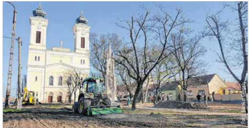
Hamarosan a Szent Sebestyén-templom előtt is zöldbe borul a tér

Kiemelte, hogy a téren – a városban is egyedülálló módon – kézzel öntött, egyedi tərbütorok lesznek, melyek a napokban készülnek el egy fehérvári öntödében. A padok mellett a húszállásos biciklitároló és a táblák is egyedi öntöttvas remekek lesznek. A parkban virágágyások is készülnek egyenári és kétynári beültetéssel több helyen, összesen mintegy kétszáz négyzetméteren. Cserjeágyások öt helyen lesznek a parkban egyenként ötven négyzetméteren, a tizenhét fa pedig Korai juhar és Krimi hárs lesz. Fűvesítést összesen kétezer-hatszáz négyzetméteren végeznek a szakemberek.