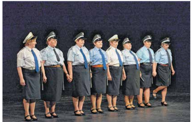
Egy hónapig gyakorolt koreográfia és saját kezűleg varrt fellépőruha