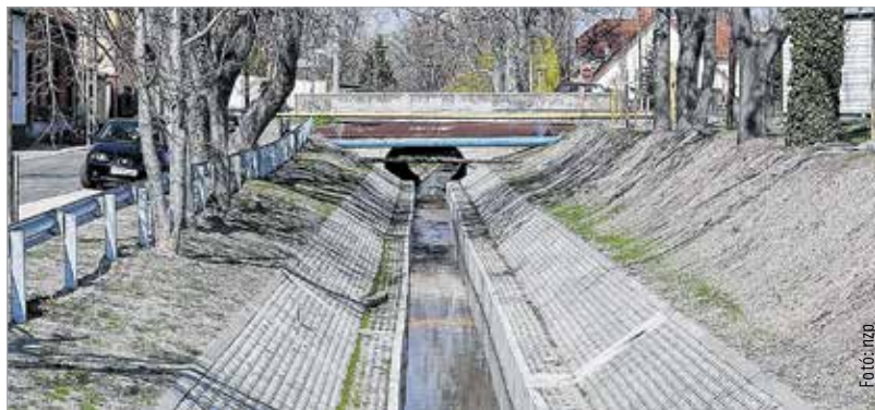
A Varga-csatornának mára csak vízelvezető szerepe maradt, ezért esztétikai megújulása megnagytartja az erre járók szemét

Székesfehérvár várát is úgy építették, hogy azt legkívül a vizes területek, ingoványok védték, majd a vizekkel határolt városi szigetek, legbelül pedig a királyi palotát védő várfal adott oltalmat. A magyar koronázóváros ilyen vízgűjtőhely közepébe épült. Kő- és fahidakkal elválasztott szárazfölkök alkották, ahol a vizek pótlását a környező három hegység biztosította. A Rákóczi-szabadságharcot követően a várak ilyen forma védelmére nem volt szükség, mert elavult, így már gondot okozott a sok víz. A török távozásával elindult az iparosítás, aminek következtében egyre nagyobb száraz területekre volt szükség a városon belül – hallhattuk a történésztől. Demeter Zsófia jelezte, hogy a mai életünkben is visszaköszön a vízzel való küzdelem, hiszen élnek sokan közöttünk, akik még látták a Tóvárosban történt gigantikus építkezéseket, ahol hatalmas munkagépek helyeztek el