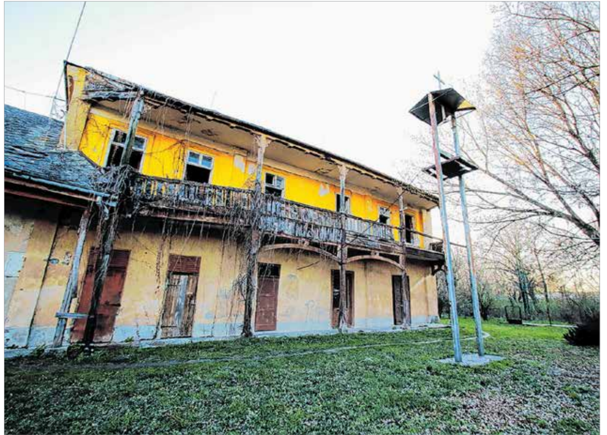
Az öreg épület bal szárnya már ebek harmincadján van, utoljára templomként használta a település, ezért áll a harangláb az épület előtt

Székesfehérvár határában a török hódoltság idején elnéptelenedett Kér és Ság nevű települések lassan éledtek. A Zichy család már a török kiűzése előtti években, 1650-ben megjelent a településen. Az uradalmat egy családi birtokmegosztás során a tehető, 62 úrbéri birtokkal rendelkező Zichy Ferenc főpohárnokmester kapta meg. A néhány majorságból, a Zichy család kúriájából, gazdaságából álló területen fia, Zichy Edmund gróf alapította meg Zichyfalvát, Sárszentmihály elődjét. Miközben a családban Seregélyesen, Soponyán, Kálozon az akkor friss klasszicista stílus jegyében hatalmas kastélyépítések folytak, a sárszentmihályi ág a fatornácos ősi kúriáját bővítette. A katonából császári és királyi kamarássá fejlődött, jeles vállalkozásokban kiváló közgazdasági tevékenységet kifejtő Edmund gróf Bécsnek tekintette igazi életterének. Vagyonát hivalkodó sárszentmihályi kastélyépítés helyett a monarchiaszerte csodált bécsi műgyűjteményébe fektette. „Az ország művészet nélkül olyan, mind a kert virág nélkül.”