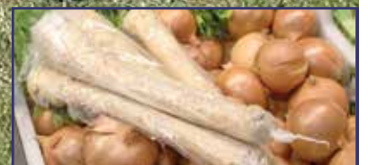
Annyiba kerül idén is a húsvét, mint tavaly 18. oldal