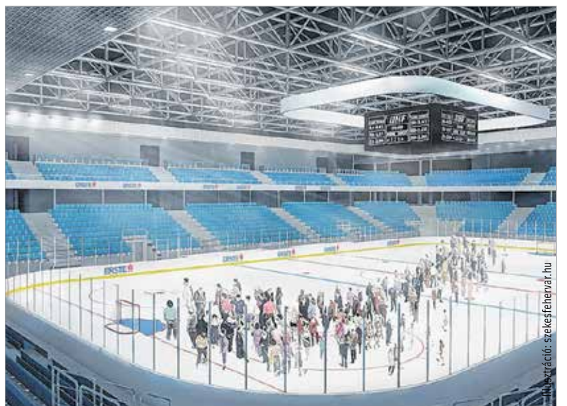
Az Alba Arénában új otthonra találnak majd a hokisok, de sok egyéb funkciója is lesz a csarnoknak

szakaszához érkezett a beruházás: a Kormányhivatal arról tájékoztatta Székesfehérvár önkormányzatát, hogy jogerőre emelkedett az Alba Aréna terveinek engedélye. A következő lépés a kiviteli tervek elkészítése, majd a szükséges közbeszerzési eljárások keretében a kivitelezők kiválasztása lesz. A munkaterület-átadásra és a kivitelezés megkezdésére ezt követően kerül sor. A tervek szerint 2019 őszétől már mérkőzéseknek és rendezvényeknek adhat otthont az Alba Aréna.