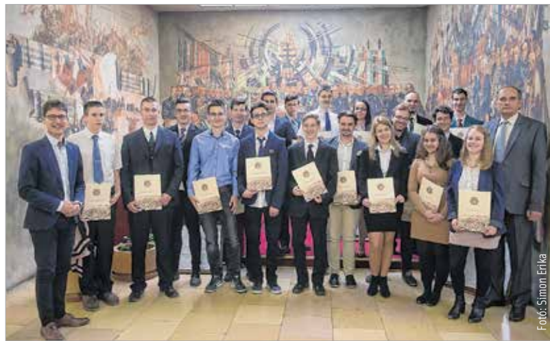
Tizenhat középiskolás és tizenkét egyetemista részesül tanulmányi ösztöndíjban

családok támogatása és a diákok városunkban tartása. A pályázatot nyert középiskolások mindegyike a Székesfehérvári Szakképzési Centrum diákja, az ösztöndíjban részesülő egyetemisták pedig az Óbudai Egyetem és a Budapesti Corvinus Egyetem székesfehérvári campusának hallgatói közül kerültek ki kiemelkedő tanulmányi átlaguk alapján. Az ünnepségen Cser-Palkovics András megköszönte a bírálóbizottság munkáját, valamint hangsúlyozta: bízik benne, hogy a diákok tanulmányaik végeztével városunkban helyezkednek majd el.