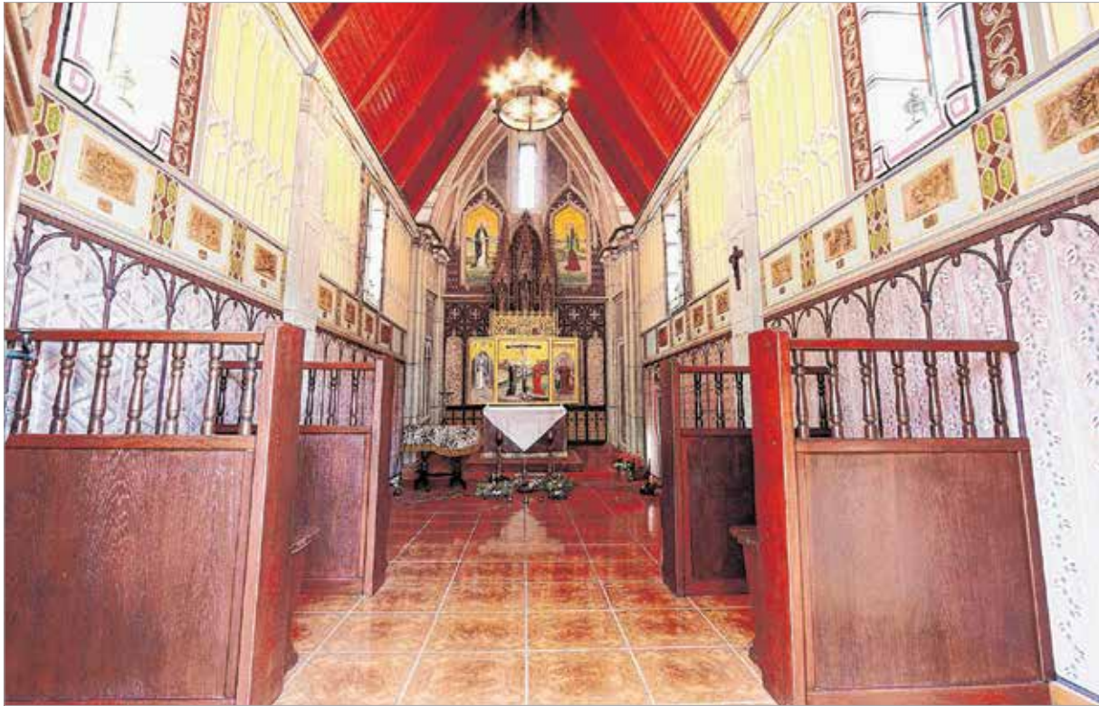
A kápolna belsejét jelenlegi tulajdonosa szépen felújította, mert mint mondta: csak a balga ember feledkezik meg Istenről

kellett cserélnie édesanya melletti hálószobáját a vendég írózóval, a szobalányok pikáns célozgatásairól, más hallomásokról és vallomásokról, végül a gróf úrtól kapott hálapénzekről is.