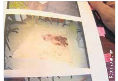
Ebbe az ágyruhába csavarva találták meg a csecsemőt húsz évvel ezelőtt

Egy guberáló bukkant rá az újszülött holttestére húsz évvel ezelőtt. A csecsemőt paplanba csomagolva egy szatyorban találták meg. A kislány szájába gyerekzoknit tömtek, és egy zsinórt tekertek a nyakára. A húsz évvel ezelőtti nyomozás során gyanúba keveredett egy fiatal lány, akiről többen is feltételezték, hogy terhes, de az orvos akkor tisztázta őt – nyilatkozta korábban lapunknak Papi Koppány rendőrőrnagy, a megyei rendőrség főnyomozója: „Akkor már felmerült a mostani gyanúsított neve, volt rávallás, hogy terhes lehetett, azonban az orvos őt kizárta, azt mondta, hogy volt nála vizsgálaton, és szülésre utaló jeleket nem talált.” Mégis ez a vizsgálat adta az ügyben a fordulópontot. A későbbi szakértői vélemény szerint ugyanis a szülésre utaló jelek nem szembevetőek akkor, ha a vizsgált nőnek nem az volt az első szülése. A nyomozók pedig a csecsemő szájába tömött gyerekzokni miatt azt