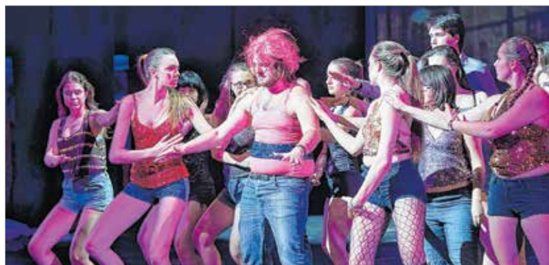
Az alapmű megannyi huszonegyedik századi, megvalósításra érdemes ötletre épülő előadást hozott