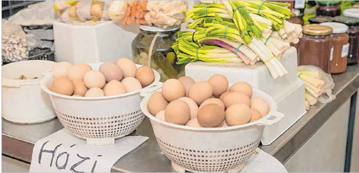
Házi tojás újhagymával. Kell ennél több?

vagy a bejárat elé „házórzőnek”. Húsvétig alig több mint egy hét van, így aki még nem kezdte el a készülődést, annak érdemes ellátogatni valamelyik fehérvári piacra. A következő héten talán az árak sem mennek feljebb.