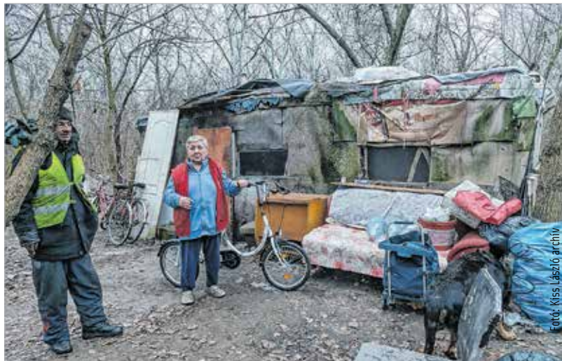
Fehérváron több mint százan élnek az utcán, az erdőben

A jubileumi év tiszteletére sajtókiállítást is nyitottak, ahol az intézmény elmúlt huszonöt évét bemutató cikkeket gyűjtötték össze.