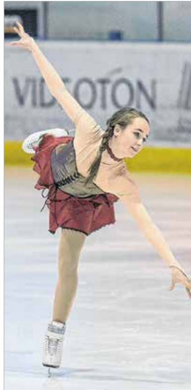
Amerikai, dél-koreai, horvát, olasz, szlovák, szlovén, szerb és magyar versenyzők léptek jégre