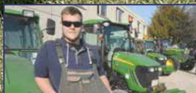
Gyakrabban nyírják az idén a füvet 5. oldal