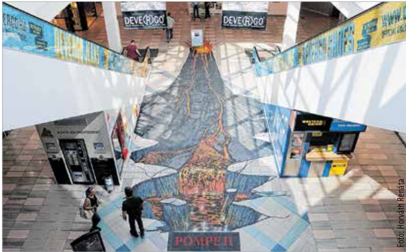
A festményen egy pontból nézve az egész vulkánkitörés három dimenziós képe látszik. A Neopaint Works alkotói egy egész napon át a kép elkészítésén dolgoztak.

ba illetve a régészeti parkba csábítani, akik eddig nem voltak rendszeres látogatói az intézménynek. Gorsium látogatóközpontjában több mint egy hete tekinthető meg a Pompeji – Élet és halál a Vezúv árnyékában című tárlat. A kiállítás bemutatja az egykor virágzó város katasztrófáját, az ott élt emberek életét, mindennapjait, szokásait, a gladiátorok világát. A kiállítás törzsanyaga a romváros feltárasának anyagát őrző Nápolyi Régészeti Múzeumból érkezett Magyarországra.