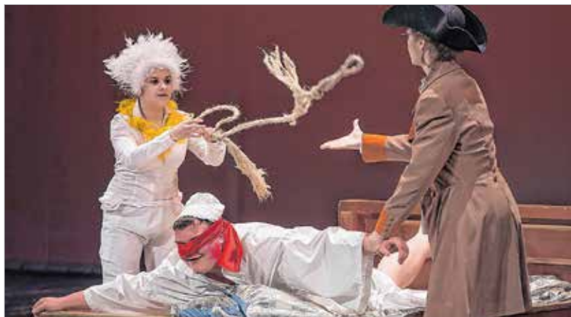
Háromszor adja Lúdas Matyi vissza!