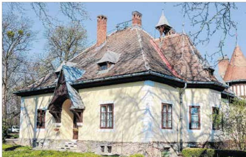
A kastély hajdani melléképületét is felújították. A harangtoronyában lakó kis harang hívta egykor a grófi családot ebédre.

barátságban lévő Tormay Cécile a másodfokú ítélet után rágalmazásért, hamis tanúzásra felbujtásért és hamis tanúzásért feljelentést tettek a bontásban résztvevők ellen. A feljelentés alapján meginduló büntetőeljárásban a bíróság ismét lefolytatta az alapos és széles körű bizonyítási eljárást, ezen túlmenően elrendelték Tormay Cécile testi orvosszakértői vizsgálatát is. A büntetőper végén az elsőfokú büntetőbíróság rágalmazásnak ítélte a nyilvánvalót, és elmarasztalta Rafael grófit a tanúval együtt. A kiszabott büntetés másfél évnyi börtönbüntetésre kerekedett, és bőséggel mérte a büntetést a tanúkkal szemben is. A másodfokú büntetőbíróság a gróf büntetését tíz hónap börtönre enyhítette. Végül a Királyi Kúria a büntetést tizennyolc napi