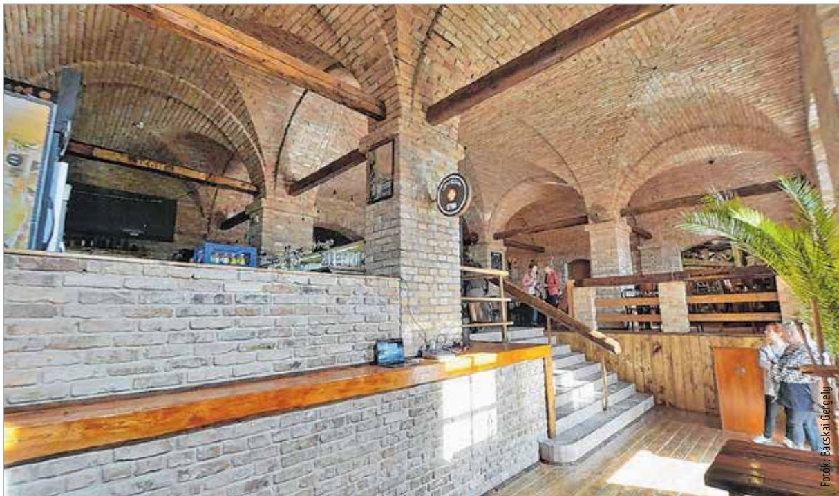
A klub boltíves belső tere

A nyitónapon a közönség egy közvetlen beszélgetés keretében belül jobban megismerhette Gundel Takács Gáborral. A népszerű tévés személyiség munkásságáról, pályafutásáról és fehérvári kötődéséről mesélt a vendégeknél: „A feleségem családja fehérvári, így elő szoktunk