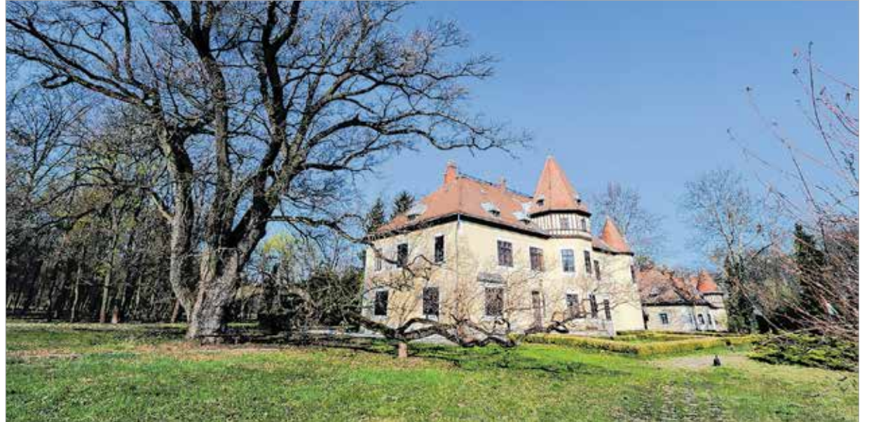
A kastély és a sok mindent látott 226 esztendő Quercus robur, azaz kocsányos tölgyfa

A magyar jogrend a válás intézményét csak 1895-től ismerte el. Az ezt követő huszonöt évben nem vált még gyakorlattá a házasság megszüntésének ezen módja az arisztokrácia számára. Korábban az egyházak döntöttek a válások ügyében. Pallavicini Edina hallani sem akart a válásról. Hitéletével összeegyeztethetetlen volt a „felbonthatatlan szentségi házasság” kötelekének elszakítása. Talán nemcsak ezért