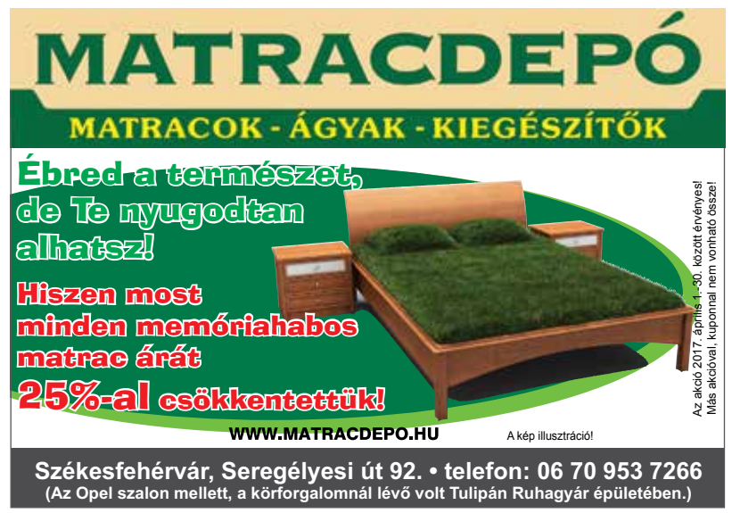
Az akció 2017. április 1-30. között érvényes! Más akcióval, kuponnal nem vonható össze!