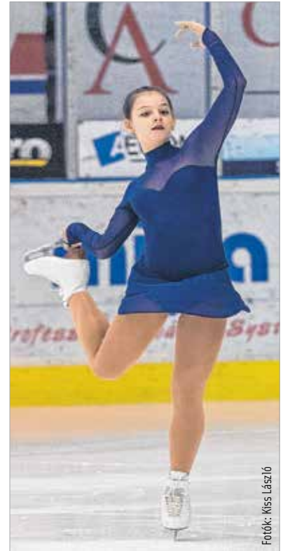
A teljes magyar utánpótlásmezőny képviseltette magát az Ifjabb Ocskay Gábor Jégcsarnokban