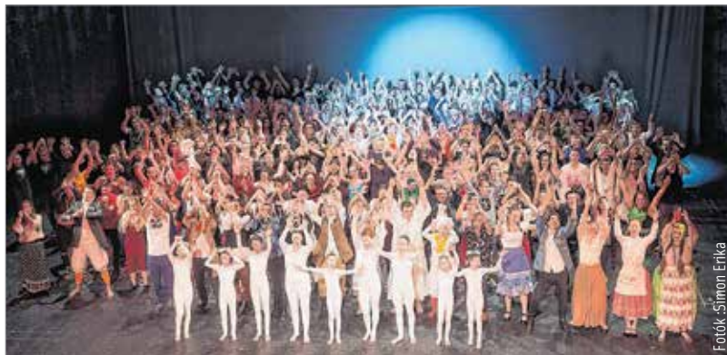
Együtt a fellépő tizenegy iskola

Döntésük alapján a legjobb diákszínpados előadás díját a Teleki Blanka Gimnázium és a Ciszterci Szent István Gimnázium kapta. A zsűrielnök különdíjában az Arany János Általános Iskola, Speciális Szakiskola és EGYMI részesült.