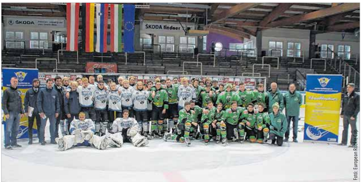
A villachi selejtezőben az ellenfeleknek volt megtiszteltetés a közös kép

„A hazai rendezésű döntőre még dolgozunk a játékon, legfőképpen a helyzetkihasználáson, mert hiába hajtanak keményen a srácok, ezt a játékot gólrá játsszák. Gólok nélkül nem leszünk eredményesek!” – summázta a selejtező történéseit a vezetőedző. A Rookie Cup döntőjét április 20. és 23. között rendezik majd Székesfehérváron.