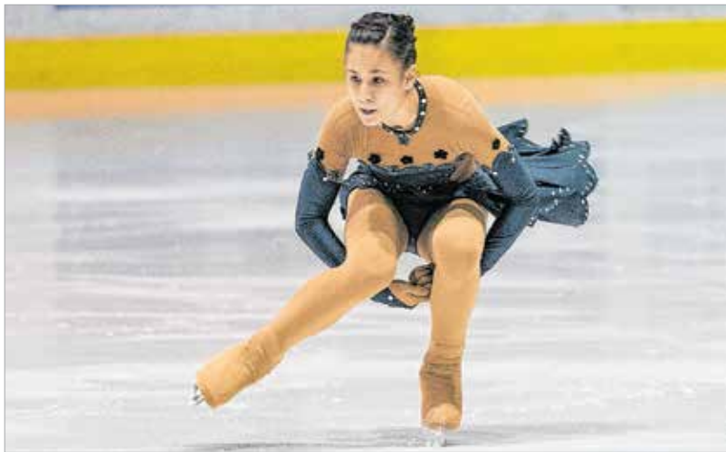
A Jégmadár kupán való részvétel már önmagában is rangot jelent

A Jégmadár Műkorcsolya-egyesületnek huszonöt igazolt versenyzője van, és mintegy hatvanfős utánpótlásbázist épített ki. A közel százfős csapatban egyetlen fiú van.