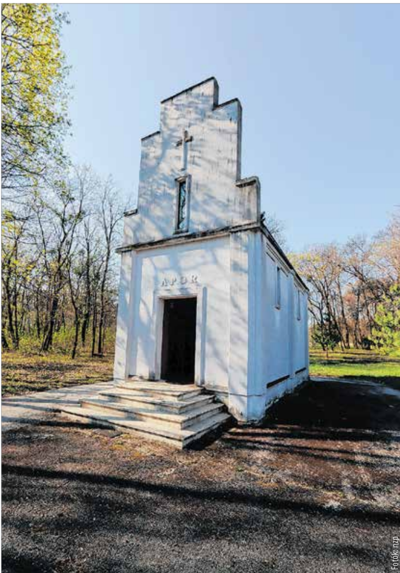
Az Apor-kápolna az imádságok helyszíne volt, amit elég ritkán használtak a grófi család szülei