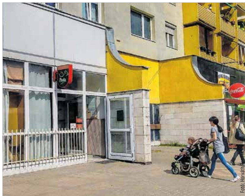
Hamarosan elbúcsúztathatják a vízivárosi postát a régi hivatal