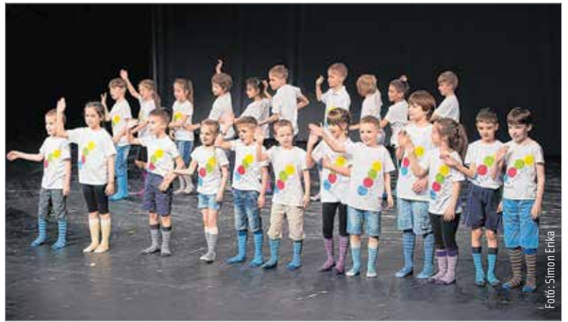
Műfajtól függetlenül övök a jövő!

A dicséret meg is illeti az iskola növendékeit, hiszen nagyívű, színes gálaműsorral bizonyították tehetségüket a zsúfolásig megtelt színházban.