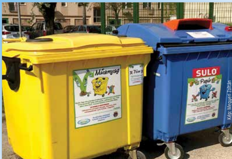
Mostantól „Fém” feliratú matricák hívják fel a figyelmet az együttes gyűjtési módra

„A MŰANYAG szelektív hulladékkal együtt kerül gyűjtésre a FÉM csomagolási hulladék.” – áll a matricákon, melyek mostantól arra hívják fel a figyelmet, hogy a konzervdobozok és alumínium italosdobozok is a sárga konténerekbe dobhatók. A két frakció gyűjtése és szállítása együtt történik, melyet később kiválogatnak és újrahasznosítanak. Százhetven kék, azaz papír-, és két-százharminc sárga, azaz műanyag- és fémhulladék gyűjtésére szolgáló konténer található városzerte. A családi házas övezetben házhoz menő rendszerrel végzi a Depónia a szelektív hulladékgyűjtést, a tömbházas övezetekben pedig