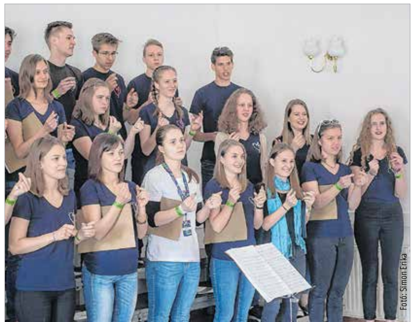
Kodály országában a zene mindenkié