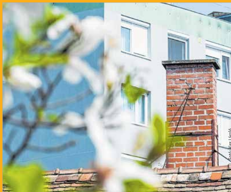
A távfűtés leállítása Fehérváron több mint huszonegyezer lakást és ezer egyéb felhasználót érint

De mi történik akkor, ha napsütést váltja az eső és a hideg? Nem kell kétségbe esni, ugyanis ilyenkor a szolgáltatást újraindítják. Ezért a szakemberek azt kérik, a lakók figyeljék az időjárás-jelentéseket, hiszen látni lehet már előre, hogyan alakul a hőmérséklet, kell-e vagy sem fűtést kérni. Ha a lakóközösség