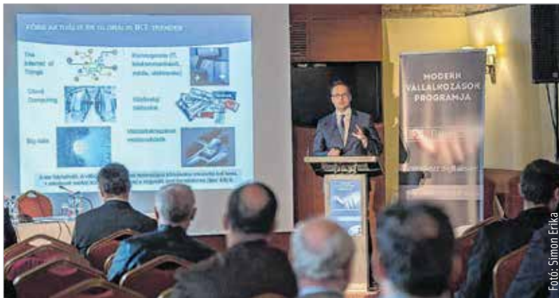
A tanácskozás egy százhuszonhét állomásos országjárás keretében érkezett Székesfehérvárra

A programban eddig több mint tízezer vállalkozást érték el, és több mint háromezren kaptak meg a Digitálisan Felkészült minősítést.