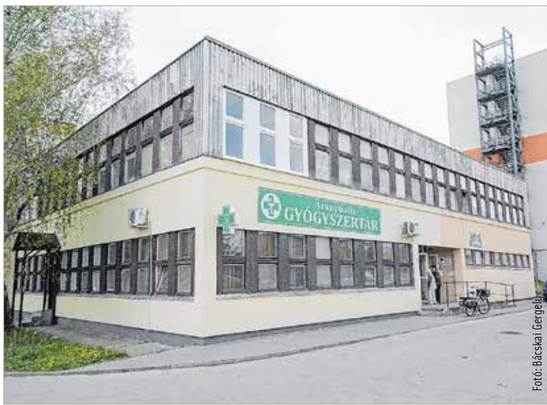
A Verseci utcaival kezdődhet a városi rendelő felújításának sora