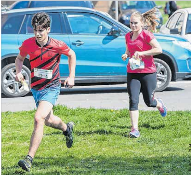
A palotavárosi tavaknál könnyű, a Gaja-szurdokban nehéz terep várt a tájfutókra

A gyerekek kipróbálhatták a labirintusfutást, és a rendezők a