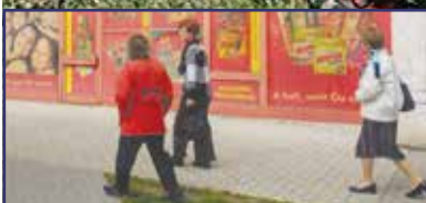
Megoldódhat a vízvárosi posta problémája 2. oldal