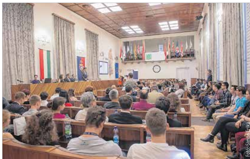
A kétnapos konferencián a jövő volt a tét

Ebben az évben sem kellett győzködni a Nosztalgia Nyugdíjasklub tagjait, hogy vegyenek részt egy kis kert munkában. A klub már 2005 óta tartja rendszerben a bolt környékét, évente többször is kitakarítják a területet. Kedden délelőtt metszettek, gazoltak, gereblyéztek, és nagyon sok szemetet összegyűjtöttek. B. G.