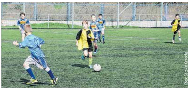
A II. korcsoportos fiúknál fociban a tóvárosiak voltak a legjobbak