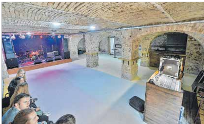
A pinceklubban színpad is helyet kapott