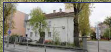
Egymilliárd a rendelőkre 16. oldal