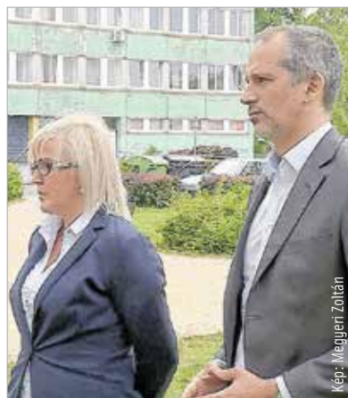
A baloldali képviselők sajtótájékoztatójukat a Gyümölcs utcai kollégium előtt tartották

Az üggyel kapcsolatban megke-restük a fenntartó képviseletét is, aki reakciójában elmondta, hogy csak a kollégiumok vezetéstechnikája kerül összevonásra. Török