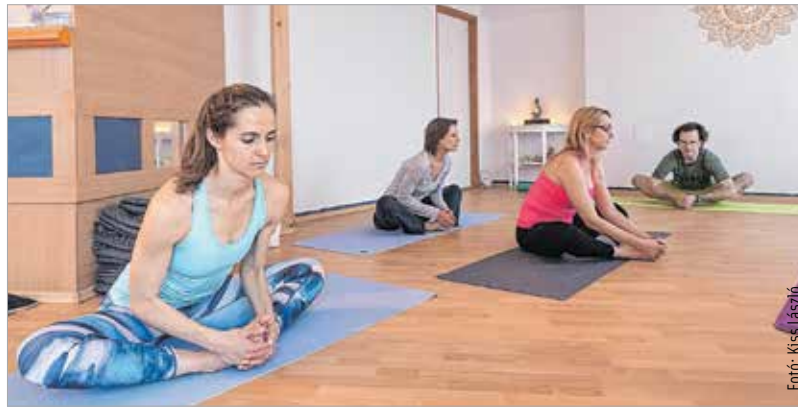
Ez a mozgásforma a koncentrációt is javítja

Aki még sosem próbálta a jógát, elsőre talán csak annyit lát belőle, hogy lassú mozdulatokat, nyújtásokat végeznek illetve nyakatekert pózokat vesznek fel a gyakorlatok során. A mozgásforma számtalan fajtája természetesen különbözőképpen megterhelő, de egyáltalán nem olyan könnyű, mint amilyenek látszik. Komolyan igénybe veszi az izomzatot, és kifejezetten gyógyító hatást tehet a szervezetre. Keretes anyagunkban összegyűjtöttünk és ismertettünk néhány jóga-fajta, így talán könnyebb eldön-