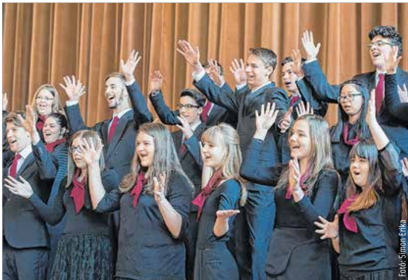
Zenei körökben a jókedv örökletes

métről és Budapestről, míg a fehérvári Kodály iskolát három énekkar képviselte. A vasárnapi zárónapon az énekkarok folklórhangversenye és a „Szállj elő, zöld ág!” című, általános iskolások számára rendezett néptánc-találkozó szerepelt a programban. Ez utóbbin a Kodályból a Bátorkák és a Botladozók nevű csoportok, a Vörösmarty Mihály Általános Iskolából a Csombor, az Alba Regia Alapfokú Művészeti Iskolából a Gabonca, míg a Csitány Emil Művészeti Műhelyből a Szamóca Csoport szerepelt, de szőlőtáncosok is megmutathatták tehetségüket.