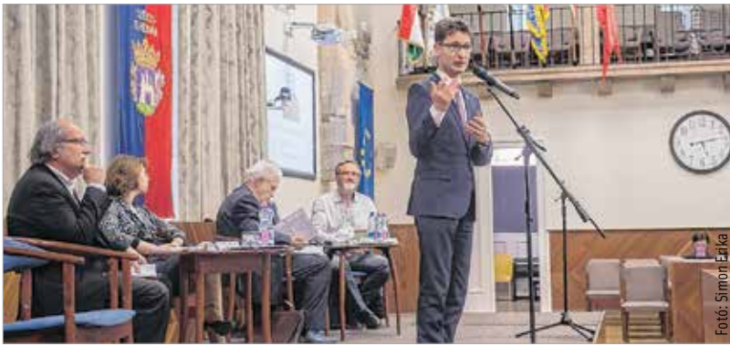
Székesfehérváron otthonra találtak Arany János gondolatai

közelítettek Arany János gazdag hagyatékához: „Örülök, hogy a Vörösmarty Társaság – csatlakozva az Arany János-emlékévkhez – programjai közé iktatott egy emlékülést, és hogy a Városháza Díszterme adhatott otthont a rendezvénynek. Ha valaki, akkor Arany János megérdemli a figyelmet, hogy itt, az ország történelmi fővárosában megmutathassuk, mit jelentett és jelent nemzetének. Tesszük mindezt olyan szakavatott előadókkal, akik felvillanthatják csodálatos életművét.” Az emlékülés végén a résztvevők megtekinthették a költő szülőhelyén, Nagyszalontán forgatott filmet Látrányi Viktória rendezésében, melyben a Fehérvár Média centrum munkatársai az Arany János-kultúrkör emlékeit dolgozták fel a nagyszalontai Arany-emlékmúzeumban.