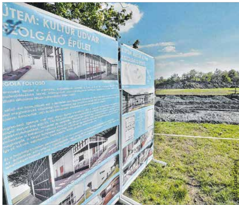
A földmunkák már megkezdődtek a közösségi központ udvarán

valamint a tervek szerint parkolókat, járdákat és utakat újítanak meg még az idei évben.” – tette hozzá a képviselő, aki addig is lakosság türelmét és megértését kéri.