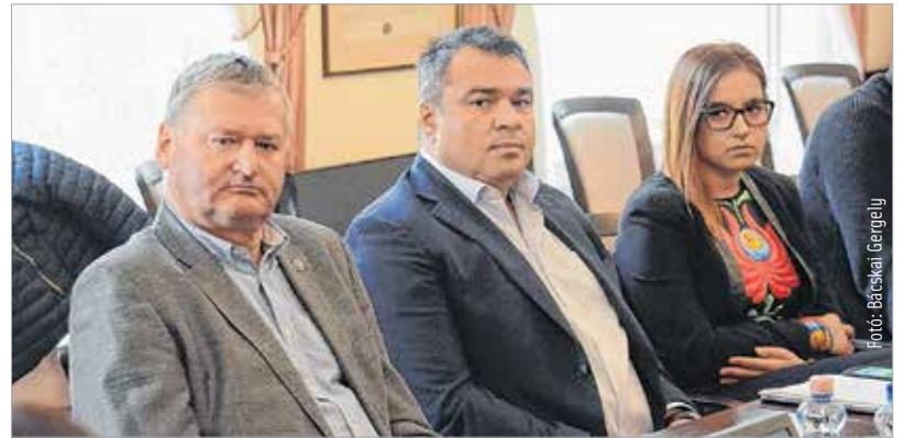
Három budapesti sportvállalat mellett két fehérvári egyesület is kínál gyakorlati helyet a leendő hallgatóknak

bővíteni a képzési lehetőségek számát. Ennek a közös gondolkodásnak az eredménye az, hogy az országban egyedülálló módon szeptemberben városunkban indul el a sportközgazdász mesterképzés. Első helyen huszonhat, az egész program iránt pedig hatvan érdeklődő van – mondta el lapunknak András Krisztina, a Budapesti Corvinus Egyetem tanszékvezető egyetemi docense, aki hozzátette: a sportközgazdász szak elsőként itt Fehérváron duális formában indul el.