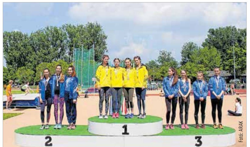
Gyakori látvány: ARAK-csapat a dobogó tetején