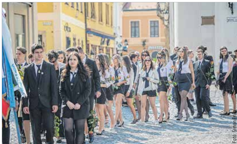
Ünnepélyes menetben, a szélrózsa minden irányából érkeztek ballagók a Városház térre

ünnep az élet rangja, felsőbb értelme”. A diákoktól Luther Márton tanácsaival búcsúzott, aki szerint „a világnak tetsző prédikátor legyen nagy tudományú, szép orgánumú, ékesszóló, szép küllemű, és olyasmit mondjon, amit az emberek szívesen hallanak.” Az Istennek kedves prédikátor viszont „képes