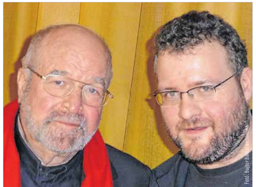
Apa és fia