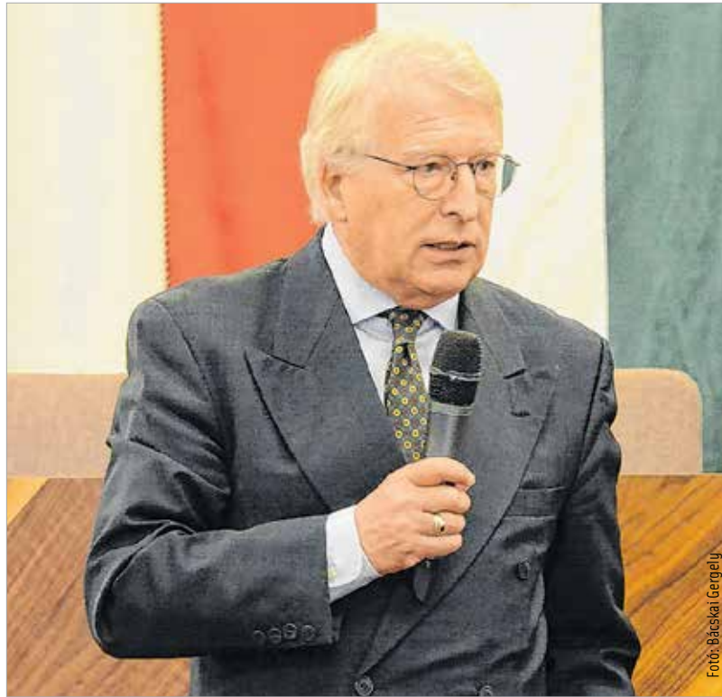
Először ülésezett a Duális Képzési Tanács Székesfehérváron

ötezer álláshelyből csaknem háromezer még mindig betöltetlen.