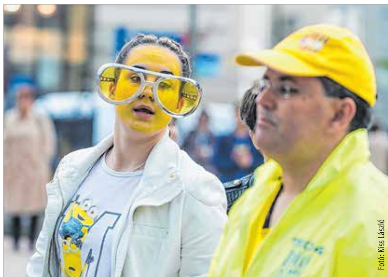
Minél nagyobb a szemüveg, annál többet látni!

tanulója szavalt el Kovács Ákos Azért vagy itt című dalszövegét. Ezt követően Székesfehérvár polgármestere mondott köszönetet a ballagóknak, hogy az elmúlt években fiatalos hangulattal töltötték meg a várost. Azt kívánta, hogy a ballagó diákok találják meg azt az életutat és hivatást, amit szeretnének, és amiben boldogan fogják eltölteni a felnőtt esztendőket. A ballagási műsor a One Day zenekar és az Alba Regia Szimfonikus Zenekar előadásával folytatódott. Josh Groban Mit ér egy hang? című dalát hallgatták meg a résztvevők. Sipos Imre miniszteri biztos felidézte, hogy egykori iskolaigazgatóként a ballagási szerenádokon számos osztályt fogadott a lakásán, és az ünnepi készülődés jegyében írta meg ballagási beszédeit. Elmondta, hogy a beszédírásához sokszor hívta segítségül Márait, akitől azt is megtanulta, hogy „az