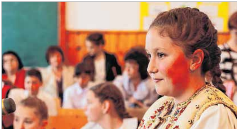
A versmondók többsége viseletben jelent meg, mert szerintük az öltözet támasza a védett, őrzött nyelvnek

A Fehérvár Televízió valamennyi székely versmondó produkcióját bemutatja műsorán és Youtube-csatornáján.