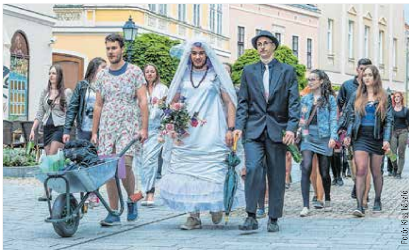
Megnőtt a házasulandók száma a Fő utcán

tanulója szavalt el Kovács Ákos Azért vagy itt című dalszövegét. Ezt követően Székesfehérvár polgármestere mondott köszönetet a ballagóknak, hogy az elmúlt években fiatalos hangulattal töltötték meg a várost. Azt kívánta, hogy a ballagó diákok találják meg azt az életutat és hivatást, amit szeretnének, és amiben boldogan fogják eltölteni a felnőtt esztendőket. A ballagási műsor a One Day zenekar és az Alba Regia Szimfonikus Zenekar előadásával folytatódott. Josh Groban Mit ér egy hang? című dalát hallgatták meg a résztvevők. Sipos Imre miniszteri biztos felidézte, hogy egykori iskolaigazgatóként a ballagási szerenádokon számos osztályt fogadott a lakásán, és az ünnepi készülődés jegyében írta meg ballagási beszédeit. Elmondta, hogy a beszédírásához sokszor hívta segítségül Márait, akitől azt is megtanulta, hogy „az