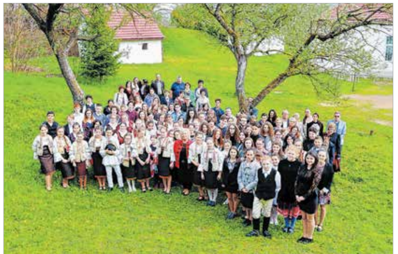
Akiknek estére nem ment el a busza, itt állnak a kamera előtt, ők a csíki versmondók, tanáraik, bírúik