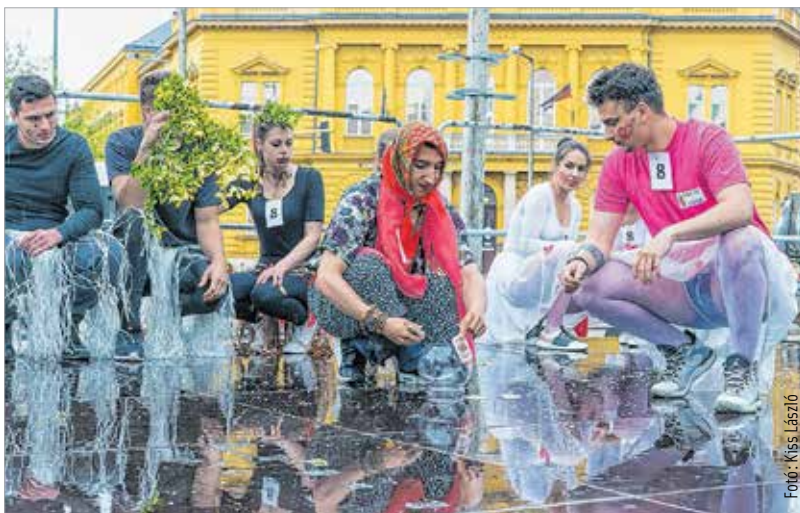
Nagyívű előadásokat láthattunk, volt olyan csapat, melynek műsorát a magyar népi kultúra inspirálta

A ballagási hét záró- és egyben legszébb ünnepén, a városi ballagáson tizenhét iskola ötvenkilenc osztályának ezerötszáz diákja sorakozott