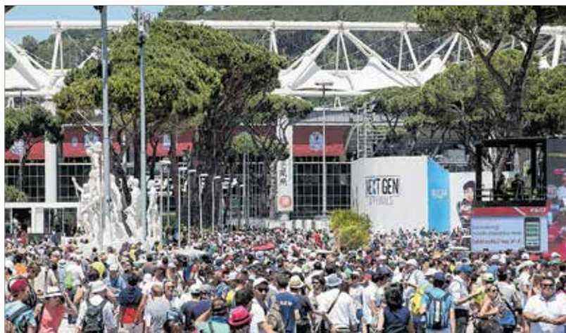
A Foro Italicon az egyetlen hely, ahol két ember kényelmesen elfér, a tenispálya...

óriási tömeg hömpölyög, naponta több mint harmincezer látogatót fogad a Foro Italico, ami a verseny további szakaszában még tovább nőhet. A jegyárak meglehetősen borsosak, ugyanakkor nyoma sincs az olasz lazáságnak, minden menetrend szerint, percre pontosan történik. A kapukon belül fokozottan ügyelnek a biztonságra. A tavaly bevezetett ingyenes Super Tennis csatorna közönségsiker idén is, mint ahogy letölthető az applikációk okostelefonra is. Az ingyenes weboldalak továbbra is várják a látogatókat, és a szintén ingyenes napi két újság is segít az események rögzítésében. Igyekeznek a gyermekeket is meghódítani: napról napra más sztárral ültögethetnek a fiatalok.