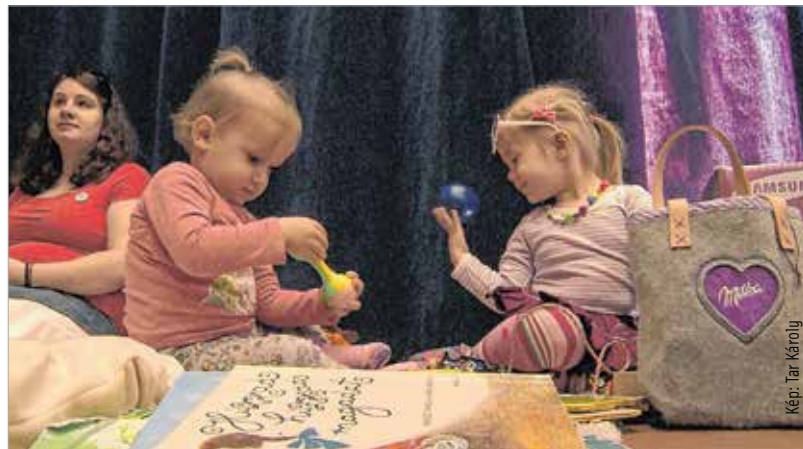
Programokkal készültek a család aprajának-nagyjának

vagy csipőn való hordozása kihívást jelenthet, ugyanis már nem vagyunk a hagyományos babahordozással kapcsolatos tudás birtokában. Aki szeretné megtanulni a babahordozás helyes és biztonságos módszereit, érdemes babahordozási tanácsadók segítségét kérnie.