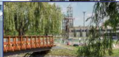
Új helyen csobog a Deák Dénes-kút 7. oldal