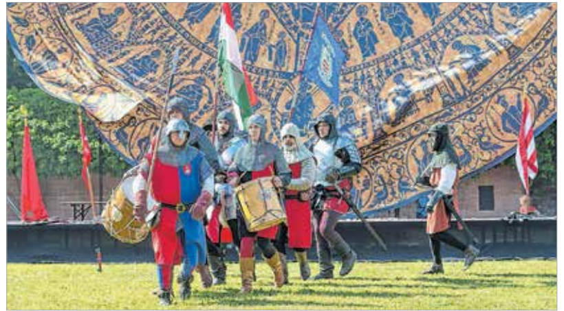
Középkori időutazás a Nemzeti Emlék helyen