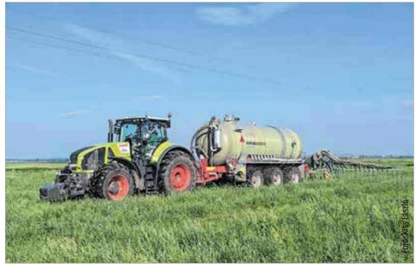
Hét év alatt harminc százalékkal nőtt a mezőgazdaságban foglalkoztatottak száma