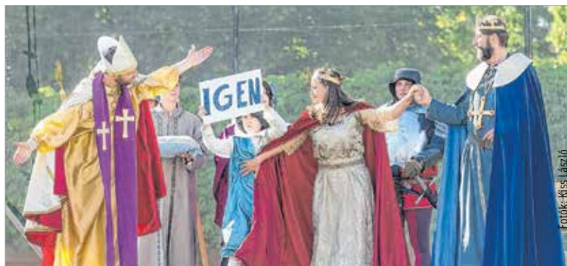
Királyi igenek – korhű szertartás, középkori esküvő elevenedett meg a programon