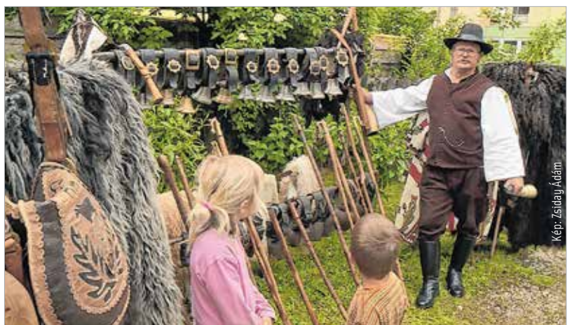
Az egész napos fesztivált gyerekeknek és felnőtteknek egyaránt szóló kézműves foglalkozások és interaktív mesterségbemutatók színesítették