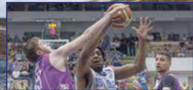
Háromból három – sima győzelem 15. oldal