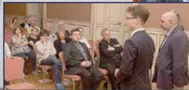
Emlékeink nyomában Rómában 3. oldal