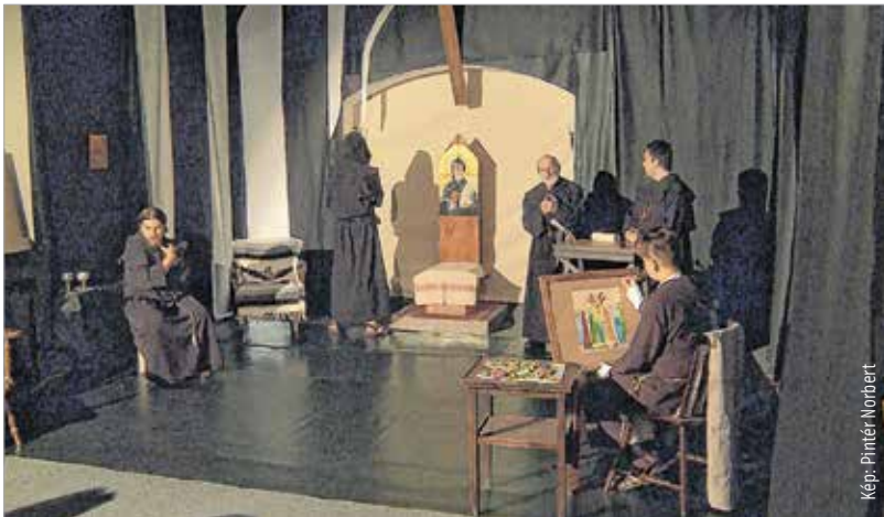
Színházi bemutatók a fesztiválon – eddig nem ismert részleteket ismerhetett meg Vak Béla királyunkról a Szabad Színház társulatának előadásában