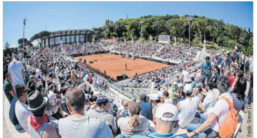
A legendás római teniszcsillag, Pietrangeli nevét viselő pálya mindig telt házat vonz

Doppingvétsége után a rendezők szabadkártyájával visszatért az orosz szépség, Marija Sarapova. Indulása megosztja a mezőnyt, ugyanakkor népszerűsége töretlen, ezt bizonyítja, hogy a római rendezők közönségcsalogató promóciós filmjében ő