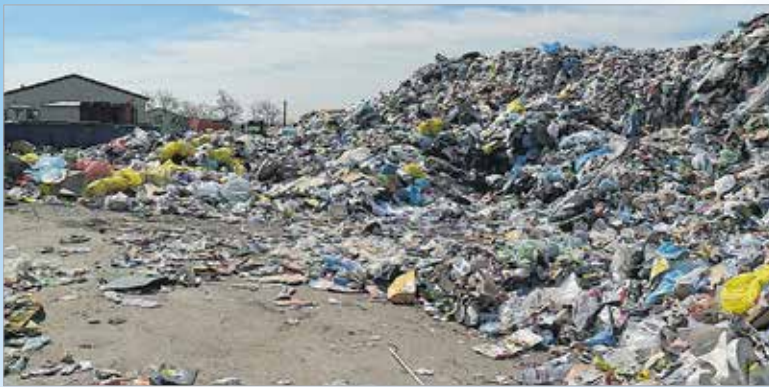
Nem szelektív a szelektív: a hulladék negyven százaléka nem újrahasznosítható

További információ a Depónia Nonprofit Kft-ről: www.deponia.hu