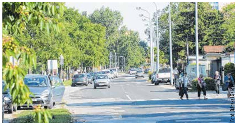
Június hatodikán kezdődik a felújítás, a munka egy évig tart

A kukásautók be tudnak majd menni a munkaterületre, és ha szükséges egy-egy munkafázisban, a kivitelező kiviszi a kukásautókat a szemetéseket. A tűzoltók és a mentők is be tudnak majd hajtani. A járdák pedig járhatóak lesznek, és a közüzemi szolgáltatásokban sem lesz korlátozás.