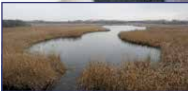
Indul a Sóstó rehabilitációja 2. oldal