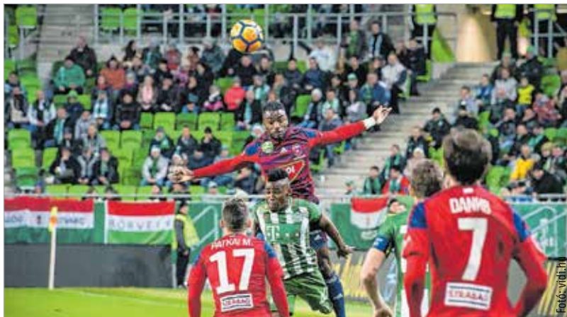
Szárnyalni kell a Zöld sasok ellen

Hála a televíziós közvetítésnek, a Videoton szombat este fél kilenckor azal a lélektani előnnyel (vagy teherrel)