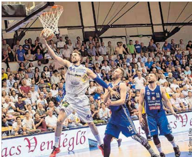
Fogcsikorgatva küzdött Lóránt és az Alba, de a ZTE nyert

A negyedik negyedben az idővel is játszott a ZTE, és bár sok támadásuk végén nem jutottak vagy csak rossz dobásig, ez nem zavarta őket, hiszen közben az Alba is fáradt és hibázott. Edwards és Mohammed így is triplát dobott, hatpontos hátránynál támadhatta a házigazda, de nem tudott