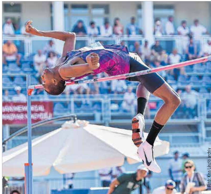
Két éve Barshim nyert a Bregyóban, lehet, hogy most nehezebb dolga lesz a katarai klasszisnak