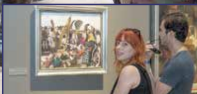
Megnyílt az Aba-Novák-tárlat 5. oldal