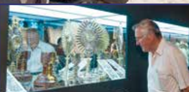
Úton vagyunk Föld és ég között 12. oldal