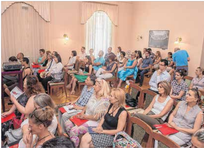
Húsz esztendeje segíti a szenvedélybetegeket a Rév Ambulancia