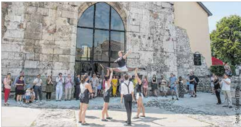
Látványos bemutató keretében ismertették az idei szertartásjáték részleteit Budapesten, a Magdolna-toronyban

viseli Az aranykor trónusán alcímet: az Árpád-ház talán legfényesebb uralkodója volt III. Béla. Az életéről készített szertartásjáték több újítást is tartalmaz a korábbi évekhez képest. Az egyik ilyen, hogy