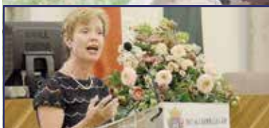
A Világbank szerint Fehérvár az élen 3. oldal