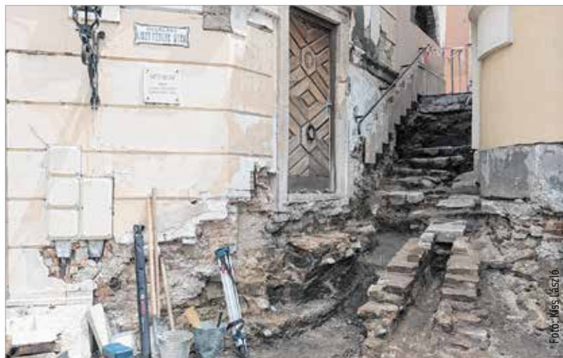
Átmenetileg eltűntek a Lépcső utca lépcsői

az utca, és balesetveszélyes volt közlekedni rajta. A bontás után olyan alapba helyezik majd a mészkő lépcsőket, amibe nem tud befolyni a víz – így várhatóan jóval tartósabb lesz, mint a korábbi burkolat, és nem töredezik majd fel. Erre azonban még hónapokat kell várni. A régészeti feltárást követően kezdődhet az utca újraépítése. Kocsis Balázs szerint augusztus végén, szeptember elején már a megújult lépcsőkön sétálhatnak a fehérváriak.