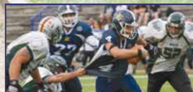
Tíz és első? 15. oldal