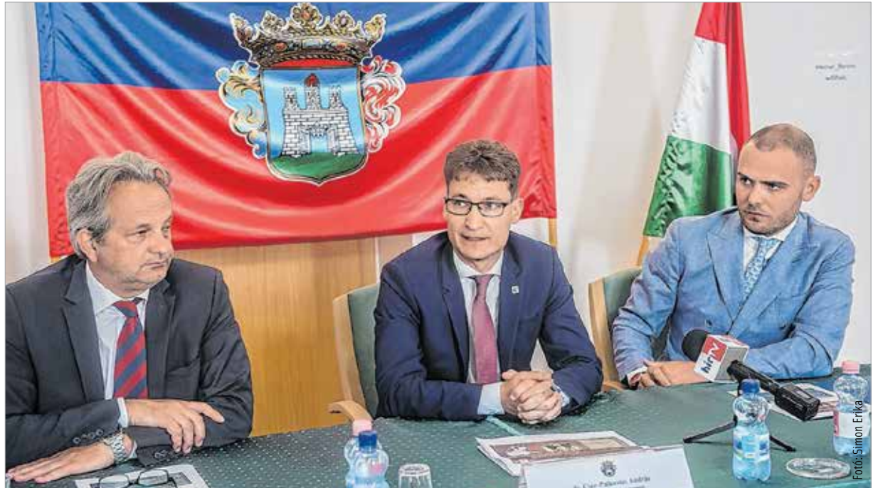
A Modern Városok Program alapelveit a Miniszterelnökség miniszterhelyettese, Csepreghy Nándor (képünkön jobbra) részletezte

„Megvalósul egy olyan program, ami a vidék Magyarországnak egy soha nem látott fejlődés lehetőségét nyitja meg. Hogyha nagyon szimbolikus történelmi párhuzamot akarok keresni, akkor olyan fellendülést tudunk biz-