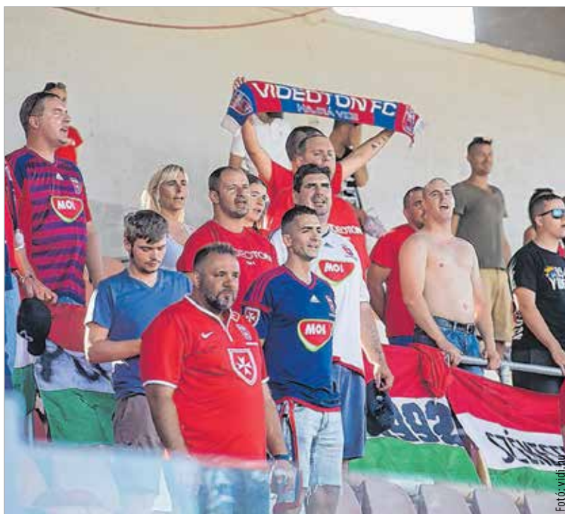
Piros-kék sziget Máltán

Bár a Vidi trénera felhívta a figyelmet arra, hogy sokat erősödött a máltai foci, azt talán még ő sem gondolta, hogy egyenlít, majd