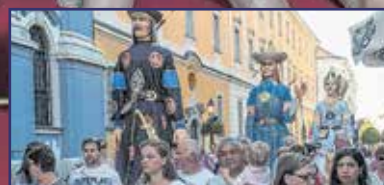
Hangolódik a város a Királyi Napokra 9. oldal