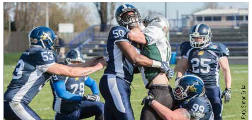
Ismét egymásnak feszül az Enthroners és az Eagles. Eddig a fehérváriak örülhettek.

Erős Márkék mind a hét meccsüket megnyerték eddig, így a tabella első helyén végeztek. A Fehérvár Enthroners 313 pontot szerzett a pályán, és csupán 48 pontot kapott. A küzdelem azonban még nem ért véget, hiszen a végső dicsőség érdekében a mindent eldöntő szombati összecsapáson is győznie kell az Enthronersnek.