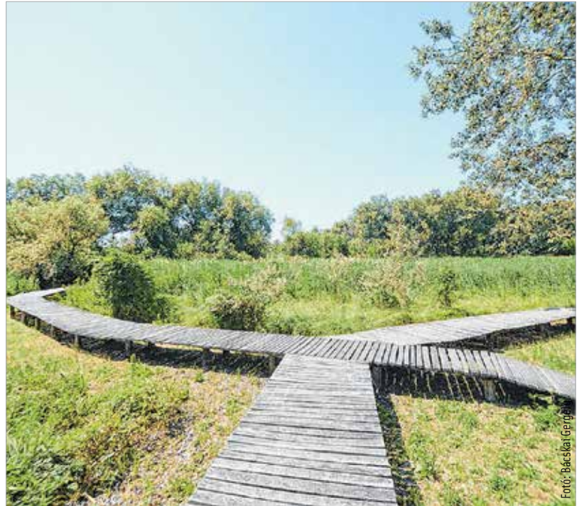
Jövőre itt lesz a város egyik oázisa