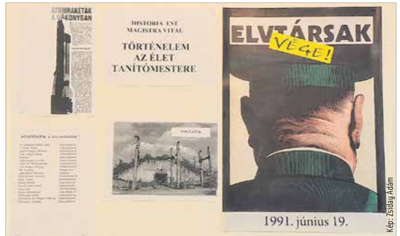
Az elmúlt negyedszázad legfontosabb eseményeinek egyike: a szovjet katonák elhagyták az országot