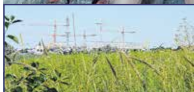
Elkezdődtek a munkálatok a természetvédelmi területen 2. oldal