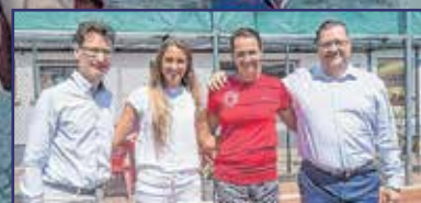
Közösen az aranyért