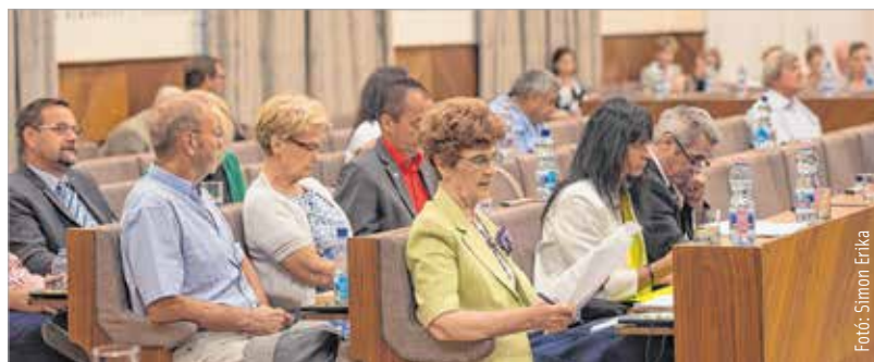
Fontos döntések születtek

„Nagyon fontos a Déli összekötő út megvalósítása. Itt a tervezők kiválasztása történt meg, megkezdődhet az ütemezett tervezési munka, így tudunk előre haladni. A város déli részének közlekedési problémáit megoldja a Déli összekötő út megvalósítása a következő években.”