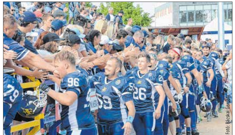
Járt a gratuláció a szurkolóktól a veretlenül „lehozott” szezon után