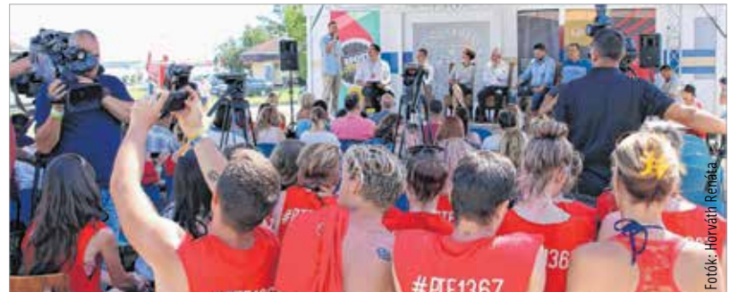
A fennállásának 650. évfordulóját ünneplő Pécsi Tudományegyetem volt az EFOTT házigazdája