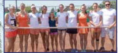
Nagyon közel a bajnoki cím 14. oldal