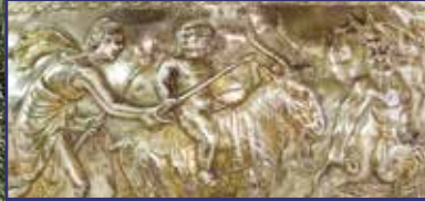
Seuso nem ereszt! 4. oldal