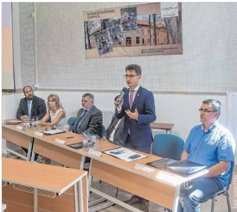
Székesfehérvár és a Corvinus Egyetem azonos hullámhosszon

„Nagy öröm a város életében, mikor egy egyetem fejlesztést valósít meg, különösen akkor, ha az ország egyik legnagyobb egyeteméről van szó, amely kiemelt partnerünk. Fontos volt a város szempontjából, hogy a Corvinus úgy döntött, Székesfehérváron is elindítja az egyetemi képzéseit. A duális képzés tekintetében pedig bizonyos dolgok itt indulnak el egyedülként. A gazdasági élet sze-