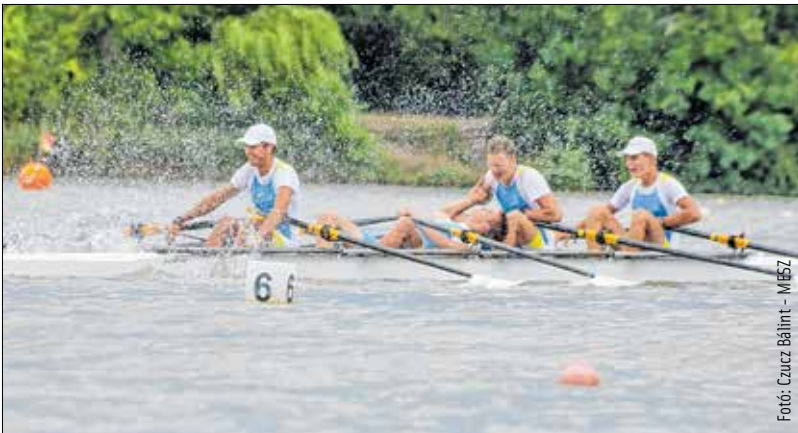
A győzelem pillanata – bajnok az agárdi ifi négyprévezős