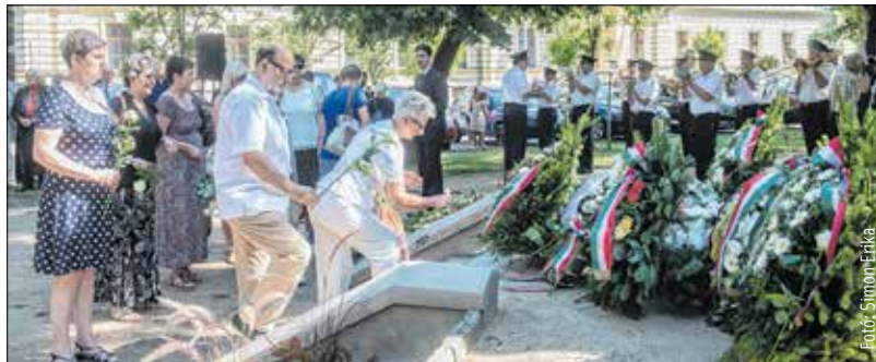
Doberdó és Isonzó emléke nem halványulhat el

igazából nem szenvedett vereséget, a magyar katonák a magyar határokon kívül álltak, az ország mégis a veszteségek közé került, s a legyőzöttek között tartják nyilván azóta is.” Az emlékezők megerősítést adtak az ezrednapon arról, hogy katonahőseink emlékeztetének megőrzése minden generáció számára szent kötelesség.