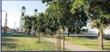
Ezer fát Székesfehérvárra! 3. oldal