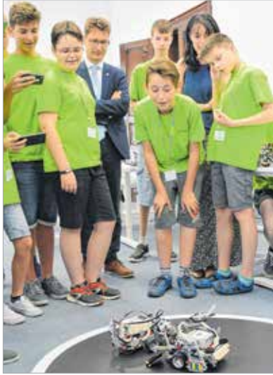
Éles helyzetben az a járgány győz, amelyik lesöpri a pályáról az ellenfelet

Bekukkantottunk, megnéztük és megállapítottuk, hogy igazán szerencsések voltak azok a gyerekek, akik az elmúlt hetet az Alba Innovárban tölthették. Elindult ugyanis a próba táborok sora a digitális élményközpontban. A gyerekek az utolsó nap autós robotokat építettek és programoztak, a csapatok aztán egy legószumó bajnokságon tesztelték is a speciális robotokat. A digitális élményközpont jól vizsgázott az ifjúság szerint.