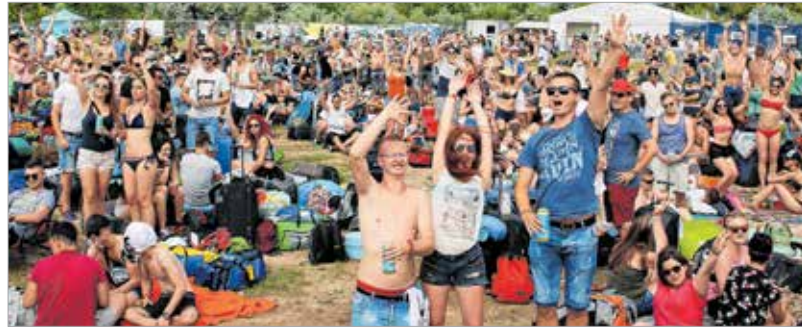
Idén százhusz-százharmincezer embert vártak az Egyetemisták és Főiskolások Országos Turisztikai Találkozója

Negyvenkettedik alkalommal nyitotta meg kapuit az EFOTT. Velencén hat napon keresztül élvezhették a fiatalok a rendezvény innovatív repertoárját. A koncertek és a közösségkövacsoló programok mellett a sport kapta a főszerepet. Lehetett szö tollasról, wakeboard-ról, korcsolyáról vagy éppen az extrém futball fortélyairól – a fiatalság lelkesen vetette bele magát az ismert vagy