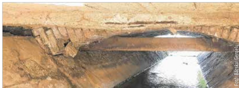
A csatorna feletti híd szerkezete meggyengült, ezért kell lezárni az átmenő forgalmat

A Tóparti Gimnázium és Művészeti Szakgimnázium, valamint A Szabadművelődés Háza parkolója a Bregyó köz felől közelíthető meg. A Sár utcai és a Bregyó közti útsatlakozásnál a „zsákutca kerékpáros továbbhaladási lehetőség” táblát helyezték ki.