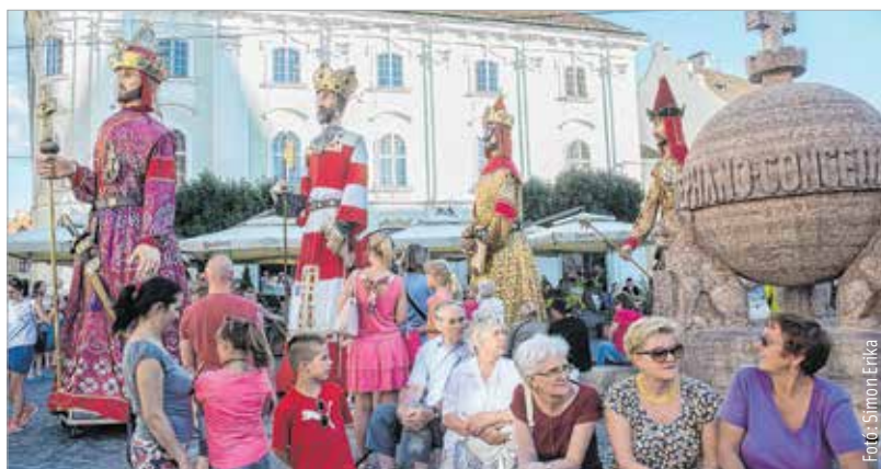
Július 22-én ismét a királyoké a Belváros

együttes, a Bandiera zászlóforgató csoport, a hagyományőrzők közül pedig a Királyi Kardforgatók Rendje tart bemutatásokat. A Vörösmarty Színház elől indul július 22-én a program, majd a Varkocs szobornál, a Mátyás király-emlékműnél, a Városház téren és visszafelé újra a Mátyás király-emlékműnél tartanak bemutatásokat. A színes kavalkád ezúttal 18:30 perctől pódiumbeszélgetés zárja, amelyen a Musica Sacra programról tudhatnak meg érdekességeket. Ahogy arról már a Fehérvár magazin hasábjain is olvashattak, igazi kuriózum a komolyzene kedvelői számára a program. Ebben az évben Verdi remekművét, a Requiemet hallhatják augusztus 12-én az ország egyik legnagyobb épített szabadtéri színpadán, történelmi környezetben, a Nemzeti Emlékhelyen.