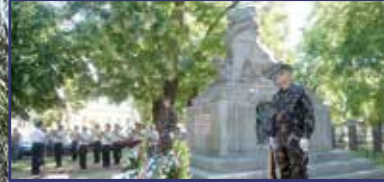
Ezrednap a hősökért 7. oldal