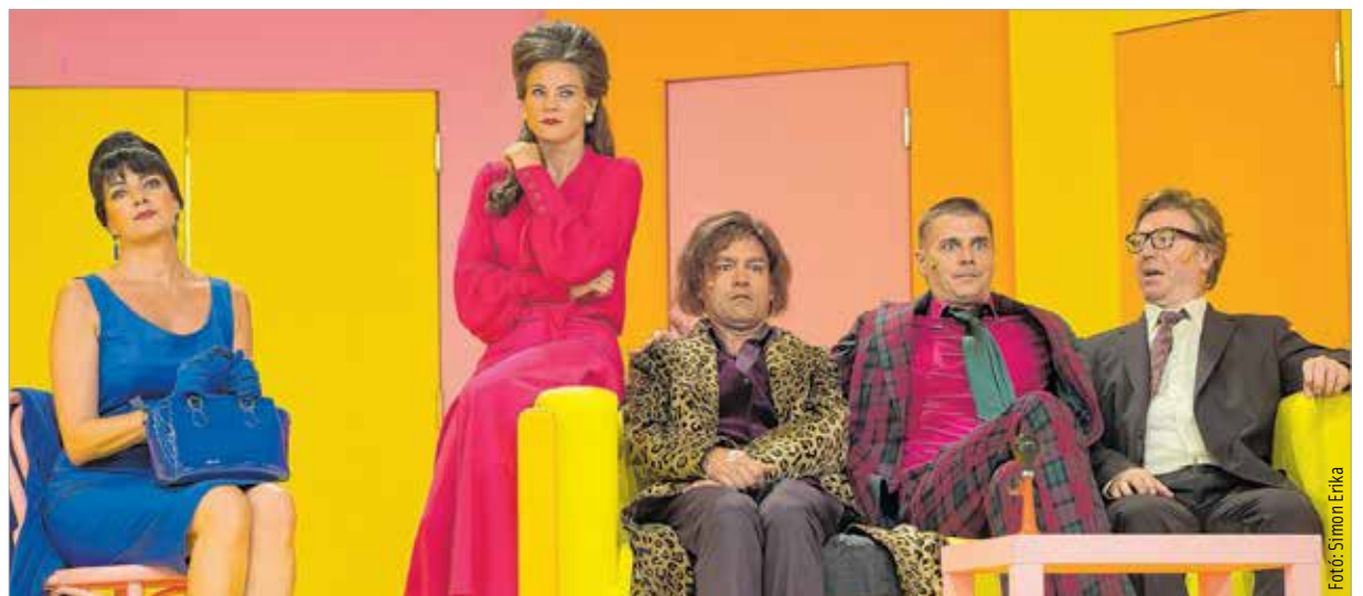
Dilemmák: egymásért vagy egy másért?

„Feydeau sok tekintetben a XX. századi abszurd előfutára. Ez a darab, a szó legjobb értelmében, egy klasszikus francia bohózat, amiben már benne vannak az abszurd előjelei. A darabban végletekig vannak feszítve a humoros szituációk, már-már túlzóak és ebben nagy élvezet volt elmerülnünk. A házastársi hűség eleve nagy kérdése az emberiségnek, hiszen kultúrtörténeti tény, hogy a házassági kapcsolatok intézménye az emberi kapcsolatok középpontja, ugyanakkor számtalan történet bizonyítja, hogy az ember ebből csak-csak kikacsint.” A darabban, amely az exkluzív illemnélküliség, az emberi gyarlóságok és ferdeségek remeke,