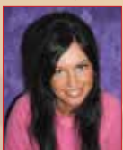
Hexina jónó www.holdfenyek.hu