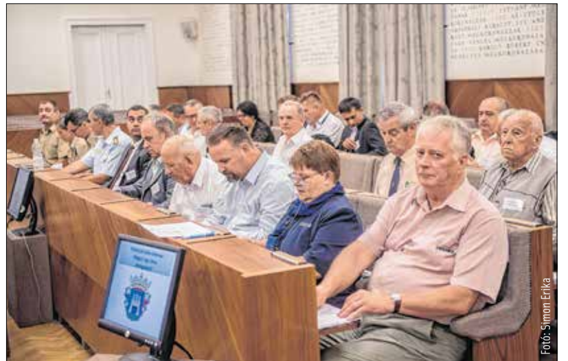
A bajtársi egyesületek élén járnak a közösségépítésben

mindenkor kiemelt szerephez jutnak a város életében. A bajtársi egyesületek mindig példaként állíthatók más civilszervezetek elé, hiszen összefogják azokat az embereket, akik kikerülnek a honvédség intézményi keretei közül, de mégis valamilyen szinten kapcsolódnak a honvédelemhez. Ez az a közösségépítés az, amit