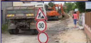
A Liget sort és a Budai út egy szakaszát is lezárják 2. oldal