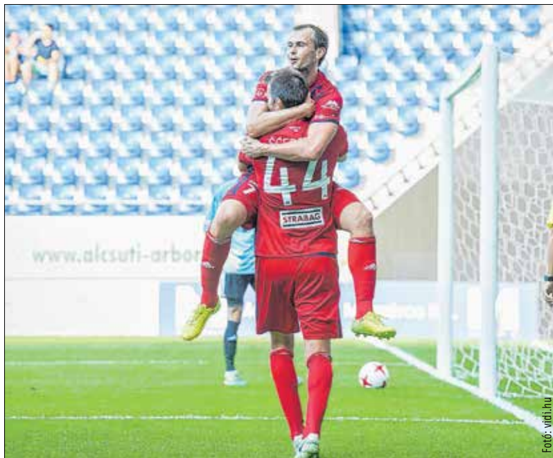
Scepovics öt, Lazovics négy gólnál jár a szezonban

Viola hátborzongató élményt is szerzett tavaly Bordeaux-ban: a meccs hajrájában csúnyán kifordult a bokája, ami véget vetett Eb-szereplésének. A hátvéd tavasz óta a sérültek listáját gyarapította,