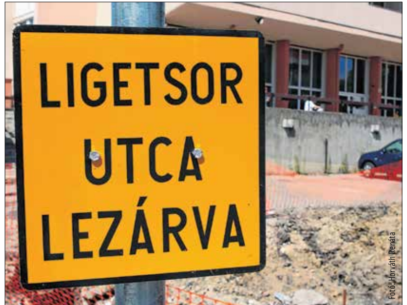
A Liget sort augusztus elsejétől teljes egészében lezárják

A felújítás miatt módosított útvonalon közlekednek a 10-es, 11-es, 12-es, 13-as, 14-es és 16-os autóbuszok. A Szedreskerti lakónegyedről induló és oda érkező buszok a Palotai úti Hosszú temető megállótól illetve megállóig közlekednek. Nem érintik a járatok a Liget soron található Uzsoda, Liget sor és Szedreskert lakónegyed megállóhelyeket. A Mészöly Géza utcán található Uzsoda megálló kiszolgálása változatlan marad. A módosított