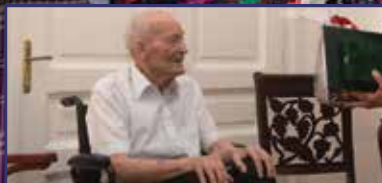
Legenda a Don-kanyarból 4. oldal