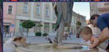
Kis nyári felfrissülés: ivóutak és díszutak Fehérváron 13. oldal