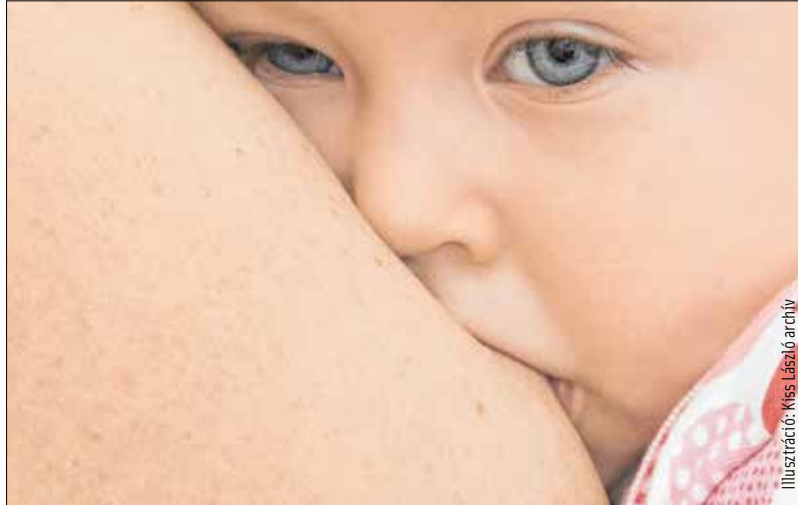
Illusztráció: Kiss László archív

Az anyukák többsége számára nyilvánvaló, hogy babájuk táplálásának legtökéletesebb módja a szoptatás. A védőnőktől, gyermekorvostól is folyamatosan megerősítést kapnak