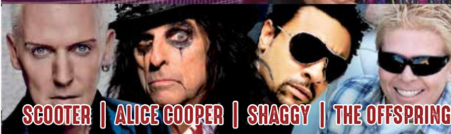
SCOOTER | ALICE COOPER | SHAGGY | THE OFFSPRING