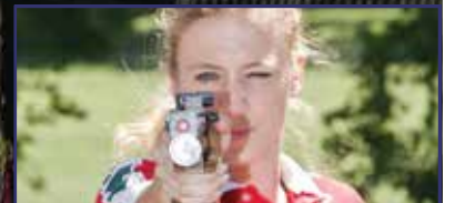
Öt fehérvári érme az öttusa Eb-n 14. oldal