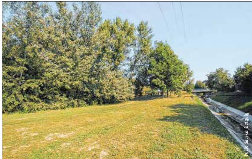
Negyven fát is ültetnek az épülő szabadidőparkba

Kosárlabda- és focipálya, játszótér és kondipark is lesz a Túrósáki úti szabadidőparkban. Az uniós forrású városi beruházás közel kétszázötvenmillió forintból valósul meg.