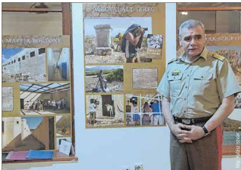
Szabó István tábornok főhajtása

a magyar hadifoglyok méltatlanul elfeledett történetével, szenvedéseivel szembesít bennünket. Az 1915-ben szerb fogságba esett magyar katonák hadifogságának története, a kéthónapos, havas hegyeken, mocsarakon át vezető menetelés balkáni halálmarsként vonult be a történelembe. Az alkotók célja, hogy méltó vizuális emléket állítsanak annak a mintegy hetvenezer magyar hadifogolynak, akik végül az olaszországi haláltáborban, Asinara szigetén áldozták életüket hazájukért.