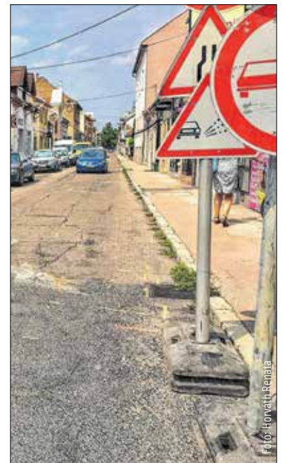
A Távírda utca felújítása januárig tart

állapotban volt. A munkálatok a tervezett ütemben haladnak. A felújítás ideje alatt a gyalogos- és kerékpáros-forgalom zavartalan, az autósoknak kell csak kerülniük.