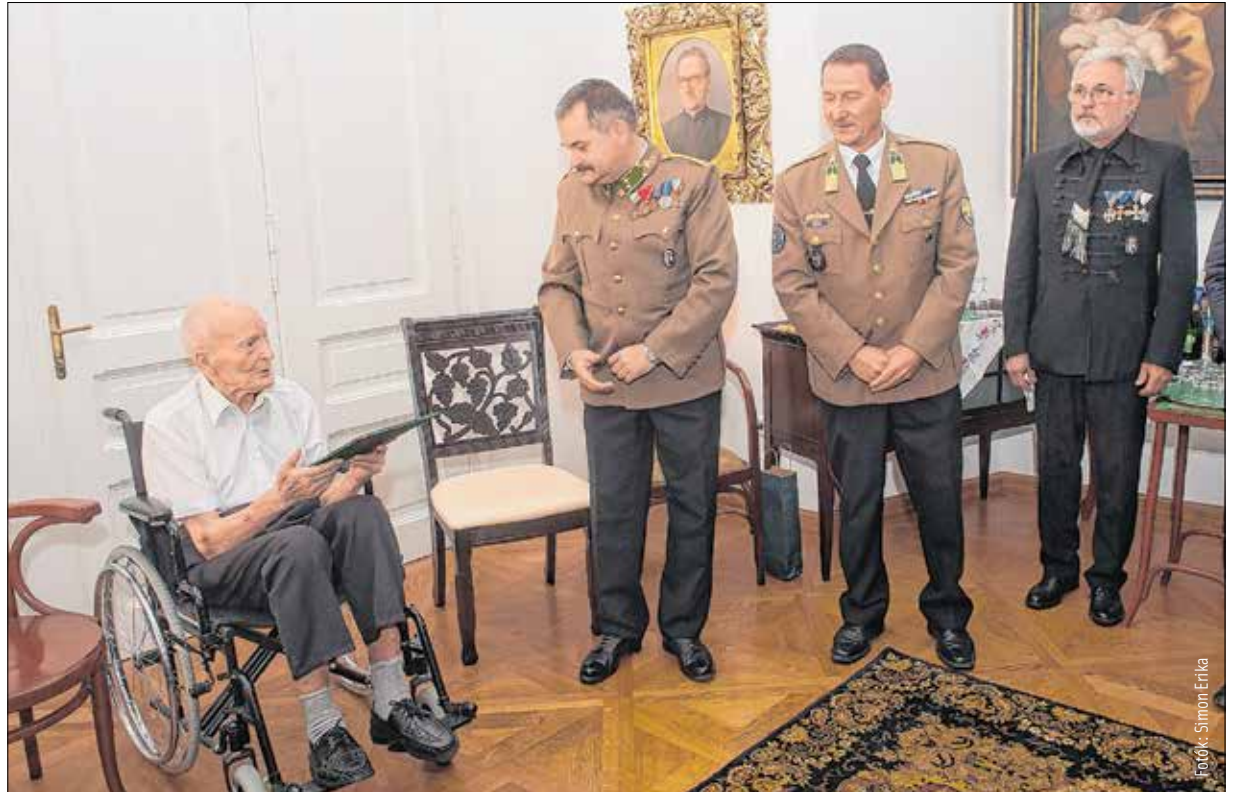
Tiszteletadás a példakép előtt

„Minden tisztességes nemzet tisztelettel és szeretettel emlékezik azokra, akik a hazát védték. Hogy később a történelem miként ítél meg egy háborút a győztesek, a vesztesek oldaláról, az egy másik kérdés, de a katonai erények azok általánosak. Ott nem az ellenfél vagy az ellenség számít, hanem az a teljesítmény, amit az egyes személyek nyújtottak. A II. világháború végén – bár a szovjet, német, amerikai, brit katonák különböző haderőben szolgáltak – egymás katonai teljesítményét mégis elismerték. Mivel Magyarország a vesztes oldalon fejezte be a háborút, vagy rossz célokért harcoltunk, ezért azok a katonai teljesítmények, azok