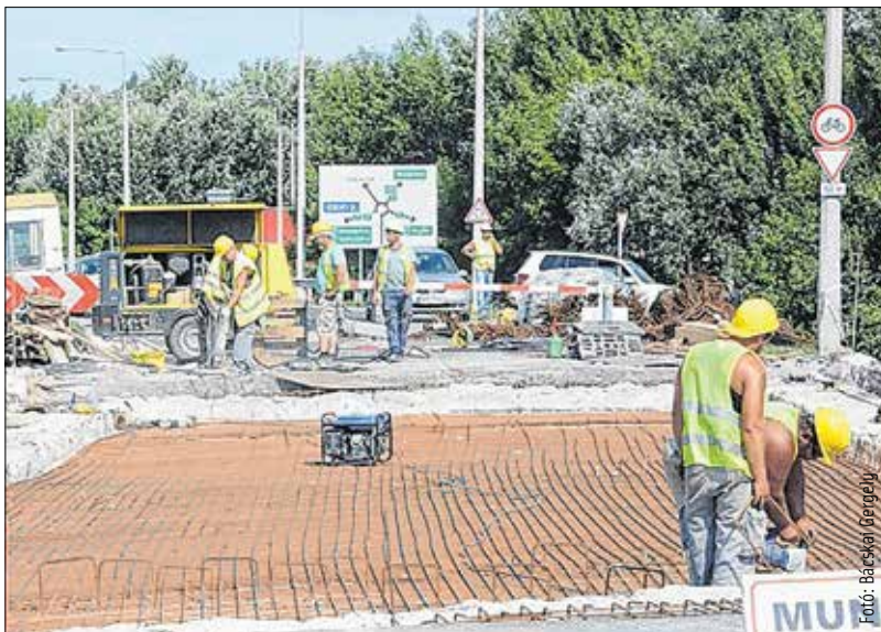
A terveknek megfelelően halad a Gaja-híd felújítása