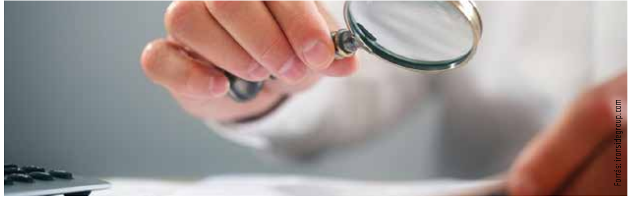
A városban huszonnyolc cég került feketelistára

adóhatóság határozatának bírósági felülvizsgálata iránt keresetet indítottak, az adatok közzétételére a bíróság jogerős és végrehajtható határozata alapján kerül sor." - olvasható az adóhatóság weboldalán. A NAV honlapján ( www.nav.gov.hu ) közzétett adatok, a név mellett a székhely és adószám ráadásul legalább két évig elérhetőek maradnak a nyilvánosság számára, ezután törlik őket. Ha azonban az érintett ismételtén vét a szabályok ellen, akkor újra kezdődik a feketelista-időszámítás.