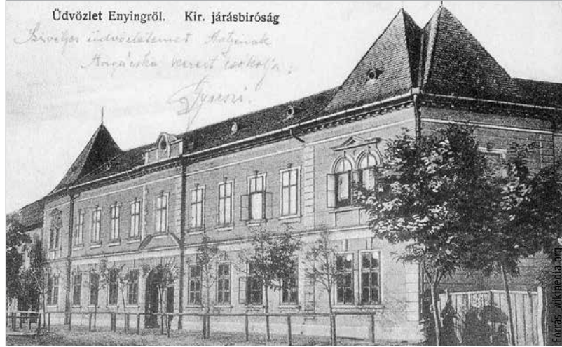
Az enyingi Batthyány-kastély a huszadik század elején egy képeslapon

1848 előtt csupán három hercegi nemzetség élt a hazai főnemesség soraiban. A Pálffy, Batthyány és az Esterházy család viselhette a címet. A három család közül kettő – a Pálffy és Batthyány – Fejér megyei kötődésű. Nagyhercsökpuszta adott otthont Pálffy Miklós 4. hercegnek Zichy Margittal kötött házassága révén. Enying és Bicske pedig a Batthyány hercegeknek. A magyar hercegi cím akkoriban még nem létezett. E három hercegi család a német birodalmi,