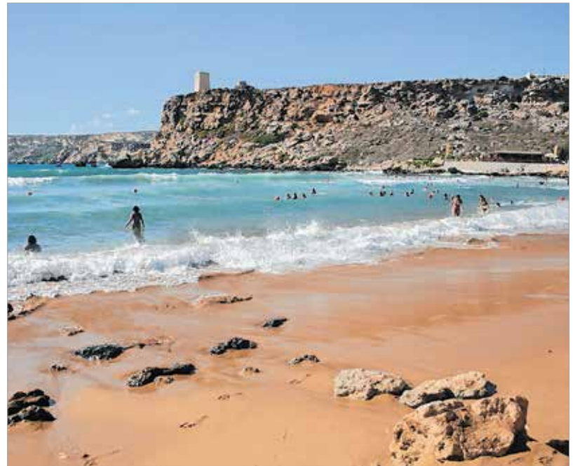
Málta egyik legszebb öblében homokos strand is van

A máltaiak persze minderről nem akarnak tudni.” Jó azért ezekkel is tisztában lenni. Szent Pál-kápolnája után aztán még megnéztük az öblöt védő, nemrég újjáépített Wignacourt-tornyot, amit Adrien de Wignacourt Grand Master építtetett 1610-ben. Röviden összefoglalva ezek lennének Bugibba látnivalói. Ha a tengerpartok és Szent Pál-öble mellett mást is fel akarunk fedezni, akkor tegyünk egy kirándulást a fővárosba, Valettába is. Sajnos a szigetország másik híres látnivalója, a gozói Azúr-ablak 2017. március 8-án összeomlott.