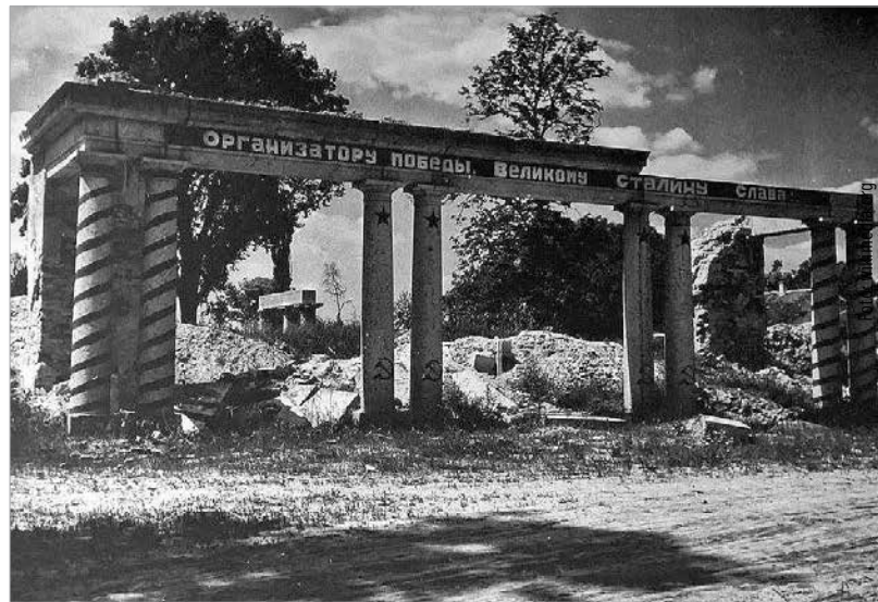
Az utolsó felvételek egyike a romokban álló polgárdi Batthyány-kastélyról, amin orosz felirat dicsőíti a diktátort, Sztálint

megtorlatlanul. Börtönbe és elmeegógyintézetbe zártak koncepciók ítélet alapján, mert a hatalmat nem lehet büntetlenül kicselezni. Előbb azonban megvárták, míg a köztisztviselő álló, szerteágazó kapcsolatokkal rendelkező szülők meghalnak, hogy semmilyen akadály ne gördüljön megsemmisítése elé. A mondén világ biszex festője egyéni stílussal, színesen jelenítette meg a felső körök életének epizódjait, a mára végleg eltűnt miliót, csillogó szépre retusálva a kezükben pezsgőt tartó elegáns hölgyeket. A csaknem két méter magas gróft korának legelegánsabb társasági szereplőjeként tartották számon. 1946-ban még díszvendége volt az extravagáns Esterházy Pál herceg és a primabalerina Ottrubay Melinda szűk körben megtartott esküvőjének. Elizabeth Arden, a divatvilág királynője is rajongott érte. Tízezer dollárt küldött részére, hogy kimenekítse az országból a nehéz időkben. Nem leszek egy amerikai milliomosnó pincsikutyája – mondta, talán kissé elhamarkodottan. Leülte, amit kiszabott rá a hatalom, a volt inasánál töltötte el hátralévő éveit, és felfokozott munkatempóban ontotta a festményeit. Bálint nevű fiának is akkor kellett bíróság elé állnia, amikor édesapja már nem élt. 1960-ban egy állítólagos 56-os tettéért, amelyet soha nem ismert el. Vasúti pályamunkásként halt meg. A „véletlenül”