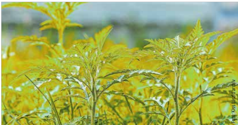
Virul a parlagfű, korábban van itt a szezon

A szakemberek arra is felhívják a figyelmet, hogy az allergiások lehetőleg keveset legyenek a szabadban. Enyhítheti a panaszokat, ha gyakran mosnak hajat, sűrűn cserélik az ágyneműt, és már az első tünetek megjelenésekor elkezdik szedni az allergia elleni gyógyszereiket. A keresztallergiát okozó zöldségeket és gyümölcsöket – így például a dinnyét, cukkinit, paprikát vagy a paradicsomot – érdemes most kerülni.