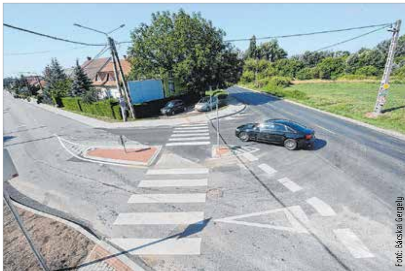
Nagyméretű útsatlakozást építettek, melyet biztonságosabban lehet használni a korábbinál. Új közvilágítási oszlop is épült, illetve a meglévőknön lecserélték a régi lámpafejeket.

Rózsáhegyi út közötti szakaszán korábban nem volt járda, így a gyalogosoknak a 811-es úton a kamionok között kellett közlekednie. „Nagyon örülök annak, hogy ez a balesetveszélyes, áldatlan állapot megszűnt. Ezzel együtt felújítottuk a Béla úton a Szeredi és a Rózsáhegyi utca közötti járdaszakaszt, és elkészült a csapadékvíz elvezetés is.” – mondta a képviselő, aki köszönetét fejezte ki a Városgondnokságnak és a kivitelezőnek.