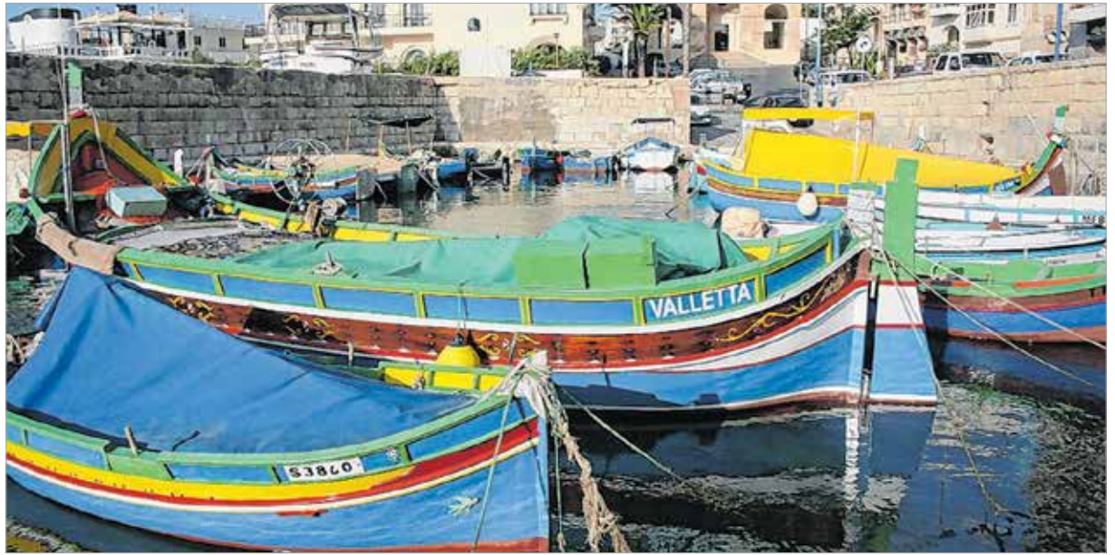
Jellegzetes máltai hajók

A toronytól a part menti sétányon némi kaktuszlikórt is szürcsölgetve sétáltunk a Szent Pál-kápolnáig (San Pawl Milqi). Az apró templom pontosan azon a helyen áll, ahol Pál apostol az egykori római kormányzóval, a később keresztény hitre térített – és emiatt mártírrá vált – Publiusszal találkozott. (Egy másik bédekker szerint a templom azon a helyen áll, ahol Szent Pál vipérát dobott a tűzbe). A kápolnától is jól látszott az öböl kijáratánál levő Szt. Pál-sziget (Il-Gzejjer): itt érte az apostolt i.sz. 60-ban az a bizonyos hajótörés, amelyre – és a szigeten való három hónapos tartózkodására – márványból készült 12 méter magas szobra emlékeztet. És ha már újra felhoztam Szent