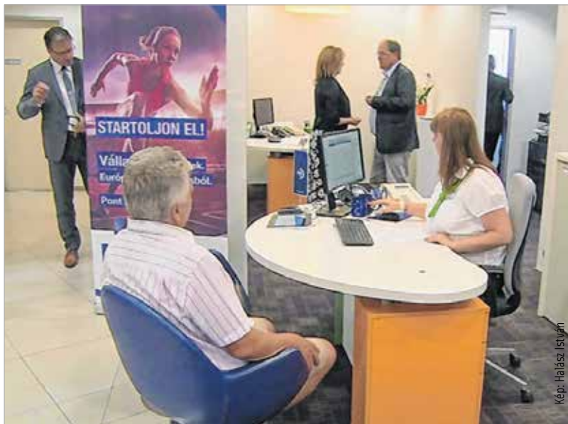
Mostantól egyszerűsödik az ügyintézés

Unió forrásához való hozzáférést minél szélesebb körben, minél hatékonyabban biztosítsa. Összesen 16 termék közül választhatnak a vállalkozók és magánszemélyek. Újdonság, hogy minden termékben van visszatérítendő rész, azaz hitel. Nemcsak a megszokott vissza nem térítendő támogatásokról van szó, hanem a pénzek egy részét visszakapják, és ezeket újból ki tudják helyezni. Ezeknél a hitelek-nél az önerő-elvárás, a biztosítéki rendszer és a hitelbírálati elvárások is eltérnek a kereskedelmi banki sztenderdektől.