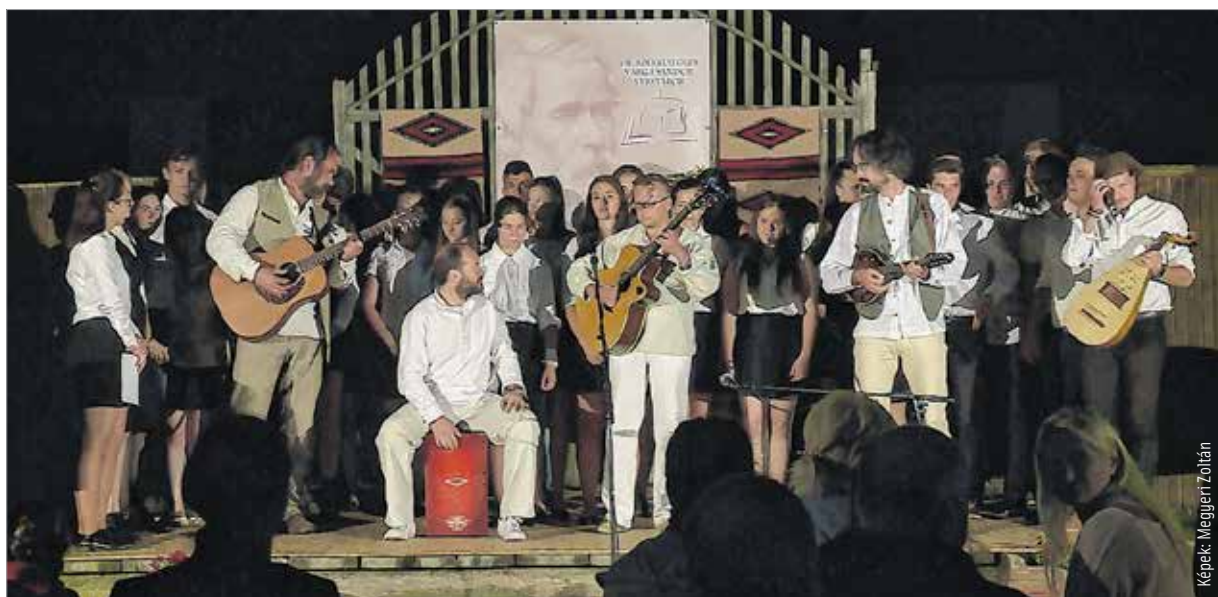
A gálaműsoron együtt énekelt mindenki, aki a táborban volt