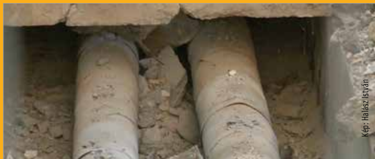
Új csövek kerülnek a földre ezek helyett

További információ a Széphő Zrt.-ről a www.szepho.hu oldalon olvasható.