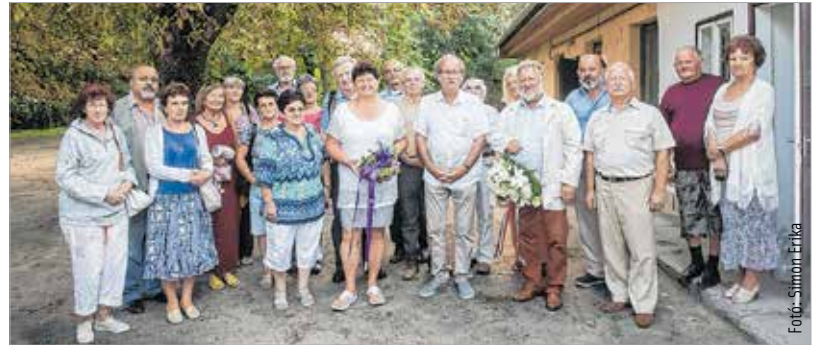
A sárkeresztúri szülői háznál emlékeztek meg a költő Bella Istvánról, aki egy ideig a Fehérvár Televízió főszerkesztője is volt