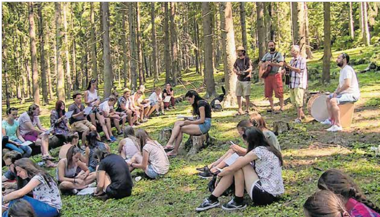
Daltanulás a Misztrállal a fenyvesek között, a Kisbütökben