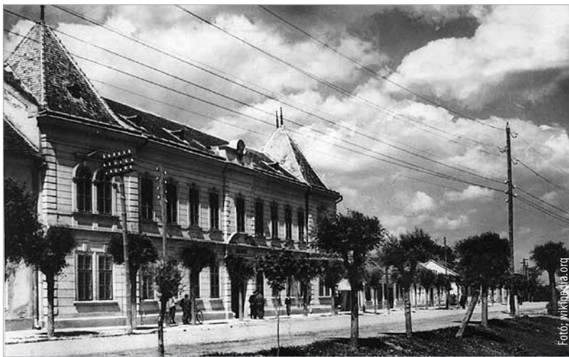
Az enyingi Batthyány-kastély az 1960-as években

A XX. század elején a grófi kastélyok egy részét tulajdonosaik értékesítették. Földjeik, gazdaságaik már nem termelték ki a kastélyok és pazar életmódjuk fenntartásának költségeit. A földreform, a gazdasági válság sem kedvezett a családi költségvetéseknek. Ez időtájt adta el a székesfehérvári, Kossuth utcai Zichy palotát Rafael gróf a város részére, a szintén Kossuth utcai Széchenyi palotát Széchenyi Viktor gróf úri kaszinó céljára. Hasonló sorsra jutott egy sor pesti palota is. Károlyi Zsuzsanna alighogy megvásárolta a bicskei birtokot és benne a 80 helyiségből álló kastélyt, 14 év múlva értékesíteni kényszerült. A vevő, Népjóléti és Munkügyi Minisztérium ingyenes használatra továbbadta a Fővárosnak szociális célokra. Anya- és csecsemővédelmi intézet, átmeneti leányotthon, ma pedig gyermekotthon működik a falai között. Folyamatos használatával ez a kastély is megmenekült a pusztulástól. Polgárdi a Batthyányak legrégebbi birtoka, még a Kóvágó Orsi időszakból való. A kastély a XVIII. században épült barokk stílusban. A család grófi