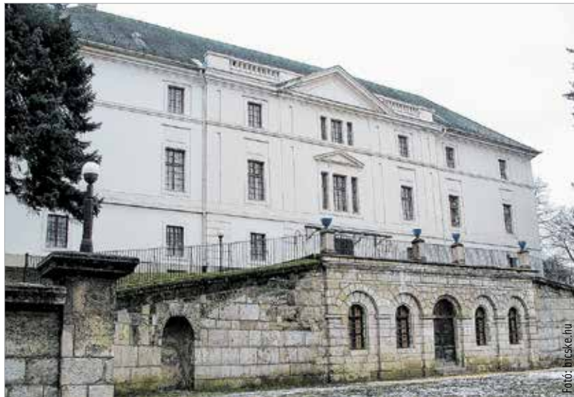
A bicskei Batthyány-kastély napjainkban