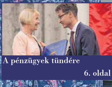
A pénzügyek tündére 6. oldal