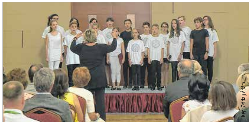
Az Oscar-díjas Mindenki című filmben szereplő kórus különleges hangulatot teremtett a rendezvényen

A több mint ötszáz szakember részvételével megrendezett fórumon szó volt többek között a jogszabályi változásokról, a magyar gyermekvédelem sikereiről valamint az 1992. és 2017. közötti gyermekvédelmi adatokról, de téma volt az itthoni és a határon túli gyermekvédelmi szakellátás is. A tervek szerint a konferencia regionális, majd nemzetközi szintre emelkedik a jövőben.