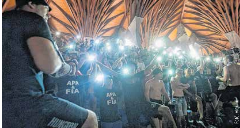
A szurkolók jóban, rosszban, világosban, sötétségben is kitarítottak