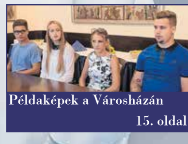
Példaképek a Városházán 15. oldal