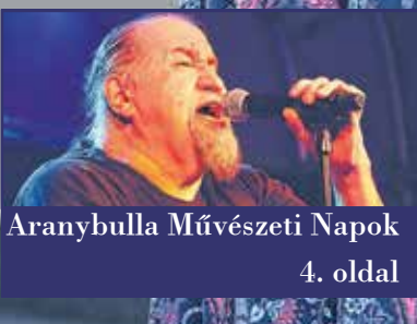
Aranybulla Művészeti Napok 4. oldal