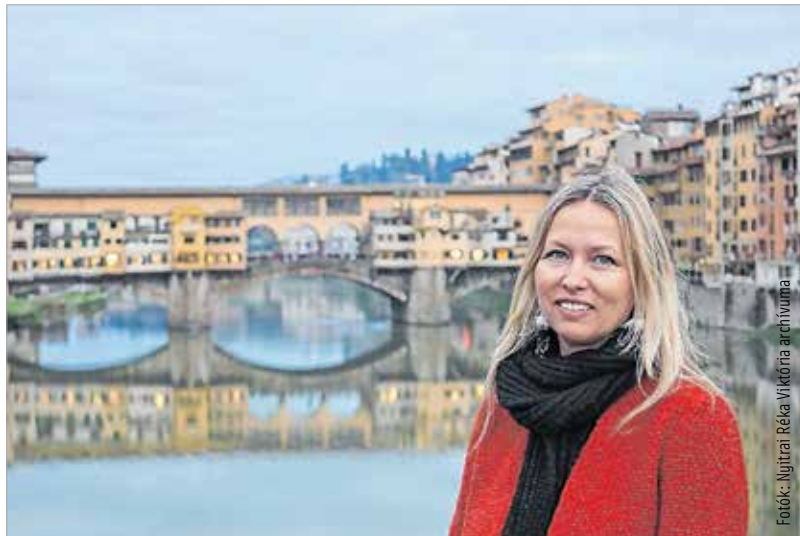
Firenze kincsei megunhatatlanok

Nem tudtam olaszul, úgyhogy azzal kellett kezdenem, hogy beiratkoztam egy intenzív tanfolyamra, ami két hónapos volt. Rögtön az idegenforgalomban kerestem állást, mert én mindig abban dolgoztam, a végzettségem idegenforgalmi közgazdász. Először egy utazási irodában dolgoztam, ami beutaztatással foglalkozott. Ezt követően egy firenzei luxusszállodában kaptam állást, ott több éven át