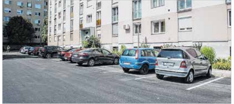
Újabb lépés a parkolóhiány enyhítésére: százötven hely újult meg Királykúton

kulturált környezetben több mint százötven autó tud leparkolni. A területen elhelyezett kukaketrecek további nyolc parkolóhelyet foglalnak el, a szakemberek keresik annak lehetőségét, hogy a tárolók máshol kapjanak helyet. A parkoló közel negyvenmillió forintból újult meg, a fejlesztések azonban ezzel nem fejeződnek be. A Királykúton a Cserkész és a Mikszáth Kálmán utca közötti szakaszt is felújítják, de készülnek már a tervek a Bényi út Tompa Mihály és Cserkész utca közötti szakasza csapadékvíz-elvezető rendszerének felújításáról. A munka 2018 tavaszán kezdődhet el.