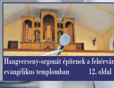
Hangverseny-organát építenek a fehérvári evangélikus templomban 12. oldal