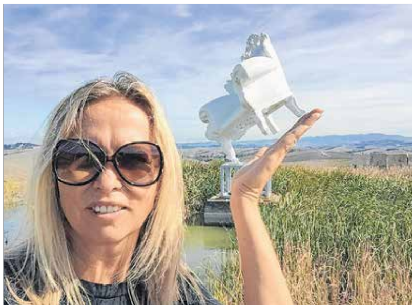
Toszkánában sokkal tovább tart a nyár

Inkább az itthoni, gyerekkori barátságaim erősek. Persze nem mindennapos a kapcsolat, de köztük vannak azok, akikkel egy perc alatt ott tudjuk folytatni, ahol egy-két évvel korábban abbahagytuk. Amikor hazajövök, mindig megpróbálok minél több baráttal találkozni, főleg karácsonykor. De most már a Facebooknak köszönhetően ez is egyszerűbb. Természetesen Olaszországban is sokakkal jóban vagyok, de ők általában felületesebben kezelik a barátságokat. Könnyebben elegyednek veled szóba. Ha bemész egy kávézóba, két perc után már haver vagy, másnap már tudják, hogy mit iszol. Elmondják, milyen szép az idő, merre menj kirándulni, de a közvetlenségük megáll ezen a szinten. A privát szférájukba már nem engednek be. Így hát nem is erőltetem. De van egy-két magyar barátnőm ott is, akikkel rendszeresen találkozunk, munkakapcsolatban is vagyunk.