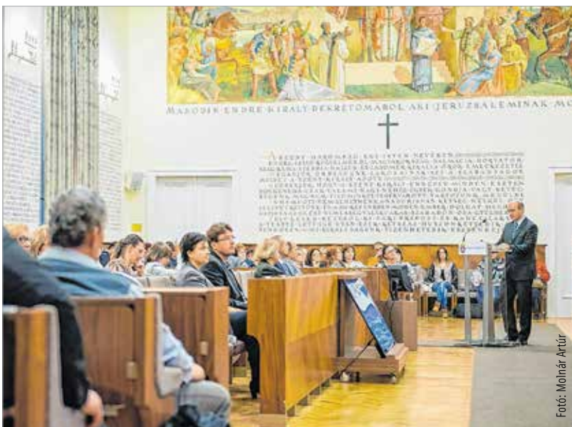
A konferencián több előadást is hallhattak a résztvevők. A Nemzeti Pedagóguskar szerepe és oktatási lehetőségei mellett szó volt a szakképzés aktualitásairól és a közösségfejlesztésről is.