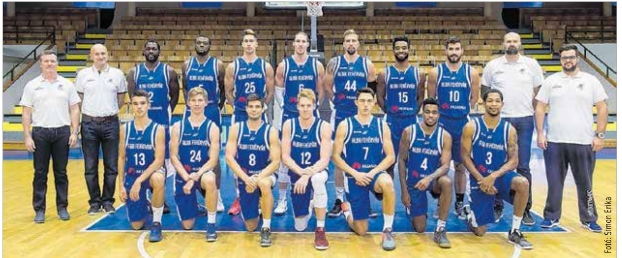
Az idei Alba Fehérvárra is rengeteg mérkőzés vár, kell a bő keret

Az alapszakaszban huszonhat, a középszakaszban nyolc, a rájátszásban tizenkettő. A nemzetközi kupában tízenkettő, a hazai kupában három. Összesen ennyi meccset játszott a tavalyi szezonban a végül bajnok és kupagyőztes, az alap- és középszakaszt is élen záró, és még az Európa-kupában is helytálló Alba Fehérvár. Ez a fejlődés záloga, és ezért jó hír, hogy az új idényben sem lesz sokkal kevesebb mérkőzés, sőt! Az Alba vasárnap a Bajnokok Ligája selejtezőjében játszik az észak Kalev Tallinn-nal vagy a macedón Karpos Szokolival. Jövő kedden Fehérváron lesz a visszavágó, és ha továbbjutnak a mieink, újabb selejtező vár rájuk a török Pinar Karşıyaka ellen. Ez kapásból négy olyan meccs, ami a tavalyi versenynaptárban nem volt, hiszen akkor nem selejtezték Lóránték. Szóval akár még az előző idénybeli hatvanegynél is több mérkőzés várhat az Albára. A csapat mindenképpen felkerül valamelyik európai kupa főtáblájára, ha nem a BL-ben, akkor ismét a FIBA Európa-kupában.