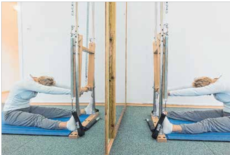
A gerinc nyújtását gépek segítségével is végezhetjük

Egy profi stúdióban vannak csoportos és egyéni órák. A csoportos órákon is csak nyolc-tíz ember dolgozik együtt az oktató irányításával, aki nem tornázik, csak figyeli a vendéget és javít. Az egyéni órák teljesen testre szabottak, pilates gépekkel és egyéb eszközökkel. Mozgásszervi problémákkal először ezt szoktuk javasolni, és a legnagyobb eredmény, amikor a vendég átkerül a csoportos órára.