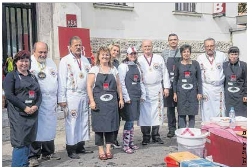
Fehérek és feketék

Idén végérvényesen bebizonyosodott, hogy a lecsófőzés egy közös játék, ahol a füst szötte világban dalsokrokkal, bográcsközelben, az üdvözült gasztromágusok uralta térben egymásra találhat minden jó szándékú ember, kicsik és nagyok. Vargha Tamás honvédelmi miniszterhelyettes kiemelkedő közösségi élménynek tartja a találkozót: „A lecsó ürügy az együttlétre. Egy egyszerű étel, ami veszélyt rejt magában, hiszen könnyű elkészíteni, mindenki ért hozzá. Ugyanakkor lehetőséget nyújt arra, hogy kreatívan, a saját ízlésünk szerint készítsük el. A közösségi élmény az, ami ezt a találkozót különlegessé teszi!” Cser-Palkovics András polgármester köszöntő gondolatsora a múltból indult ki, hogy megérkezzen a jelenbe, és megmutassa a jövőt: „Ez a közösség évről évre osszejön a lecsófőző vigasságokon. Láthatóan