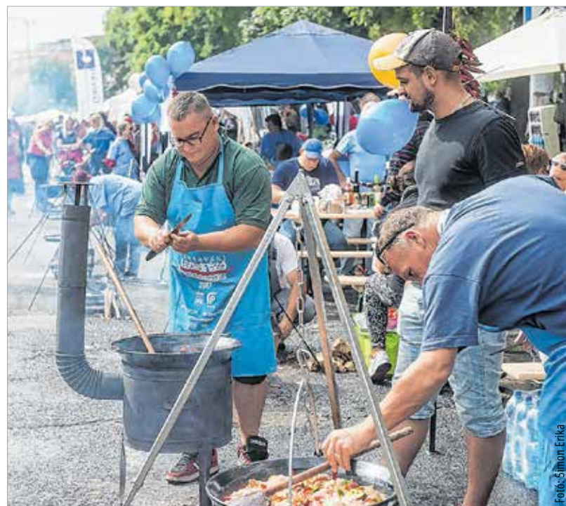
Füst szötte csodanap