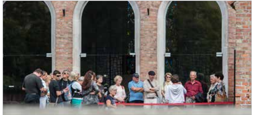
A koronázási bazilika története címmel kiállítás nyílt a Nemzeti Emlékhelyen. A tárlat interaktív módon, gazdag látványelemekkel mutatja be az egykori koronázótemplom történetét a kezdetektől napjainkig.

Hétvégén az összes székesfehérvári kiállítóhelyet ingyenesen lehetett látogatni, és érdemes volt este is a belvárosban sétálni, hiszen az érdeklődők egyedülálló fényfestést láthattak a mauzóleum homlokzatán. A tízperces, három dimenziós animációs film az egykori koronázótemplomot elevenítette meg, életre keltek a Szent István Király Múzeumban őrzött kőtöredékek, de megjelent III. Béla király arc-rekonstrukciója is.