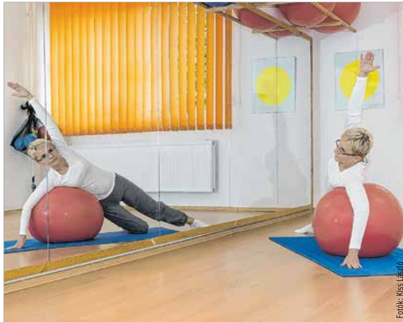
Az egyéni órák teljesen testre szabottak

Joseph Pilates közel száz évvel ezelőtt kidolgozott egy több mint háromszáz gyakorlathal álló edzéssorozatot, ami megerősíti a hátizmokat, hasizmokat, farizmokat – ez biztosítja a megfelelő tartást a gerincoszlopnak. A gyakorlatokat részekre lehet bontani, ezért mindenki számára elvégezhető. Természetesen egy kezdő vendég esetén állapotfelmérést végzünk, megbeszéljük, hogy mik a problémák, és ezeket figyelembe véve alakítjuk ki a gyakorlatsort. A legszebb a dologban, hogy a