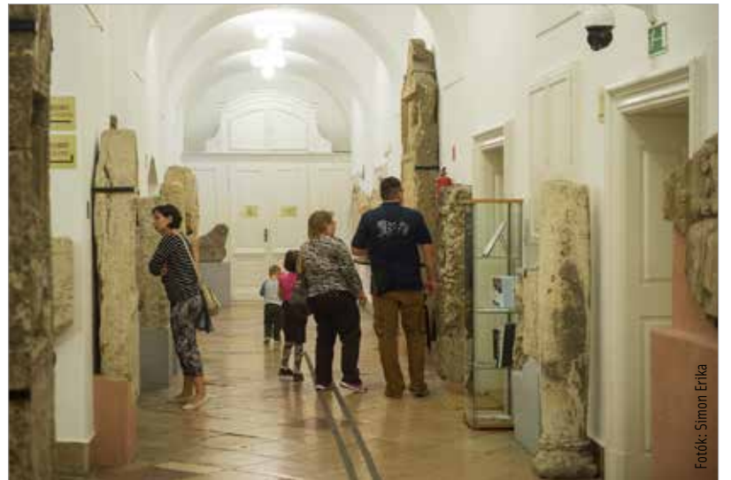
A fehérváriak és az ide látogatók örömmel fogadták, hogy egész hétvégén nyitva álltak a Szent István Király Múzeum kiállítóhelyei. Emellett olyan különleges helyeket is felkereshettek, mint például a Nemzeti Emlékhely, a Hiemer-ház, az Árpád fürdő, a Szent Anna-kápolna, a Rác templom vagy a Fejér Megyei Levéltár.