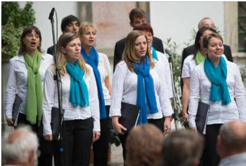
A Vox Mirabilis Kamarakórus szombaton este az Ars Sacra Fesztivál részeként, a nyitott templomok napján adott koncertet a múzeum díszudvarán. Lengyel zeneszerzők művei fogták keretbe az előadást, mindkét mű a békeért felcsendülő könyörgés volt.