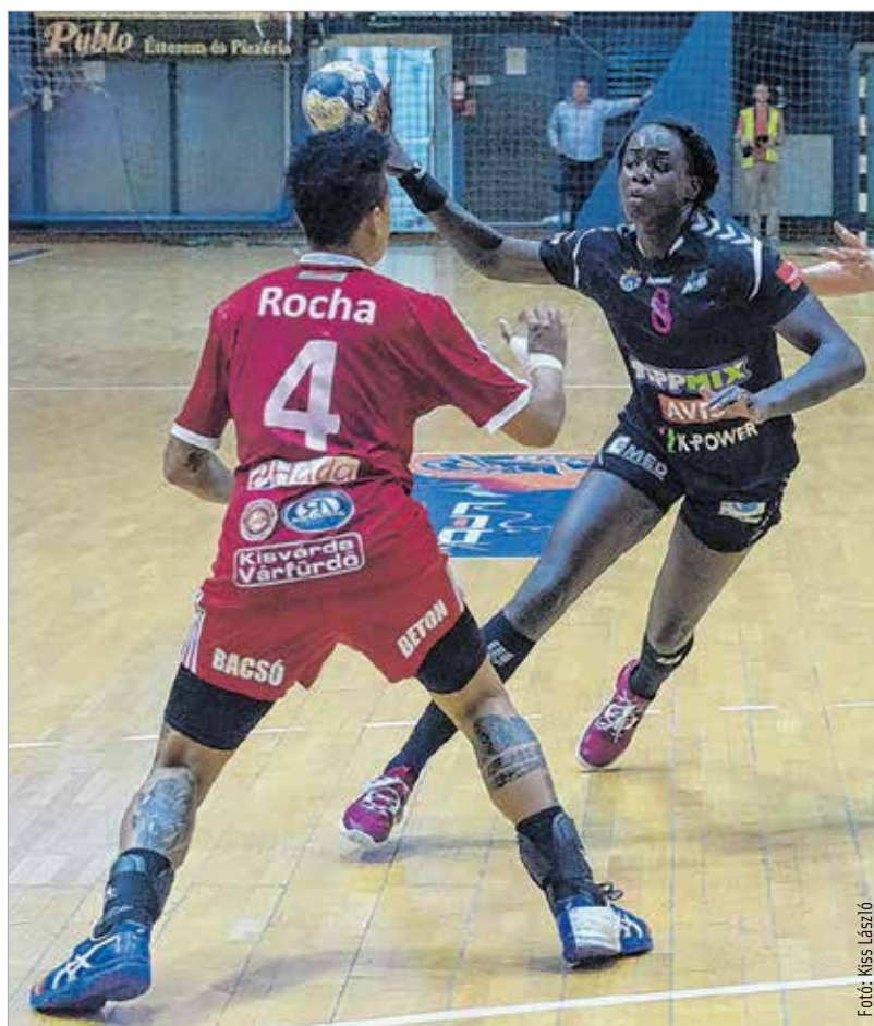
Menyéknek a Kisvárdá ellen nem, a Kecskemét ellen összjött az első idei győzelem