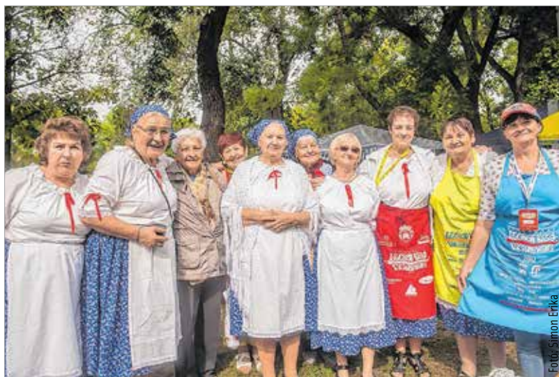
Együtt a nagy generáció