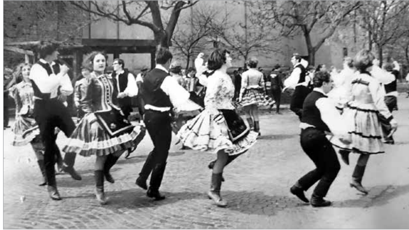
A felsővárosi néptáncosok rendszeresen felléptek a május elsejei műsorban