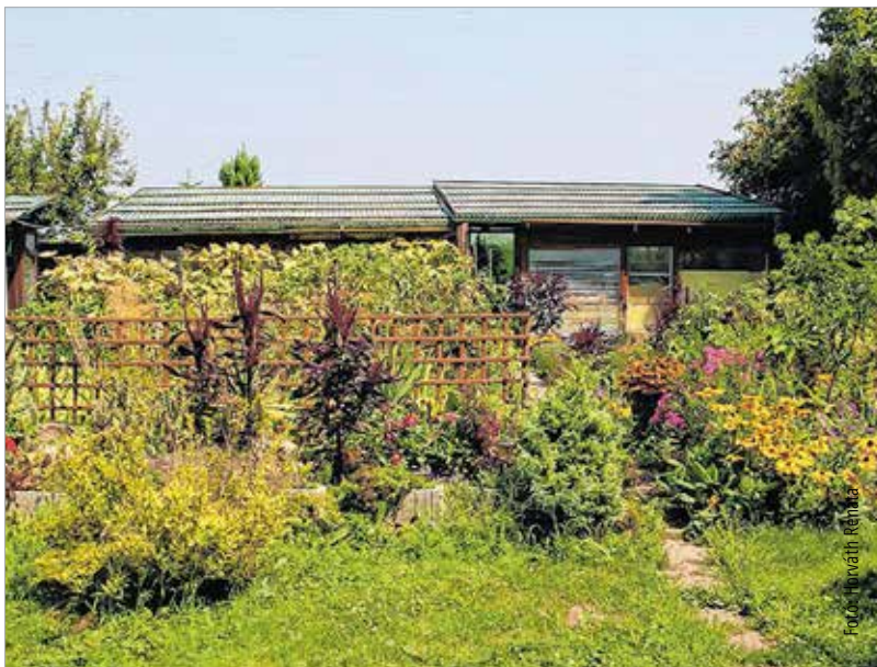
A kert végében álló üvegházat nyáron szinte eltakarják a növények

Akadnak követői is ebben a szenvedélyében?