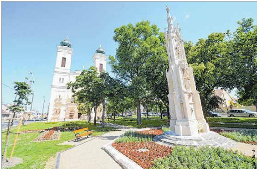
Ezen a téren avatják csütörtökön a második világháborús felsővárosi áldozatainak emléket állító szobrot

„A csütörtöki emlékműavatás ünnep és gyász egyszerre. A Doni Bajtársi és Kegyeleti Szövetség magától értetődő természetességgel állt az ügy mellé, megtisz-