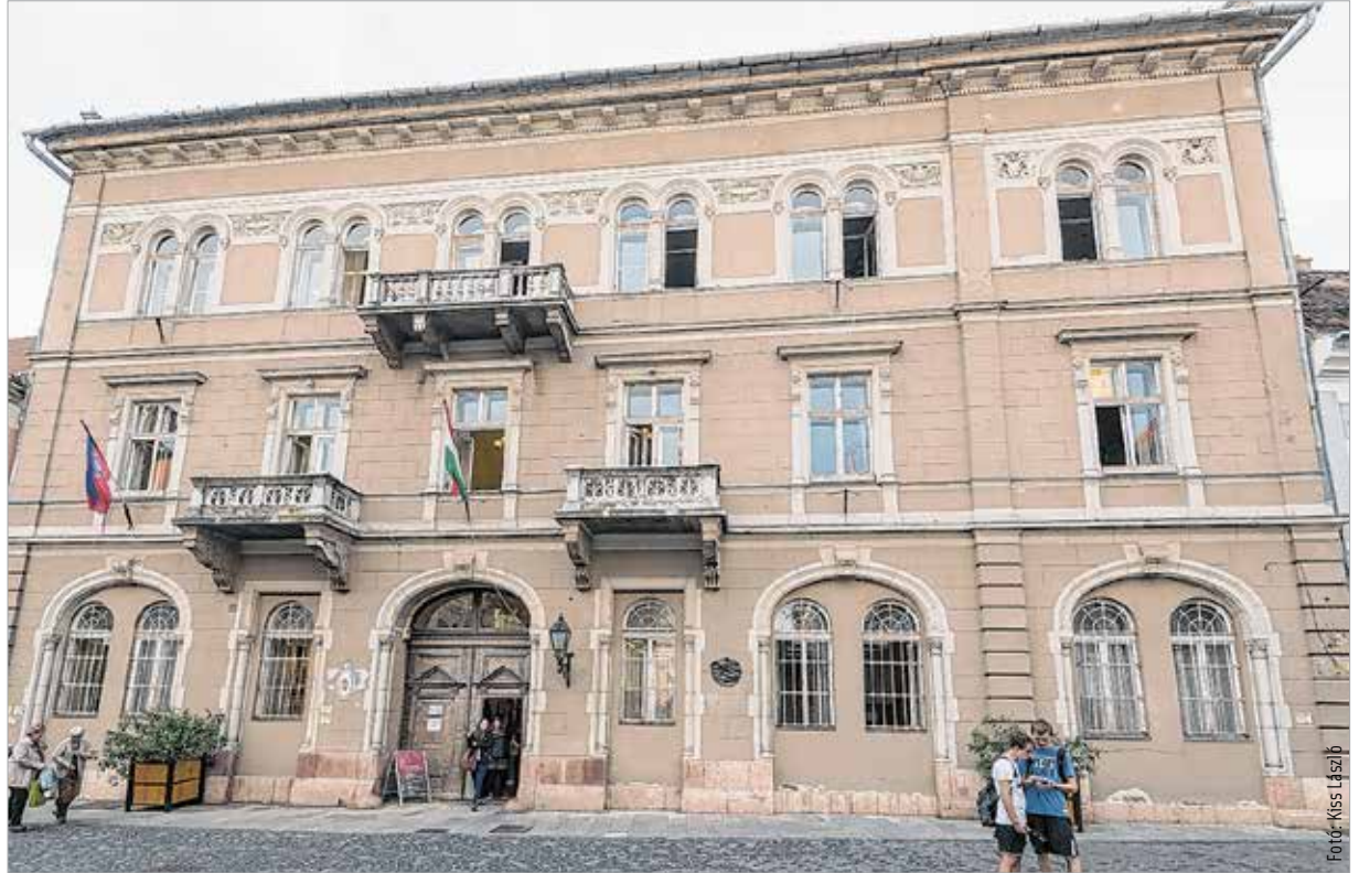
Ákár költözik a zeneiskola, akár marad, az épületet biztosan nem értékesítik. A város főterén nem kíván ingatlant eladni az önkormányzat.

Még semmilyen döntés nem született. A zeneiskola felújítására ebben a pillanatban nem látunk forrásokat – itt is több milliárd forintról beszélünk! Ha véglegesen eldőlt, hogy a Hermann költözik, akkor fogunk foglalkozni a zeneiskola épületével. Ebben az esetben szeretnénk olyan funkciót találni az épületnek, ami továbbra is városi közösségi tulajdonban tartja azt. A város főterén nem kívánunk ingatlant eladni, ezt sem. Az elmúlt években bizonyítottuk, hogy nem ez az a közgyűlési többség, amelyik a város vagyonát értékesíti és feléli. Ez a közgyűlési többség vagy visszavásárol, vagy megvásárol, és növeli a város vagyonát. Egy ilyen értékes épületet nem akarunk értékesíteni, akkor sem, ha más funkciót találunk a számára. Szállodáról is lehetett hallani.