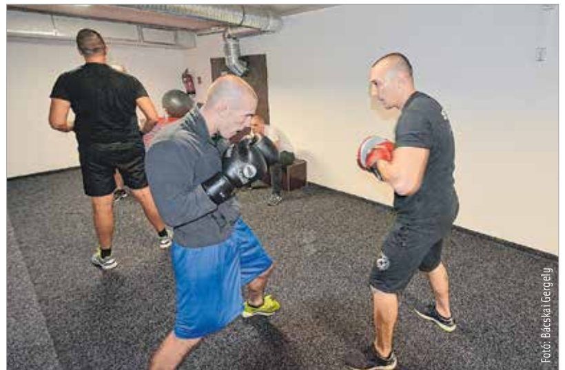
Hamarosan új edzőteremben készülhetnek a VT Vasas bunyócsai

Ha a klub nevét hallja valaki, nagy valószínűséggel eszébe jut 1941. és a Videoton jogelődjét jelentő labdarúgócsapat alapítása. Nem véletlenül: „A névváltoztatás oka egészen egyszerűen az volt, hogy az egyesületünk alapjait Vidi-szurkolók tették le. Először egy kis baráti társasággal kezdtünk boksizolni, és a Vörösmarty Általános Iskolában tartottunk edzéseket, majd a Prohászka úton béreltünk egy termet. Szépen fejlődöttünk, és hittünk abban, amit csináltunk.”