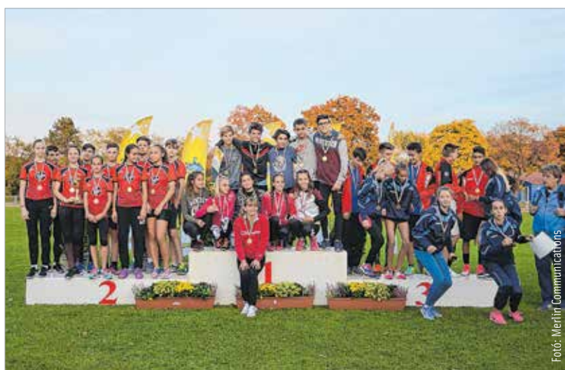
A 10x200 méteres váltófutás dobogójának tetején a Hétvezér Iskola csapata