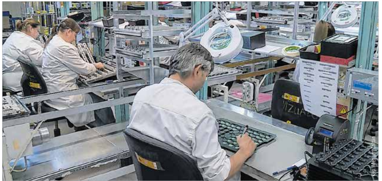
Szorgalom és kitaró munka – ez a Videoton sikerének titka