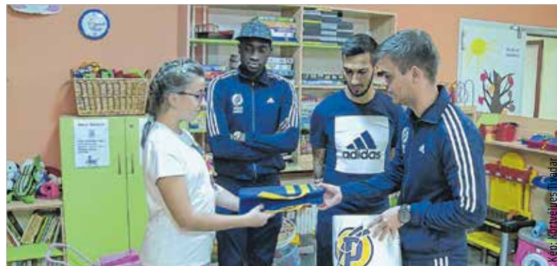
A Puskás Ferenc Labdarúgó Akadémia NB I-es csapatának képviselői látogattak el a kórház újszülött- és csecsemőosztályára. A focisták nem érkeztek üres kézzel, fonalakat és egyéb ajándékokat hoztak a kórháznak és az apróságoknak.