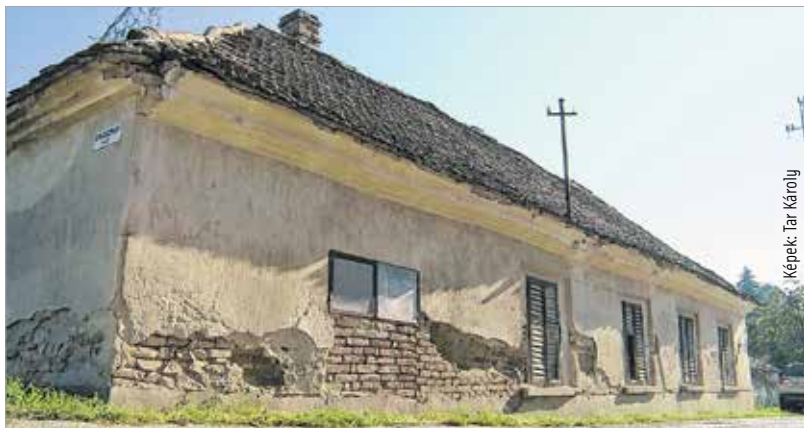
Tudjon meg többet az Almási-pincéről! Nézze meg videónkat a Fehérvár Televízió honlapján, és kattintson az fmc.hu oldalra még több érdekességért és helyszíni fotókért!