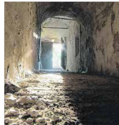
Rejthet még titkot a különleges hangulatú pince

Az Almási-pince több száz éves. Biztos, hogy az 1700-as években volt már itt pince. Az épület préházként, később pedig nagysága alapján valószínűleg rövidebb-hosszabb ideig lakóházként is szolgált. 1829-ben Wüstinger József felmérte az Öreghegyet, így a préházak, a telkek szinte centire pontos meghatározással térképre kerültek. Mintegy három hektáros birtok volt ez annak idején, s mint Öreghegyen mindenütt, itt is volt szőlő, borászat, sőt valószínűleg gyűjtőpincéként is működhetett a birtok annak idején. A ház környéke elvadult, de ha végigsétálunk a környéken, érezzük és tapasztaljuk azt a különleges atmoszférát, ami körülöleli a helyet. Maga a pince jó állapotú, egyetlen helyen vár javításra, ugyanis a két pincszakaszt összekötő rész részlegesen beszakadt. A ház állapotáról azonban ez már nem mondható el: az épület beázik, teteje beszakadt.