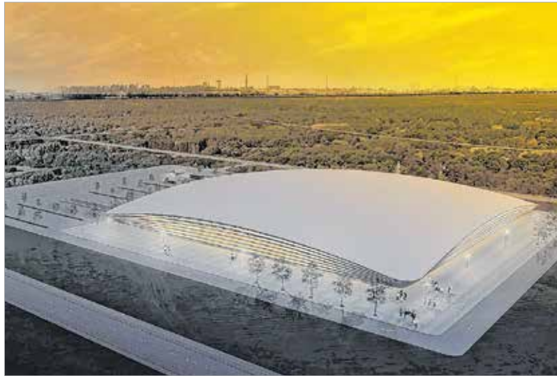
A látványterv alapján impozáns építménnyel gazdagodhat Fehérvár