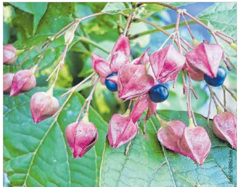
Télen-nyáron virágzik valamelyik növény

Rendelek magokat az interneten is. Előfordul, hogy a trópusi