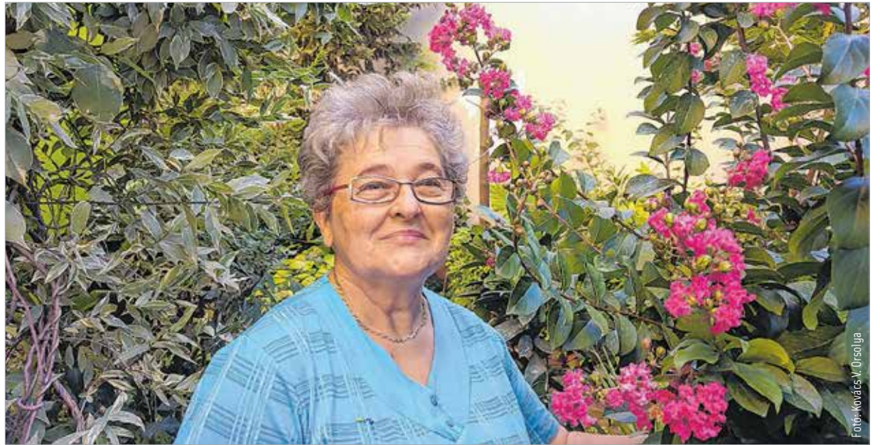
Irén és imádott kertje