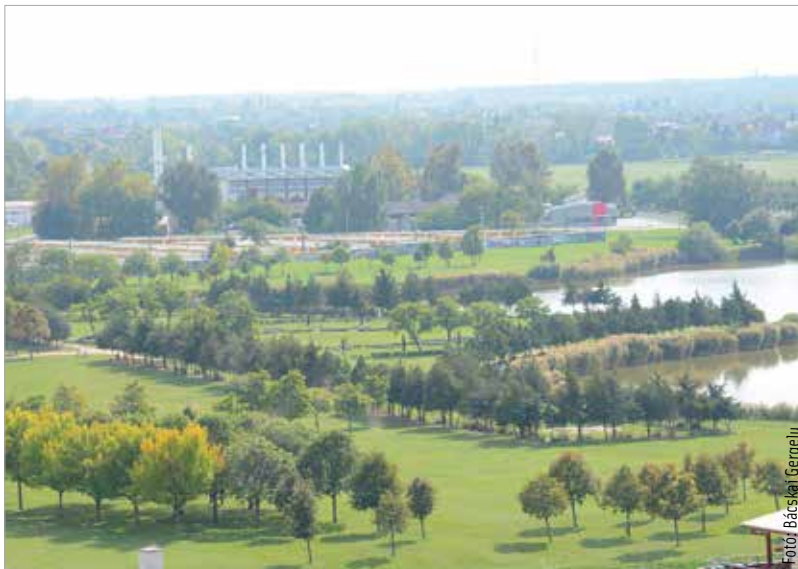
A három ütemből álló program az Alsóvárosi réten, a palotavárosi tavak mögött valósul meg. Pihenőparkokat, szabadidős területeket alakítanak ki, és egy erdőszávot is telepítenek.

A kormány a megyei jogú városokkal, köztük Székesfehérvárral kötött együttműködést a Modern Városok Program keretében. A legnagyobb összeget, mintegy tizenhatmilliárd forintot Székesfehérvár kapja.