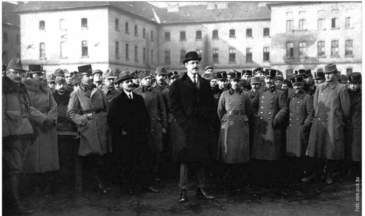
Károlyi Mihály, mint honvédelmi miniszter az 1. honvéd gyalogezrednél. Budapest, 1918.

lemondó nyilatkozattal valami végleges és visszafordíthatatlan dolog történik. Kétségbeesett gyorsasággal a megyegyűléshez fordult, hogy indítványt terjesszen elő a törvényes jogállapot, azaz a királyság visszaállítására. A megyegyűlés azonban süket csenddel válaszolt. Értve a finom jelzésekből, mely szerint a főispánnal szemben