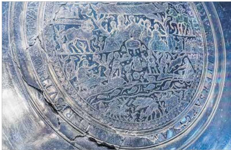
Ez az úgynevezett Seuso-tál. Átmérője mintegy hetven centiméter, súlya megközelíti a kilenc kilogrammot. Itt olvasható a Pelso szó is, ami a Balaton latin neve. Ezen a tálon szerepel a készlet tulajdonosának, Seusónak a neve.

A Magyar Nemzeti Múzeum szervezésében indult országos körútra a páratlan lelet. Elsőként Székesfehérváron nyílt meg a kiállítás. A megnyitón Vargha Tamás, a Honvédelmi Minisztérium miniszterhelyettese, a város országgyűlési képviselője köszöntötte a látogatókat: „Sokan vallják magukénak a Seuso-kincset, de Magyarország sohasem mondott le arról, hogy ez magyar tulajdon. Magyarországon találták meg, és aztán 2014-ben a magyar kormányhoz került, és azóta a magyar kormányhoz tartozik, és a kincset visszaszerezte.”