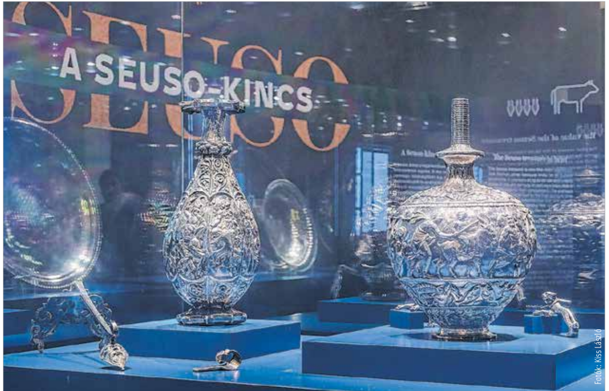
Az ezüstműves remekművek saját korukban összesen 2040 solidust érthettek. 5 hogy ez mit is jelentett akkoriban? A 4. században egyetlen solidusból 350 liter búzát vagy 109 liter bort lehetett vásárolni.

„A Seuso-kincs Európában a legjelentősebb római leletgyűjtések közé tartozik. Olyannyira a legjelentősebbek közé, hogy a súlyát és az értékét tekintve az első háromban szerepel, míg a művészeti értékét tekintve vetekedik bármelyikkel, igényessége, díszítése önmagáért beszél. Ez a kiállítás azért is fontos az egész ország számára, mert azt mutatja be honfitársainknak, milyen páratlan értékekkel rendelkezik az ország.” – fogalmazott Varga Benedek, a Magyar Nemzeti Múzeum főigazgatója.