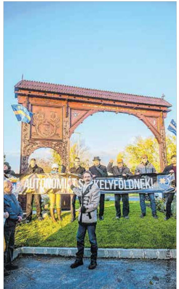
A székelyek autonómiatörekvéseiért Fehérváron is kiállnak

Székesfehérváron a város székelykapujánál rendezett találkozón a MAÉRT Szórvány Szakbizottság, a Fejér Szövetség és a Hatvannégy Vármegye Ifjúsági Mozgalom aktivistái tettek hitet a székely autonómia mellett. A résztvevők a maroshegyi találkozóhoz követően a Szabadművelődés Házában ünnepi műsort hallgathattak meg, melyben az ősi székely népbaladák mellett Wass Albert gondolataival köszöntötték székely testvéreiket.