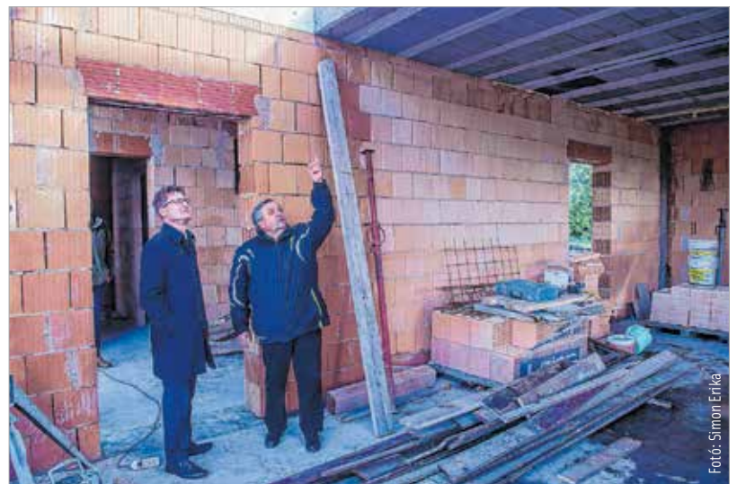
A közösségi központban kap helyet a kisgyermekek kézműves műhelye és a kiállítótér is