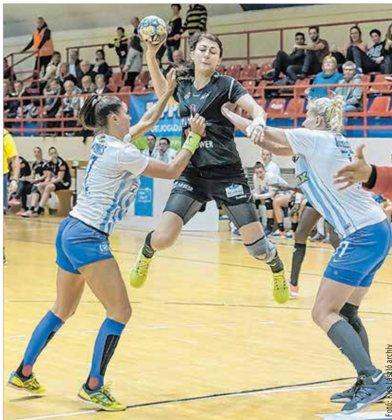
Legutóbb, a kupában simán verte az Alba az MTK-t