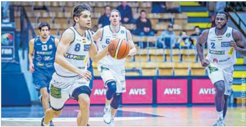
Az utolsó ideji meccsen is kell még a lendület Kovácstól, Kellertől, Harristól és a többiektől