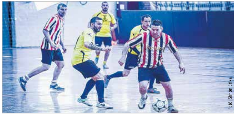
Az öregfiúk sem öregek, elvégre harmincnégy év az alsó korhatár

VOK-ban, nyolc csapat részvételével. A fehérvári kispályás futball ismert arcai mellett láthattunk a parketten szabadbattyáni, agárdi öregfiúkat, és érkezett csapat Székelyföldről is. Ezt követte az RBD-szurkolói kupa, melyen nyolc csapat mérte össze tudását, köztük a Debrecen – és természetesen a házigazda VBKE csapata. A szerdai programban összesen negyven meccs szerepelt, plusz az említett gálamérkőzés, és még büntetőrúgó-versenyt is rendeztek. Csütörtökön kezdődik a huszonnyolc csapatos nemzetközi torna. A négy nap alatt hatvannyolc csapat mintegy nyolcszáz játékos összesen százhuszonöt mérkőzést játszik. A torna kísérőrendezvényeiről lapunk egészségügyi és programajánló rovatából tájékozódhat!