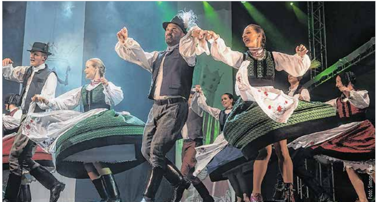
A nemzetközi néptáncfesztivál két évtizede igazi sikertörténet