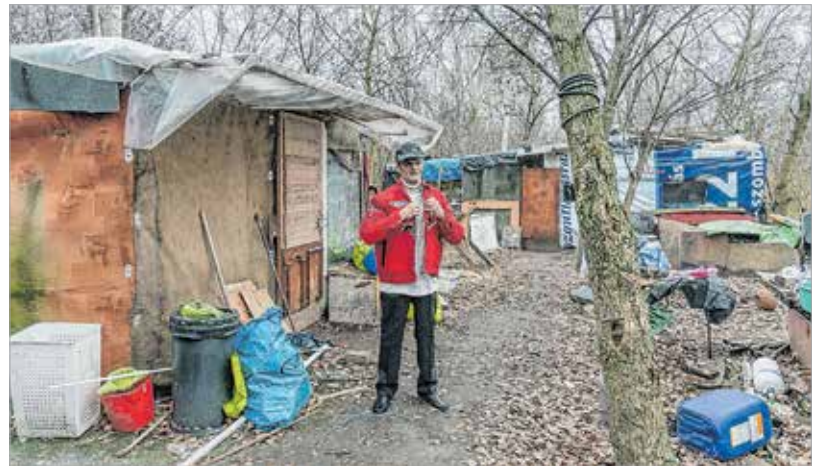
Innen indulunk, ide is térünk vissza

Van, aki tizenhat éve él az erdőben, van, aki néhány hónapja költözött ide. Marikák a Mura utcában laktak egy drogfüggő férfi melletti lakásban. Állandó rettegésben éltek, mígnem egy nap a férfi baltával verte szét az ajtót. Ekkor döntöttek úgy, hogy az életük többet ér a lakásnál, biztonságosabb lesz a a