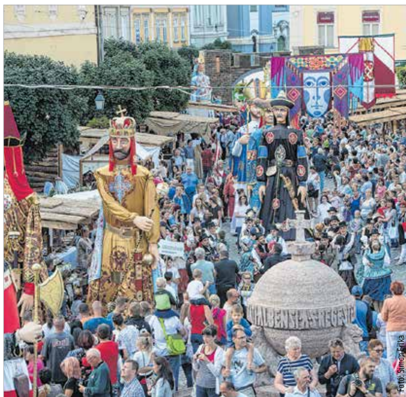
A Királyi Napok a város legfontosabb rendezvénye

„A programszervező létrehozása jó döntésnek bizonyult. A városban élők tudják, hogy kihez fordulhatnak, ha kérdéjük van, illetve nagyon sok ötlettel keresnek meg bennünket. Költségvetési szempontból is racionális