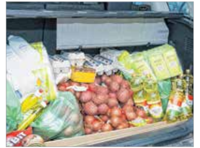
Hasznos dolgok az ünnepekre

Amikor megszületett a nagybevásárlás ötlete, megkerestük az egyik nagyáruházat Fehérváron, akik azonnal igent mondtak a nyilvános szereplésre, és a karácsony előtti véghajrában is engedélyezték a Fehérvár Média centrum játékonysági akcióját. Az Auchan még