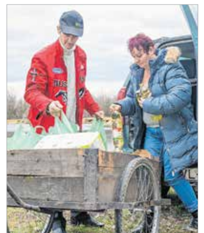
Terepjáró helyett taliga – az erdőben ez a leghasznosabb szállítóeszköz