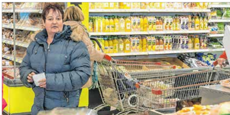
Először a krumpli került a kosárba

„Ha ott kiesik a zseemből hús forint, a földön már nem koppan. Sajnos lopnak egymástól a lakók, ezért