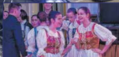
Más, mint egy hétfévi buli 6. oldal