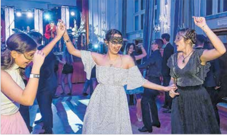
Induljon a banzáj!