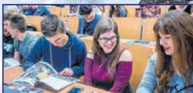
A jövő a gyakorlatorientált képzésé 4. oldal