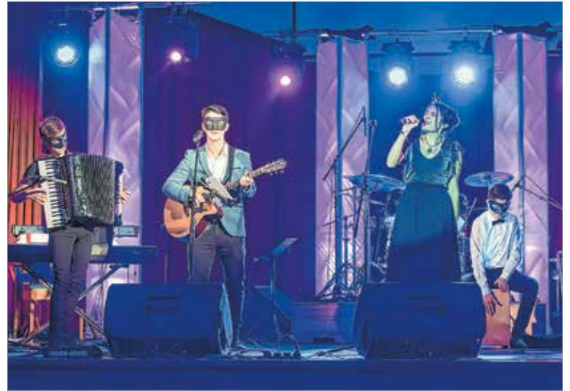
Az Arany Dobverő díjas 21 Gramm koncertje hangolta a fiatalokat