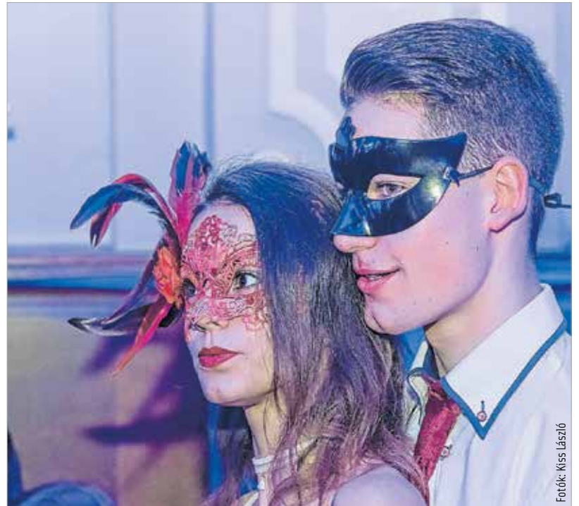
Idén az álarc is a dresscode-hoz tartozott