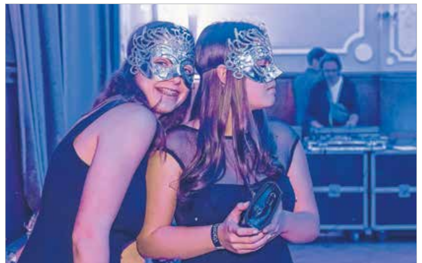
Egyenmaszk és bolondozás