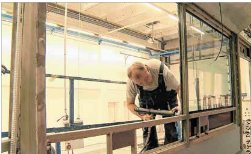
Dupla üveget kap a honvédség számára készülő busz