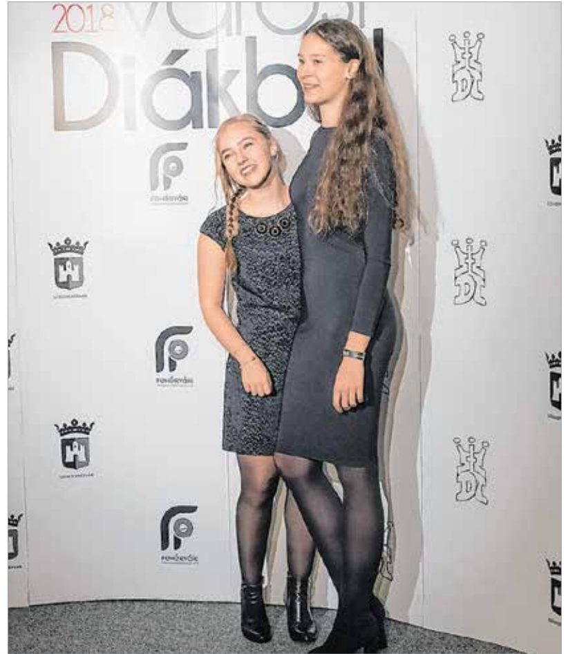
Fotósarok is várta a fiatalokat