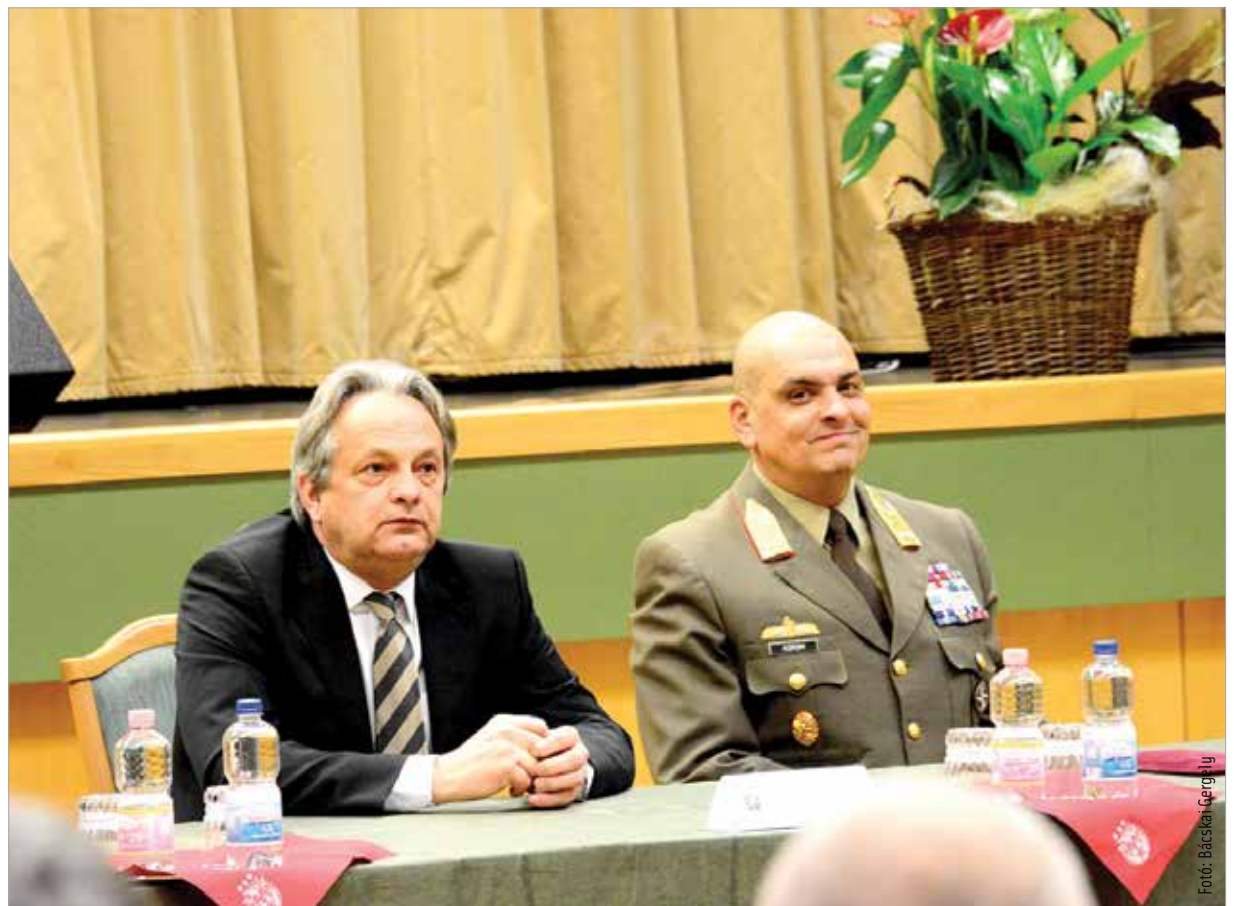
Az állománygyűlésen elhangzott: egy hadseregnek ahhoz, hogy el tudja látni feladatát és a legmagasabb szinten garantálja a biztonságot, folyamatos felkészülésre, fejlődőképességre, modern technikai eszközökre van szüksége

Huszár János altábornagy helyét – aki a jövőben a Honvéd Vezérkar főnök-helyetteseként teljesít szolgálatot – Korom Ferenc vezérőrnagy veszi át, aki eddig a vezérkar hadműveleti csoportfőnökségének főnöke volt. Korom tábornok bemutatkozó beszédében elmondta: „Csapatban lehet csak eredményeket elérni, az egyes harcosok, az egyes emberek egyéni érdekeinek képviselete manapság nem működik. Egymásért dolgozunk!”