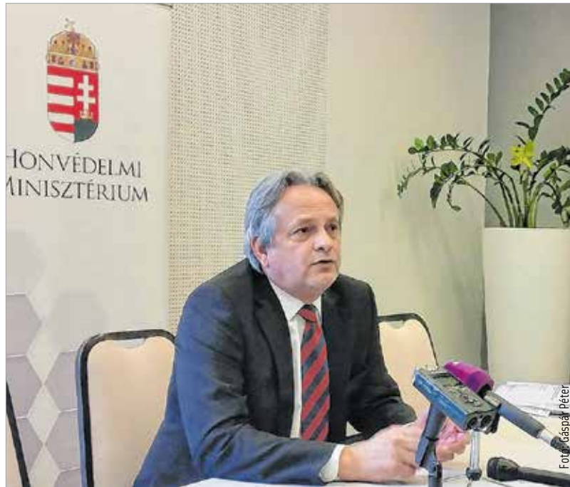
Vargha Tamás szerint az elmúlt néhány évben Közép-Európa és az egész kontinens biztonsági környezete jelentősen megváltozott

A tavaly ősszel megrendezett V4 Senior Body Meeting után ismét Székesfehérváron tárgyalt biztonsági kérdésekről Ondrejcsák Róbert, a szlovák védelmi minisztérium államtitkára. A magyar-szlovák vegyes bizottság ülésén Vargha Tamás miniszterhelyetttel a globális biztonsági kihívásokról és a NATO szövetségi rendszerében megvalósítandó feladatokról is tárgyaltak. Az ülés után Vargha Tamás elmondta: úgy értékelték, hogy az elmúlt néhány évben Közép-Európa és Európa biztonsági környezete jelentősen megváltozott, ami cselekvésre sarkallta a két országot és a visegrádi négyeket is. Kiemelte: szlovák kollégájával egyetértettek, bizakodásra adhat okot, hogy az Európai Unió is