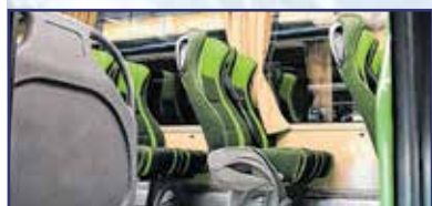
Újra szárnyal az Ikarus 2. oldal