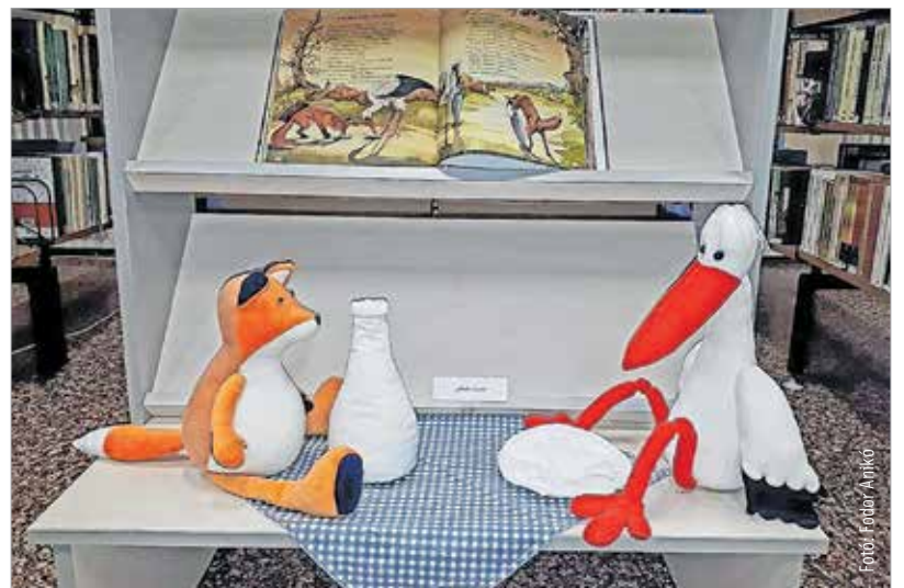
A róka és a gólya mese kézzel készült illusztrációja

S hogy miért jobb egy kézzel készült játék, mint a boltban megvásárolható? Erre a kérdésemre így válaszolt: „A gyártósorokon készült baba lehet bármilyen bájos és szép, akkor is csak a gépek jutnak eszünkbe és a sorozatgyártás. Ez olyan személytelenné teszi a játékokat! Amikor én készítek babát, akkor fel vagyok villanyozva, örömet érzek, és csak a kezem között alakuló kis lényeml törődöm. Azzal, hogy milyen legyen a formája, nagysága, arccocskája, ruházata. Ha nem tudnék varrni, akkor csak kézzel készített babát vásárolnék, mert abban van élet. Erződik rajta, hogy milyen figyelemmel, szeretettel készült.”