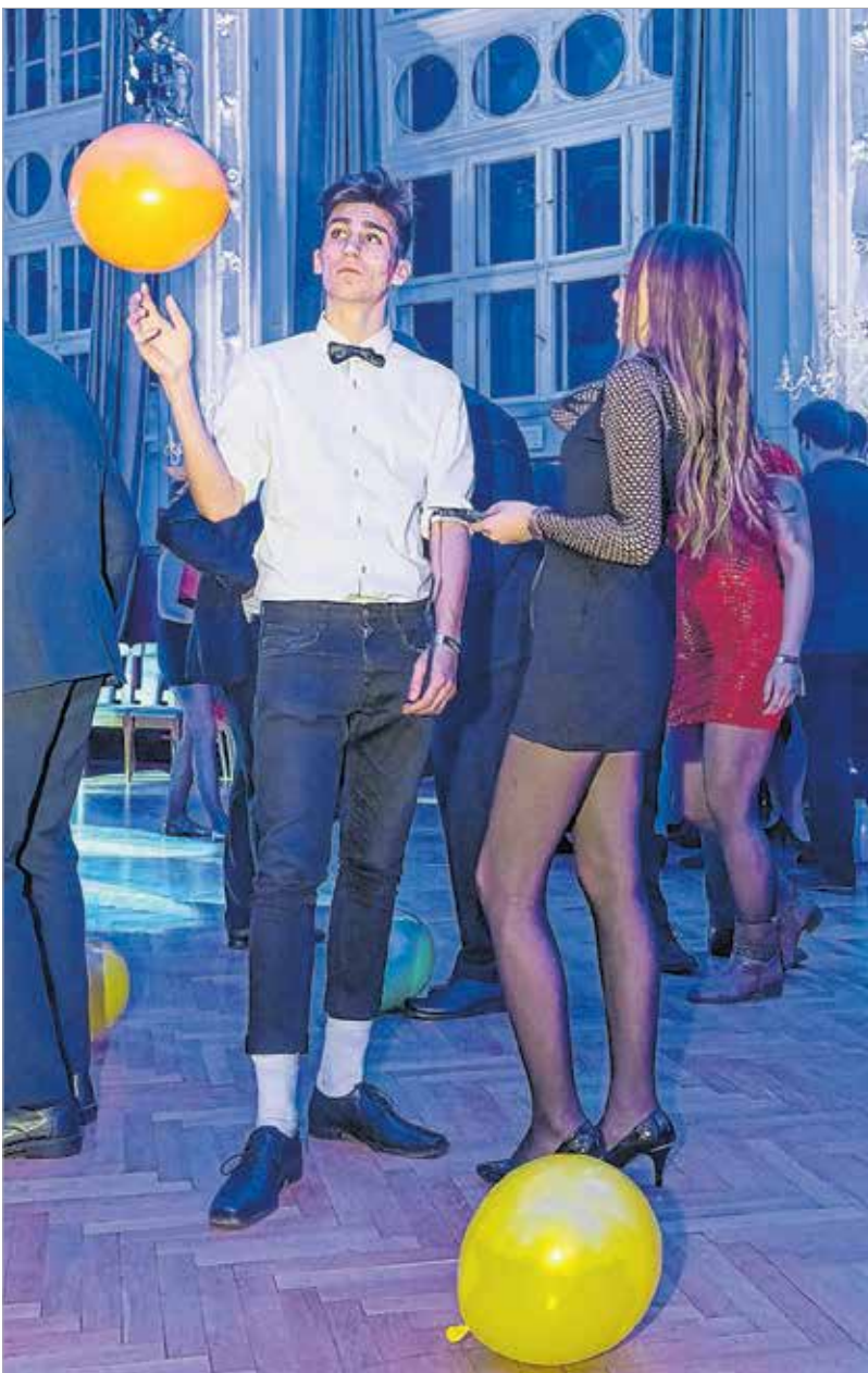
Michael Jackson után szabadon...