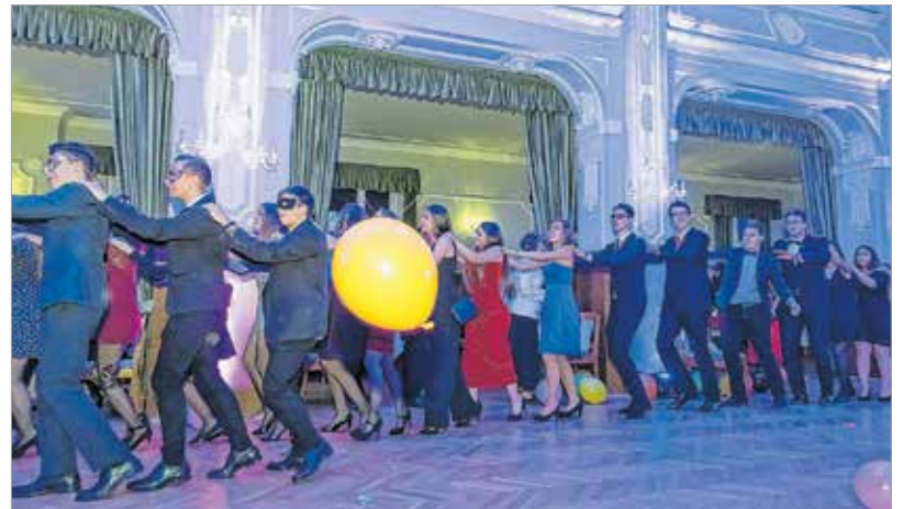
A vonat nem vár, a lufi is száll...