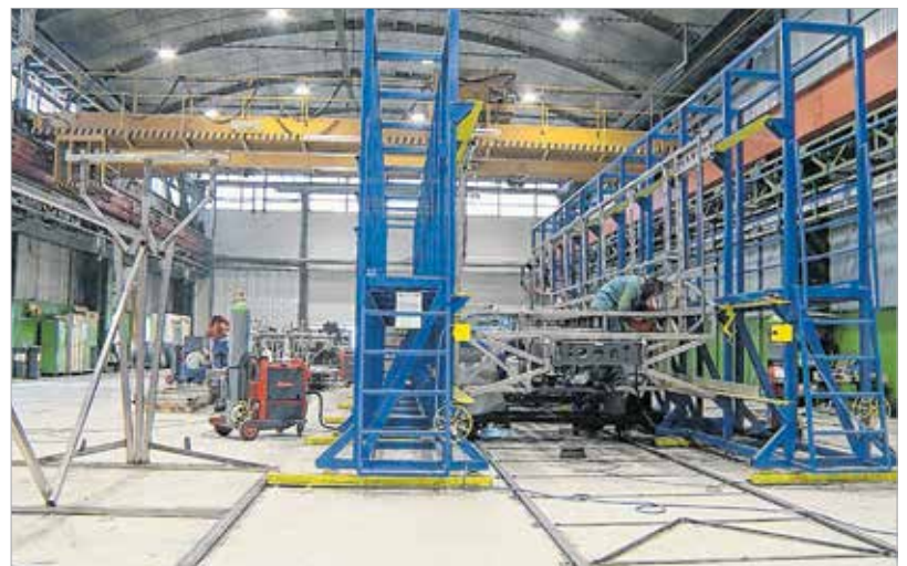
Folyamatos a munka az Ikarusban, itt éppen a helyben gyártott elemek összeillesztését végzik a szakemberek

„Olyan katonai buszok gyártását kezdjük meg, melyek NATO-kompatibilisek, alkalmasak csapatszállításra. Egész pontosan ezek a katonai buszok multifunkcionális buszok, tehát viszonylag rövid időn, két órán belül átalíthatók más üzemmódba. Vagy arra, hogy katonákat, esetleg sebesülteket szállítson, vagy arra, hogy bizonyos csapat-