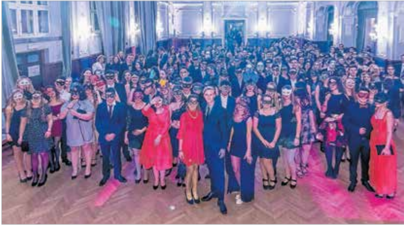
Több mint száz fehérvári középiskolás szórakozott együtt