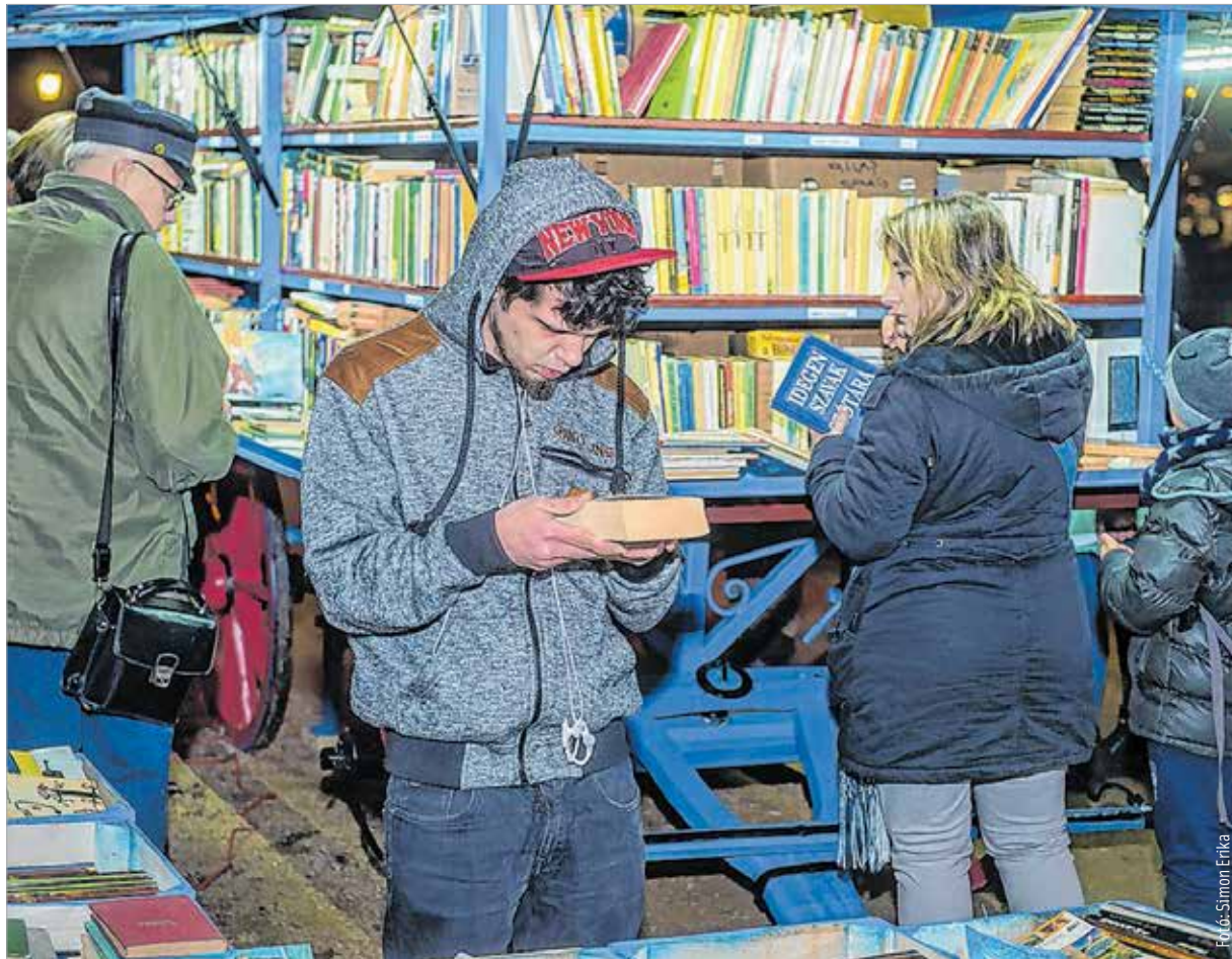
Az átalakított szekeret Erdélyből hozták. Van már könyves szekér Szekszárdon, Veszprémben és Budapesten is.

vásárolta meg: „Már diákkoromban szerettem verset olvasni és mondani is, ez egy régi szerelem. Ma már kevesebb időm van erre, de régebben sokat olvastam angolul is, nagyon szerettem például John le Carré klasszikus kémtörténeteit. A magyar irodalomból pedig József Attila, Ady Endre és Pilinszky a kedvencem.” A megnyitó közben elkezdődött: „Különösen családi körben nemesül igazán közösségi élménnyé az olvasás. Magam is – többgyermekes édesapaként – szívesen olvasok gyermekeimmel jól ismert meséket, történeteket. Jó átélni együtt újra és