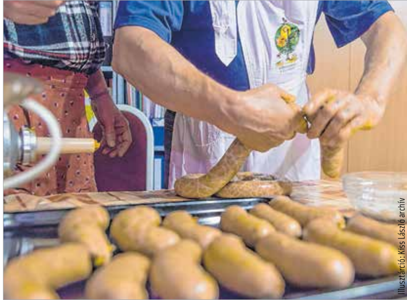
A kezeletlen húskészítményekkel nem árt az óvatosság!

Különleges esetekkel is találkozott: „Egy ételmérgezés volt. Egy nagyon veszélyes kórokozó állt a háttérben, az idősek hurkamérgezésnek ismerik a betegséget. Jellemzően a hőkezeletlen húskészítményekkel és konzervekkel terjed leginkább.” – nyilatkozta lapunknak Müller Cecília megyei