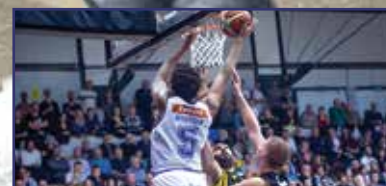
Vasnál erősebbek 29. oldal