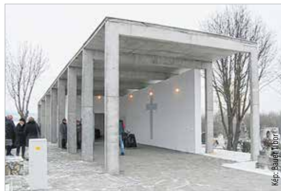
Kép: Baurei Tibor