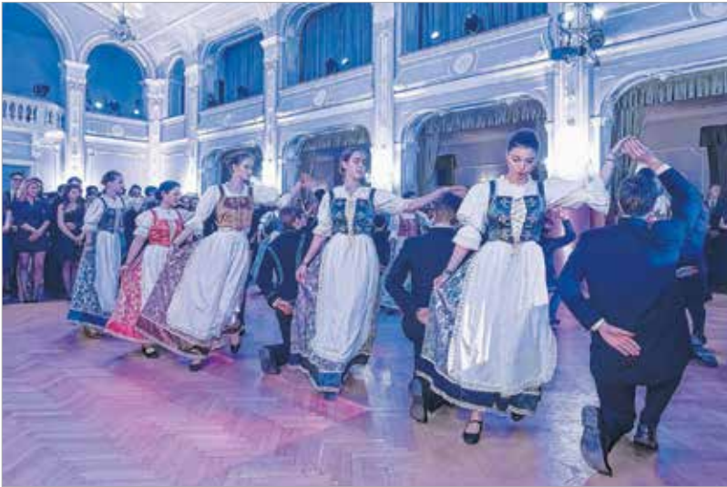
Nyitótánc Székesfehérvári Diákkanás módra

Pénteken tartották a negyedik Városi diákballt. A Székesfehérvár különböző iskoláiba járó diákok a báli hagyományoknak megfelelően, elegáns körülmények között szórakoztak a Szent István Hitoktatási és Művelődési Házban.