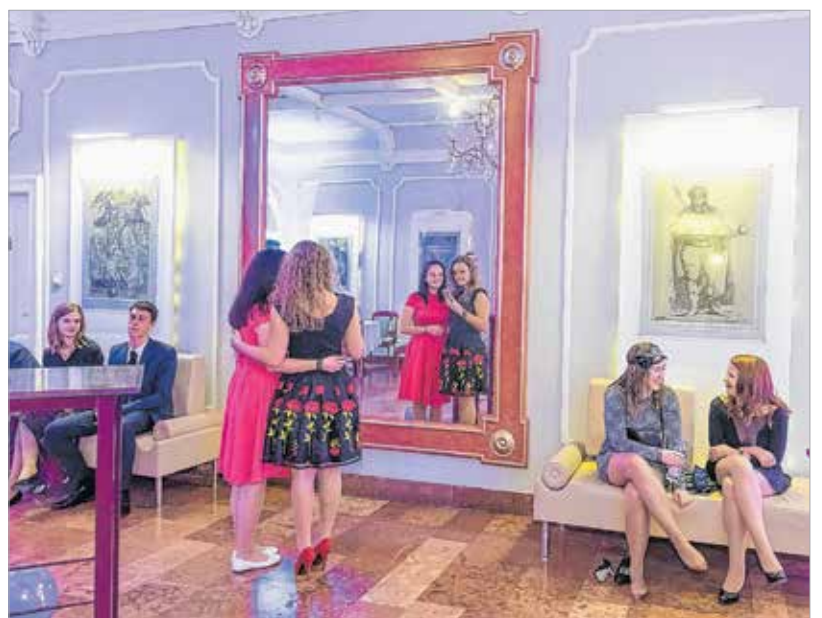
Egy gyors sminkellenőrzés