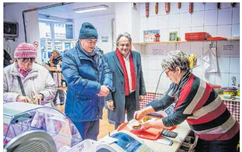
Zöldnél zenét és pezsgőt is kaphatott az arra tévedő