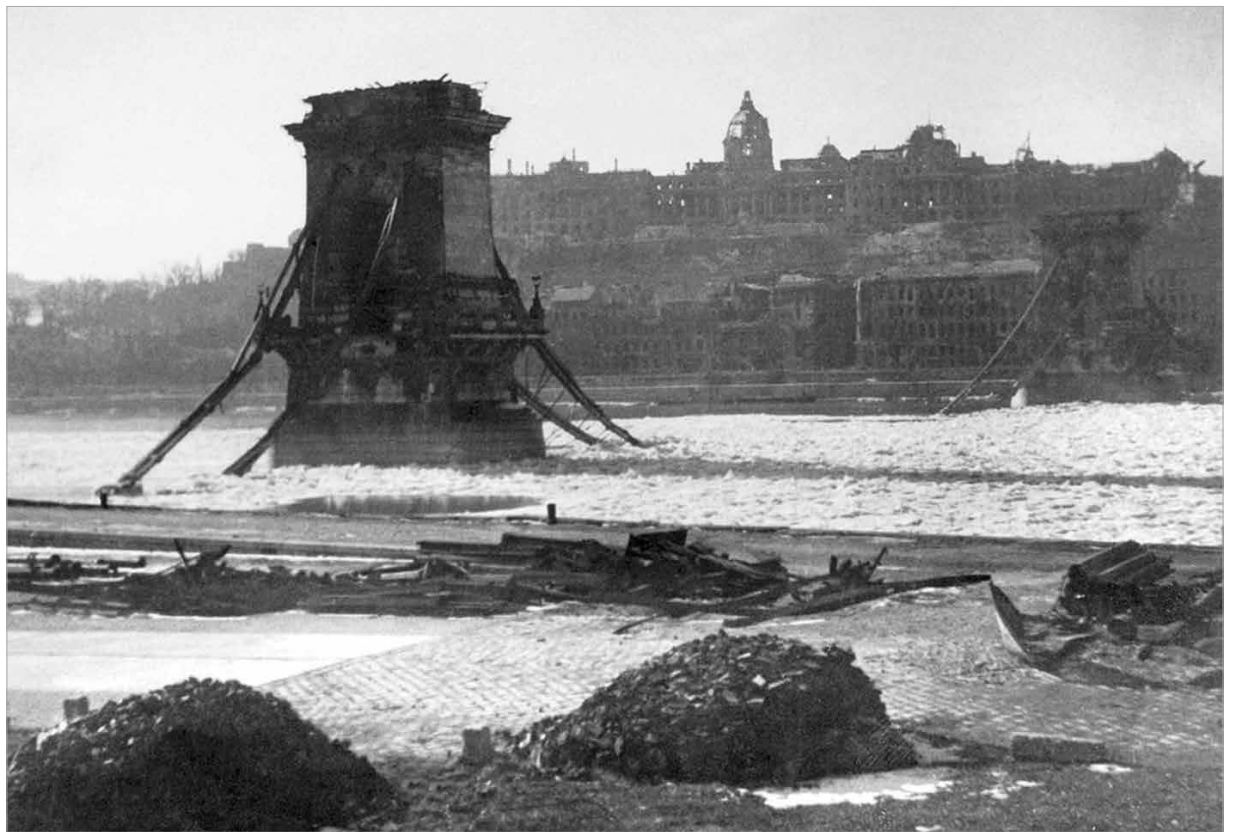
A felrobbantott Lánchíd, háttérben a szétlőtt várnegyed