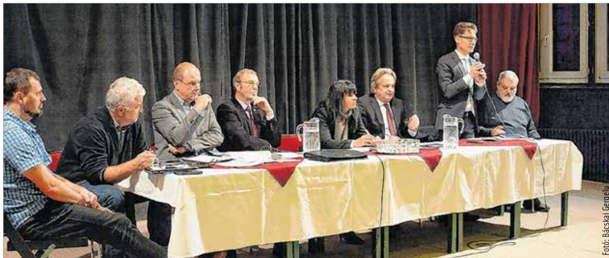
Östör Annamária és Horváth Miklós Csaba öreghegyi önkormányzati képviselők mellett Vargha Tamás országgyűlési képviselő és Cser-Palkovics András polgármester is válaszolt a lakók kérdéseire

Cser-Palkovics András arról is beszélt a lakossági fórumon, hogy zajlik a város 2018-as költségvetésének tervezése, amit várhatóan a február 9-i közgyűlés tárgyal majd. Székesfehérvár gazdasága jó évet zárt 2017-ben, ami azt is jelenti, hogy az önkormányzatnak van mozgásteret és fejlesztési lehetősége, továbbá érezhető lesz még 2018-ban is az adóssághozsólidáció hatása. Mint mondta, állami és uniós források is rendelkezésre állnak 2018-ban városi fejlesztésekre. Az idén várható öreghegyi útfelújítások közül kiemelte a Fiskális utat, ami a városrész csapadékvíz-elvezetésével és a kisebb utcák felújításával is szorosan összefügg, ugyanis az út alatt húzódik majd Öreghegy egyik nagy csapadékvízgyűjtője. Vargha Tamás, Székesfehérvár országgyűlési képviselője arról beszélt a fórumon, hogy ma is lehet érezni a kormányzat adóssághozsólidációjának hatását, így sokkal többet lehet