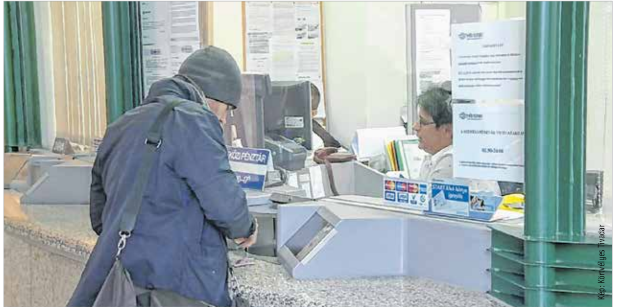
Fehérvár és Budapest között már nem kell papír alapú bérletet venni, elég az e-személyi

„Nagyon jó véleménnyel vagyok erről, de hát e-személyije még nem mindenkinek van, gondolom majd idővel.” – mondta egy hölgy a peronon, miközben az egyik délutáni pesti vonatra várt. Az utasok – azon felül, hogy nem kell papír alapú bérletet váltaniuk – három százalékos kedvezményt kapnak az árból. „Egyelőre a Déli pályaudvaron, Pusztaszabolcs, Százhalombattán, Kelenföldön, Érd-alsón, Tárnokon, Martonvásáron és Székesfehérváron van lehetőség a pénztárakban ezt a fajta bérletet megvásárolni és feltölteni az e-személyire.” – tájékoztatott Lócsei Virág, a MÁV sajtófőnöke.