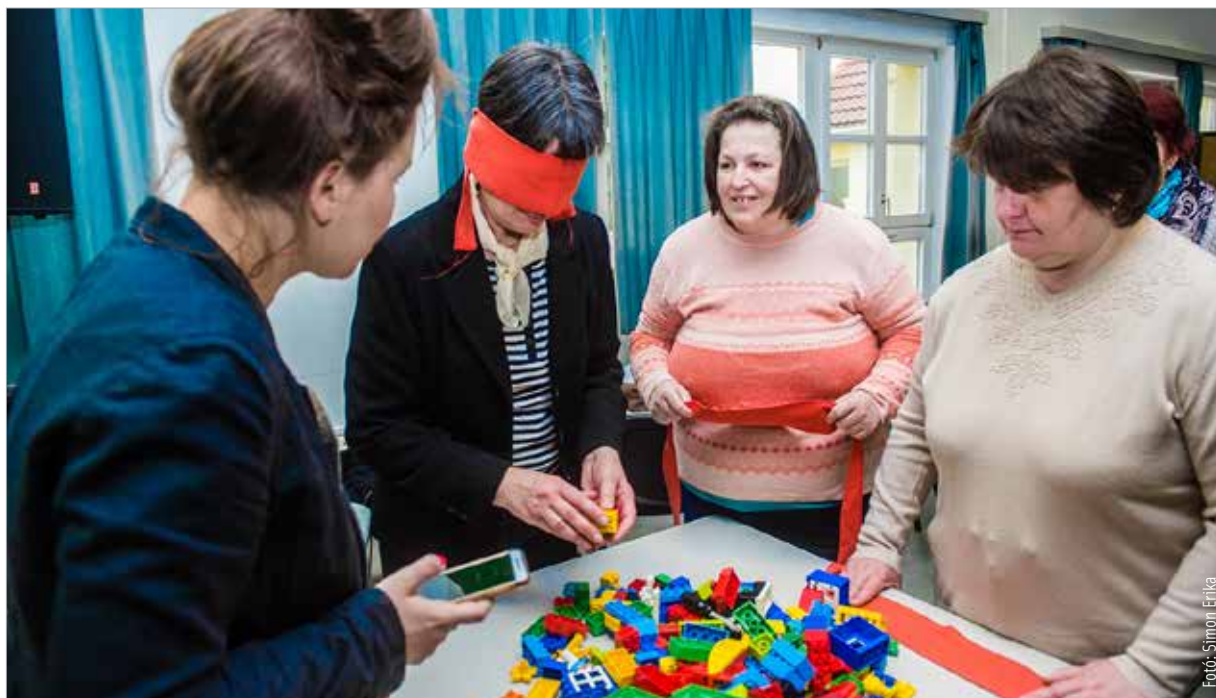
A résztvevők bepillantást nyerhettek a fogyatékkal élők mindennapjaiba

A szakmai napon szó esett a fogyatékkal élők foglalkoztatási lehetőségeiről, képzéseiről, az esélyelemzésről illetve a vállalkozóvá válás, a bedolgozás és a távmunka lehetőségeiről is.