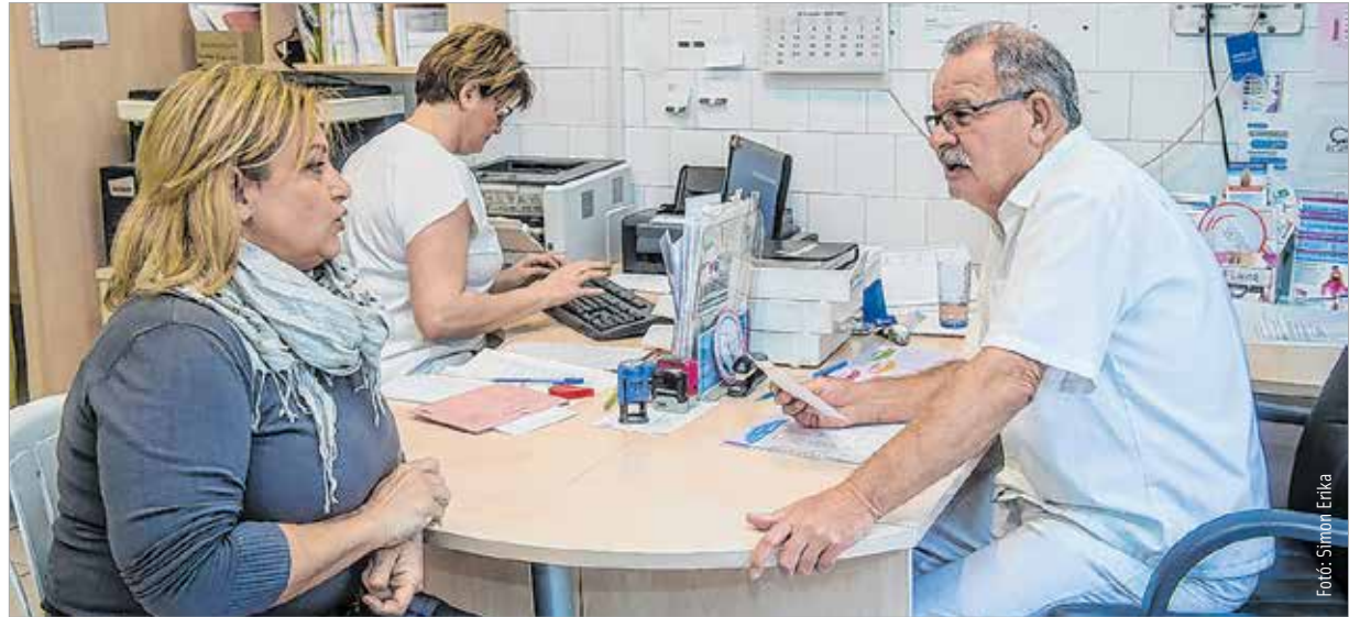
Középpontban a megelőzés – ezúttal is rengetegen érkeztek a Család- és Nővédelmi Központ szűrőnapjára