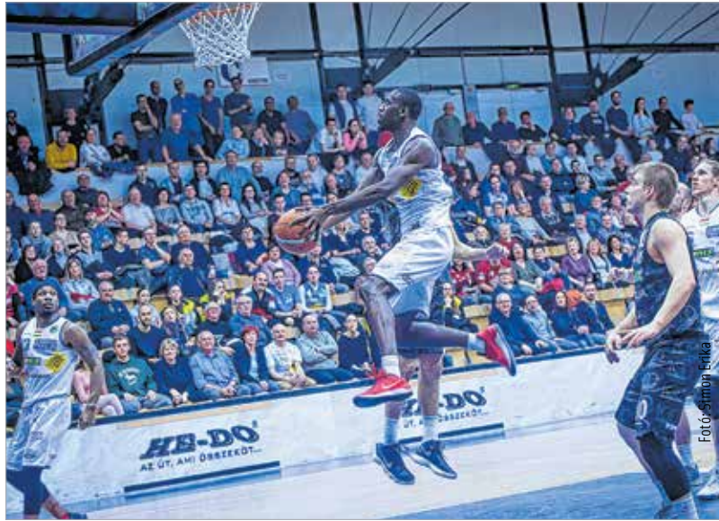
Pointer mindkét meccsen ponterős volt, de ő is csak a második féldőben

Ezek után elutazott Litvániába az Alba, ahol a Juventus Utena ellen a FIBA-Európa-Kupa nyolcaddöntője várt rá. És mi történt az első negyedben? Hat pontra voltak képesek Lóránték, mint a szezon legrosszabb emléké meccsén. Az Utena úgy vezetett már majdnem harminccal, hogy zsinórban szórta a triplákat, miközben a Fehérvárnak szinte semmi nem ment be. Totálisan szétesettnek,