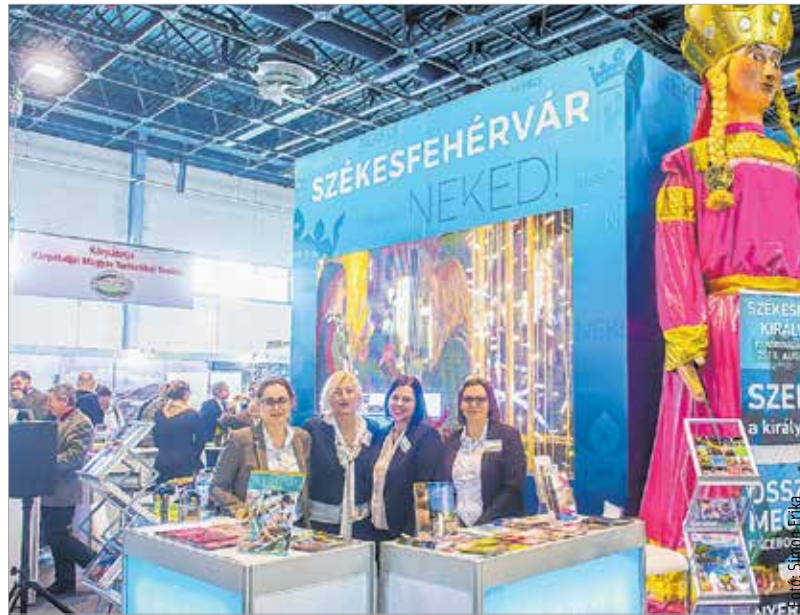
A cél a szezonáltság csökkentése és a látogatási idő meghosszabbítása Fehérváron

A jövőre nézve a legfontosabb kitűzött cél Székesfehérvár turizmusával kapcsolatban, hogy ne csak szezonálisan érkezenek a látogatók városunkba, és ha már jönnek, minél több napot maradjanak is. Mindezt kiválóan elősegíti, ha a város környékének színes programkínálatát is megismerik az ideutazók. Városunk idén a Pákozdi Katonai Emlékparkkal és a Móri Borvidékkel közös standon mutatkozott be március elején a fővárosban rendezett Utazás Kiállításon. A város turizmusának fellendülésével kapcsolatban rendkívül kedvező adatok hangzottak el a rendezvé-