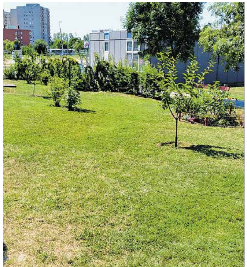
A virágokat napi rendszerességgel locsolja a társasház, a fákat pedig forgásban több naponta, így nyáron is üde zöld az épület körüli közterület