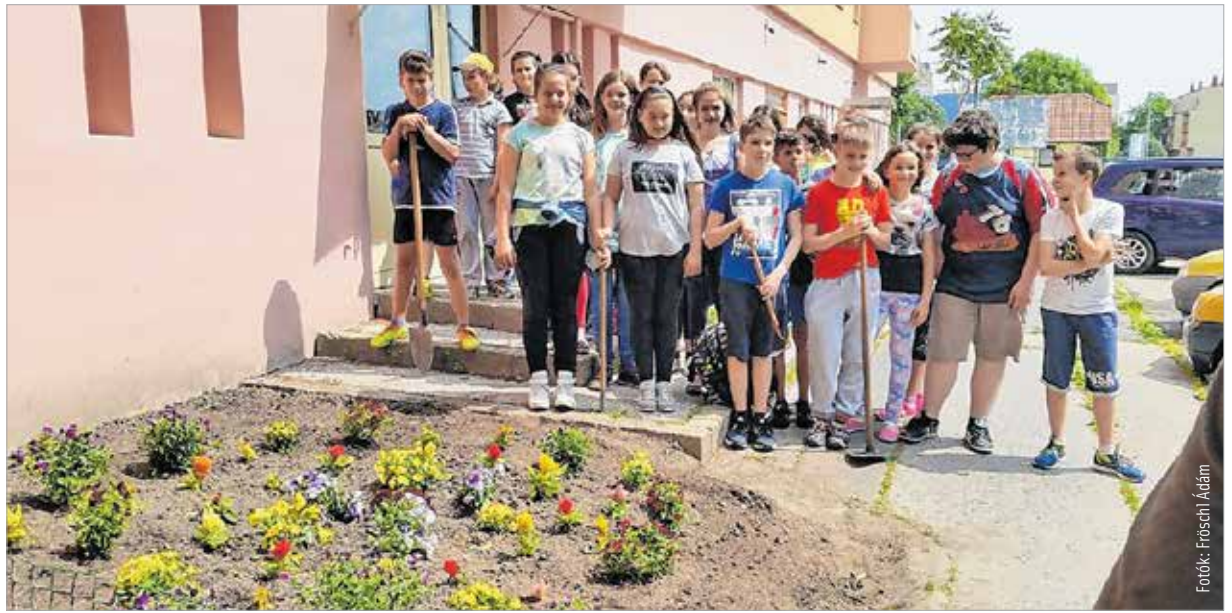
A Kelemen Béla utca 2-4-6. lakóközösségének munkája mintaként szolgálhat mindenki számára. Tavaly a pályázaton nyert növényeket a Bory Jenő Általános Iskola tanulói segítettek elültetni. A társasház lakói napi rendszerességgel locsolják a virágokat, és a fás szárú növényeket is rendszerben tartja a közösség a ház körüli közterületen.

A növényeket személyesen lehet majd átvinni a Bregyó Sportcentrum területén, és virágföld helyett idén komposztra pályázhatnak a fehérváriak. A komposzt Székesfehérváron készül a Depónia által összegyűjtött zöldhulladékból. A fenntartható fejlődés miatt tért át erre a Városgondnokság. Újdonság továbbá, hogy idén az ablakok és erkélyek díszítésére is pályázhatnak a társasházi és a családi házakban lakók ötezer forint értékben.