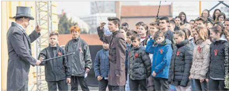
Jelenet a tavalyi előadásból. Az idei előadással kapcsolatos további részleteket és a próbafolyamatról készült fotókat keressék a hétfvégen az fmc.hu oldalon!

A készítésről szóló videoklip óriás kivetítón látható lesz az előadáson is. A Pákozdi Katonai Emlékparkkal való együttműködésnek köszönhetően pedig kétszáz nemzetőr gyermek és diák vonul majd fel a közönség előtt.