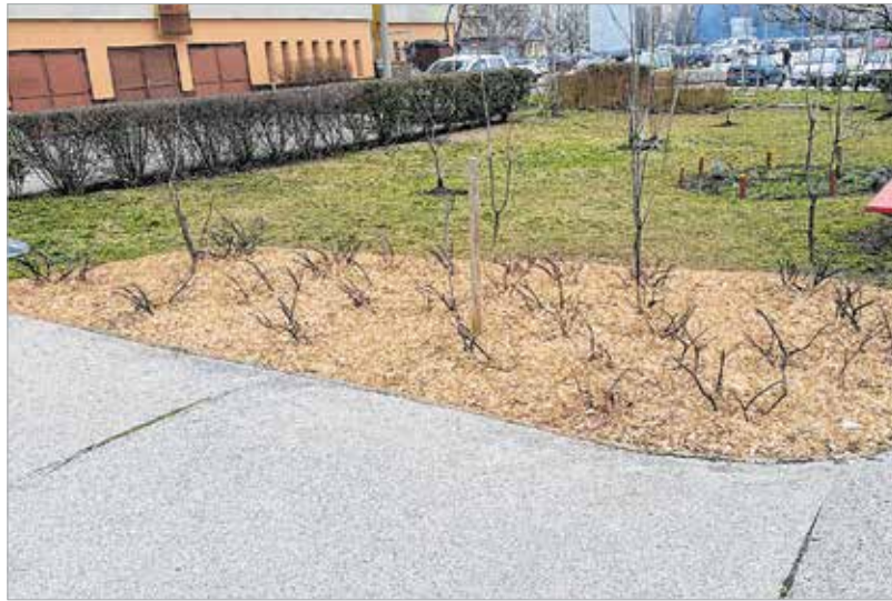
A Városgondnokságtól kapott faaprítékkal takarták be a ház előtti bokrok alját, hogy védjék azokat a nyári kiszáradástól és a gázosodástól