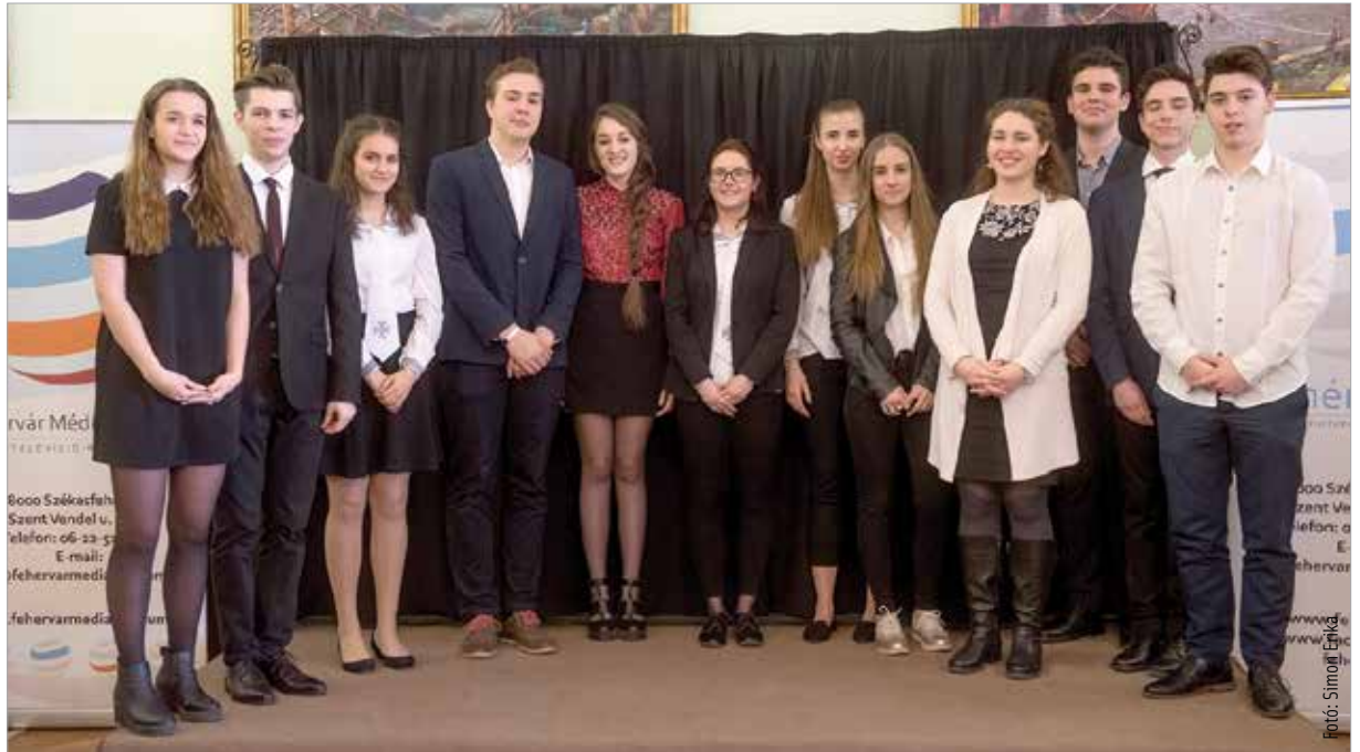
Megkönnyebbült mosoly és felszabadt hangulat: a tizenkét döntős az eredményhirdetés utáni pillanatokban