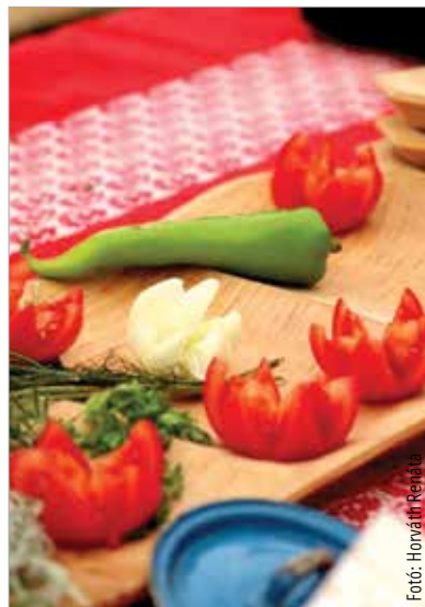
Együnk minél több zöldséget!