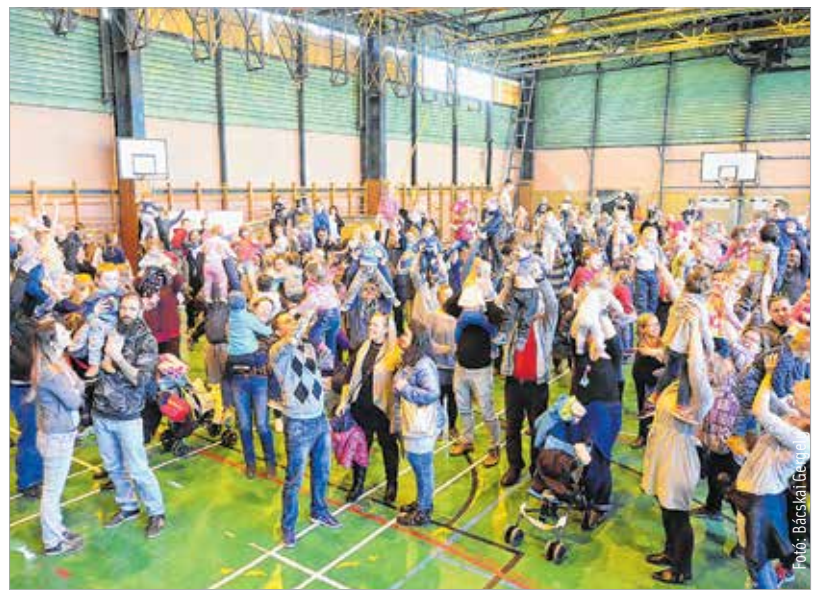
Emeljünk magasba minél több gyereket! elnevezéssel Székesfehérváron is sokan csatlakoztak ahhoz a világrekord-kísérlethez, melynek keretében egy időben minél több gyermeket emeltek a magasba a szülők. A vasárnapi gyerekelemeléssel a gyermekvállalás fontosságára hívták fel a figyelmet.