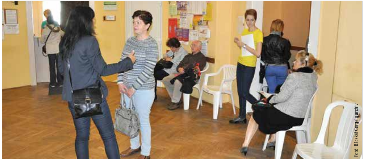
A Nővédelmi Központban 2015-ben vezették be az internetes előjegyzési rendszert

A Család- és Nővédelmi Központ, a város szülészeti-nőgyógyászati és ultrahang-diagnosztikai szakrendelője 1998 januárja óta várja a pácienseket a Várkörúton. 2015-ben vezették be az internetes előjegyzési rendszert, amit a bejelentkező szándékozó az intézmény honlapján talál. Az előjegyzés kizárólag a nőgyógyászati szakrendelésekre vonatkozik. A bejelentkezés nagyon egyszerű: az oldalra való belépést követően az irányítószámot kéri a rendszer, majd ennek megadása után a páciens orvos és idő szerint is választhat magának rendelést. Ha az orvosok közül kívánnak az érintettek választani, akkor a legközelebbi időpontot mutatja a rendszer, de ha az az időpont nem felel meg, későbbi is választható. Amennyiben megfelelő az időpont, akkor a név és a születési idő megadásával lehet véglegesíteni a foglalást.