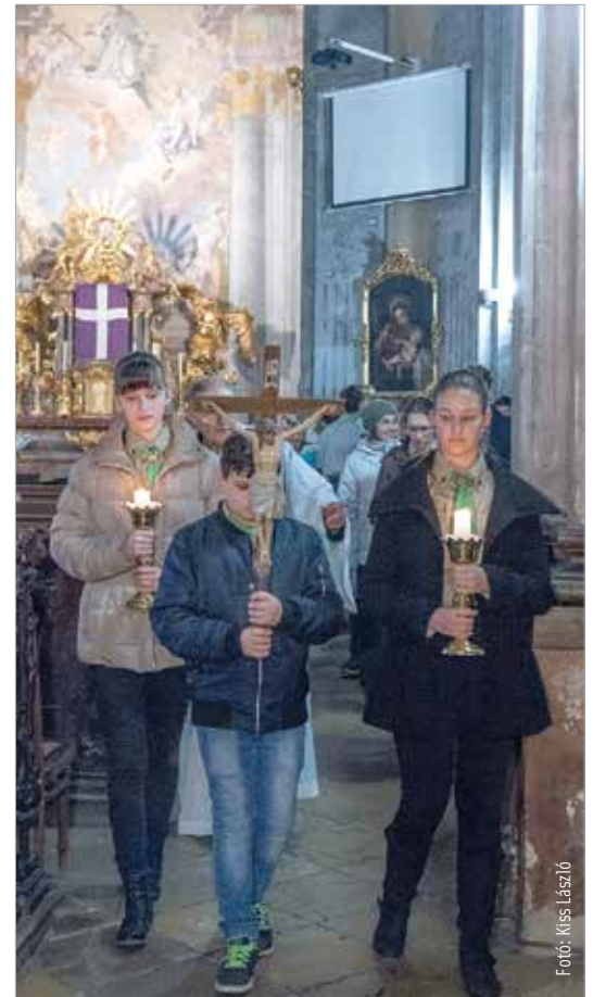
A gyertya fénye Krisztus világosságát jelképezi

A cserkészek többsége a Ciszterci Szent István Gimnázium diákjai közül kerül ki. A csapat legismertebb tagja Kaszap István volt, aki még Pótz Edgár ciszterci paptanár vezetése alatt az 1930-as évek elején tanult a gimnáziumban. A hagyomány, a régi értékek és a modern világban való helyes eligazodás az, amit a cserkészcsapat ma is szeretne tagjainak átadni. Nagy hangsúlyt fektetnek a nevelésre, az életre való felkészítésre, ami a cserkészlet alapelvei közé tartozik. Virtuális világunkban fontosnak tartják azt a gyakorlatias – és szórakoztató – tudást, élményt, amit egy cserkészközösség adni képes.