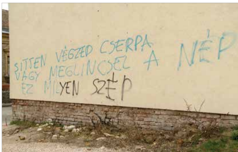
Nemzeti ünnepünk reggelére fenyegető falfirka jelentek meg a városban

Székesfehérvár polgármestere közösségi oldalán a véleménynyilvánítás szabadságára hívta fel a figyelmet: „Szerintem bármit megrongálni, lefesteni bugyuta dolog, de a demokráciában egy kampányban ez a véleménynyilvánítás egyik eszköze. Nem hiszem, hogy bűn lenne, amit üldözni kell, legfeljebb hiba. Ha ők ezt gondolják a világról, hát tegyék! Én persze távolinak érzem ennek a városnak a stílusától, ezért magam nem tartom bölcs kampányfogásnak. Székesfehérvár ennél többet érdemel!”