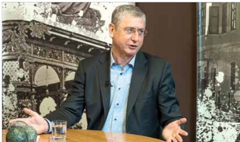
Gyurcsány Ferenc: „Egy szókimondó pasi vagyok, és a pártom is az!”

A fórumot követően Gyurcsány Ferenc a Fehérvár Televízió stúdiójában járt. Mivel korábban több DK-s politikus, többek között a párt fehérvári jelöltje, Ráczné Földi Judit is a kerítés lebontása mellett érvelt, ezért megkérdeztük az elnököt, véleménye szerint kell-e kerítés? Gyurcsány Ferenc kérdésünkre ezt válaszolta: „Igen sokfajta megoldás közül választhatott volna a kormány. Tény, hogy mára áll ez a kerítés, és a kerítés az emberek biztonságérzetének szimbóluma lett, függetlenül attól, mennyit véd vagy mennyit nem. Két feladat van: az ország lakosságát biztonságban tudni, és akkor a szimbólumok ellen nem kell harcolni,