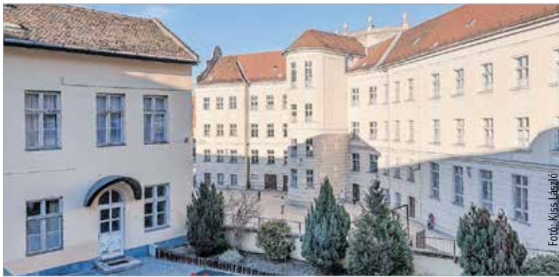
A Szent Imre Általános iskola és Óvoda korszerűbb, energiatakarékosabb lesz

A Székesfehérvári Egyházmegye további fejlesztési terveiről következő lapszámunkban olvashatnak.