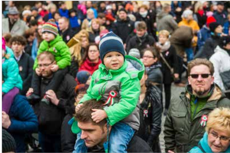
Az utcaszínházat nem lehet megenni: erről tanúskodik az a rengeteg ember, akik a bizonytalan időjárás ellenére is ellepték a belváros tereit