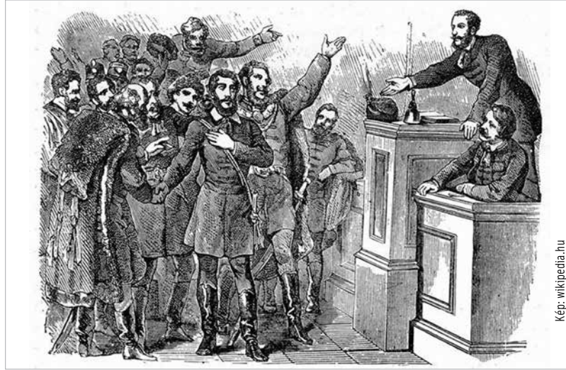
Kossuth kormányzóvá választása - 1849. április

kísérletet tett Magyarország önállóságának megszüntetésére, birodalmi tartománnyá leminősítésére. Az országgyűlési ifjak – Lovassy László, Kossuth Lajos, Wesselényi Miklós – felvállalták az udvarral való szembeállást, akár a börtönbüntetés terhére is. A Magyarország önállóságának megszüntetésére tett kísérlet fokozta a nemzeti érzés amúgy is nagy lángon tartott hevületét.