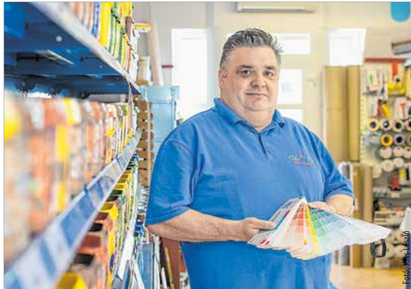
A nekünk tetsző árnyalatot érdemes néhány négyzetméternyi falfelületen kipróbálni