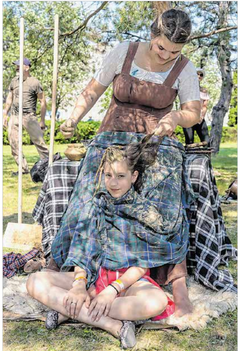
A kézműves foglalkozásokon többek között ékszereket, babér- és virágkoszorút, mozaikképet és bőrsarut lehetett készíteni. Annak aki pedig szeretett volna rómaiá válni, lehetősége nyílt beöltözni egy fotó erejéig.