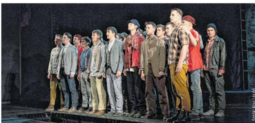
Molnár Ferenc szívbemarkoló regényéből Grecsó Krisztián készített új színpadi változatot