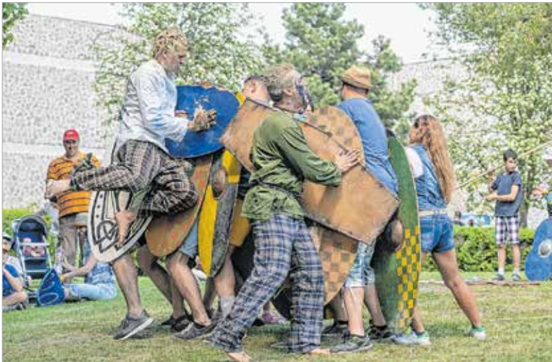
A bátrabbak kipróbálhatták milyen az, amikor a kelták teljes erőből rájuk támadnak

A kalandjátékon túl a múzeumpedagógusok izgalmas, ókori témájú játékokkal és foglalkozásokkal várták a gyermekeket, a táci gyerekek pedig az ókori gyermekjátékokba vezették be az érdeklődőket. A régészetben alkalmazott egyik modern technológiával, a quad-