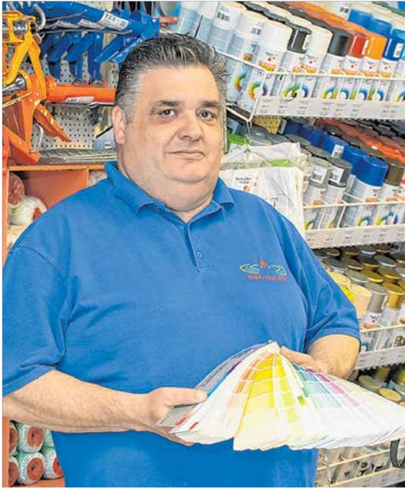
Az idei tavasz trendszínei a fehér, a szürke és a halvány árnyalatok