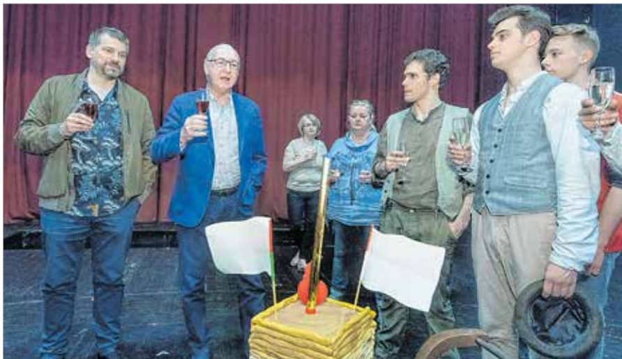
Tortával ünnepelték az ötvenedik előadást

Molnár Ferenc szívbemarkoló regényéből Grecsó Krisztián készített új színpadi változatot, a dalok a Dész-Gesztli szerzőpáros remekművei. A Pál utcai fiúk egy olyan érzékeny történet, melynek zenés változata tartalmas kikapcsolódást ígér az egész családnak, hiszen a fiatalokat és a felnőtteket is egyaránt megszólítja és magával ragadja. A zenés darabot Keszég László rendezésében láthatja a közönség a Vörösmarty Sínházban. A Pál utcai fiúk nemcsak Magyarországon az egyik legolvasottabb és legnépszerűbb történet, hanem külföldön is az egyik legismertebb magyar regény. Számtalan nyelvre lefordították, és a maig tartó nemzetközi népszerűsége töretlen.