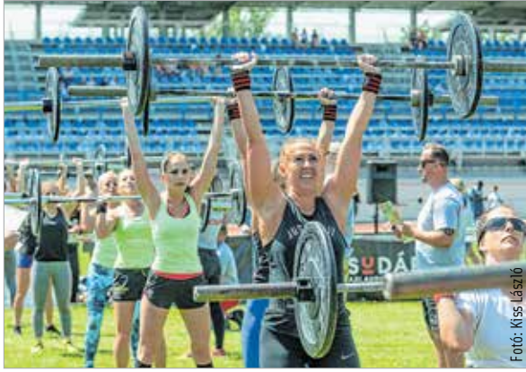
Az erő velük volt, avagy a gyengébbik nem súlyos vállalása