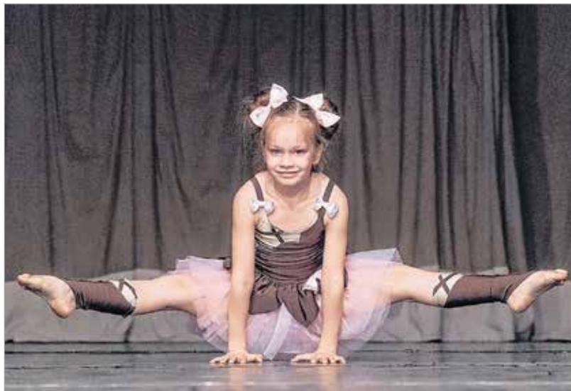
A táncfesztiválon a legkisebbek is színpadra léptek