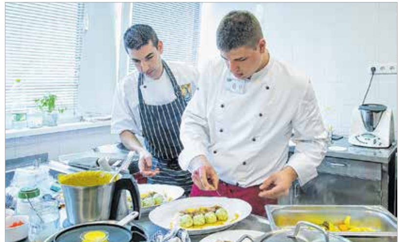
A mentorok csak szóban segíthettek, de nem nyúlhattak az ételhez

A külső szemlélőknek még éppen belefért egy gyors kávé, amíg a