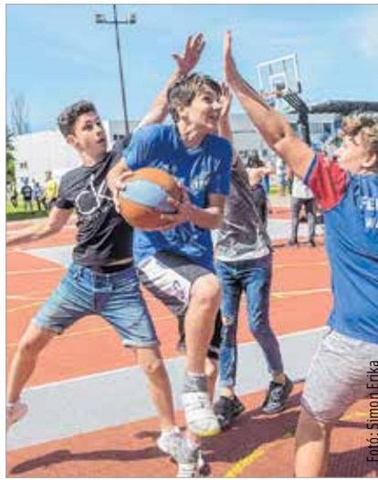
Akárcsak a nagyok!