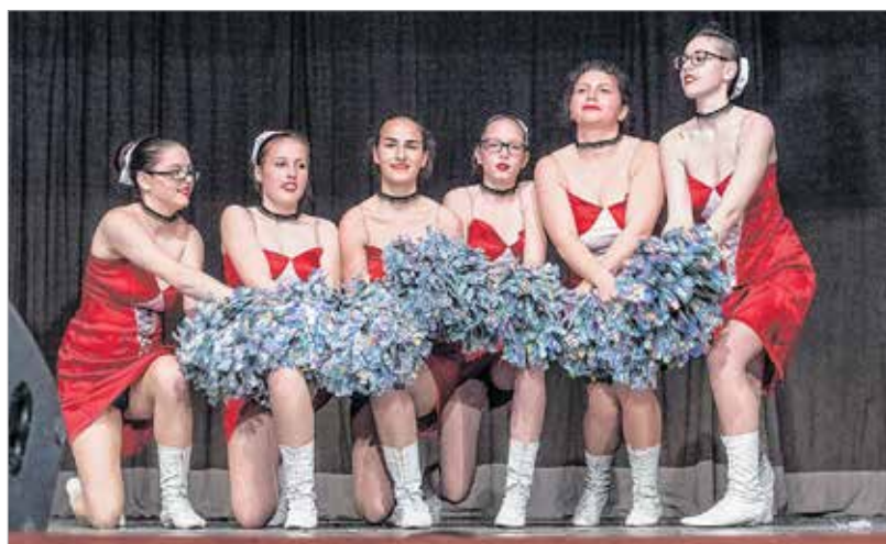
A tánc világnapját a VII. Fehérvári Táncfesztivál keretében a Fejér Megyei Művelődési Központban is megünnepelték

A gála „Megőriztem, tovább adom...” című részében dél-alföldi, Galga-menti, Kraszna vidéki, somogyi, hegyközi és bodrogközi táncokat láthatott a közönség, valamint „A férfi tánca...” című koreográfiával Kallós Zoltánra is emlékeztek.