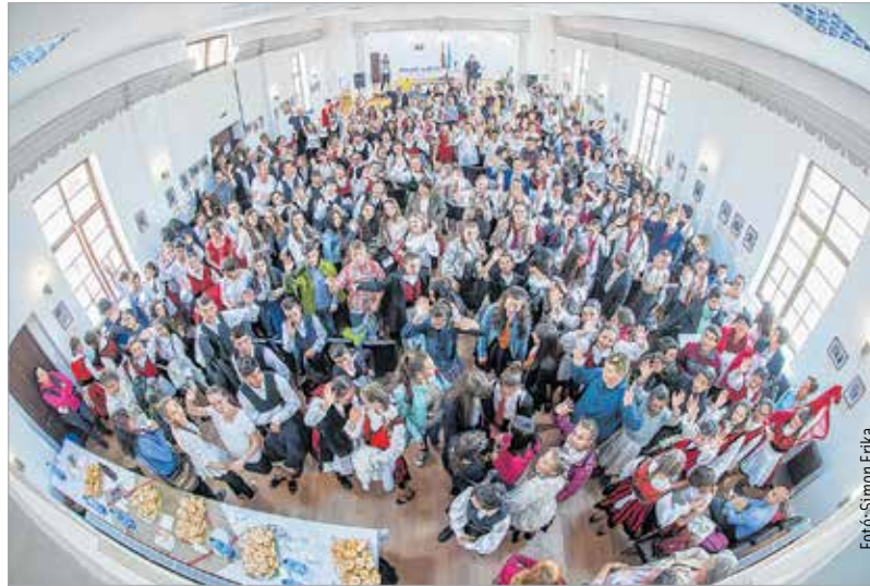
A folytonosságban élő székely nép gyermekei Csíkpálfalván is bizonyították elkötelezettségüket anyanyelvük iránt