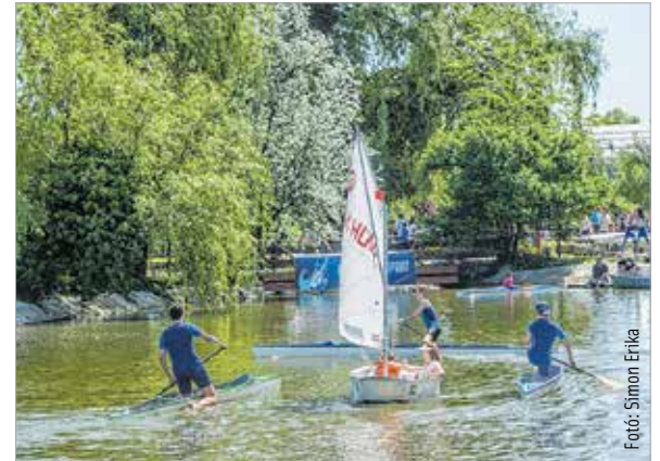
A tavon a Velencei-tavi Vízi Sportiskola gyermek versenyzői is megmutatták tudásukat. Céljuk volt, hogy minél több fiatalot motiváljanak a vízisportok kipróbálására.