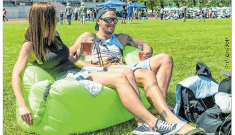
Fröccs az új sör, gumicsónak az új kanapé – május elsején illik sportot űzni a pihenésből

e-mail: info@szepho.hu; uzemeltetes@szepho.hu