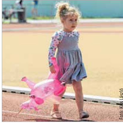
Amikor egy csillámpóni célba ér