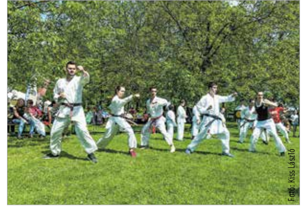
A Sportmajális minden évben lehetőséget ad arra, hogy különböző sportolási lehetőségekkel ismerkedhessenek a gyerekek. Az egyesületek egész nap bemutatókkal várták az érdeklődőket.