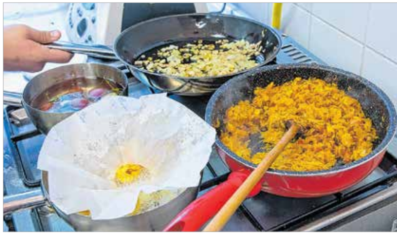
Sül a fondantburgonya és majdnem kész a töltött káposzta

„A zsúri a bírálatában azt emelte ki, hogy az ételeim nem lettek túlbonyolítva. Megtartották a hagyományokat, ugyanakkor az ízek tökéletesen passzoltak egymáshoz.” – mondta a tanuló, aztán megjegyezte, két napot gyakorolt a versenyre. Leginkább a szarvasvadász miatt izgult, de megfogadta a felkészítője tanácsát, nem sütötte túl rozéra, nehogy a vendég nyersnek találja.