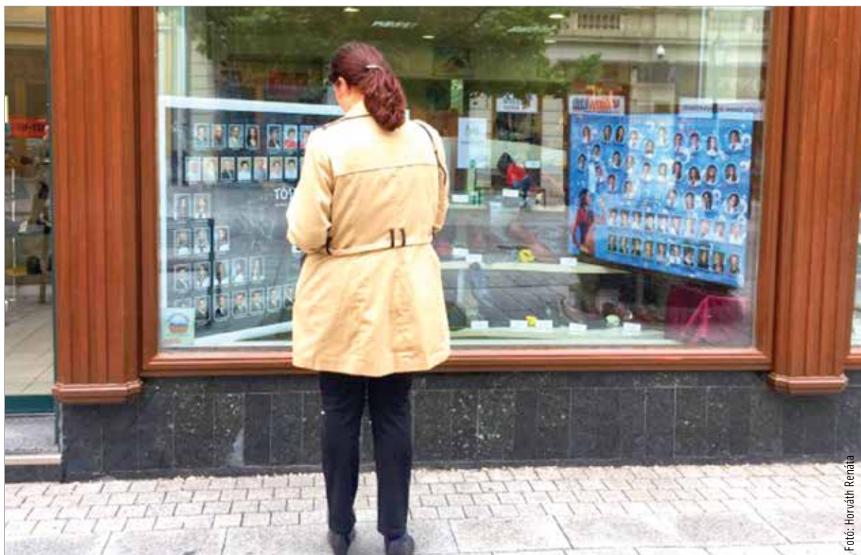
Szombaton kiderül, melyik lesz a győztes

A győzelem reményében az osztályok mozgósították ismerőseiket, az április 19-i meghirdetés óta több tízezer szavazatot gyűjtöttek már eddig is. Cser-Palkovics András polgármes-