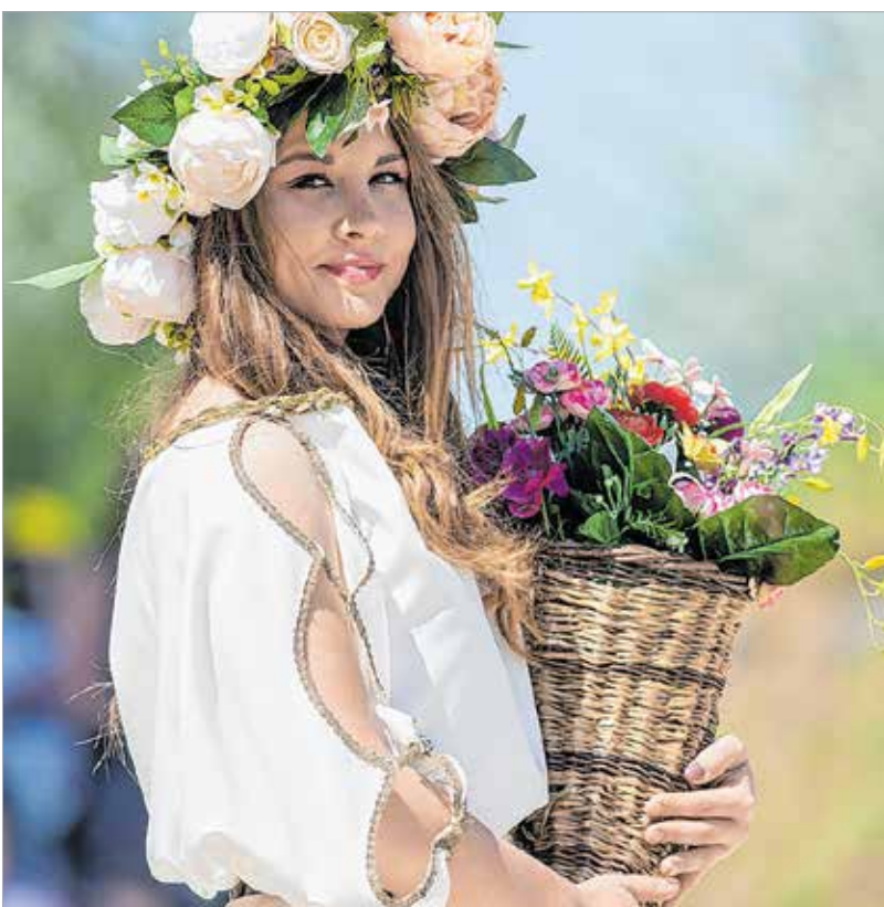
Flora, a tavasz istennőjének ünnepén látványos bemutatók, játékok, életképek, interaktív programok hívták időutazásra a látogatókat

Septimius Severus 202-ben, amikor keleti hadjáratáról visszatért Rómába, hogy megünnepelje uralkodásának tízéves évfordulóját, akkor sem egyenesen a fővárosba ment, hanem feljött Pannóniába,