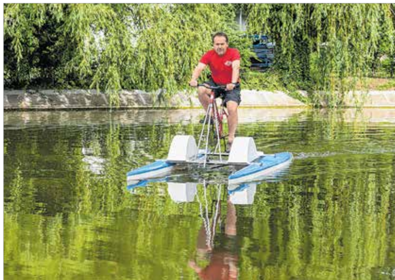
Vízi rider: félig bicikli, félig csónak

„Az állandó létszámunk húsz-harminc fő között mozog, mert nem lehet több gyereket biztonsággal vízre tenni. A