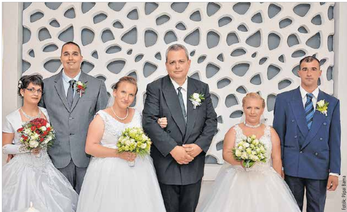
A menyasszonyok maguk választhatták ki ruhájukat és csokraikat