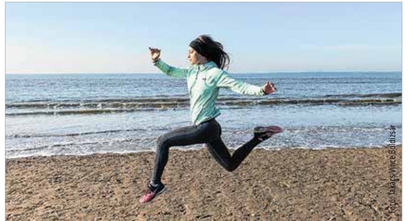
A futás felszabadít

A Fehérvár Televízió nem új számodra. Tizenhat évesen kezdtem itt diák-ként, a Farmerzseb című műsort készítettük, így amikor néhány hónapja adódott a híradós műsorvezetési lehetőség, nagyon örültem neki. A Farmerzsebet imádtam csinálni, nemcsak a műsorvezetés és szerkesztés, hanem a társaság miatt is. Amikor vége lett, óriási úr keletkezett az életemben. Később gyakornokoskodtam országos televízióknál, de azt az összetartást, amit itt tapasztaltam, nem kaptam meg más tévéknél. Mindig is több dolog érdekelt egyszerre, ezért is kötöttem ki végül egy nagyvállalat kommunikációs osztályán. De a tévézés végig nagyon hiányzott.