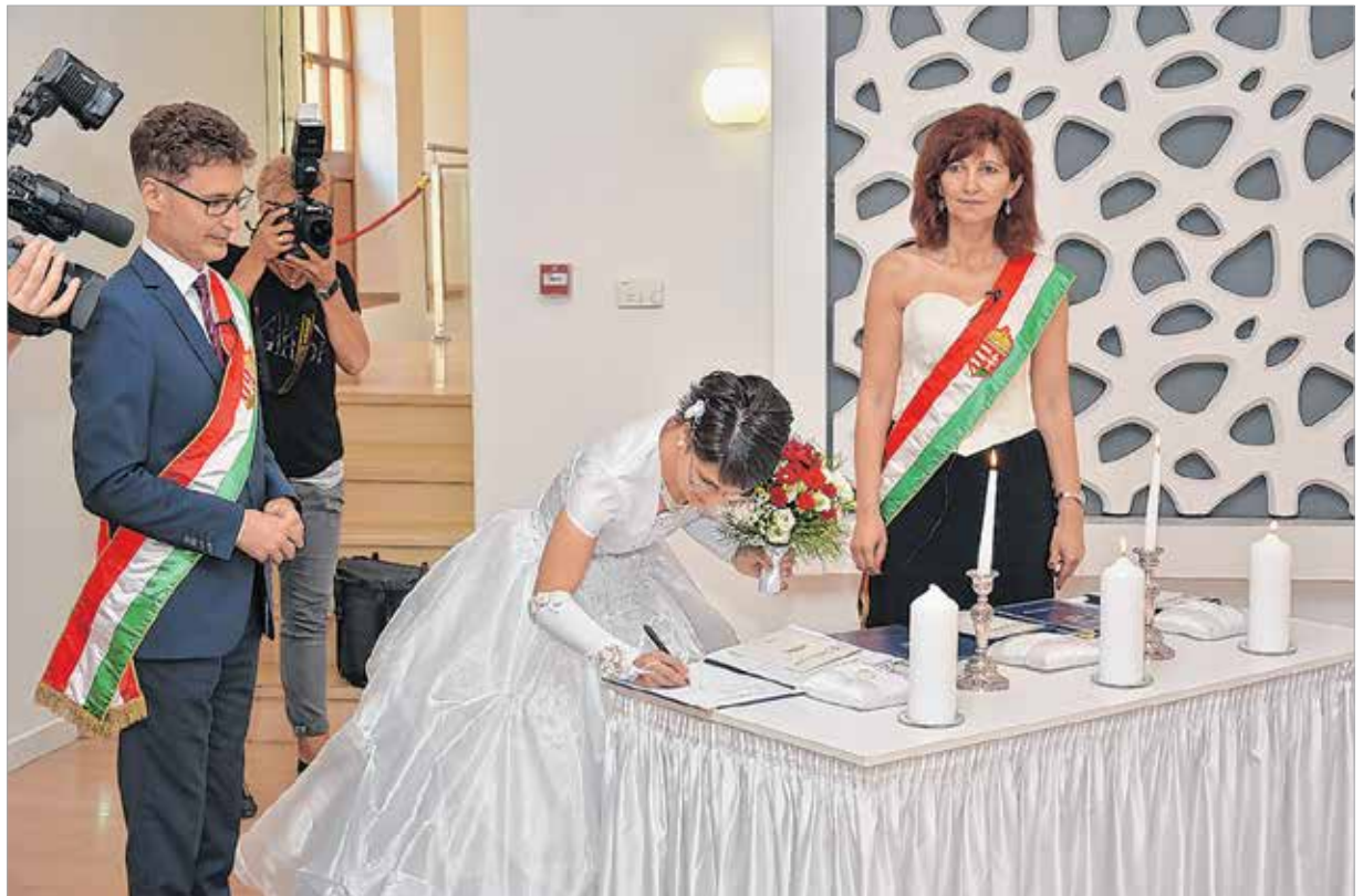
Székesfehérvár polgármestere adta össze a párokat