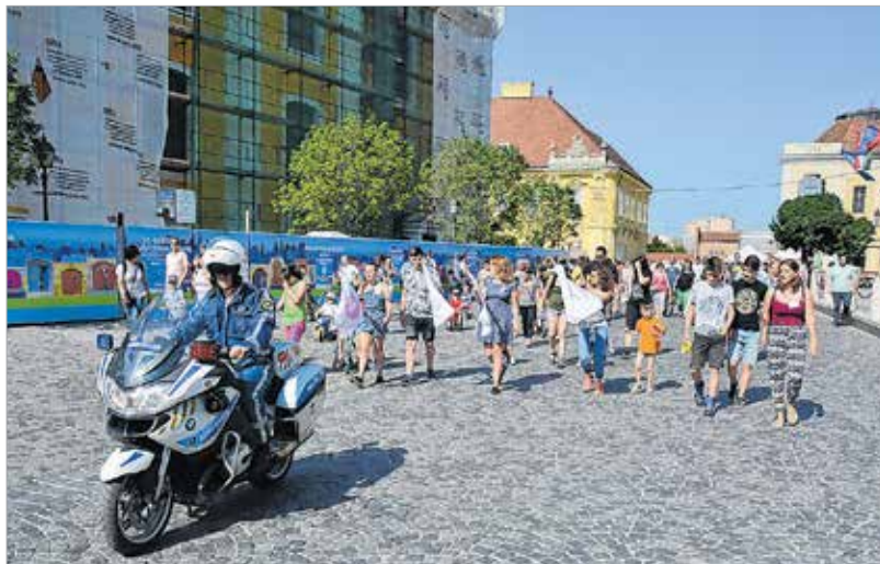
Rendőrmotor vezette a felvonulást

A díjátadót követően a MegaDance Táncstúdió művészei léptek fel,