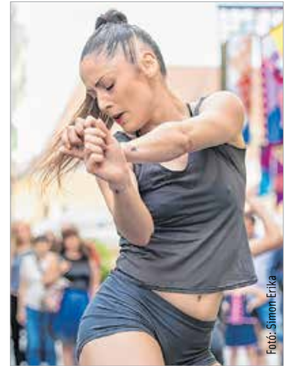
Megnyitó kortárs balettel fűszerezve

Az összművészeti program fő motívuma ebben az évben a textil. Libbenő, színes textiltől és más anyagokból készített lélekleckék fedezhetők fel a fák között. „Művészeink alkotják ezeket jobbra, de a fesztivál közönségét is alkotásra