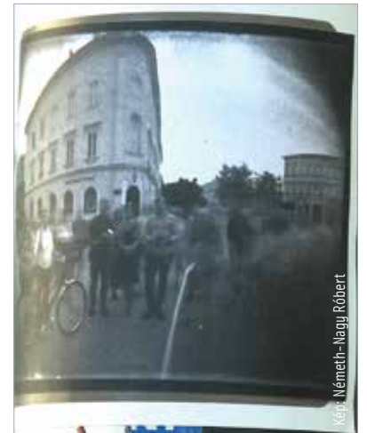
Camera obscura – varázslat a villanyoszlopokon