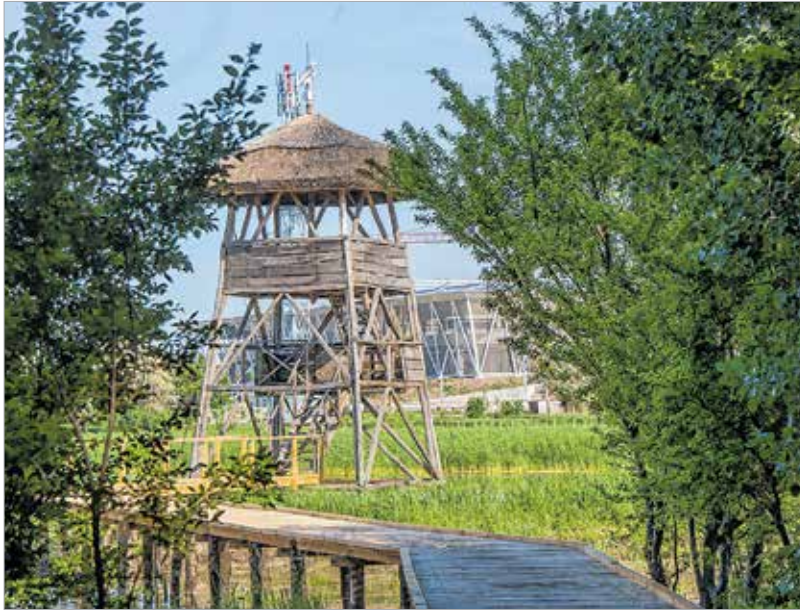
A madárlest is felújítják

és a burkolat, mely a terület belsejébe vezet, vízáteresztő, lélegző, teljesen természetes anyagból van.”