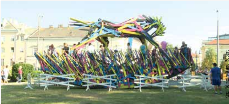
Óriási ringatózásban lehetett részünk a hétvégén