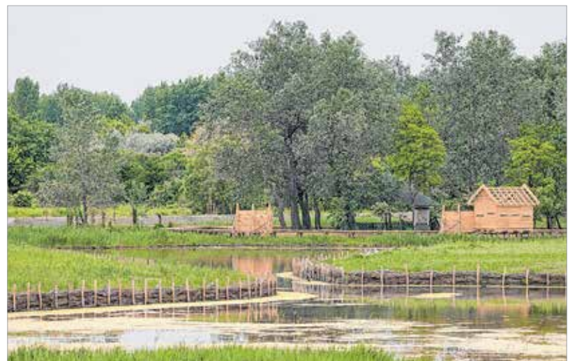
Költőszigeteket alakítottak ki, melyek nemcsak a látogatóknak jelentenek esztétikai élményt, hanem védettséget is biztosítanak a költő madaraknak

Itt sem horgászni, sem csónakázni, de még vízibiciklizni sem lehet, viszont egy év leforgása alatt úgy tűnik, sikerült helyrehozni a kiszáradóban lévő Sóstó Természetvédelmi Területet. A nagyközönség előtt július közepén nyílnak meg a kapui, és minden természetszerető számára élményt és kikapcsolódást nyújt majd. A Szárca csárda mögötti út végén rendezett parkolóban lehet letenni az autót, szemben a még épülő új stadion látható, melynek felénk néző oldalában látogatóközpont alakítanak ki. A látogatóközpont előtt hatalmas, több mint ötszáz négyzetméteres stég épül kiülőkel, szelfitáblával. A Sóstón belül madárlessel bővítették az erdei iskolát, kicserélték az összes bürrühidat, nagyobb vízfelület