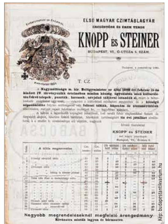
Knopp és Steiner, a díszes emlékérmeket készítő cég