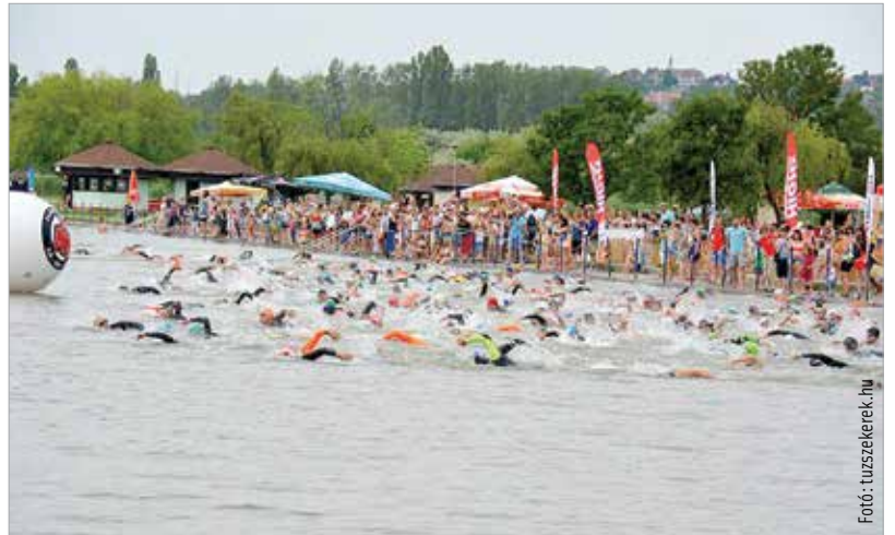
Több mint háromszázan ugranak vízbe

A versenyen szakaszosan rajtoltatják majd a mezőnyt, az első startra délután egykor kerül sor, az eredményhirdetés ötkor lesz.