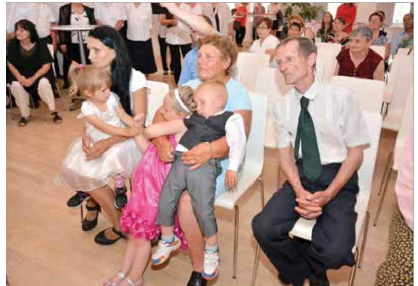
Sokan osztottak a három pár örömeiben