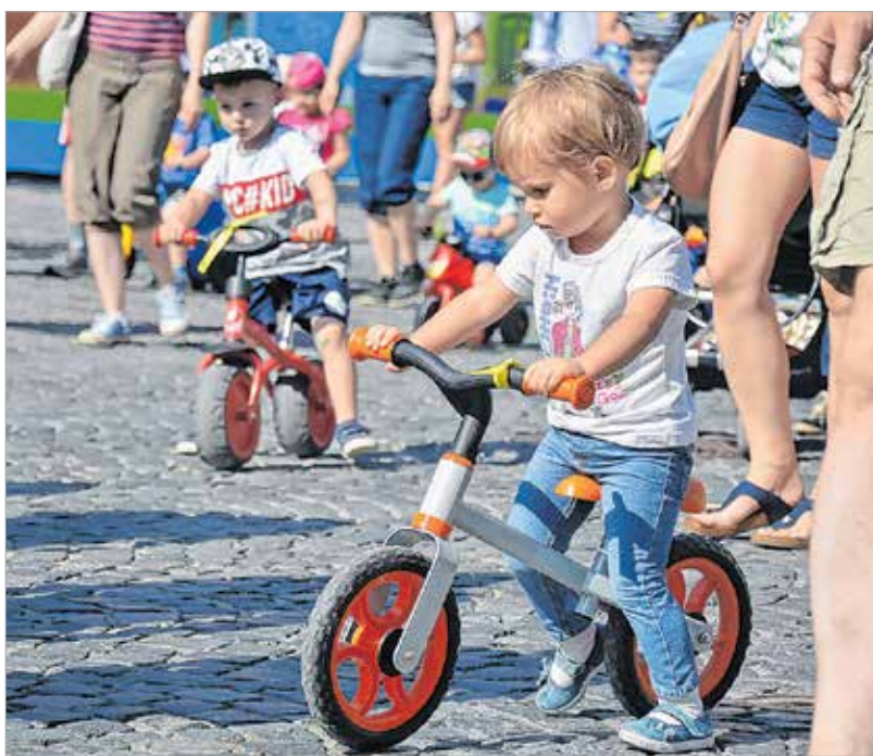
Több mint ötszázan érkeztek