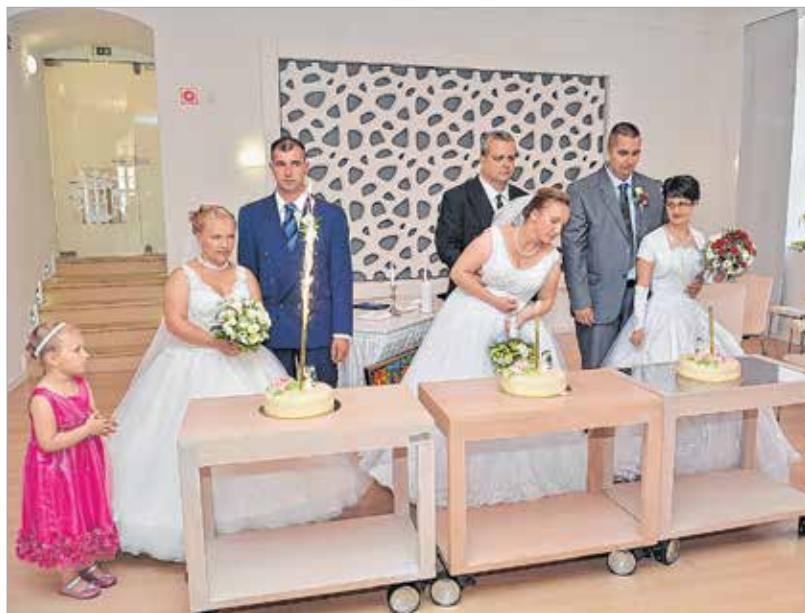
Minden pár külön tortát kapott