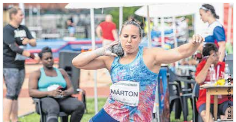
A magyar atlétika első világbajnoka, Márton Anita is megméretteti magát Székesfehérváron

Baji Balásznak sem lesz könnyű dolga: a tavaly szabadtéren, 110 gáton világbajnoki bronzérmet szerző vágató mellett ott lesz a rajtgépben a vb-győztes, egyben olimpiai címvédő jamaicai Omar McLeod, aki két sikertelen próbálkozás után tavaly először tudott nyerni a Gyulai-émlékversenyen. De jön a tavalyi vb ezüstérmese, a 2015-ben világbajnok, Eb-címvédő orosz Szergej Subenkov, aki karrierje során szintén nyert már Magyarországon. Biztosan Fehérvárra érkezik majd az amerikai távolugró Tianna Bartoletta, a lengyel kalapácsvető Anita Włodarczyk, a bahamai sprinter Shaunae Miller-Uibo, a katarai magasugró Mutaz Essza Barsim, a cseh gátfutó Zuzana Hejnová valamint a világ legkeresettebb atlétanője, az etiópai futó Genzebe Dibaba.