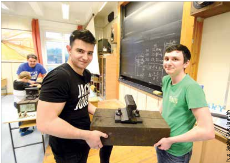
A gyakorlatra és a későbbi elhelyezkedésre lehetőséget biztosító duális képzés Fehérváron is jól működik, de ezen felül is szükség lesz reformokra az oktatásban