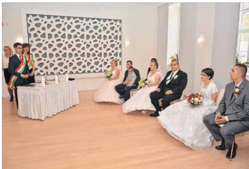
Valóra váltak az álmok

Egyesület vezetőjének eszébe: kezébe veszi a szervezést, támogatókat, segítőtket keres, és esküvőt szervez néhány fiatal párnak, akik maguk ezt nem feltétlenül tehetik meg.