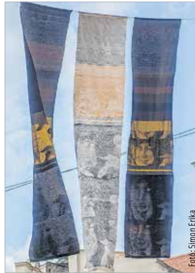
Művészászlók lobognak a belváros felett