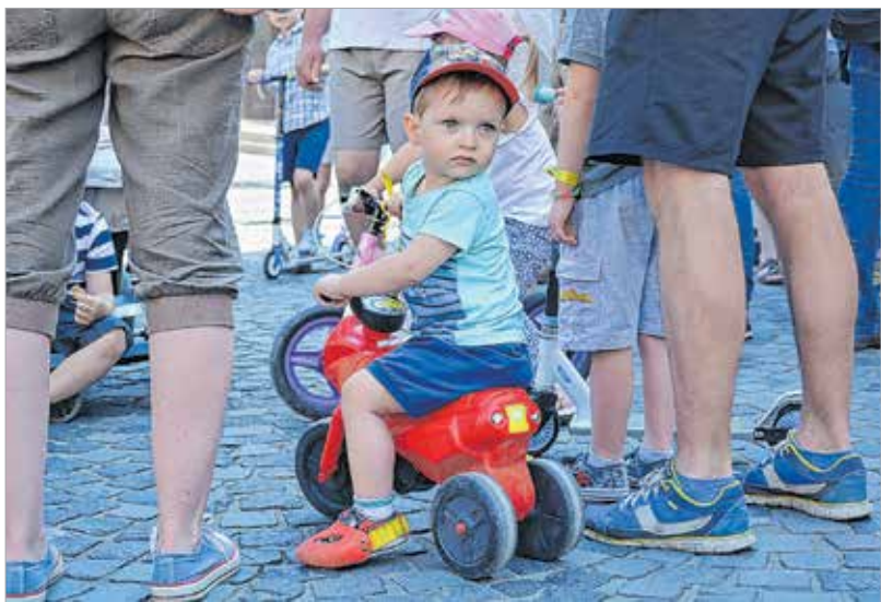
Szelíd motorosok gyülekeztek a Városház téren

mélyes élményét is megosztotta a résztvevőkkel.