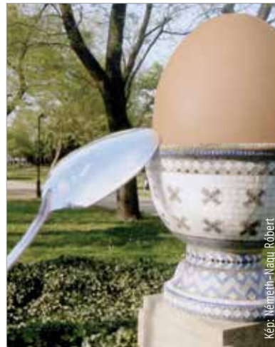
Arany-tojás, ezüstkanál. Nem kell megrettenni, fotóról van szó!