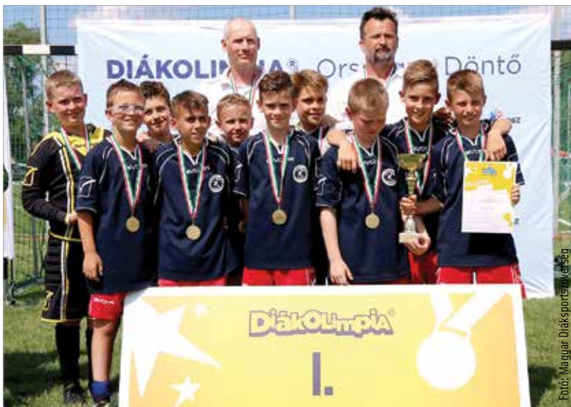
Minden meccsüket megnyerték a Tóvárosi Általános Iskola kis focistái