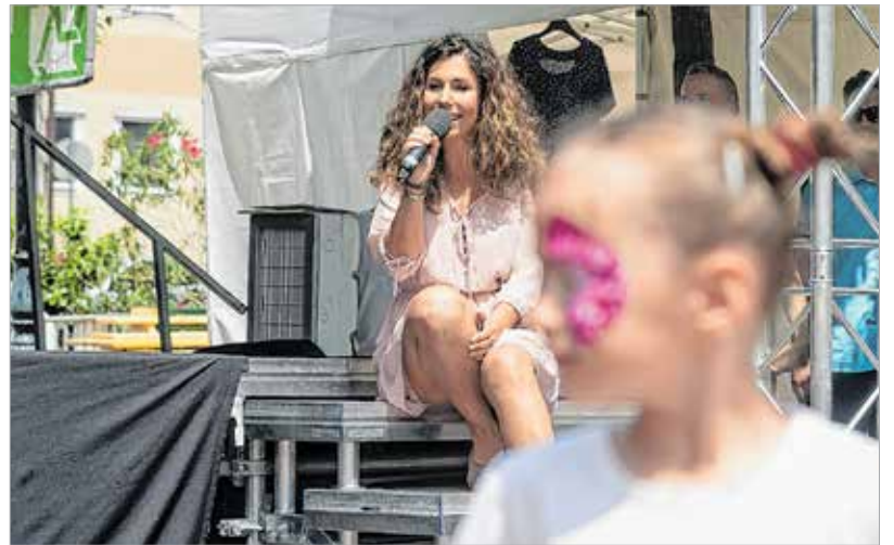
A Vörösmarty Színház művészei énekeltek és mesét mondtak a vendégeknek