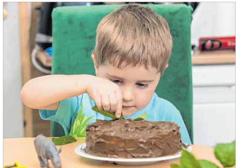
A dzsungelt a mentalevelek és a műanyag állatok imitálják

Amíg a tészta sül, a kimagozott meggyet leturmixoljuk a levével együtt. A meggy savanyúságától függően beletesszünk egy kis cukrot, majd félretesszük az egészet addig, amíg a tészta ki nem hűl. A kihűlt tésztát kettévágjuk. Ekkor elővesszük a meggykrémet, és csomó-