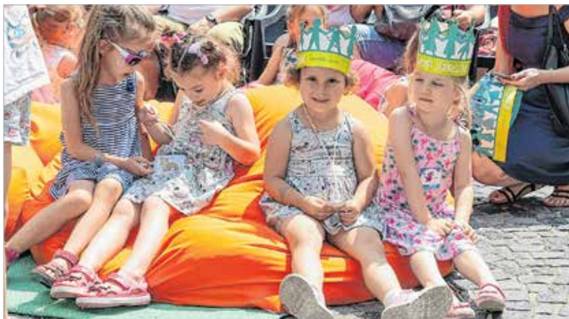
Az egy négyzetméterre jutó királynők száma meglehetősen magas