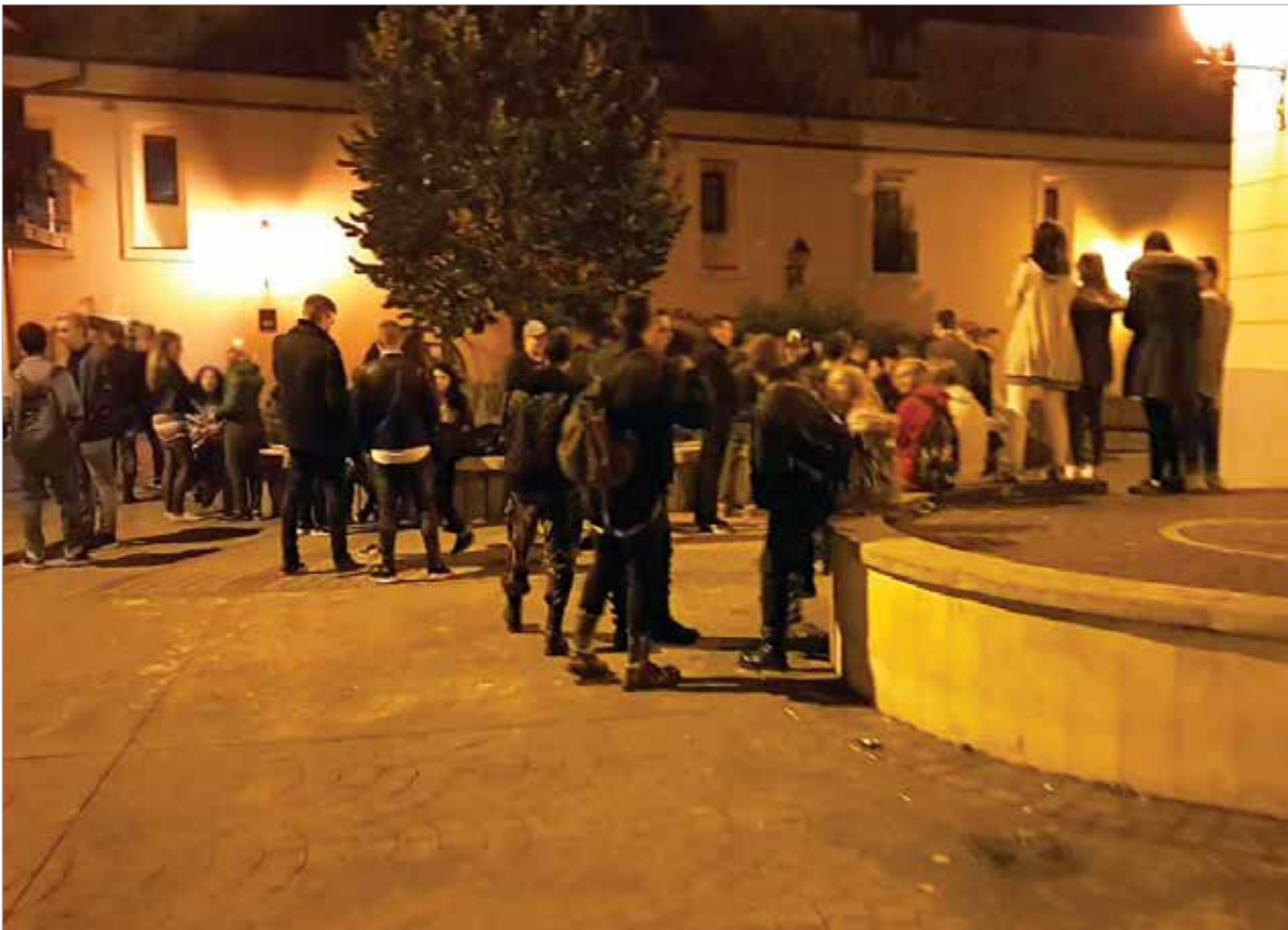
Pillanatképek a Kossuth-udvar éjszakáiból

próbaalvásra!” – tette hozzá a Kossuth-udvarban lakó egyik asszony. A Kossuth-udvarban lévő lépcsősor is megér egy misét. Egy itt lakó hölgy szerint nappal a tizenévesek hangoskodnak, amit még el lehet viselni, de az éjszakai dorbézolást már kevésbé. Mivel a lépcső végén lévő körkiülő eldugottabb, ezért azok, akinek erre néz az ablaka, gyakran túlzottan intim pillanatoknak lehetnek fül- és szemtanúi. Az életre kelt városnak tehát az árnyoldala is megmutatkozik: az éjszakában a terek, padok más funkciót kapnak.