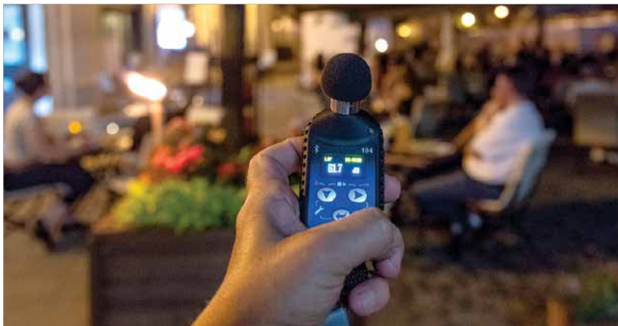
Hol kezdődik a hangos?

ten nem lehet alkoholt fogyasztani. Ha betartanánk a törvényeket, nem lenne itt semmi gond!” – mondja a Petőfi utcai asszony.