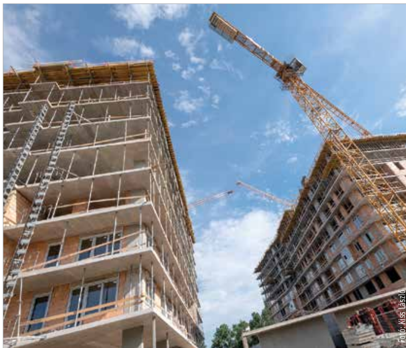
Fehérváron rengeteg új lakás épül, ezeknek átlagos négyzetméterára jelenleg négyszáztizennégyezer forint körül mozog, ami alig több, mint a budapesti árak fele

Kis túlzással Fehérvár az élre tört. De legalábbis felmászott a dobogó második fokára, már ami a vidéki új építésű lakások négyzetméterárát illeti. Az Otthon Centrum legutóbbi elemzése szerint ugyanis Sopron, Székesfehérvár és Kecskemét áll az első három helyen az átlagárakat tekintve. A megyeszékhelyek és megyei jogú városok újlakás-kínálatának átlagos négyzetméterára jelenleg 414 ezer forint körül mozog, ami alig több, mint a budapesti árak fele. Székesfehérvár a 450 ezer forintos négyzetméterárral valamivel az átlag fölött áll, ám a legdrágább jelenleg Sopron, ahol lassan, de biztosan kúszik a négyzetméterár 500 ezer forint felé. Székesfehérváron csak 2017 októberétől a nagyjából 3-3,5 százalékkal nőtt az új építésű lakások négyzetméterára, amivel viszont a középmezőnyben helyezkedik el városunk, hiszen például Kaposváron ugyanezen időszakban átlagosan 18 százalékot ugrottak