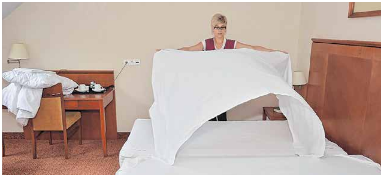
Minden mozdulatnak megvan a koreográfiája