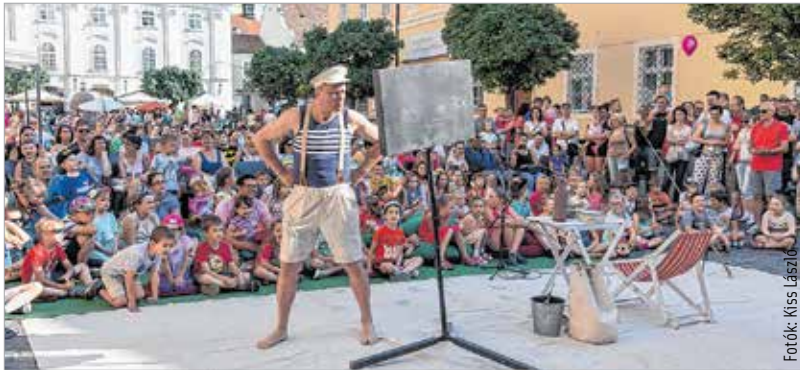
A Vaskakas Bábszínház, a Tintaló Társulás, a Bóbita Bábszínház és a Mesebolt Bábszínház előadásaira rengetegen voltak kíváncsiak

Ládasút, felhóadászat, lovagi torna és mackókereső kalandok várták a gyerekeket a belvárosban május utolsó hétvégéjén a Hetedhét Játékfesztiválon. A bátrabbak igazi kincseket találhattak a régészhomokozóban, vagy ha éppen ahhoz volt kedvük, táncra is perdülhettek a színpad előtt.