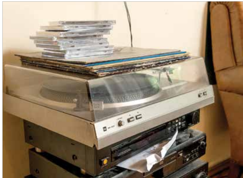
Zene minden formában

Nem gondoltuk, hogy minket ott ennyire szeretni fognak! Valószínűleg azért kedveltek ennyien, mert nem játszottuk meg magunkat, nem erőltettünk egy szerepet magunkra a színpadon. Soha életemben nem néztem korábban Eurovíziót, de pozitív csalódás volt, mennyire összehozza az embereket. A közönség, a fellépők, a szervezők mind nyitottak és kedvesek voltak. Jó érzéssel töltött el, hogy mindegy volt, ki milyen országból érkezett,