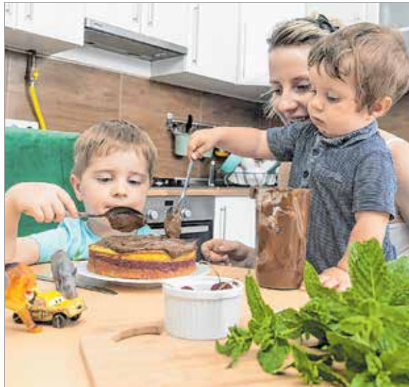
A gyerekeknek egy mezei tortasütés legalább akkora élmény, mint egy játszóház

Igaz, közben a konyha a feje tetejére áll: annyi liszt kerül a padlóra, hogy egy mini homokvárat lehetne belőle építeni, a mosatlan halmokban áll a pulton, és a végén (legalábbis nálunk) valahogy mindig előkerülnek a kisautók, amelyek ki akarják próbálni, milyen a sütőből éppen csak kivett tésztában driftni.