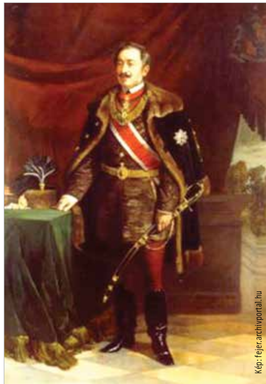
Pállik Béla: Szogyény-Marich László (1880)

A püspök azonban furcsállotta, hogy őt nem értesítették erről az ügyről. Azt sem értette, hogy művei miért csak most jutottak erre a sorsra, hiszen „A modern katolicizmus” című könyve már 1907-ben jelent meg, még pedig az esztergomi egyházmegye approbálásával. „Az intellektualizmus tulhajtásai” merőben filozófiai disszertáció, akadémiai székfoglaló. A dolgok és fogalmak bölcséleti meghatározása, anélkül, hogy bármilyen hitet érintene. A „Több békességet!”, pedig karácsonyi cikke volt az Egyházi Közlönynek.