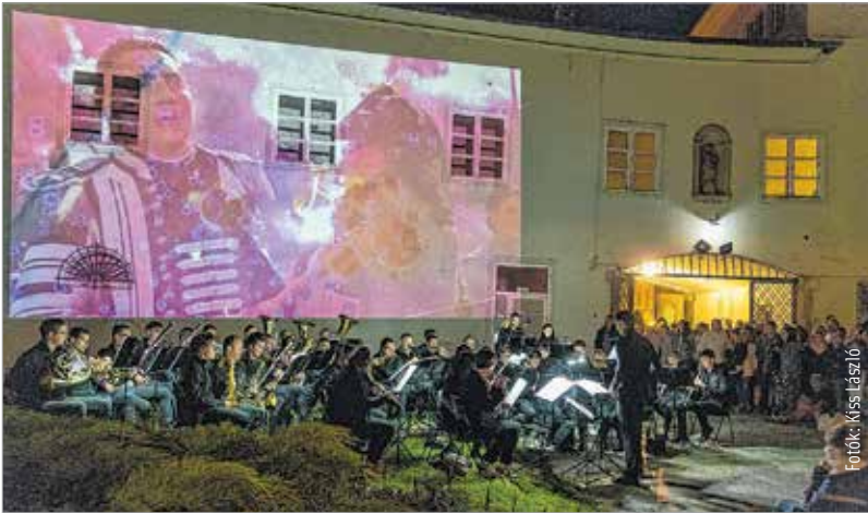
A Városháza díszudvarán a Székesfehérvári Ifjúsági Fúvószenekar filmzenékből összeállított koncertje szórakoztatta az érdeklődőket

Mese Mújkoról, gasztrokaszinó és csipesz üzenetküldés – csak néhány izgalmas dolog, amit kipróbálhattak a kultúra szerelmei június 23-án, a Múzeumok éjszakáján, melynek keretében huszonhét helyszínen közel száz, a család és a kultúra gondolatkörre épülő program várta a kicsiket és nagyokat.