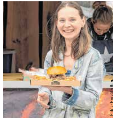
Pulled porkot is lehetett kóstolni