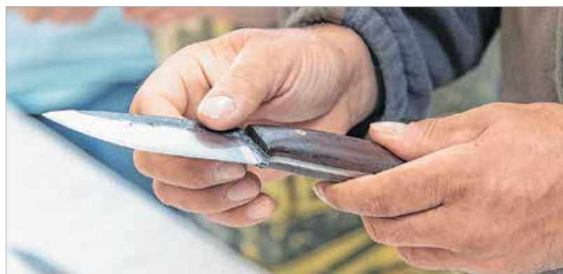
A fesztivál előtti napon a szakmabeliek az I. Késes Konferencián a magyar bicsekfajtákkal ismerkedhettek meg