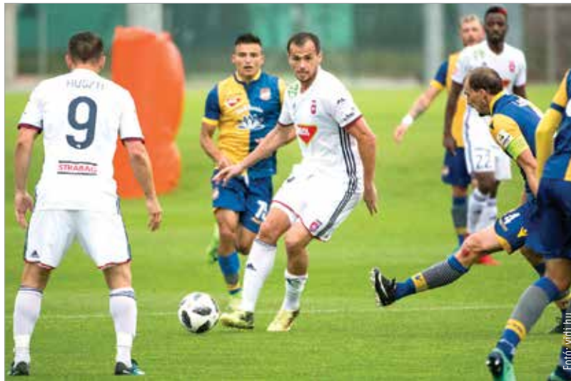
A BL-selejtező első mérkőzésére július 10-én, 18 órakor kerül sor a Dudelange otthonában, majd a luxemburgi kiruccanás után egy héttel, 17-én következik a visszavágó a Pancho Arenában