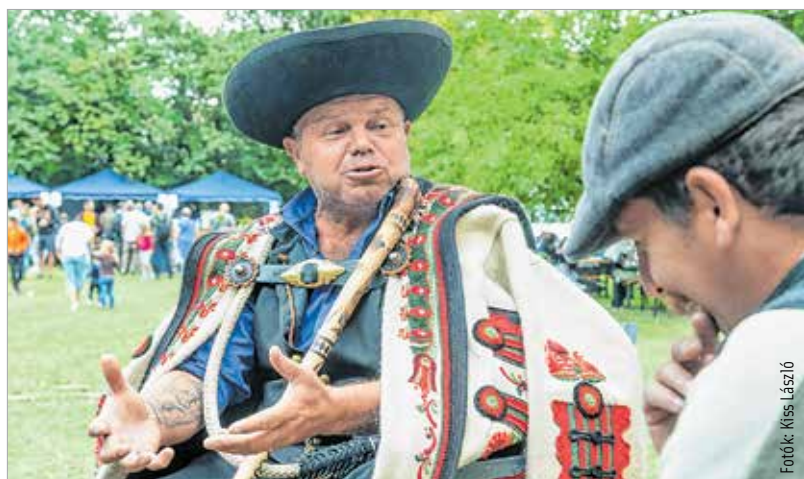
A juhászok is remekül érezték magukat