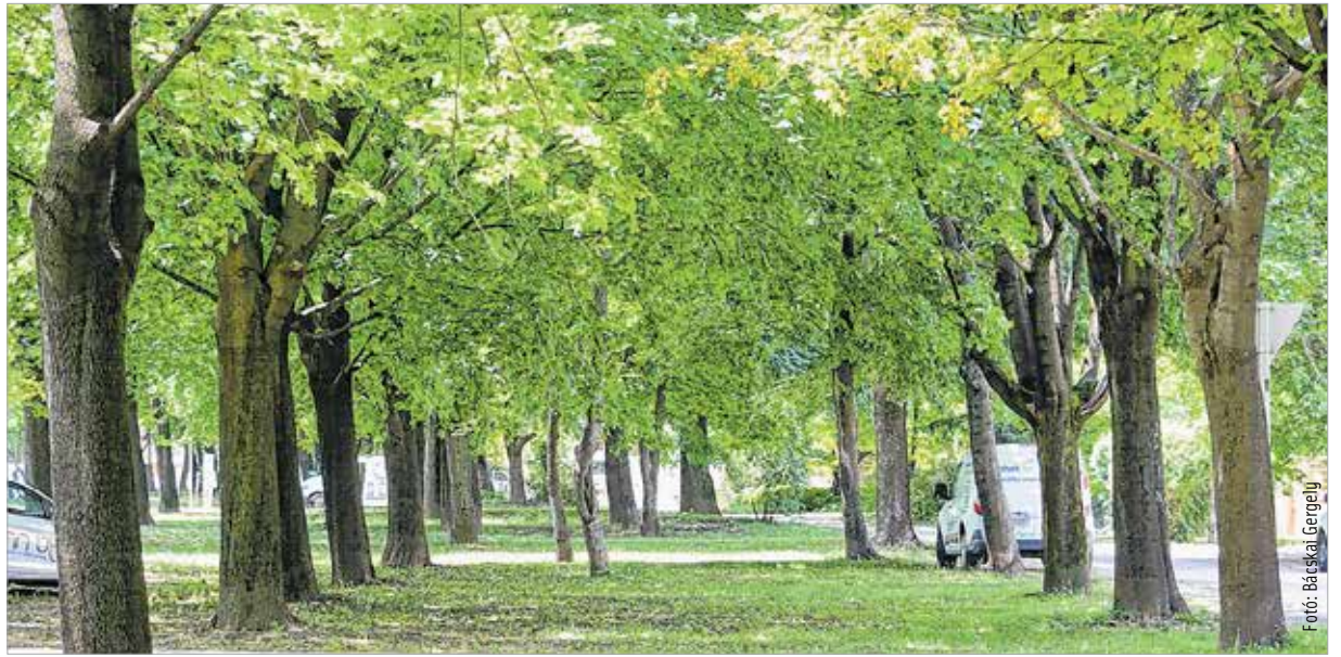
Közterületen lévő fát kivágni csak hatósági engedéllyel lehet

A bányatörvény például egyértelműen meghatározza a bizonyos nyomású gázvezetésektől kötelezően tartandó távolságot, de nincs