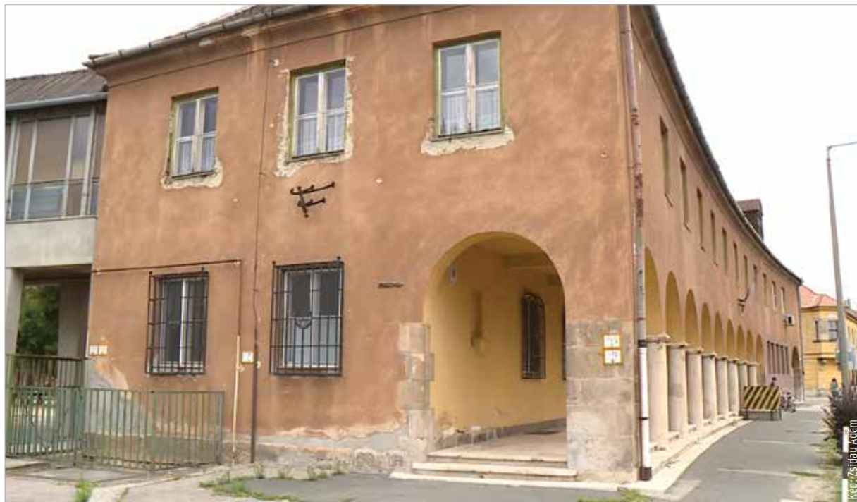
A város egyik legrosszabb állapotú oktatási intézménye is megújul