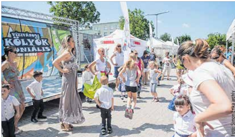
A rendezvény ezúttal is ingyenes lesz

Az ötödik évforduló tiszteletére ovis ötérvadát hirdettek, amire nyolc óvoda jelentkezett. Ötéves gyerekek ötfős csoportokban hajtják végre az ötérvadot, a helyezett megkaphatják azokat a játékokat, amikkel végrehajtották a feladatokat. Lesz bábelődés, gyerekkoncert, de a hagyományokhoz híven a fehérvári cégekkel is megismerkedhetnek a legkisebbségek. A szervezők több nagy cég, például a Fejérvíz, a Depónia, a Széphó és a Városgondnokság szakembereit hívták meg, akik játékos formában ismertetik meg munkájukat a gyerekekkel, de jelen lesz a honvédség és a rendőrség is.