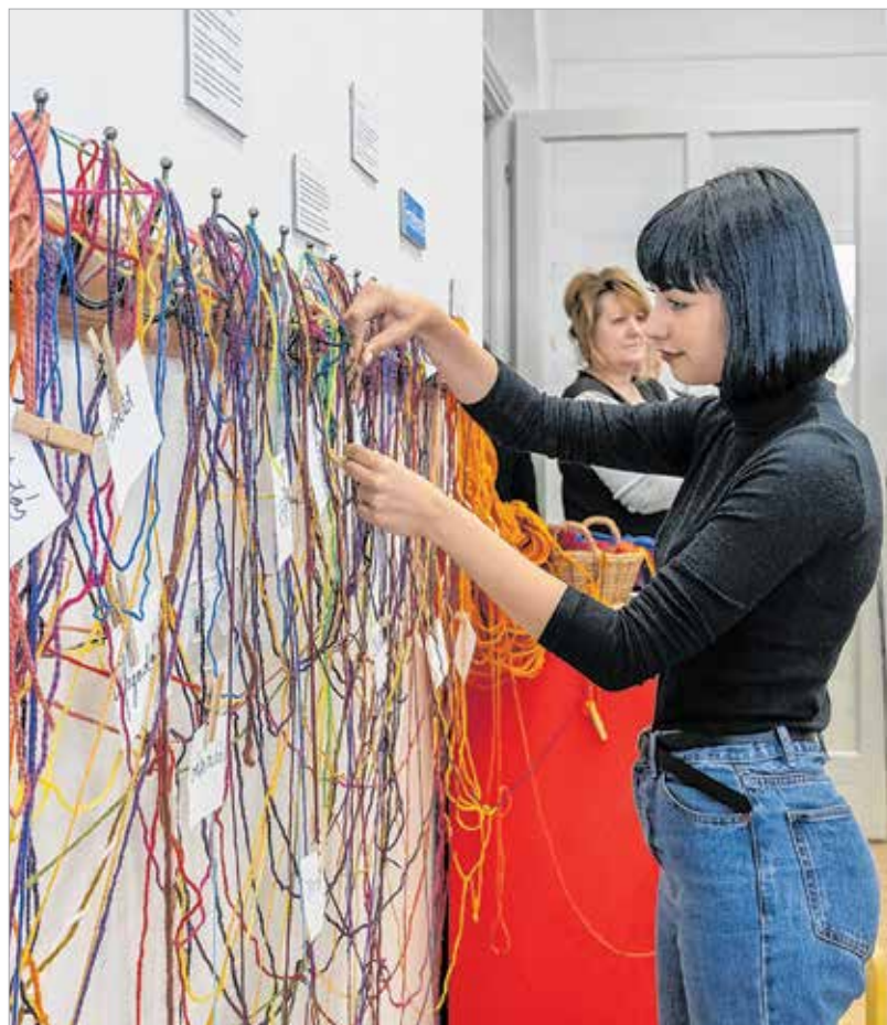
A Szent István Király Múzeum Országzászló téri épületébe lépve egy fonalat követve jutottunk el arra a kísérleti kiállításra, melynek készítői a Ciszterci Szent István Gimnázium 10. és 11. évfolyamos diákjai voltak