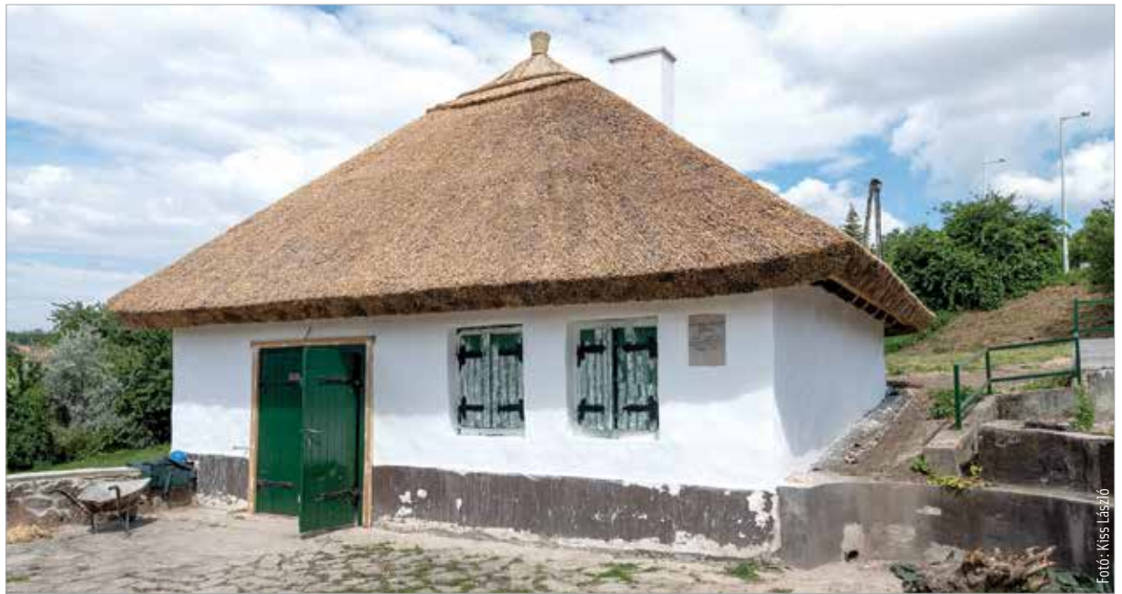
A Bence-hegyen lévő családi pincét Vörösmarty apjának halála után nem sokkal elárverezték

belőle. A szabadságharc leverése után Baracskán nyújtanak felé segítő kezet, nem hagyják, hogy szükségét szenvedjen. Az Üllői úti Bártfay-szalonn rendszeres látogatói a reformkori írók, költők, politikusok: Vörösmarty, Kisfaludy Károly, Bajza, Deák. Bajzával szerkesztette az Athenaeumot, kilenc társával alapította meg a Kisfaludy Társaságot, haldoklása idején is Kisfaludy lába nyomát kereste. Annak a pesti háznak az emeletére költözött, ahol Kisfaludy Károly fejezte be életét. Halála után pedig Deák Ferenc lett Vörösmarty gyermeke-