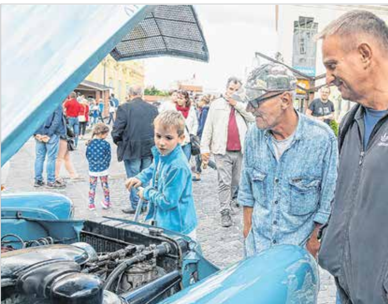
Több ezren jöttek-mentek a kiállítóterek között