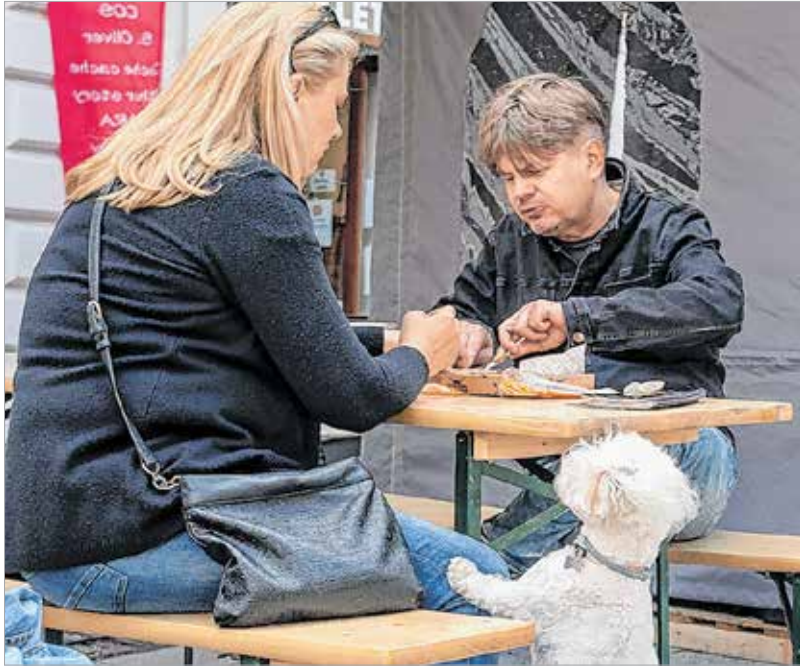
A kutyát érdekelte volna...

A múlt hétvégén tartották az I. Streetfood Fesztivált Fehérváron. A sajnálatosan szegényes kínálat keretében pulled porkot, kacsamellet, fánkokat és sós-sajtos kürtőskalácsot is kóstoltak az érdeklődők. A színpadon fellépett többek között Pély Barna és a Winnetou Jr. Country Band. A kicsiket óriásbuborékokkal, a nagyobbakat pedig biciklis bemutatóval szórakoztatták.