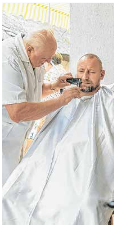
A bátrabbak kipróbálhatták, hogyan beretvél egy hagyományos borbély...

Idén már a XV. Tűzzel-Vassal Fesztivált rendezték június 23-án, szombaton a Rác utcában. A késes és kés-készítő mesterek, kovácsok és fegyverkovácsok országos találkozója idén a pásztorkodás és a pásztorelet bemutatásával is kiegészült. A fesztiválra ötvenkét mester érkezett az ország valamennyi tájáról.