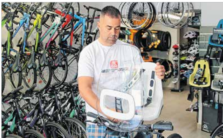
A legkisebb gyerekeket ilyen ülésben ültethetjük magunk elé