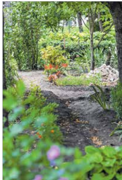
Panelkert az Ősz utcában