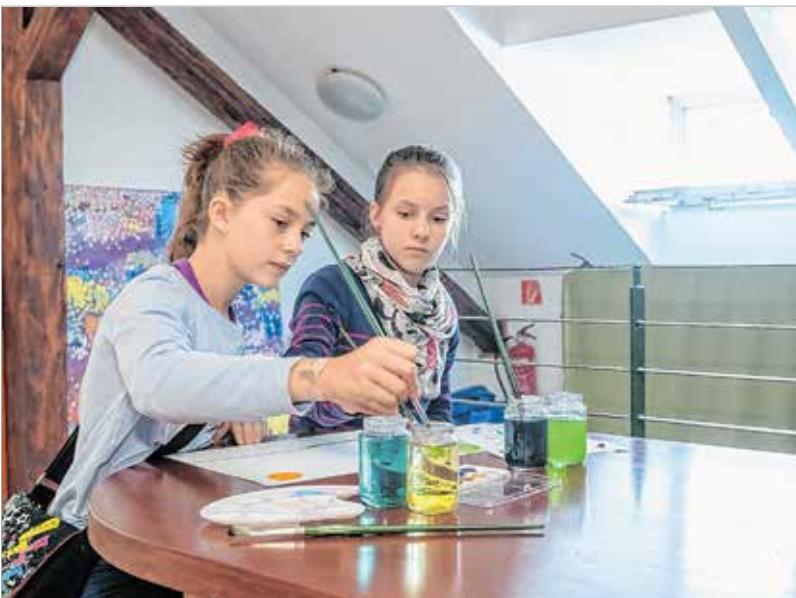
Az Oskola utcában a Deák-gyűjteménybe betérők a Hóborost ultramodernek a Műkertben című kiállítás kapcsán közösen alkothattak az emeleti galériában