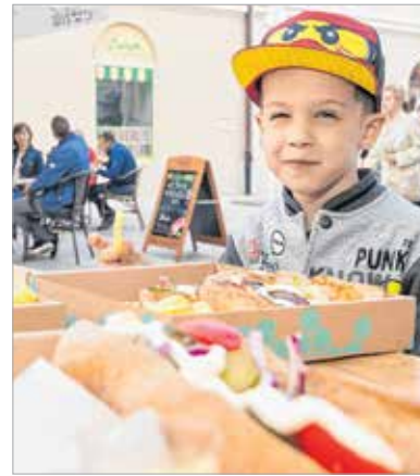
A kisebbek is gasztroturistáskodtak