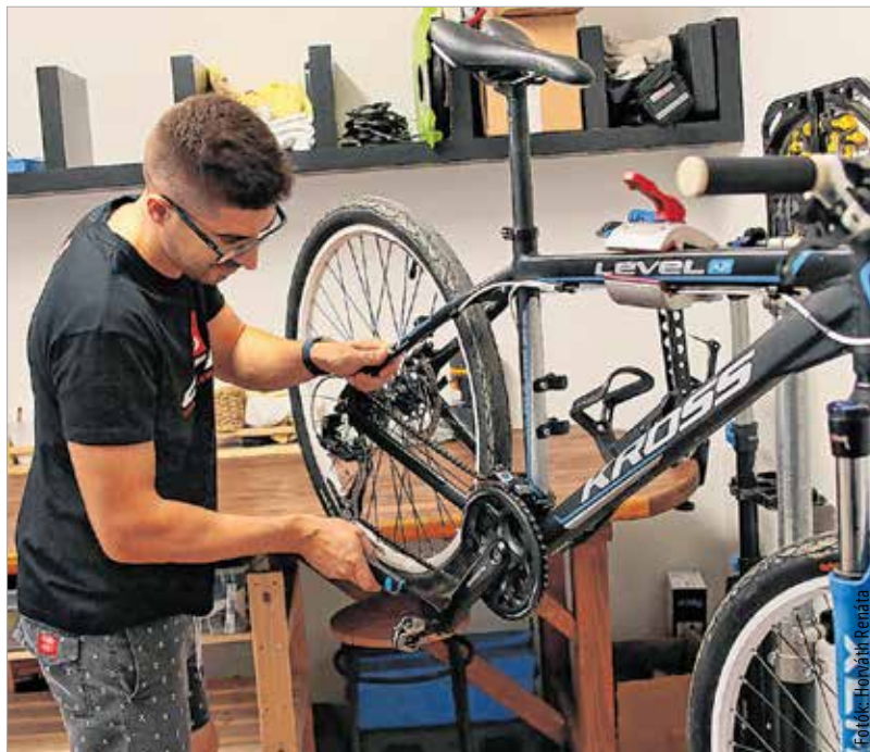
Évente érdemes átnézni a kerékpárt!

„Egy új kerékpár vásárlása után mindig elmondjuk a vásárlóinknak, hogy száz kilométer használat után mindenképpen jöjjenek vissza ellenőrzésre, amikor már bejárt a kerékpár. A boudenek utánállítása szükséges lehet ilyenkor. Ezt követően pedig az éves átvizsgálást javasoljuk.” – foglalja