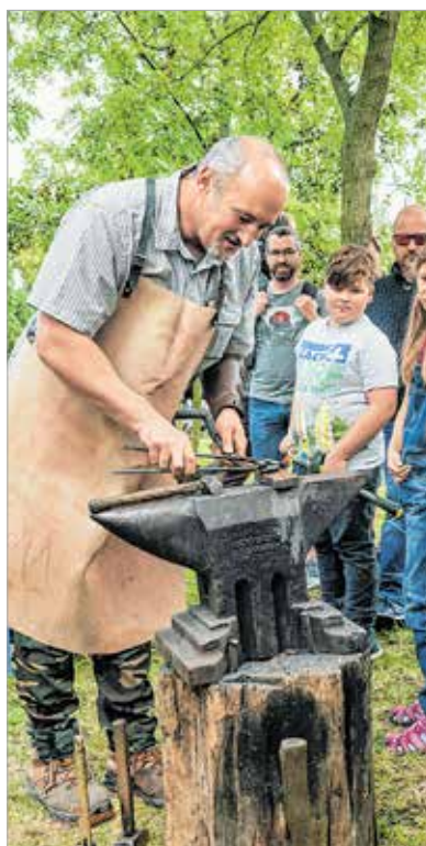
...vagy bepillanthatnak a fegyverkovácsok életébe