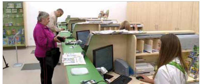
A maroshegyi posta mostantól a Balatoni úti bevásárlóközpontban található

Az ügyfelek számára jó hír, hogy a nyitvatartási idő is hosszabb lett, így hétköznapokon 10 és 18 óra között intézhetik ügyeiket.