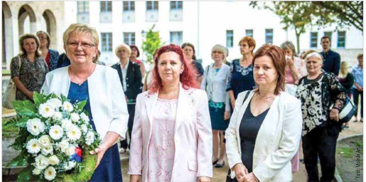
A rendezvényen elismerték a megyében dolgozó védőnők, továbbá a Humán Szolgáltató Intézet munkatársainak egész éves áldozatos munkáját

„Egy város életében az egészség az egyik legfontosabb alapkérdés, így az egészségügyben dolgozók megérdemlik, hogy minden évben megemlékezzünk a mindennapi munkájukról. Ha a szakemberek tudják tenni a dolgukat – és ebben mi minden segítséget megadunk – annak minden székesfehérvári polgár haszonélvezője lesz.” – mondta Cser-Palkovics András polgármester, majd hozzátette: „Tanuljunk meg megbecsülni az országot,