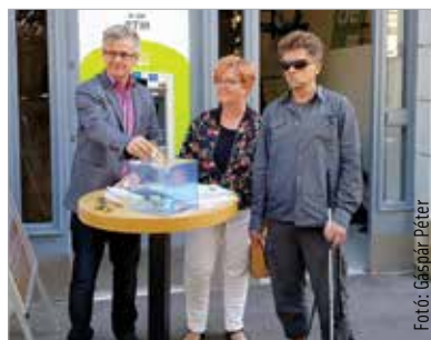
Július elsejétől a MÁRKÉ „a nyár szervezete”, kampányukkal a fehérvári járókelők is találkozhattak a Kossuth utcában

Az első forintok már belepottyantak a perselybe. A MÁRKÉ javára lehet adományozni mostantól három hónapig a Kossuth utcai bankfiók előtt. Az egyesület a befolyt összeget a térségben élő látássérültek eszköztámogatására fordítja majd. Például okostelefonokat, különféle közlekedést segítő eszközöket vásárolnak majd, vagy éppen vakvezető kutya beszerzésének támogatására fordítják az adományokat. Az egyesület tagjai érzékenyítő programokkal is készülnek a kezdeményezés időtartama alatt. Az apró- és papírpénzeket kell megkülönböztetni bekötött szemmel. Azokra a nehézségekre szeretnék felhívni a járókelők figyelmét, amivel a látássérültek a mindennapokban küszködnek.