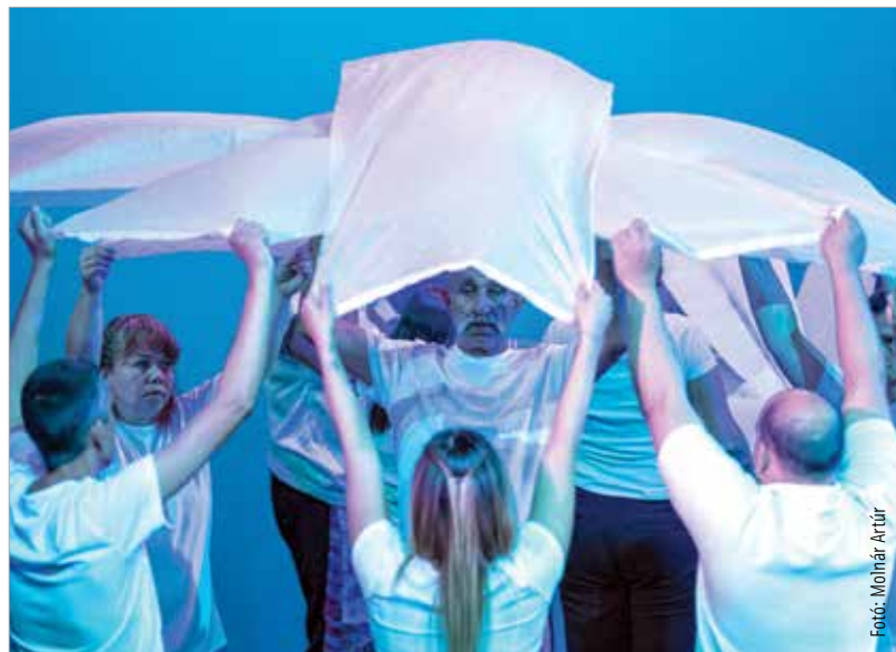
A fellépők jelképrendszere a tisztaságot sugározza