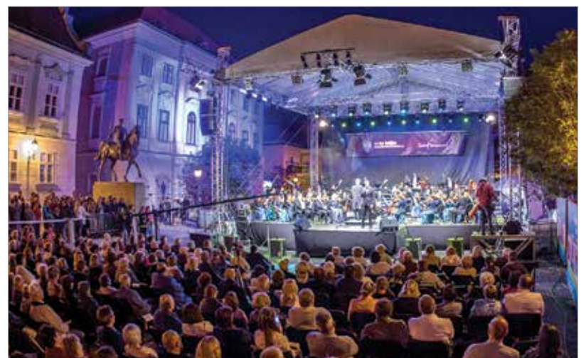
A Parlami d'amore könnyed nyáresti koncert ezúttal is üde színfoltja volt a fehérvári zenei nyárnak

át a hallgatóságot szívekhez szóló dallamokon keresztül az érzelmek világába. Az énekesnő otthonosan mozog a blues, a dzsessz és a soul világában. A legjelesebb itáliai és európai musicalszínházak színpadain is folyamatosan találkozhat vele a közönség. Fabio Vagnarelli ugyancsak tapasztalt és elismert művész, számos musical-produkcióban szerepel. Meglepetésekben sem volt hiány ezen az esten: ahogy felcsendült Verditől az Aida bevonulási indulója, trombiták szólaltak meg a nézőtér szélén és a Városháza