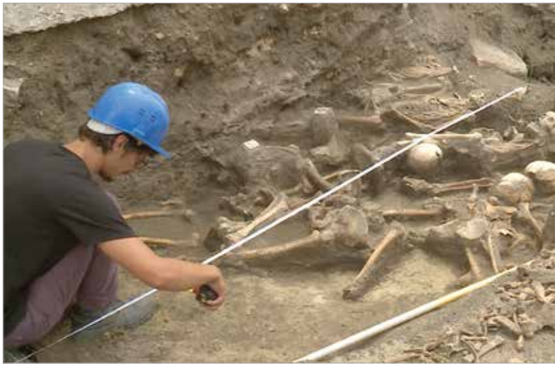
Középkori, török és barokk kori sírokat tártak fel a szakemberek