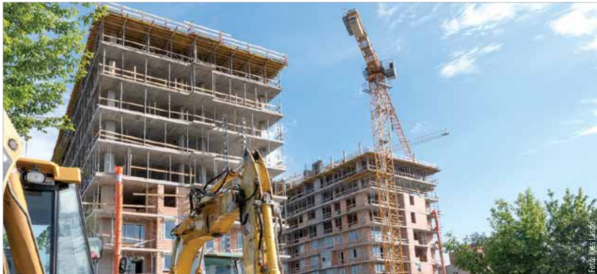
Fehérváron az országos átlag feletti az épülő ingatlanok száma