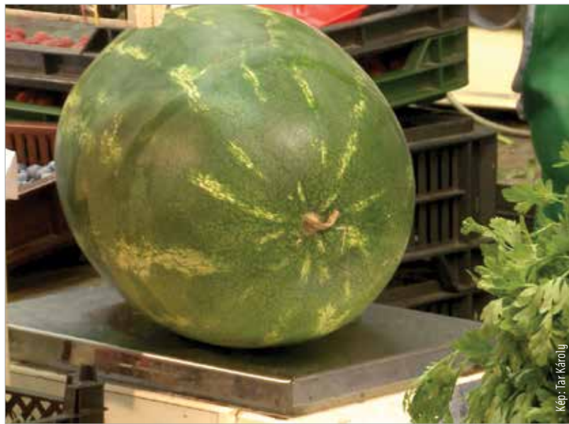
A piacról a gyerekek asztalára került az első idei görögdinnye