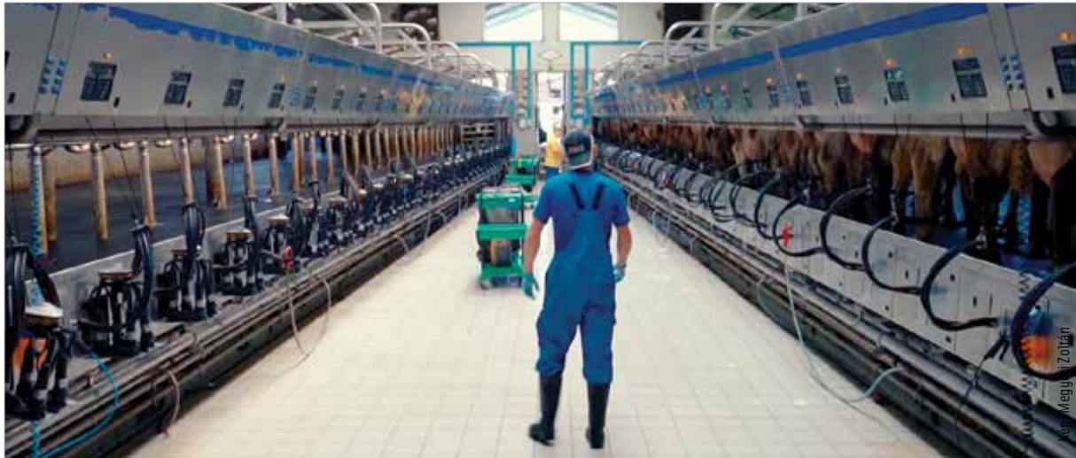
A nyerstej beltartalmi értékének csökkenése is szerepet játszik az áremelkedésben

„A klímaváltozás miatt a zsír és a fehérje terén nagyon komoly