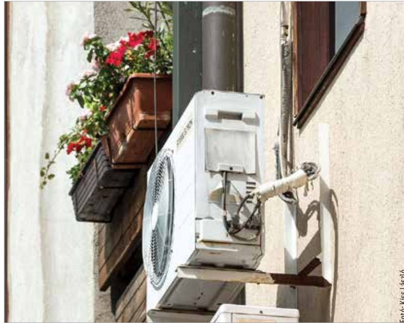
A légkondicionálás segíthet

Bizonyos élelmiszerek felerősítik a szénanáthások érzékenységet, fokozhatják panaszait. Ebben élen jár a görögdinnye, ami még úgynevezett keresztallergiát is okozhat: a szemviszketés, orrfolyás, tüszögés mellett ajak- vagy nyelvduzzanat, hasi görcsök is előfordulhatnak. Hasonló okokból szintén jobb, ha nem visszük