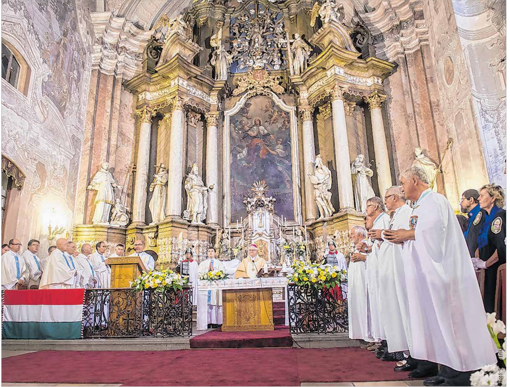
Az ünnepi szentmisén az egyházmegye papjai, az egyházi iskolák tanulói valamint a város és a különböző intézmények, szervezetek képviselői is részt vettek. A megyés püspök a Magyarok Nagyasszonya pártfogását, közbenjárását kérte az egész magyar néptől.