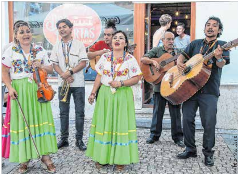
A fesztivál többi napján is lehetett látni népviseletbe öltözött táncosokat. A mexikóiak például a helyi mexikói étterem ajtajában adtak mini koncertet.