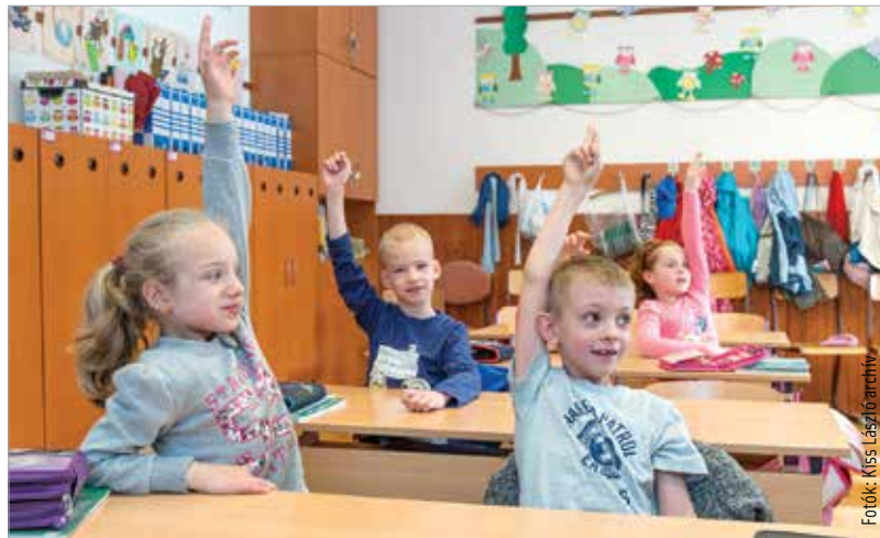
A pihenés után jöhet a feladat!

Egy másik fontos kérdés, hogy ismétljen-e a diák? A tanító szerint nem szabad kötelező jelleggel leültetni tanulni. Az viszont fontos, hogy nyáron is olvasson. Mindegy, hogy képeskönyvet, mesét vagy képregényt. A lényeg, hogy örömmel tegye: „A vakáció utolsó napjaiban át lehet