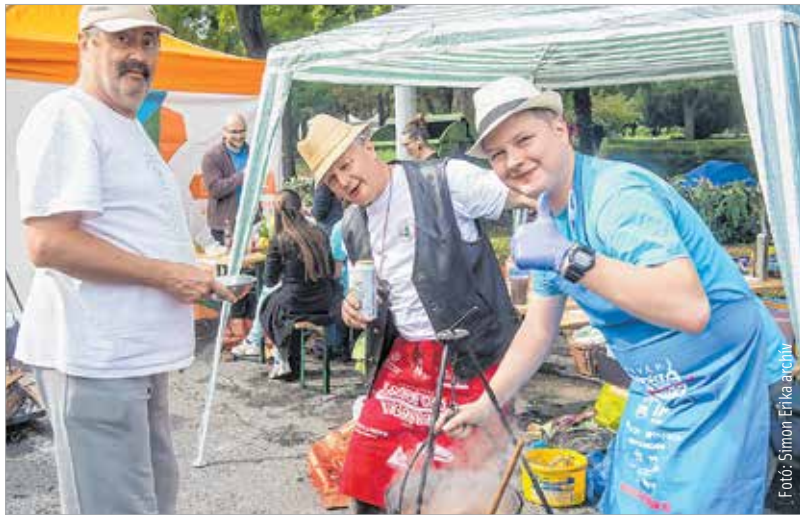
A lecsóba sokminden belefér!

Bár a helyek száma évek óta nem változik, azok egyre hamarabb kelnek el. Ez is alátámasztja, hogy