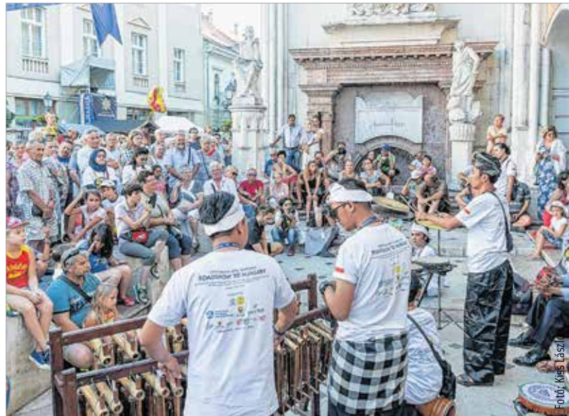
A Mátyas király-emlékműnél távol-keleti dallamok is felcsendültek. Az egzotikus hangszereket a bátrabbak ki is próbálhatták.