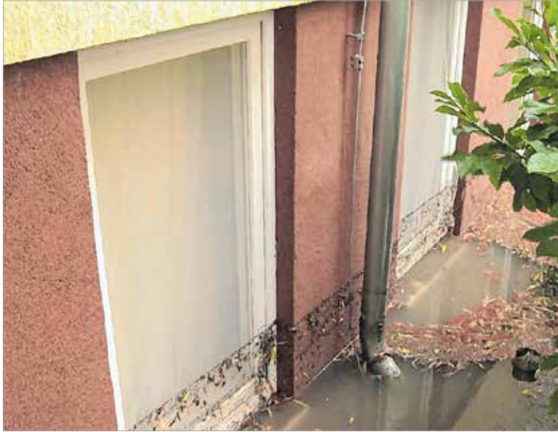
Az alagsorban mintegy háromszáz négyzetméteren egy szórakozóhelyiséget valamint öt lakásként használt apartmant árasztott el a víz

Szombat reggelre annyi eső esett Székesfehérváron, hogy a Kodolányi Apartmanháznál több millió forintos kár keletkezett a vihar miatt. Még az épület belsejét is elöntötte az eső, ugyanis megtelt a vízvezető árok, kiöntött a