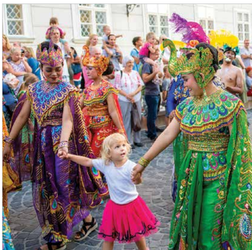
A zárófelvonuláson az indonéz „pávák” teljesen elkápráztatták a gyerekeket