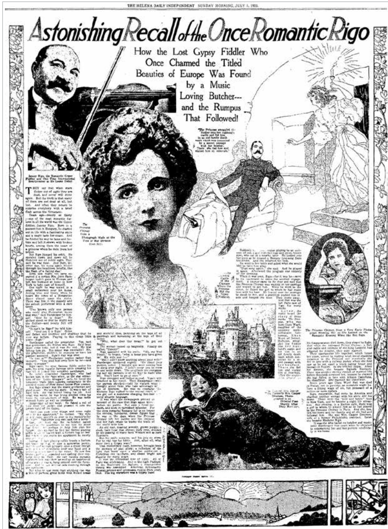
„A Rigó-story” – a Daily Independent 1925. július 5-i cikke