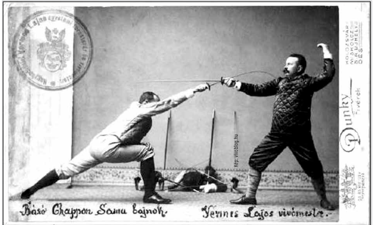
Fotó 1903-ból. Itt csak sportból párbajoznak.

lovagias úton, mint nálunk, Magyarországon.” – kérkedik a legnépszerűbb párbajkódex írója, Clair Vilmos Emil. A becsület megvédésére a párbajt tekintették az egyedüli hatékony eszköznek. A jog a sérelmek orvoslására gyengének bizonyult. A párbaj szokása évszázadokon keresztül