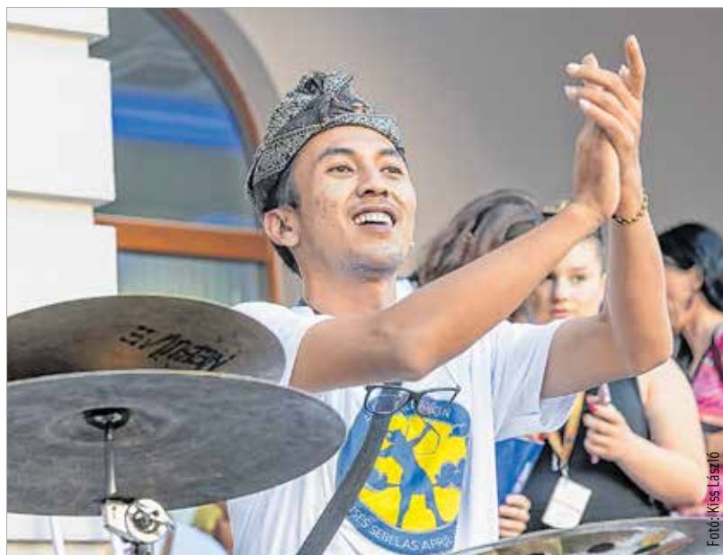
A közönséget nem kellett nagyon hangolni