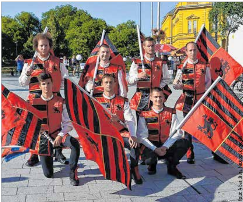
Három éve a Koronázási Ünnepi Játékokon

A zászlóforgatás érthető módon szabadtéri műfaj, és még csak nem is feltétlenül színpadra való, inkább tágasabb, nyitottabb tereken látványos. Zárt térben kisebb, visszafogottabb dinamikájú és ívű dobásokra van csak lehetőség. Odakint a zászlók akár tíz-tizenkét méter magasra is repülnek. „Ritkán szereplünk színpadon, és ha szűkösnek látjuk a teret, akkor inkább kevesebben állunk a közönség elé. A magasság mellett ugyanis a szélre is nagyon oda kell figyelni, nehogy a közönség közé fújja a zászlót!”