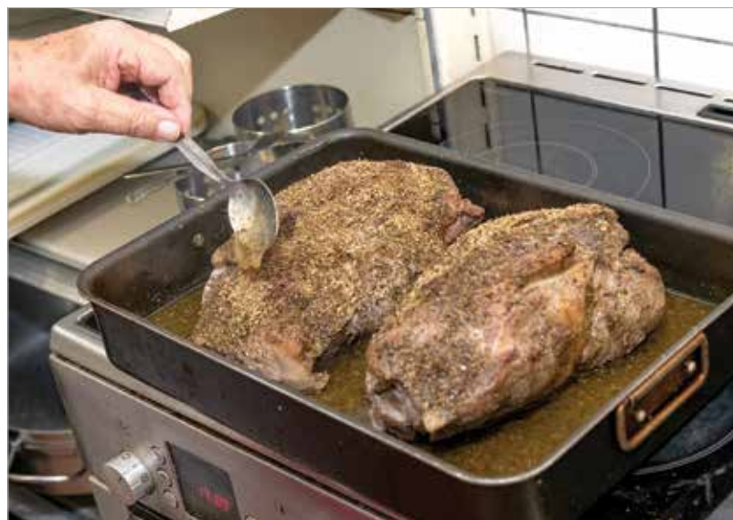
A combot és a tarját a görögök sóval és oregánóval fűszerezik