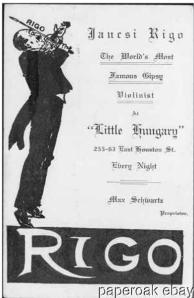
Rigó Jancsi New Yorkban, a Little Hungary-ben

Chimay hercegnő és Rigó Jancsi egészen biztosan föllépnek Bécsben a jubileumi kiállítás Heidsic pavilon-