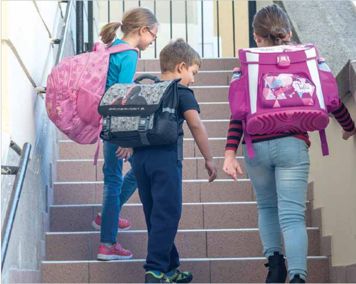
Hogy mennyire nehéz az iskolatáska, a szülőkön is múlik!

gusztus utolsó két hetében érdemes elhagyni az ebéd utáni szunyókálást, és este fél órával előbb altatni, hogy a szeptemberi korán kelés senkinek se okozzon gondot.