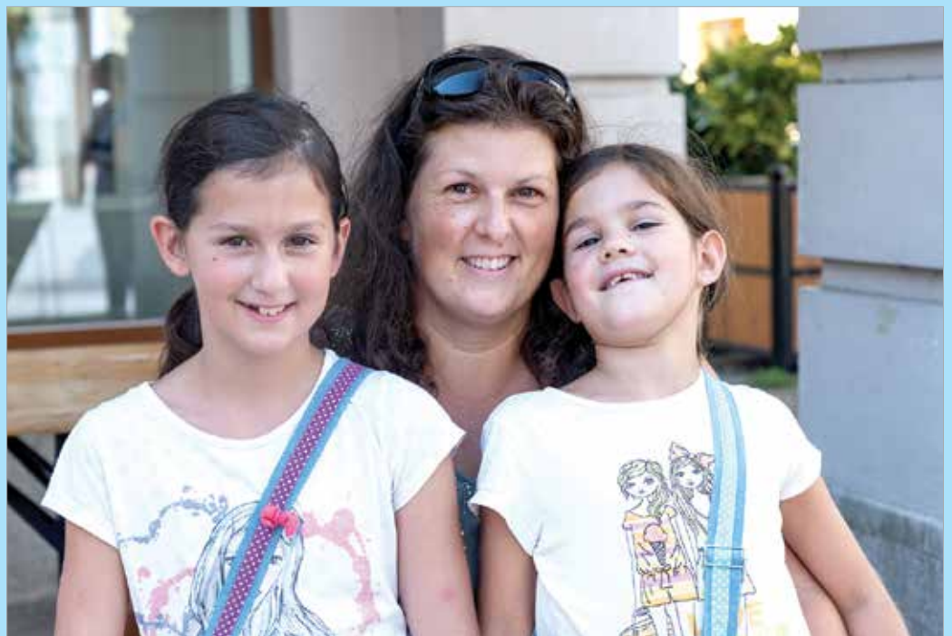
Somogyfoki Enikőék élnek a papírboltok akcióival

Az iskolából ugyan kapnak instrukciókat, hogy nagyjából miket várnak el például ragasztóban vagy filctollban, de vagy igazodnak hozzá, vagy felülbírálják a szülők. A támogatás nagyban hozzájárulhat egy-egy iskolakezdési felkészüléshez, de a végső döntés legtöbbször a szülők kezében van. A minőséget előtérbe helyezőknek sem kell feltétlenül a drágább eszközöket megvásárolni, de ki kell tapasztalni, mit tartanak fontosnak és mi éri meg a legjobban.