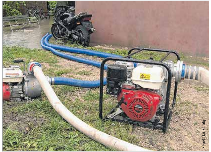
A tűzoltók nyolc órán keresztül szivattyúzták a vizet

víz, ami az apartmanház udvarát és a földszint alatti lakásokat is elárasztotta és lakhatatlanná tette. A katasztrófavédelem munkatársai több száz köbméter vizet szivattyúztak ki. Akiknek el kellett hagyniuk a lakásokat, a Széchenyi úti József Attila Kollégiumban biztosítottak