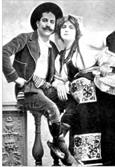
Rigó Jancsi és Clara Ward-Chimay képeslapon