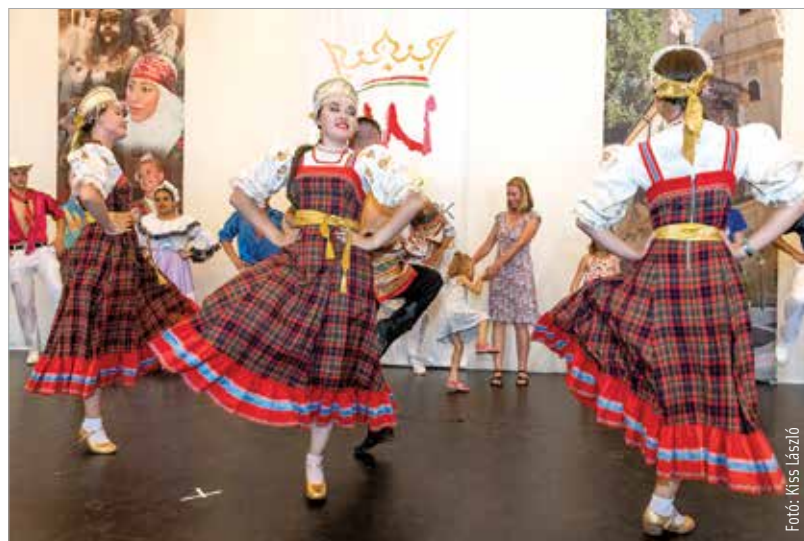
A Királyi gyermekjátson ismerkedhettek meg a legkisebbek a lépésekkel