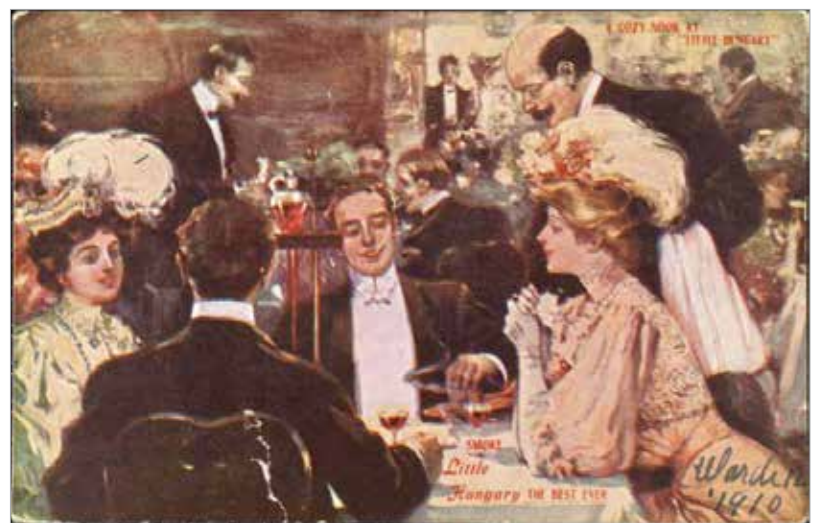
A Little Hungary 1910-ben