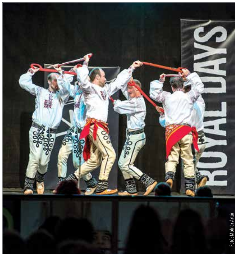
A cseh csapat kardos tánca egy húsvéti szokást elevenített meg