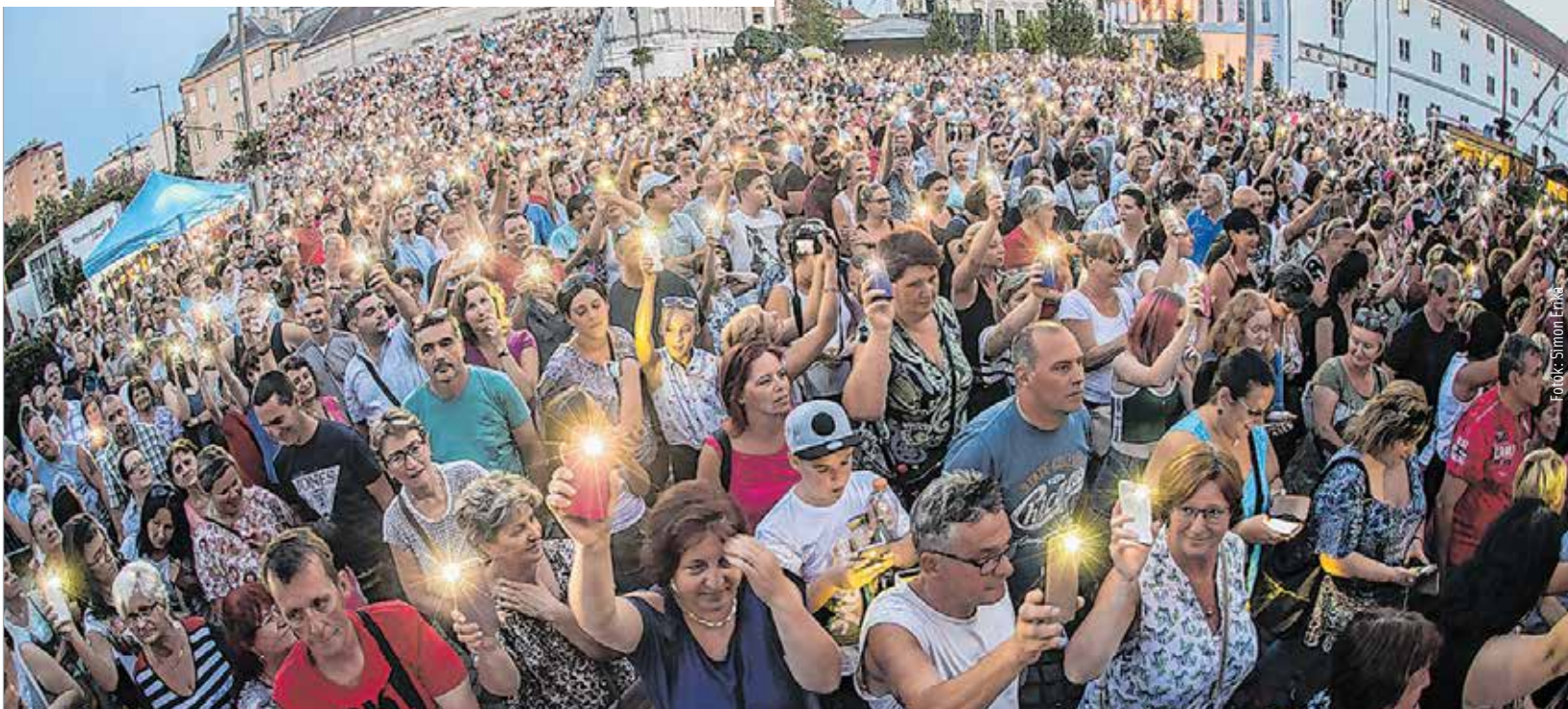
Minden este megtelt a Zichy színpad előtti tér

Fergeteges zenei élményben volt része mindazoknak, akik a Zichy liget nagyszínpadára esküdtek, ahol estéről estére az elmúlt húsz év meghatározó magyar zenekari léptek fel, telt ház előtt.