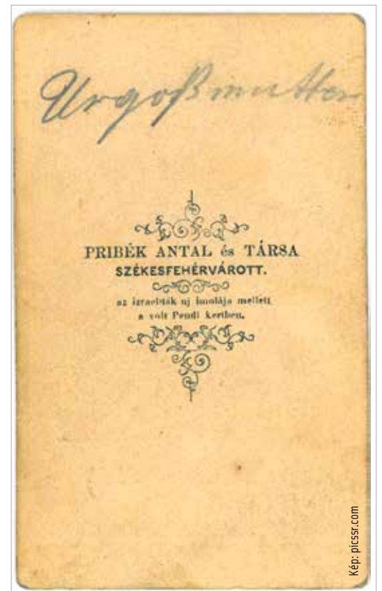
Pribék Antal fényírdája

Hogy juthat egy székesfehérvári menyasszony és vőlegény pápai áldáshoz? Mi a kapcsolat Königrätz és a Stignitz-kávéház között? Hány perc alatt tették meg a kerékpárosok a Székesfehérvár-Sárbogárd oda-vissza versenyt versenyt száztizt éve? A válaszokra a folytatásban lehetünk rá.