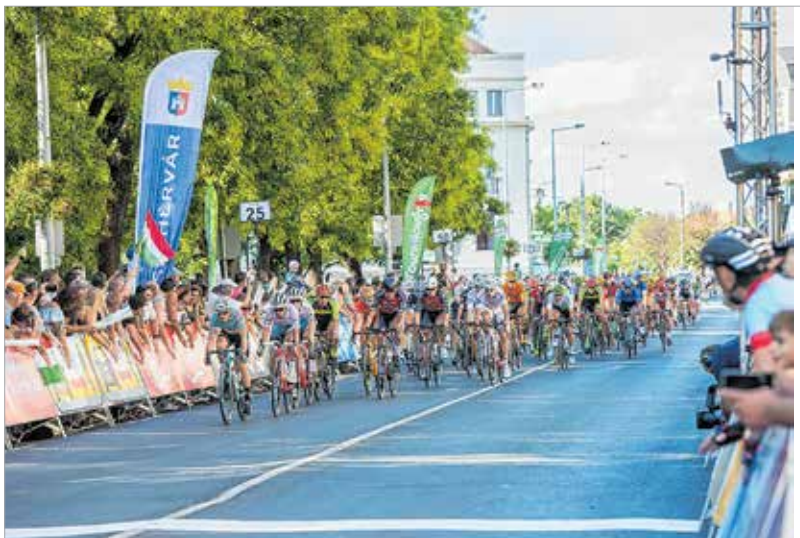
Közel százkilencven kilométer, három gyorsasági és két hegyi részhez után szángludott be a Tour Fehérvárra