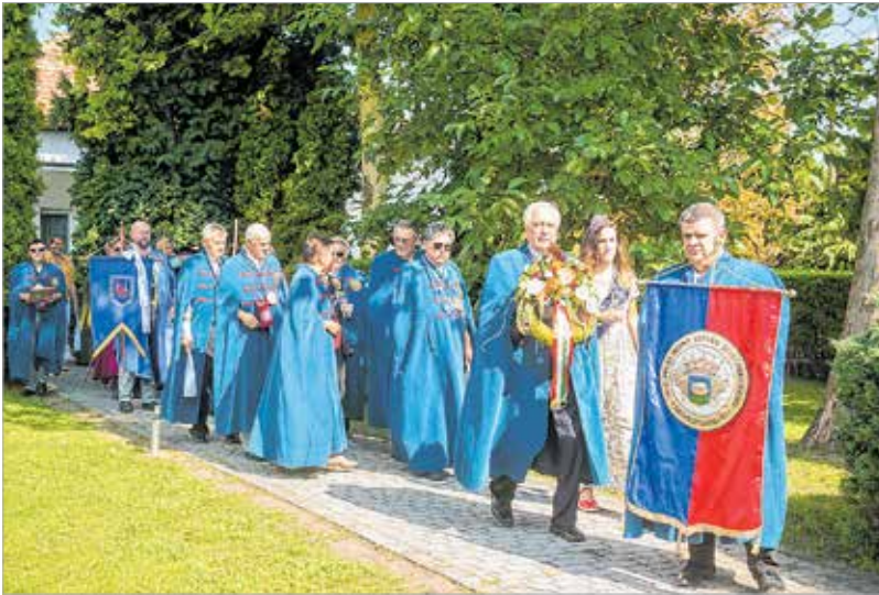
A mulatság a hagyományokhoz híven a borrendek felvonulásával kezdődött

Régi hagyomány, hogy Szent István napja előtt Öreghegy vendégül látja a várost. Idén sem volt másként: szórakoztató zenés-táncos színpadi műsorokkal, borrendek felvonulásával, kenyér- és borlúrással várták az érdeklődőket.