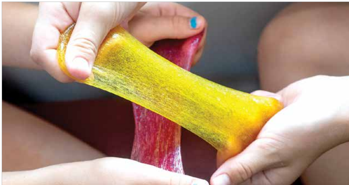
A slime gyurma a felnőttek számára gusztustalannak tűnik, bár a gyerekek szeretik

A slime gyurmáról azonban újabban olyan vizsgálati eredmények