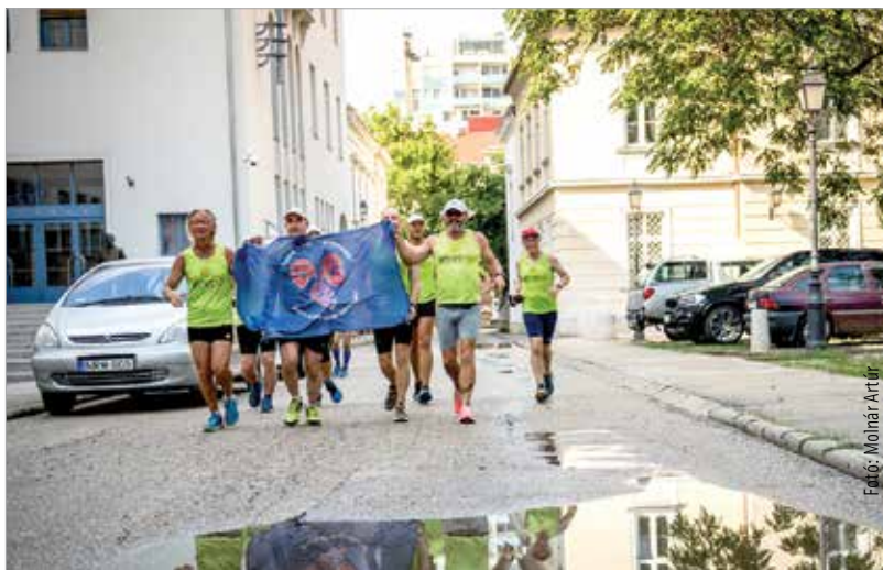
Az utolsó métereken a JótiFuti csapata

hogy Esztergom, Győr, Komárom, Celldömölk és Veszprém érintésével és mintegy háromszáznyolcvan kilométer megtétele után állami ünnepünkön, augusztus huszadikán térjen vissza a koronázóvárosba. A nem éppen rövid út során sokan csatlakoztak hozzájuk akár csak néhány kilométer erejéig, de ami legalább ennyire fontos, sokan segítettek a jótékony megmozdulást adományukkal. A Fehérvári Heti Betevő számára pedig nagy segítség volt a gyűjtés. A civilszervezet kéthetente tart élelmiszerosztást rászorulóknak. A JótiFuti csapata tehát idén is kitétt magáért, futottak, segítettek, mert ahogy a mottójuk is mondja: a láb mindig kéznél van!