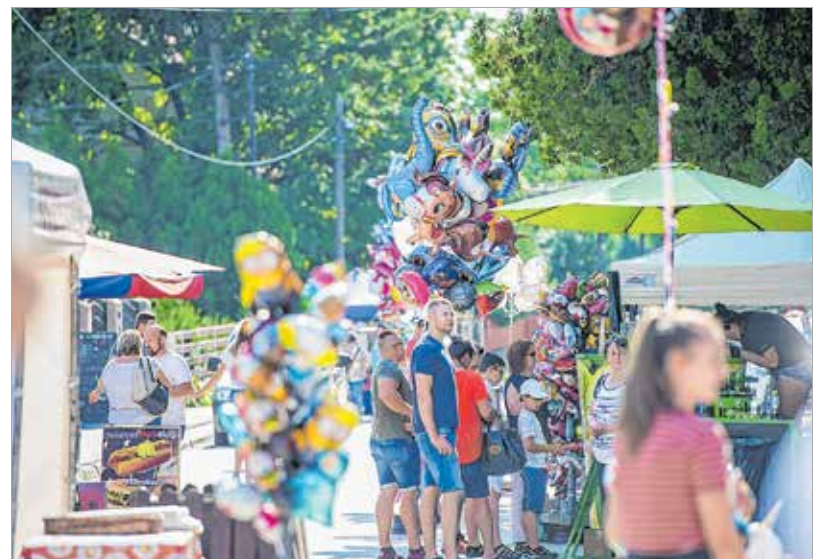
Nem hiányozhatott az utcai kirakodóvásár sem