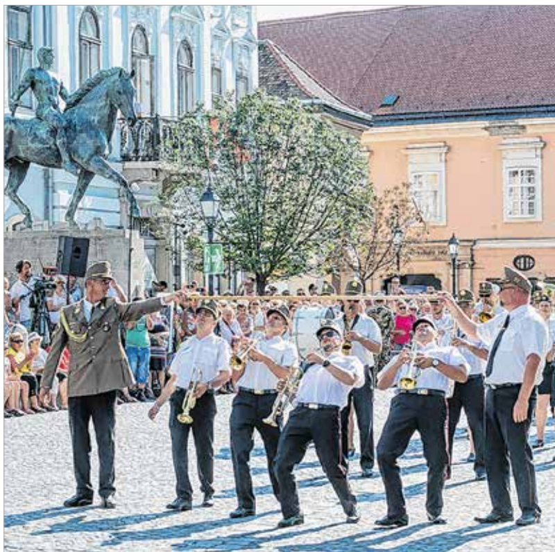
Limbőláz hangszerekkel súlyosbítva

A katonazene több évszázados múltat tekint vissza: régen a harctéri műveletek vezetésére használták, hiszen ahova nem jutott el az emberi hang, oda eljutott a dob és a kürt hangja. Ahogy fejlődött a technika, úgy ez egyre inkább háttérbe került, és a katonazene is átértékelődött. Később a toborzásban kapott szerepet, illetve a katonaság és a társadalom közötti kapcsolat építésében.