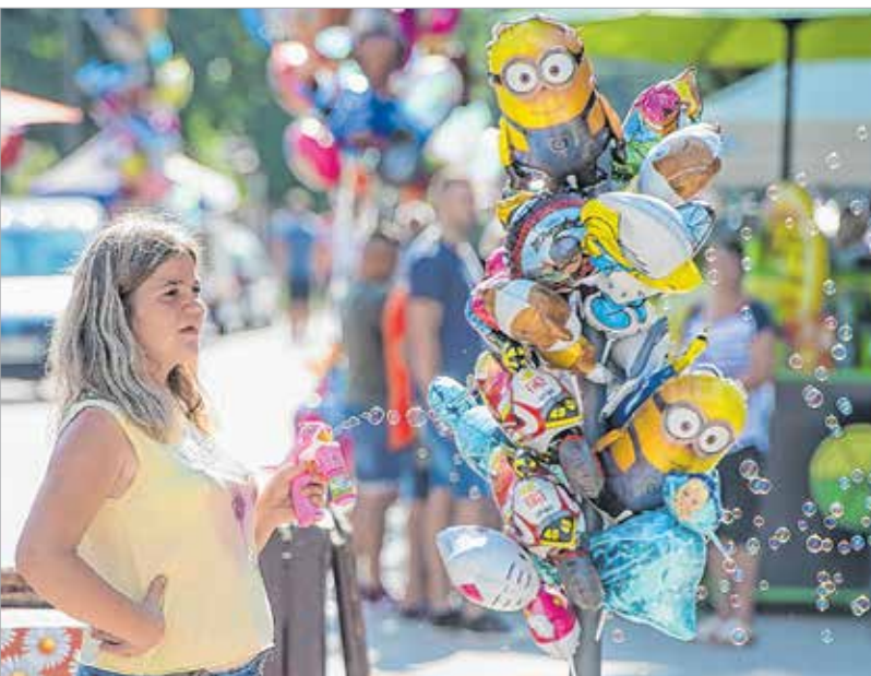
Egyéb alternatív szórakozási lehetőségek is akadtak