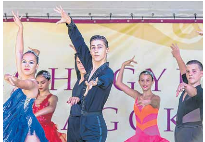
Lenyűgöző táncosok, vérpezsdítő ritmusok