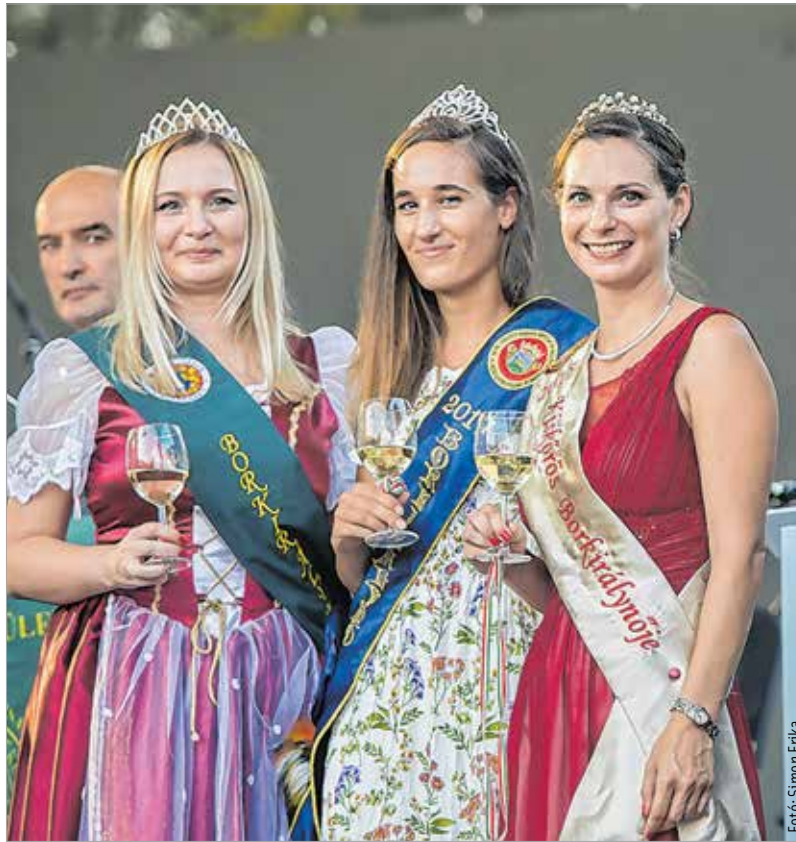
A borrendi találkozáson bemutatkoztak a borkirálynők is