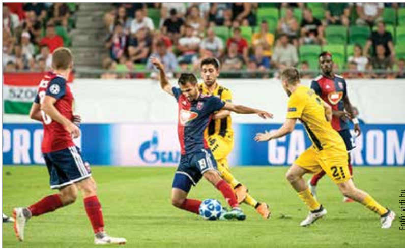
Nikolovéknak meg kellett szenvedniük a görögök ellen a Fradi-pályán

A Vidi magasra tolt védekezésből előreivelt labdákkal próbálkozott, vagy éppen oldalról belőtt szabad-