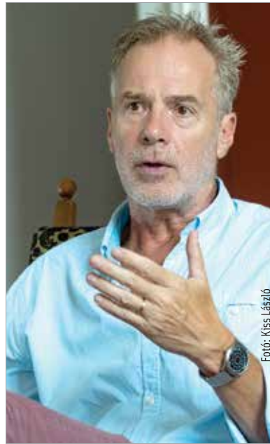
Hirtling István színművész, a Katolikus Társadalmi Napok védnöke

„Az ember kulturális, családi és vallási identitása nagyban meghatározza az életét. Az én esetemben ez természetesen nem jelent kizárólagosságot. Mindig a nyitottságot és a sokszínűséget hirdetem, ahogy ezt a szüleimtől tanultam. Ők is nagyon mélyen motiváltak voltak vallási identitásukat tekintve, ugyanakkor soha nem zárkóztak el, és nem létezett számukra sem a kirekesztés, sem a kizárólagosság. Sokkal befogadóbbak voltak, annak ellenére, hogy