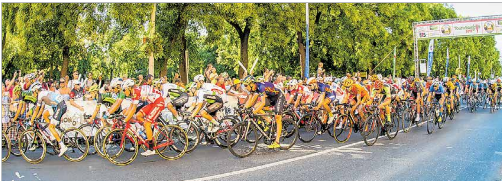
A televíziós közvetítés révén hat kontinens közel kétszáz országába jutottak el a Bajnokok Városáról készült felvételek