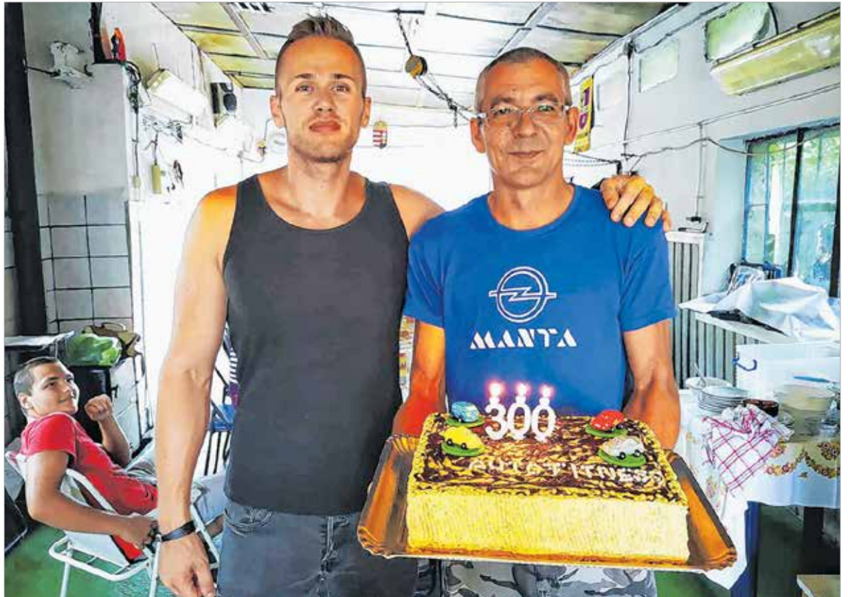
A közös munka során barátság született