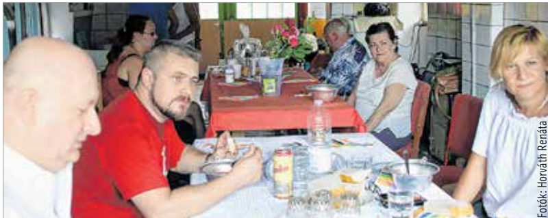
Halászlé a szerelőakna fölött