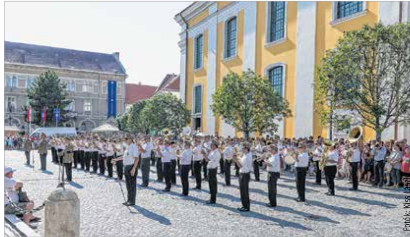
Térzenével kezdődött a fesztivál. Idén Tatárol, Debrecenből és Budapestről érkeztek helyőrségi zenekarok.

A fesztivál névadója, Fricsay Richárd alezredes a magyar katonazene történetének emblemikus egyénisége. 1897 októberében családjával együtt érkezett Székesfehérvárra, ahol ebben az időszakban állították fel az 5. honvédkerület zenekarát a 17. Honvéd Gyalogezred keretein belül. A tehetséges fiatal karmester Székesfehérváron példaértékű kulturális életet teremtett, ápolta a magyar