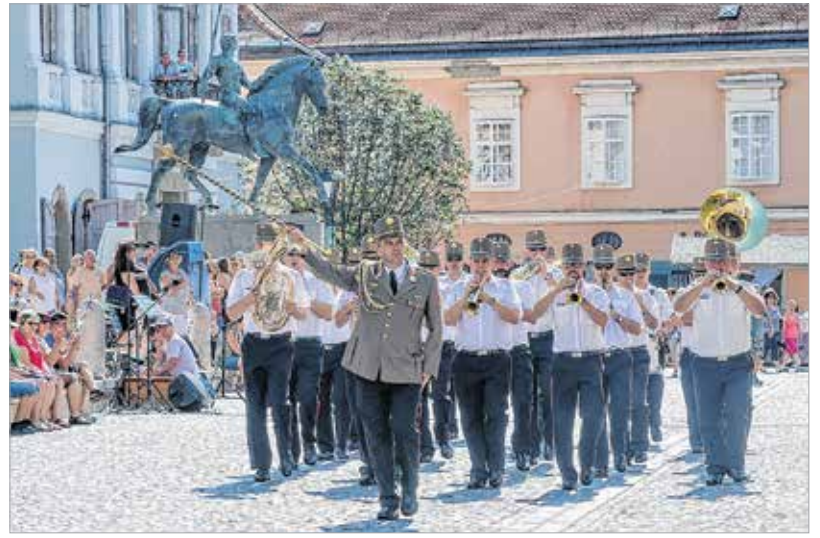
2013-ban, a Szent István-émlékében rendezték meg először a fesztivált, de a katonazenekarok felvonulása ma is ugyanolyan emelkedett hangulatot ad, mint legelőször