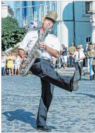
Egyeseknek a könnyed díszlépés sem esett nehezére