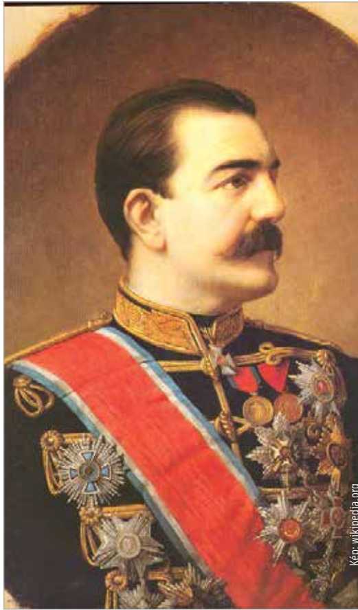
Milán Obrenović, I. Milán szerb király (uralkodott: 1868-1882)