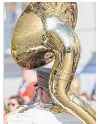
Gömbpanoráma kicsit másképpen