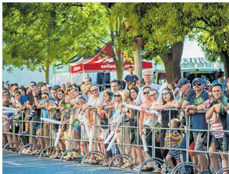
Ezrek szurkoltak a több mint százhusz fős mezőnynek