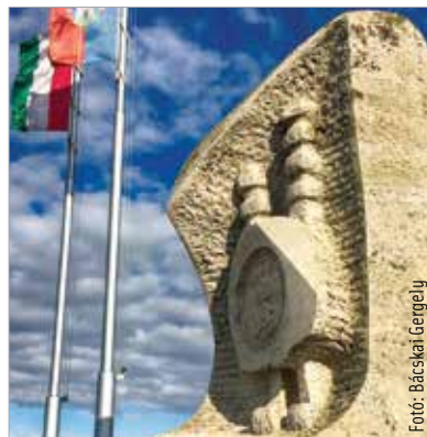
Az Aranybulla a középkori európai jogtörténet második alkotmányos dokumentuma, mely hét évvel az angol Magna Carta Libertatum kibocsátását követően tette le a magyar alkotmányosság alapjait

Prosperis Alba Kutatóközpont Nonprofit Kft. – melynek feladata, hogy a hagyományokra építkezve egy modern város jövőjét tudományos módszerekkel segítsen felvázolni. Olyan nemzetközileg is fontos kutatásokról van szó, mint például az okotechnológia, a jövőorientáció vagy a demográfia vizsgálata, melyek nemcsak gazdasági, hanem társadalompolitikai kérdésekre is hatással vannak. Ez a városi kezdeményezés Magyarországon – és Közép-Európában is – egyedülálló: Székesfehérvár az élen jár.