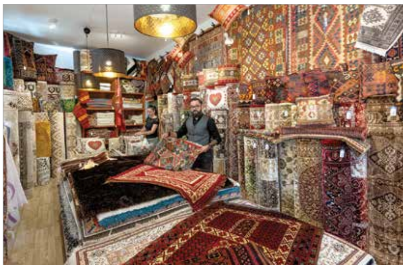
A kézi készítésű szőnyeg a legtartósabb

A szőnyegszőnyegekkel küzdőknek a szőnyegben óhatatlanul is felgyűlő por kellemetlen tüneteket okozhat. Nekik érdemes a mosható pamut-szőnyeget választani, amit akár heti rendszerességgel is kimoshatnak. De mindenképpen voksoljanak a természetes alapanyagokra, részesítsék előnyben a gyapjút!