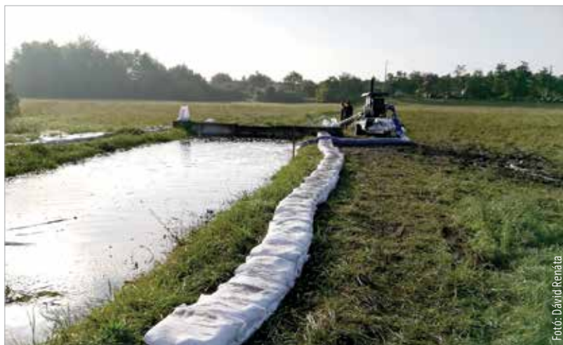
Kedden a Városgondnokság az összes szivattyúját munkába állította, de homokzsákokkal is védekeztek a veszélyhelyzet elkerülése érdekében

A szakemberek a városban több helyen is védekeztek a lehulló csapadék miatti áradások ellen. A Gaja-patakon kívül ilyen helyszín volt például a Jancsár-csatorna, a Hármashíd vagy a Gáncs Pál utca.