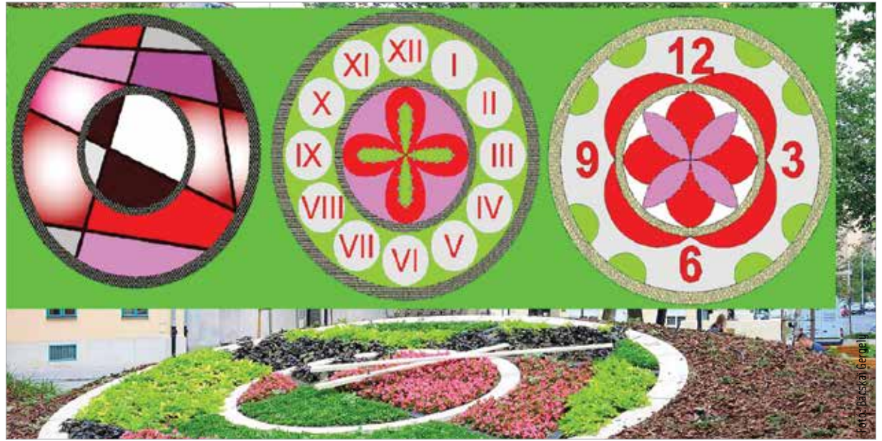
A tervekre szeptember harmincadikán éjjelig lehet szavazni a szekesfehervar.hu oldalon