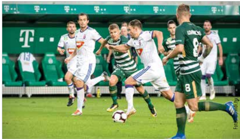
Lendületben a Vidi!