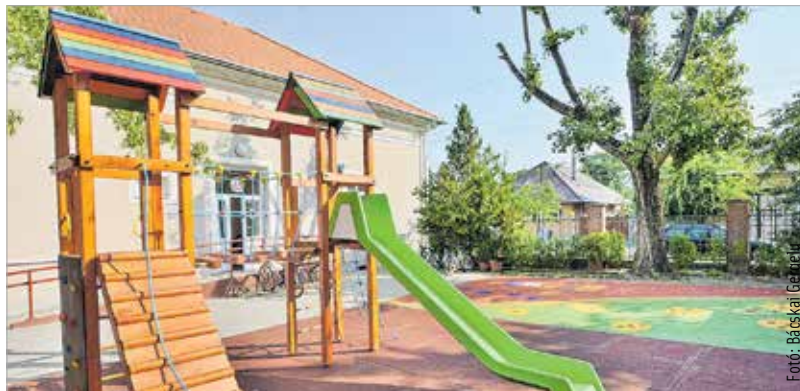
Két nagyobb felújítás is történt nyáron a Felsővárosi Óvodában: önkormányzati forrásból lecserelték a százharminceg éves épület tetejét, és a KÉPES Program keretében megújult az intézmény udvara is. A két beruházás mintegy hatvannyolcmillió forintba került. B. G.