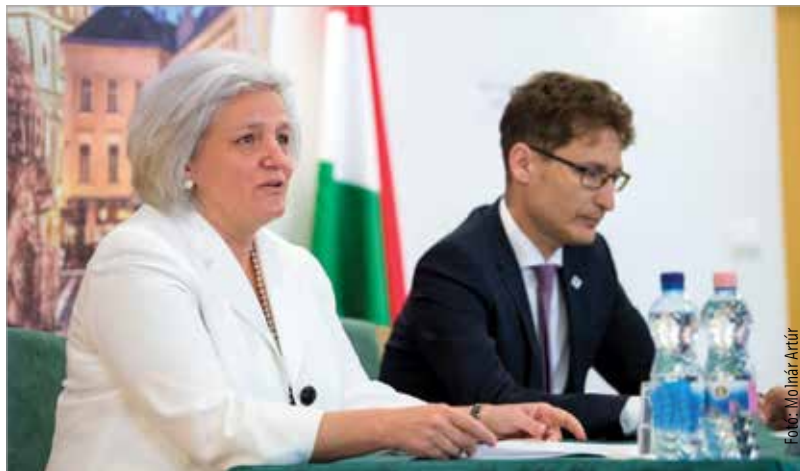
A központban a város jövőjével kapcsolatos kutatásokat végeznek

kutatóközpont működését. Sok kihívás áll előttünk, fontos, hogy kutassuk ezek tudományos hátterét, ráadásul sok olyan kihívás is van, amire a választ nem találjuk meg Magyarországon.” – mondta Cser-Palkovics András polgármester.