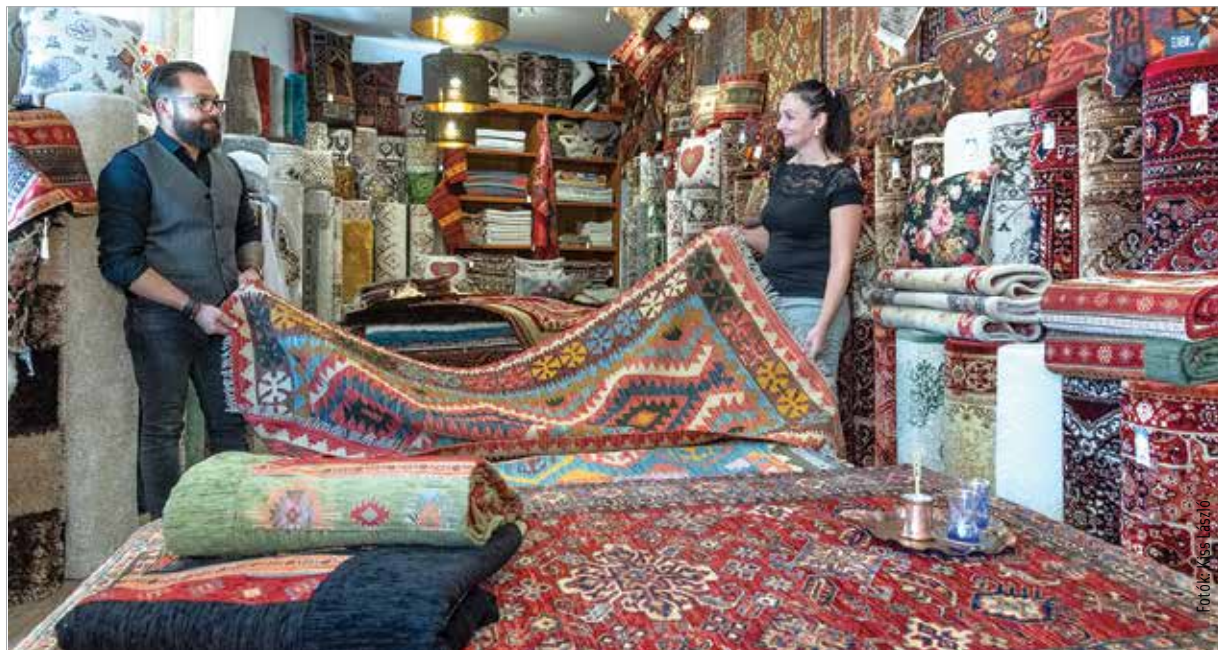
Egy igazán jó szőnyeg akár egy életre is szólhat