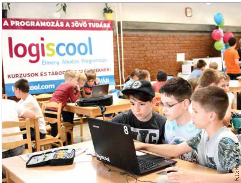
Az iskola Digitális Kaland versenyén Fehérvárról is több mint száz általános iskolás vett részt

készíténi. Óriási örömet jelent, amikor a gyerekek által összerakott programból működőképes játék vagy animáció válik. Az oktatási rendszer segítségével bárhol elérhető az elkészült programok, így otthon is meg tudják mutatni a családjuknak, mit alkottak. De az iskolában minden szombaton nyílt napot tartanak, ahol bárki bepillantást nyerhet a programozás izgalmas világába.