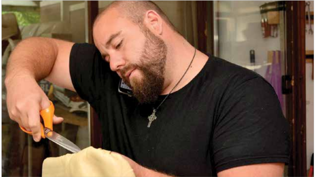
A Barátság mozinak és a Püspöki Palotának is kárpitozott székeket

„A szakképzés utolsó évében megnyertem a Szakma Kiváló Tanulója versenyt. Ez akkoriban még nem járt