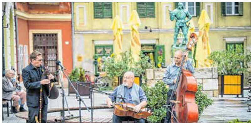
Ünnepi műsorral és koszorúzással emlékezett a város szeptember harmadikán, hétfőn Varkocs Györgyre. A várkapitány 1543-ban a törökök elleni küzdelemben halt hősi halált. Emlékére 1938-ban állított szobrot a város, mely 2013-ban, a Szent István-émlékévben megújult. L. B.