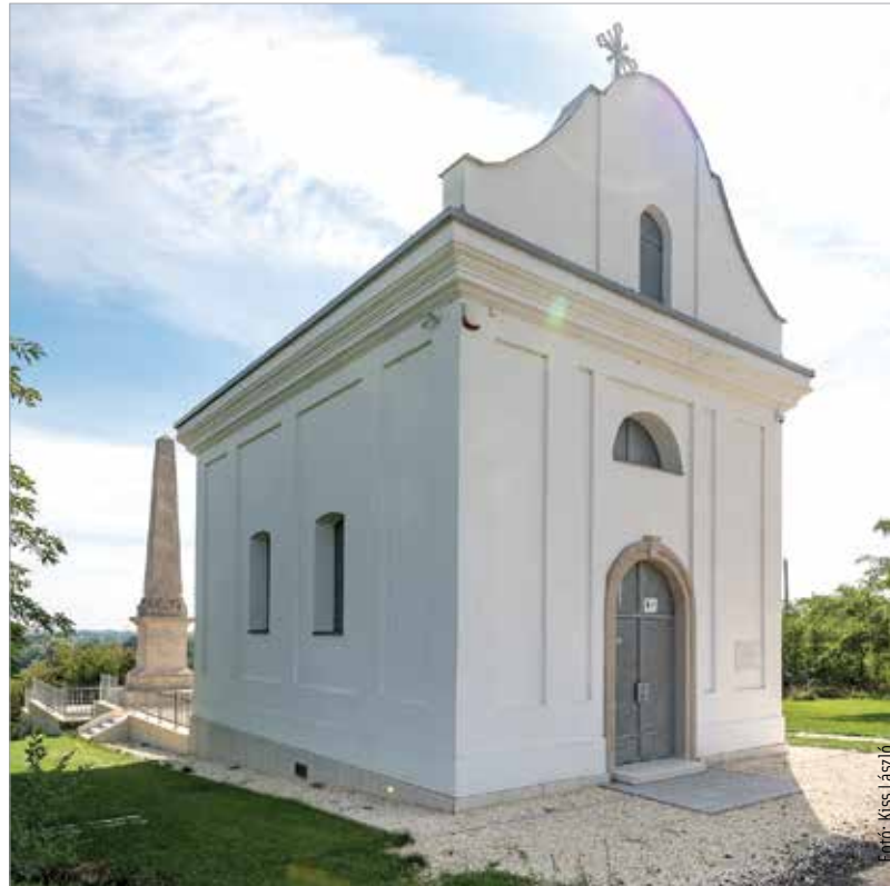
Az egy éve felújított Eötvös-Szapáry kápolnához érdemes kilátogatni, remek kirándulóhely a Duna-part kedvelőinek

volt. Állította, hogy a lányt egy sakter ölte meg. A vizsgálat során megállapítást nyert, hogy friss ásás nyomai látszanak a zsinagóga közelében, és Eszter eltűnése napján késő estig jövés-menés volt a zsinagógában. A nő sikolyokra is jelentkezett tanú. A Tiszaeszláron, majd Nyíregyházán lefolytatott tárgyaláson a védelmet a mezőszentgyörgyi nemes Eötvös Károly ügyvéd látta el. Annak ellenére vállalta a védelmet, hogy az antiszemita közhangulat miatt politikustársai és barátai féltették őt attól, hogy akár a közelébe is menjen a pernek. A vérvádrak hatalmas érdeklődés mellett zajlott. Európában minden szem Eötvös Károlyra szegeződött. A bizonyítékok ízeke szedésével a tehetséges védő bebizonyította, hogy alaptalan vádakkal illették a helyi zsidó közösséget. A lány vízbe fúlhatott, és a tragédiához a megvádoltaknak nincs köze. Híres, hétéoras védőbeszédét követően a bíróság mind a tizenöt vádlottat felmentette. Az ügyvédet pedig a per egycsapásra híressé tette. Győzelmének saját maga számára hiabavalónak bizonyult: Eötvös Károlyt „zsidóbarátságáért” a következő választáson már mellőzték. Az 1883-ban megalakult Antiszemita Párt viszont az 1884-es és az 1887-es választásokon fényes győzelmet aratott. Az pedig, hogy valójában mi történt a szerencsétlen Solymosi Eszterrel, máig sem tisztázódott.