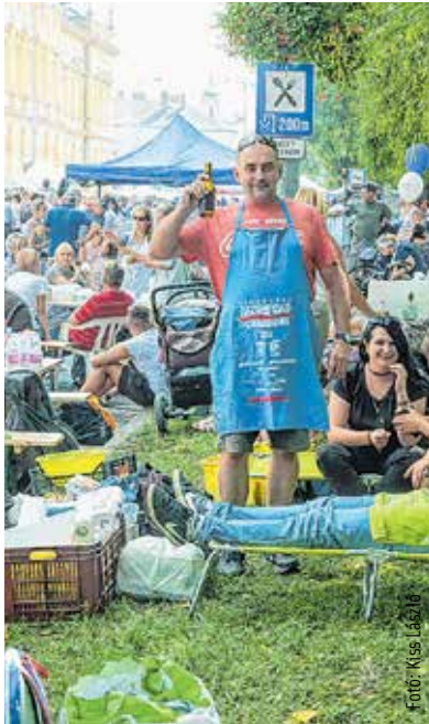
A szakács sörútánptólásáról folyamatosan gondoskodni kell!