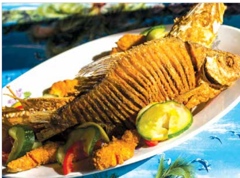
A pisztráng minden formában ingyencsónaknak számít

Tapolcán a halak mellett komoly történelme van a borkereskedelemnek is, így a rendezvény hangsúlyt fektet a hal- és borfogyasztás együttes népszerűsítésére. A pisztráng általában a hal fogyasztása szinte kötelezővé teszi a bor fogyasztását is, hiszen „átkozott a hal a harmadik vízben” – tartja egy latin mondás. Nem nehéz megfejteni, ez mit is jelent. A hal az első vízben úszott, a másodikban párolódott, tehát Isten ellen való véték lenne harmadikként vizet inni hozzá. A közeli badacsonyi borvidéken készült borok – úgymint a kéknyelű, a rózsakő, a szürkebarát vagy az olaszrizling – a halételeket harmonikusan kiegészítik. Ezen kívül lesz népművészeti kirakodó vásár, bemutakoznak a környékbeli borházak, pálinkák, lehet kóstolni különböző halételeket, kenyérlángost és házi rétest is.