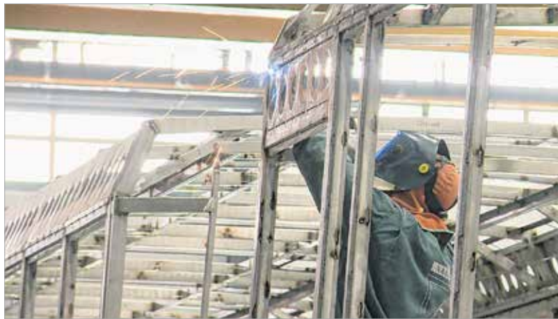
Igy fest az Ikarus busz a gyártósoron karosszéria nélkül, építés közben

A 2015-ben meghirdetett Nagyvállalati Beruházási Támogatási Program keretében eddig több mint ötvenmilliárd forinttal segítette a kormány a magyar vállalatok fejlődését. Ezzel a hozzájárulással 131,5 milliárd forint értékű fejlesztés valósul meg, és több mint kétezer új munkahely jön létre Magyarországon. Az idei évben további tizenötmilliárd forintot fordít erre a célra a kormány – tette hozzá a pénzügyminiszter.