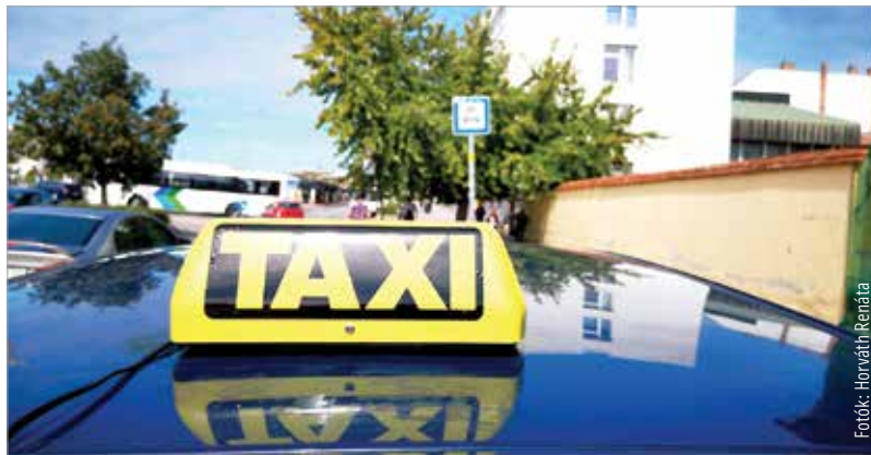
A fehérvári tarifákat a taxitársaságok maguk állapítják meg

A két nagy taxitársasághoz tartozó sofőrök csak név nélkül beszéltek a Fehérváron kialakult, lassan már tarthatatlan helyzetről. Egy negyvenöt-ötven körüli taxis szintén kiemelte: hiányzik az utánpótlás. Az ő tudomása szerint az elmúlt néhány évben két új taxis érkezett a városba. A legfiatalabb sofőr is elmúlt harmincöt éves. Ez az adat főleg annak tekintetében megdöbbentő, hogy Fehérváron harminc évvel ezelőtt