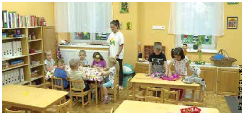
Újra a megszokott helyen, de felújított mesebirodalomban

arról is, hogy befogadja a sajátos nevelési igényű gyerekeket. A mostani beruházás által megvalósult az akadálymentesítés is, aminek köszönhetően a kicsiket még jobban ki tudja szolgálni az intézmény. Az óvoda igazgatója örömmel számolt be a gyerekek első napjáról, amikor birtokba vehették a felújított mesebirodalmat. Mint mondta, felbecsülhetetlen az örömet látni a szülők és a gyerekek arcán egyaránt. A város polgármestere is meglátogatta az ovis csoportokat. Lapunknak elmondta: nagy öröm, hogy Székesfehérváron ismét egy megújult intézményt adhattak át a gyerekeknek. A kétszázötzöt férőhelyes óvoda mintegy négyszázmillió forint európai uniós támogatásból valósult meg.