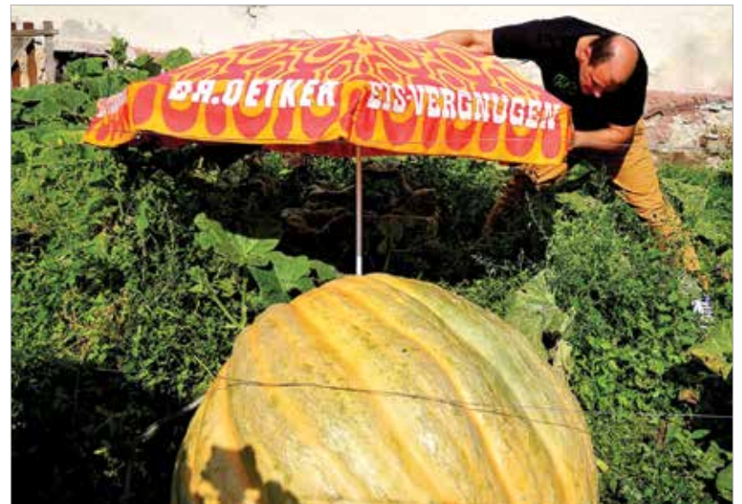
A napernyő ezúttal a tök védelmére szolgál

Mint egy mesebeli kertben, csak éppen ez valóság