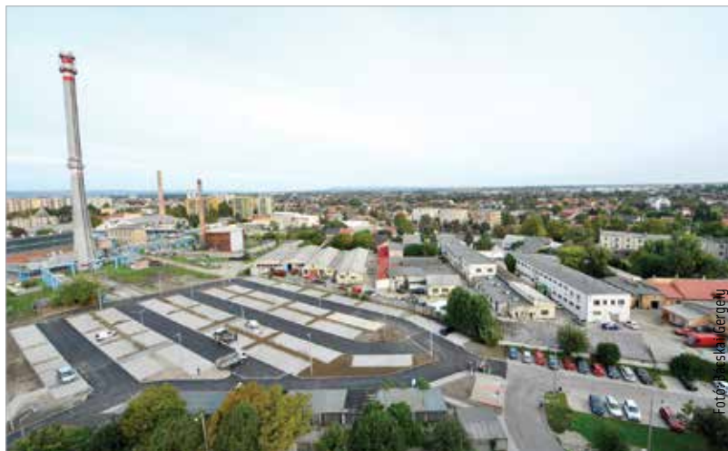
Két ütemben több mint háromszázötven parkoló épült Vízivárosban

A munka ezzel nem áll meg, további új parkolók épülnek a városrészben.