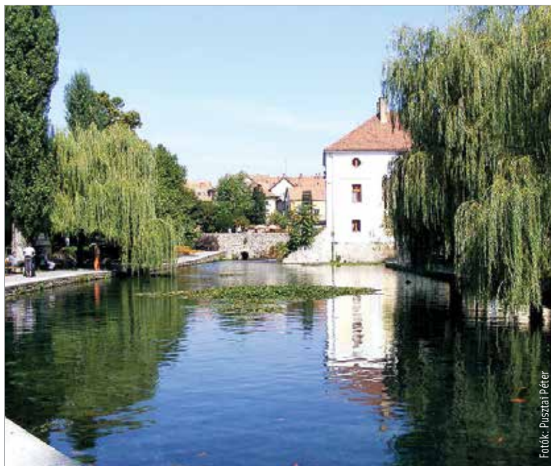
A festői Malom-tónál megfelelőbb helyszínt keresve sem lehetne találni

Kelet-Közép-Európa egyik legnagyobb pisztrángtelepét a csónakázó-barlangként ismert karsztforrásokból kiáramló tiszta, oxigéndús, télen-nyáron tizennyolc fokos karsztvíz táplálja. A város alatt húzódó barlangrendszer számtalan földalatti tóval rendelkezik, melyből egy csónakázható is. A földalatti vizek közvetlen összeköttetésben vannak a város szimbólumává vált Malom-tóval és a megújult parti sétánnyal. A Tapolcát körbelelő nyolc vulkanikus hegy oldalában termő legkiválóbb borokat mutatják be a környék pincészei. A pisztrángfesztiválon több halkészítési módot is megismerhetnek