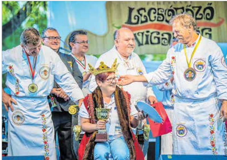
Az Egyesített Szociális Intézmény győztes csapata csülkös lecsóval kápráztatta el a zsűrit

közül csak só, pirospaprikát és borsot használtak. Az étel ízét igazán a füstölt csülök dobta meg. De az nagyon!