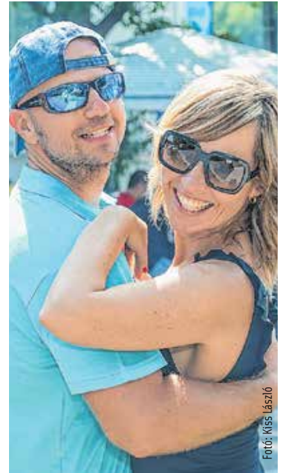
A végére csak a vigasság maradt