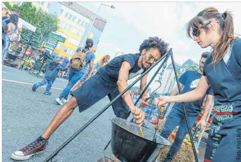
A tökéletes lecsóhoz a füstölt szalonna zsírában kell megpirítani a hagymát

Szombat reggel hét órától gyülekeztek a főzőhelyeken a csapatok. Mindenki szépen sorban pakolta ki a szatyrokból, kosarokból a hagymát, a paprikát, a paradicsomot. A termoszos kávé és a házi pálinka is sokat segített, hogy a közösségépítő főzés gördülékenyen induljon. A feladatok kiosztása után indulhatott a munka. Csattogtak a balták, kopogtak a kések a deszkákon a paprika, a paradicsom és a hagyma alatt. Mire a csípős, őszi reggel