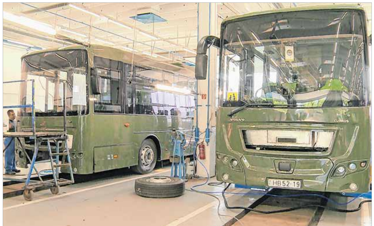
Ez már a végszerelés közbeni állapot. A Magyar Honvédség számára nyolcvan ilyen járművet gyártanak.