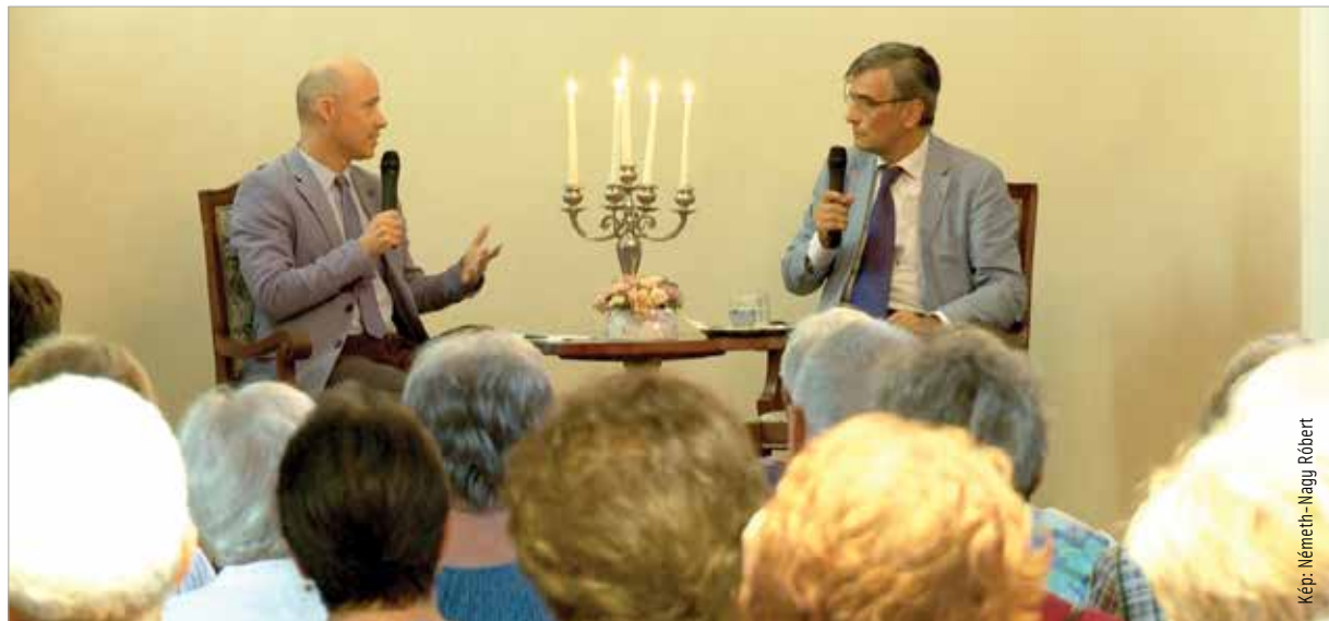
Szabadegyetemi előadás-sorozat indult a megye arisztokráciájáról