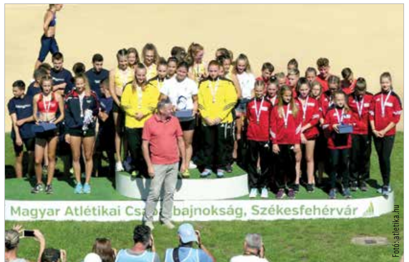
A lányok harminckettő, a fiúk huszonegy pontot vertek a második helyezett csapatra