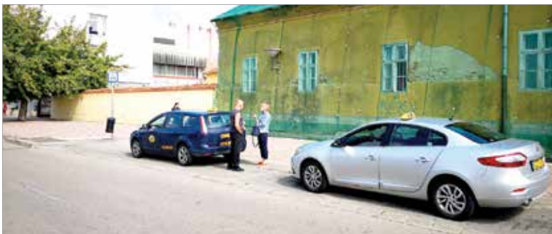
Jelenleg nyolcvan taxis van a városban

Kérdéseinkkel megkerestük a City és a Fehérvár Taxit is. Az egyiknél az ügyvezető szabadságára hivatkozva hátrították a kérdéseinket. A másiknál éppen tulajdonosváltás zajlik, ezért csak annyit mondtak: megértik az utasok felháborodását, mert előfordul, hogy nem tudnak autót küldeni – „de a nincsből nem lehet!”