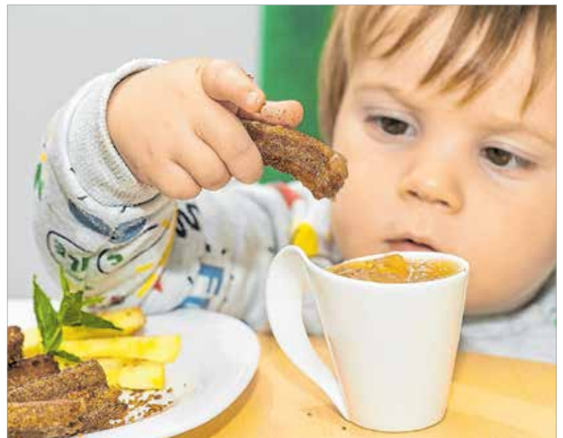
A fotózásra szánt adag pár perc alatt elfogyott...

megforgatjuk a fahéjas cukorban, és még melegen lekvárral vagy csokoládépudinggal tálaljuk.