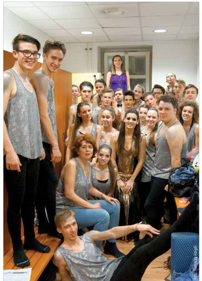
Ciszterések a kulisszák mögött

A bojtárból tündérkirály program olyan népszerű lett az utóbbi