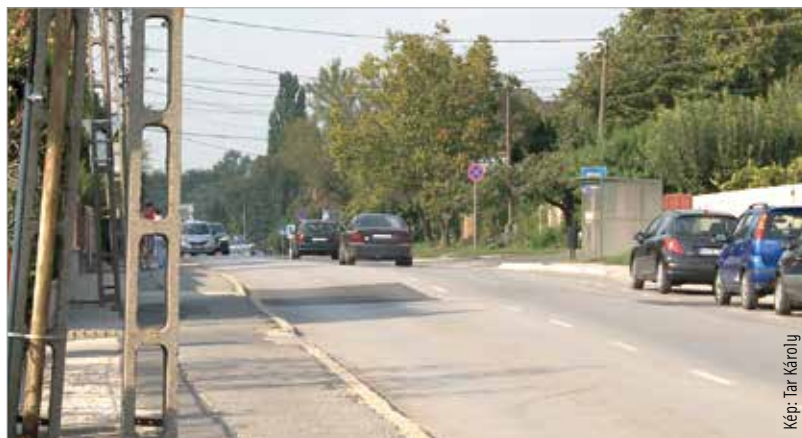
A Fiskális út teljes keresztmetszetét érintő rekonstrukció kezdődik október elsején