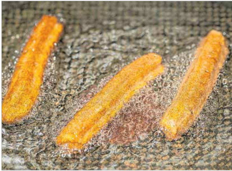
A churrost forró olívaolajban kell kisütni

Hogy az első churrost ki készítette, nem lehet tudni. A spanyolok szerint évszázadokkal ezelőtt a hegyekben legeltető pásztorok találták fel, akik a tűz fölött egyszerű kenyert akartak sütni. Hosszas próbálkozások és kudarcok során rájöttek, ha hosszúkas, csillagformájú tésztát készítenek, könnyebben átsül a belseje úgy, hogy a kérge ropogós marad. Mivel a kenyérke alakja hasonlított a birkák szarvára, ezért az általuk legeltetett churra fajtájú birkáról churrosnak nevezték el.