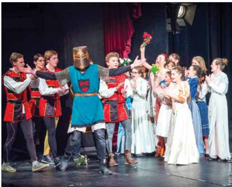
Tavaly összesen négyszáz diák szerepelt a Toldiban

években, hogy idén már többen jelentkeztek rá, mint amennyi résztvevőt elbírnak a darab. A kihívás adott, tavasszal pedig megláthatjuk, mire jutott az a közel ötszáz diák, akik a Vörösmarty Színházban az Odüsszeust tolmácsolják a nagyérdeműnek.