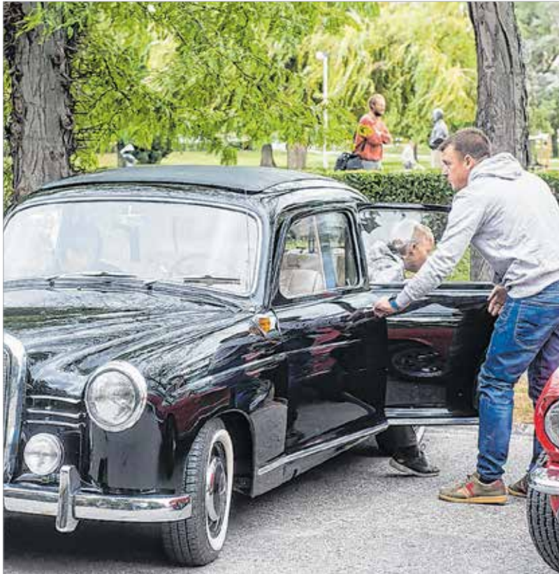
Kívül is, belül is meg lehetett nézni, milyen járgányokkal utaztak a múlt század első felében