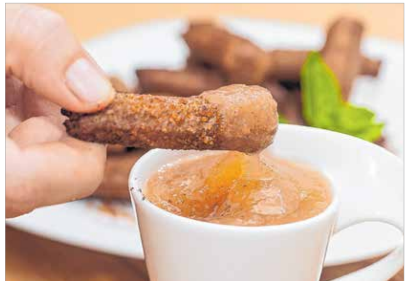
A churros és a baracklekvár remekül illik egymáshoz

Egy nyeles fazékban felforraltjuk a vízben a vaját, a cukrot és a sót. Egy főzőkanállal sűrűn keverjük,