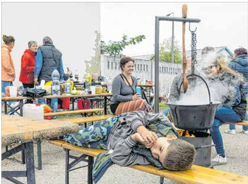
Ki mondta, hogy csak ebéd után lehet szundítani?

tartja, hogy a maroshegyiek egyre inkább magukénak érzik a szüreti mulatságot, s egy olyan közösségi esemény résztvevői lehetnek, amely valóban mindenkié: „Ez a fesztivál olyan tradícióval bír, ami évek óta megmozgatja a helyi közös-