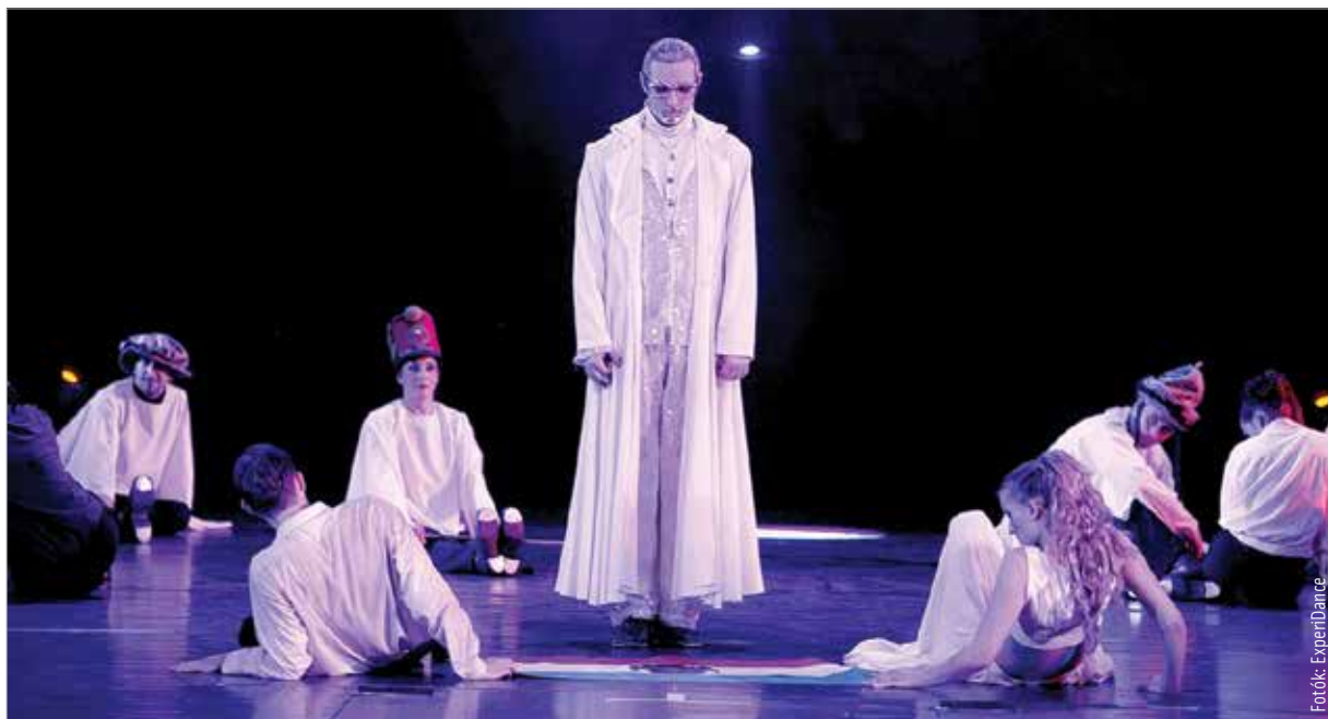
Az Ezeregyév Generációkat október huszadikán láthatják a fehérváriak