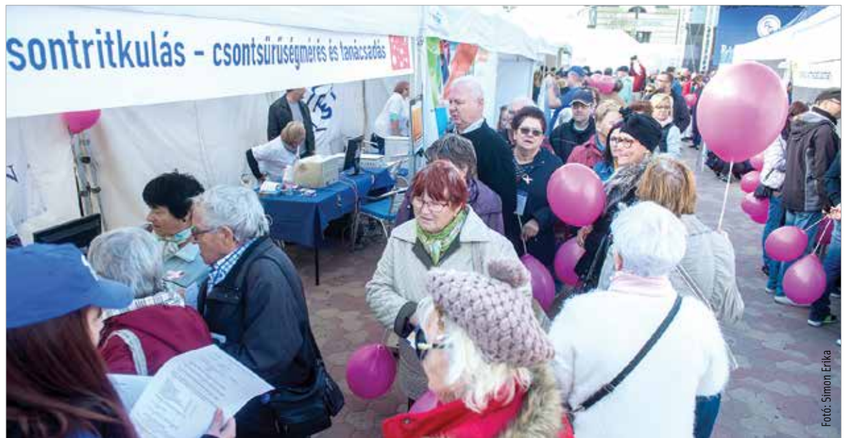
Több százan vettek részt a szűréseken

Idén is több százan vettek részt a rózsaszín lufis felvonuláson. A séta a Palotai kapu térre vezetett, és idén első alkalommal összefonódott a Richter egészségnap programjával. Az Alba Plaza előtt számos vizsgálat, tanácsadás és színpadi produkciók várták a fehérváriakat. Azok, akik részt vettek az ingyenes szűréseken, adománypontokat gyűjthettek, ezzel pedig egy jótékony ügy mellé is álltak.