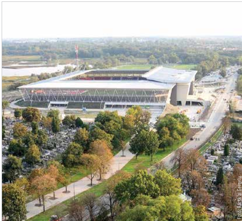
A stadionnal együtt a városrész is megújult

A használatbavételi engedélyeztetési eljárás során a hatóságok is alaposan átvizsgálják a létesítmény minden négyzetméterét és teljes infrastruktúráját. Székesfehérvár önkormányzata közleményében kiemelte: a biztonság és a minőség a két kulcsszó, ezeknek kell megfelelnie a megújult stadionnak, ami a mérkőzések mellett modern technikával felszerelt közösségi térként is szolgálja majd az itt élőket. Hangsúlyozták azt is, szeretnék, ha mielőbb – minden engedély birtokában – hazai terepen léphetne pályára a MOL Vidi FC. Még szeptember 4-én látott napvilágot a hír, hogy az önkormányzat nem fogadta el a Sóstói Stadion kivitelezőjének készre jelentését, és a hiányosságok pótlására szólította fel a Strabag által vezetett konzorciumot. A stadionrekonstrukcióra vonatkozó szerződésben egyébként augusztus 30-a volt a kivitelezés befejezési határideje. Úgy tűnik, hamarosan pont kerülhet a történet végére, vagyis befejeződhet a nagyberuházás, ami nemcsak sportcélú, hanem a teljes Sóstó városrész megújulását is jelenti. Ezek között is kiemelkedik