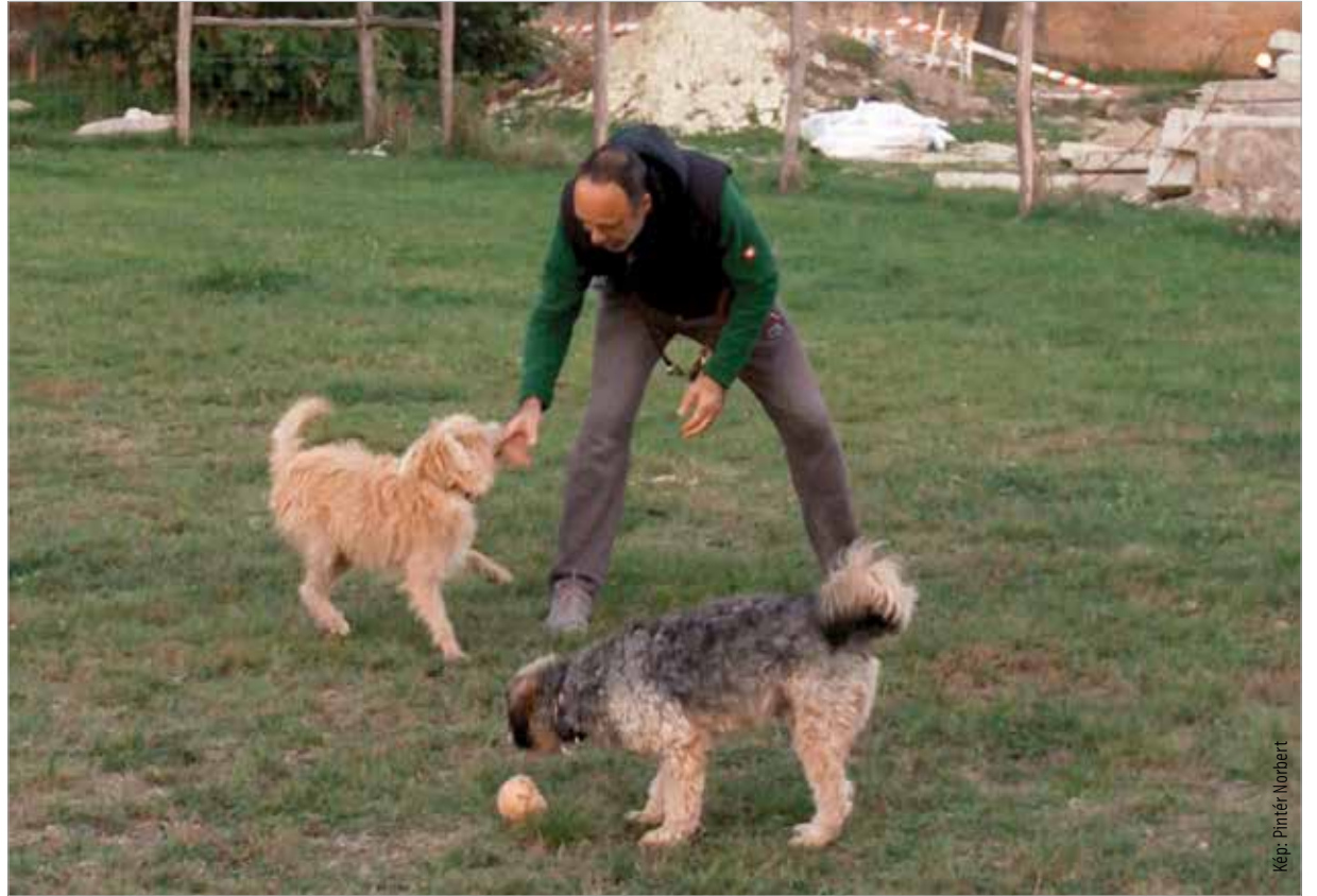
Póráz nélkül csak a kutyafuttatóban mozoghat a kutya

A kutyát – nyilvántartásba vétel céljából – három hónapos kor betöltését követően tizenöt napon belül be kell jelenteni a jegyzőnek. Ugyancsak be kell jelenteni, ha a kutya elpusztult, elveszett, tartási helye három hónapnál hosszabb időre megváltozott vagy új tulajdonoshoz került.