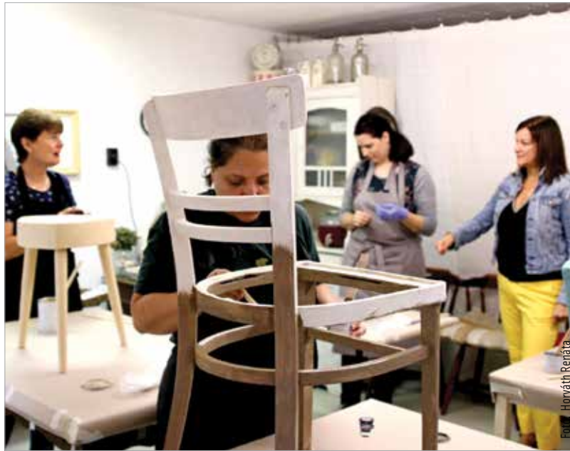
Munkában a RegAndina Alkotóműhely