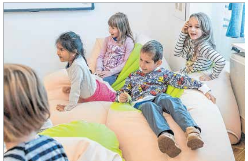
A gyerekek rögtön birtokba vették a Népmesepontot