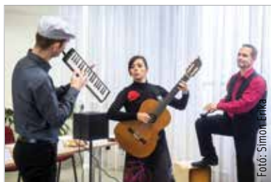
A Melodika Project három tagja rendhagyó hangszeres felállásban szólaltatja meg a jól ismert dallamokat

A Partitúra Ifjúsági Hangversenysorozat négy alkalommal, négy időpontban várja a fiatalokat az Alba Regia Szimfonikus Zenekarral. Elsőként október 8-án Rómeó és Júlia – ahogy Prokofjev látta címmel csendülnek fel a nagy orosz zeneszerző életművének talán legszebb dallamai, majd december 3-án népszerű válogatást hallhatunk Csajkovszkijtól Johann Straussig. 2019. február 5-én Változatok és fuga egy Purcell-témára címmel hallhatjuk Benjamin Britten remekművét, mely azzal a céllal született, hogy egy oktatófilm keretén belül mutassa be a gyerekeknek a zenekari hangsze-