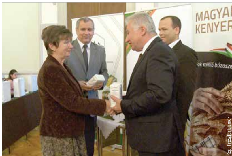
A Magyarok kenyere akció hozadéka, hogy a Gyermekvédelmi Központ is részesülhetett az összegyűjtött élelmiszer-adományokból

nyezettudatos, egészséges életmód segítése. A szakmai rendezvényen Jakab István, az Országgyűlés alelnöke megerősítette, hogy a kormány minden segítséget megad a helyi termékek népszerűsítéséhez: „A magyar mezőgazdaság egy olyan átalakulási folyamaton megy keresztül, ahol figyelembe kell vennünk az adottságainkat. Ebből kiindulva fontos számunkra az, hogy az emberekhez eljussanak a helyben előállított termékek, és minél kisebb legyen az ökológiai lábnyom. A cél, hogy a helyben megtermelt élelmiszer helyben kerüljön fogyasztásra!”