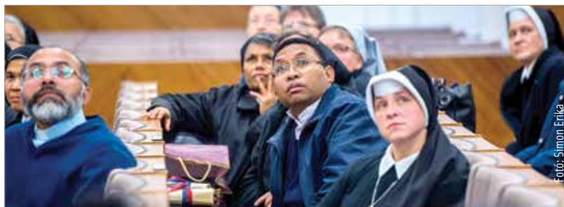
A külföldi misszionáriusok megismerkedtek a város történelmével is

mód okoz jelentős károkat. Kiemelte, hogy a gyermekek egészséges lelki fejlődéséhez elengedhetetlen a szerető, összetartó család, így a misszionáriusoknak a családok megerősítésén kell fáradozniuk. Magyarország apostoli nunciust és a hazánkban szolgáló külföldi misszionáriusokat délután a Városházán fogadta a polgármester, aki a város történelmi jelentőségéről is beszélt a vendégeknek, kiemelve, hogy Szent István városa elképzelhetetlen a keresztény kultúra és értékrend nélkül. Felidézte, hogy a kommunista diktatúrában nem volt divat keresztény kultúráról és értékekről beszélni, ezért újjá kell építeni ezt a lelkiületet az emberekben: ez is egyfajta missziós tevékenység. Cser-Palkovics András szólt arról a kiváló együttműködésről is, ami az önkormányzat és a Székesfehérvári Egyházmegye viszonyát jellemzi.