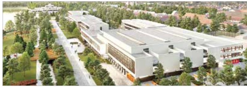
Így néz majd ki a középiskolai campus környéke

A Csónakázó-tó mellett a Szabadságharcos út és a Sár utca között 4,7 hektáron, harmincöt ezer négyzetméternyi hasznos területen valósul meg a beruházás. Négy intézmény – a Vasvári Pál Gimnázium, a Kodolányi János Gimnázium és Szakgimnázium, a Tóparti Gimnázium és Művészeti Szakgimnázium valamint a második ütem keretében a Hermann László Zeneművészeti Szakgimnázium és Alapfokú Művészeti Iskola – összesen több mint két és félezer diákjának biztosítja majd a tanulás lehetőségét egy 21. századi épületegyüttesben a beruházás. A lakossági fórumon elhangzott, hogy többféle szempontból vizsgálták az érintett területet, forgalomszámlá-