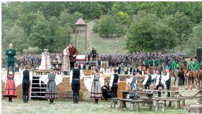
Pákozdi 1848 – A reményt adó győzelem