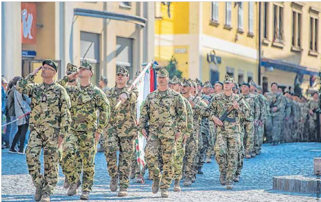
Szombaton tartalékosesküt tett és átvette a köztársasági elnök által adományozott csapatszázlót az október elsejével megalakult 6. Sipos Gyula Területvédelmi Ezred mintegy háromszáz katonája

A szervezeti átalakítás a Zrínyi 2026 program részeként valósul meg. Az új egység neve Magyar Honvédség Parancsnoksága lenne, és itt zajlana a haderő vezetése – tudtuk meg a honvédelmi minisztertől. A honvédség parancsnoka a vezérkari főnök lenne, és a minisztérium ezután inkább ellenőrző szerepet töltene be a haderő életében. Míután azonban még nem született parlamenti döntés az ügyben, további konkrétumokról nem nyilatkozott Benkő Tibor. A miniszter hangsúlyozta, hogy bár a városvezetés és a Honvédelmi Minisztérium közös célja és érdeke a fehérvári központ létrehozása, ennek feltételrendszerét is meg kell teremteni. Vagyis ahhoz, hogy a 21. századnak megfelelő parancsnokság jöjjön létre, a