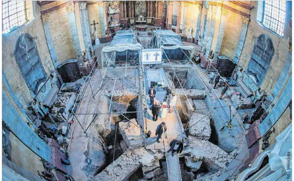
A ritka lelet és az ásatás során előkerült falmaradványok is megerősítik: Székesfehérvár belvárosának legmagasabb pontján a középkorban jelentős egyházi épület állt