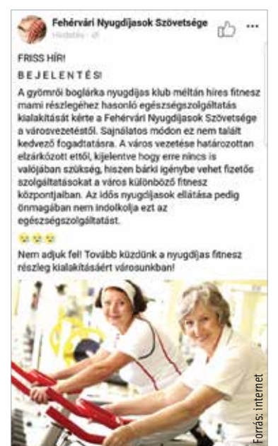
gei ügyében, így a megkeresésre való választól elzárkózni sem tudtak, sem határozottan, sem határozatlanul...