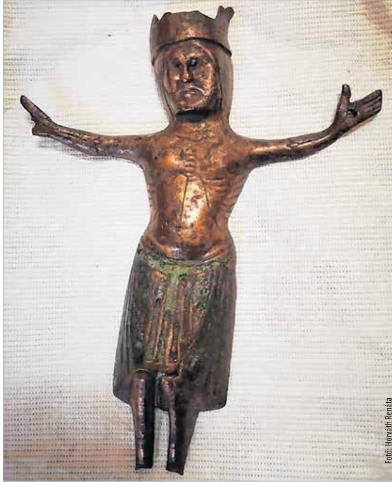
A korpusz minden bizonnyal egy dél-franciaországi ötvösműhelyből származik

A székesegyház kormányzati forrásból külsőleg már megújulhatott. A belső megújulás megkezdésével pedig létrejöhett a Csók István Képtárban a Barokk mennyország kiállítás és