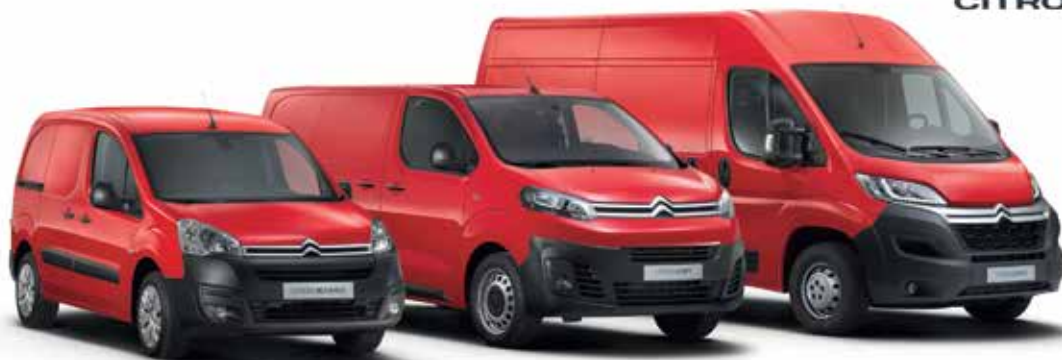
CITROËN BERLINGO FURGON