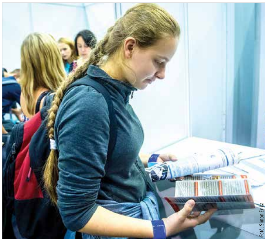
A rendezvényen képviseltették magukat a fehérvári felsőoktatási intézmények: az Óbudai Egyetem Alba Regia Műszaki Kara, a Budapesti Corvinus Egyetem Székesfehérvári Campusa és a Kodolányi János Egyetem

A standoknál információkkal, munkalehetőségekkel várták az érdeklődőket a Fejér Megyei Hírlap állásbörzén. Az Alba Regia Sportcsarnokban az egészen kicsi cégektől a legnagyobb multinacionális vállalatokig széles körben találhattak állást az érdeklődők. De nemcsak a felnőtteknek kínált hasznos információkat a program, a diákok is több kérdésre választ kaphattak: mik a vállalkozások nyújtotta lehetőségek, milyen felsőoktatási szakokra érdemes jelentkezni, milyen lehetőségek vannak a duális képzések terén. A továbbtanulás előtt