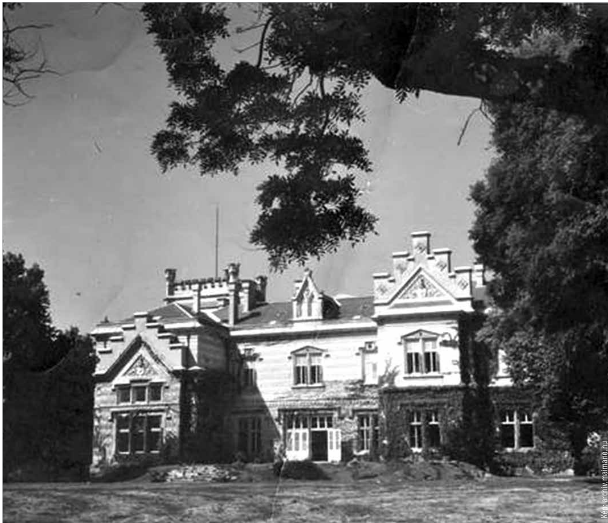
Nádasdladány az 1900-as évek elején

Széchényi Viktor leköszönő fő- ispán ajánlása az apára, Janko- vich Béla volt kultuszminiszterre és Jankovich Miklós kiváló teh- etségére hivatkozással történt. Az ajánláshoz bizonyára hozzá- járult a Széchényi és Nádasdy család mély barátsága és szoros összefonódása. A társadalmi különbségeket 1918-ig címek adományozásával egyenlítette ki az uralkodó. Utolsó királyunk száműzése után a címek adomá- nyozását a pozíciókba helyezés pótolta. A rácalmási földbirtokos a főispáni tisztség felkínálásával Nádasdy Ilona grófnőhöz illő rangot, tekintélyt és jövedel- met kapott. Buda ostroma alatt mindkét család a várban rekedt. Egymásra figyeltek, egymást tá- mogatták. Az emlékezet szerint Jankovich Miklós találta meg néhány héttel az ostrom befeje- ződése után az egyik templom lépcsőjén üldögélő, a fogságból az utcára kitett, magáról mit sem tudó, lázas beteg Széché- nyi Viktort, és helyezte el ápoló kezek biztonságába. A második világháború után a Jankovich házaspár a budai várban, egy Tárnok utcai lakásban élt. Soká- ig megőrizték egymást. Janko- vich Miklós 1978-ban, Nádasdy Ilona 1984-ben költözött át a rácalmási temető családi kriptá- jába. A rácalmási ősi barokk kúria ma gyönyörűen felújítva ad háttérrel a település rendez- vényeihez. A környék szépsége segíti megérteni Nádasdy Ilona választását.