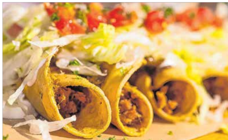
Kívül roppanós, belül krémes