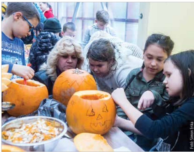
Családi délutánon faragták a tököket