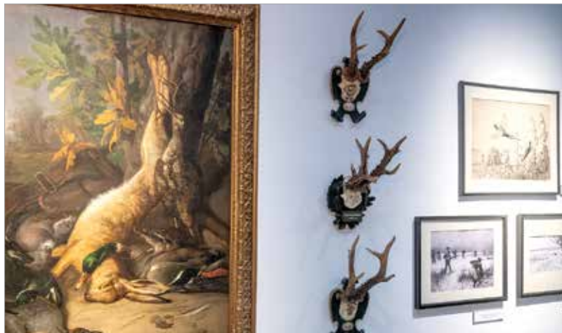
A kiállítás megragadja a vadászat Fejér megyei történetének több korszakát a tizennyolcadik századtól a Horthy-éráig