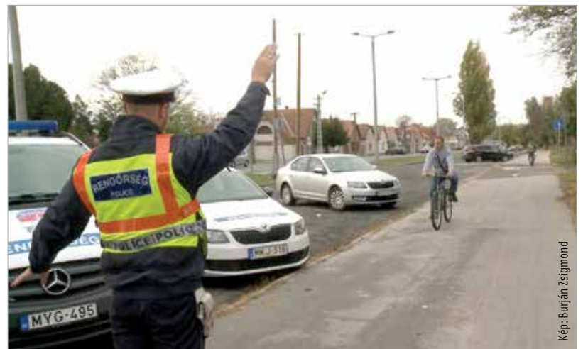
A biztonság közlekedés alapja a láthatóság