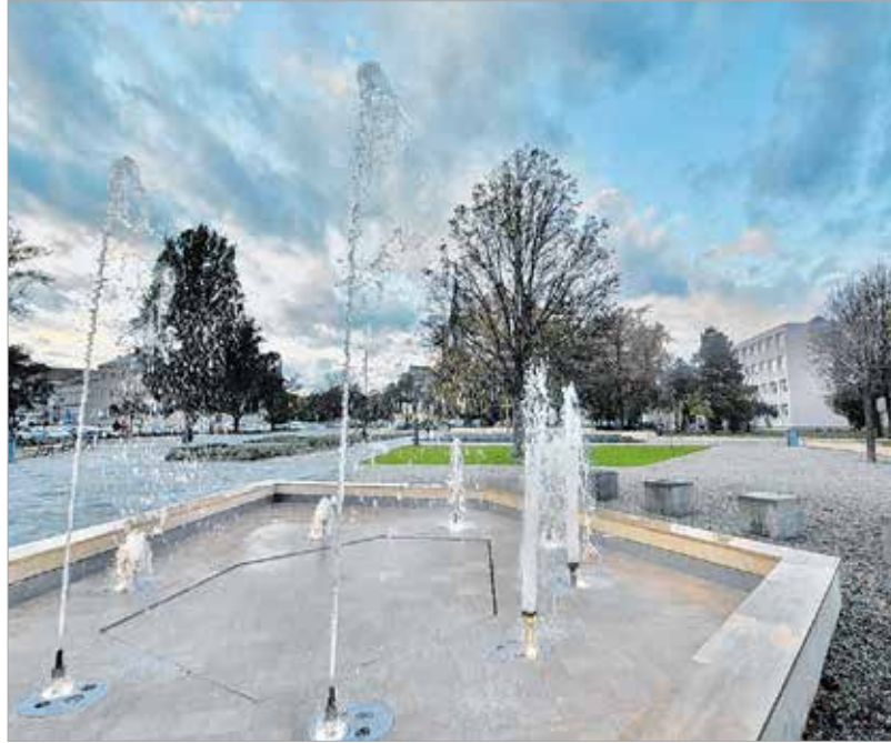
A Jávor Ottó téren mostantól egy szökőkút is csobog