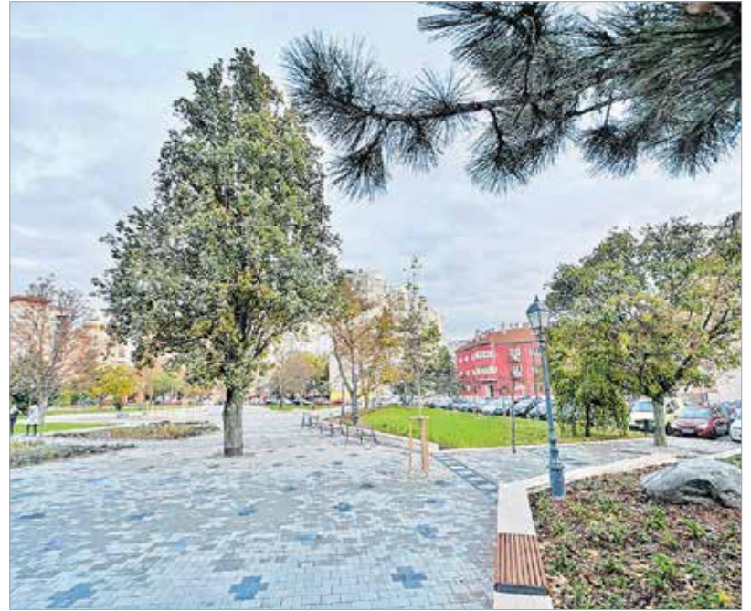
A felújítás során több mint ötezer növényt ültettek el a szakemberek