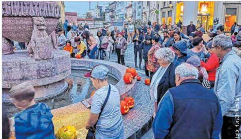
Már a meghirdetett kezdési időpont előtt rengetegen érkeztek

pások. A szervező fmc.hu csapata azzal az elképzeléssel indította útjára a kezdeményezést, hogy egy kötetlen őszi délután folyamán bárki megmutathassa otthon készített töklámpását a városnak, vagy csak kilátogasson és nézelődjön egy jót. A tökfaragás egyébként nem újkeletű, és nem is feltétlenül a halloweenhez kötődő hagyománya úgy tűnik, népszerű Fehérváron is: jókedvű, népes tömeg gyűlt össze az I. Fehérvári Töklámpásfesztiválon október 28-án.