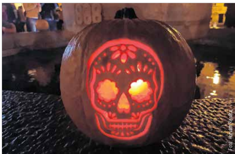
Az alkotásaikba láthatóan rengeteg munkát fektettek a fesztiválra érkezők