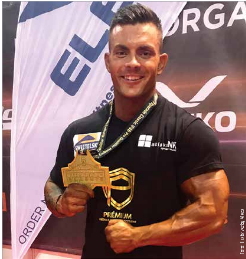
Barcelonából tapasztalatokkal, a Fitparádéről érmeikkel tért haza

Rengeteget tanultam a barcelonai kalandból, de leginkább azt, hogy mennyi mindent nem tudok még. Fiatal vagyok, és bár nyertem már