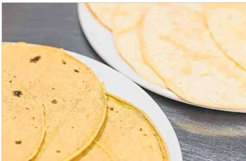
A mexikóiak kenyere a kukoricatortilla (balra), ami egy forró lapon sült vékony lepény-szerűség. Szinte mindenhez ezt eszik. A búzatortilla (jobbra) csak később, a nyugati civilizáció hatására jelent meg.

tépett csirkével. Utána jön az egyik szósz: a tejfökhöz hozzácsurgatjuk a főzőkrémet, majd addig keverjük, amíg folyós nem lesz. A kukoricatortillákat nagyjából tizenöt másodpercre bele rakjuk a mikróba, hogy megpuhuljanak, így később könnyebben fel tudjuk őket tekerni. A langyosítás után a tortillákba nagyjából huszonegy grammnyi töltelék tesztünk. Felcsavarjuk őket, végül fogsízkálóval megtűzdeljük, nehogy süítés közben szétnyíljanak. Egy mély serpenyőbe olajat öntünk, és közepes lángon megsütjük a tortillatekerceket. Mikor szép, aranybarna színűk lesz, kivesszük őket az olajból és papírtörőn lecsöpögtetjük. Egy tányérra öt tekercest teszünk, és ízlés szerint meglocsoljuk a tejfőléssal és a ranchera szósszal. Végül a tetejére bőségesen szórunk a jégсалátaból és a Pico de Gallóból.