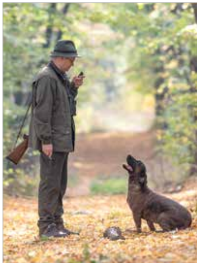
A vadászat Széchényi Zsigmond szerint vadűzés és erdőzúgás... de több erdőzúgás!

A megnyitón Bóka Viktor jegyző Széchényi Zsigmond szavait idézte, miszerint „A vadászat fantasztikus dolog! A vadászat vadűzés és erdőzúgás... de több erdőzúgás!” Majd felelevenített két híres vadásztörténetet. Az egyik Sarvaicz Lajos híres Velencei-tavi tóbíró vadászbalesete: Széchényi Zsigmond édesapja 1928-ban meghívta barátját, a német nagykövetet libavadászatra a Velencei-tóra. Hirtelen