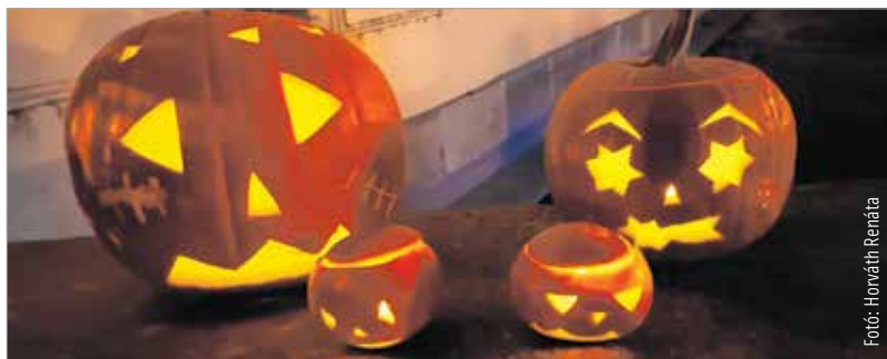
Kedves és ijesztő képű tök egyaránt akadt