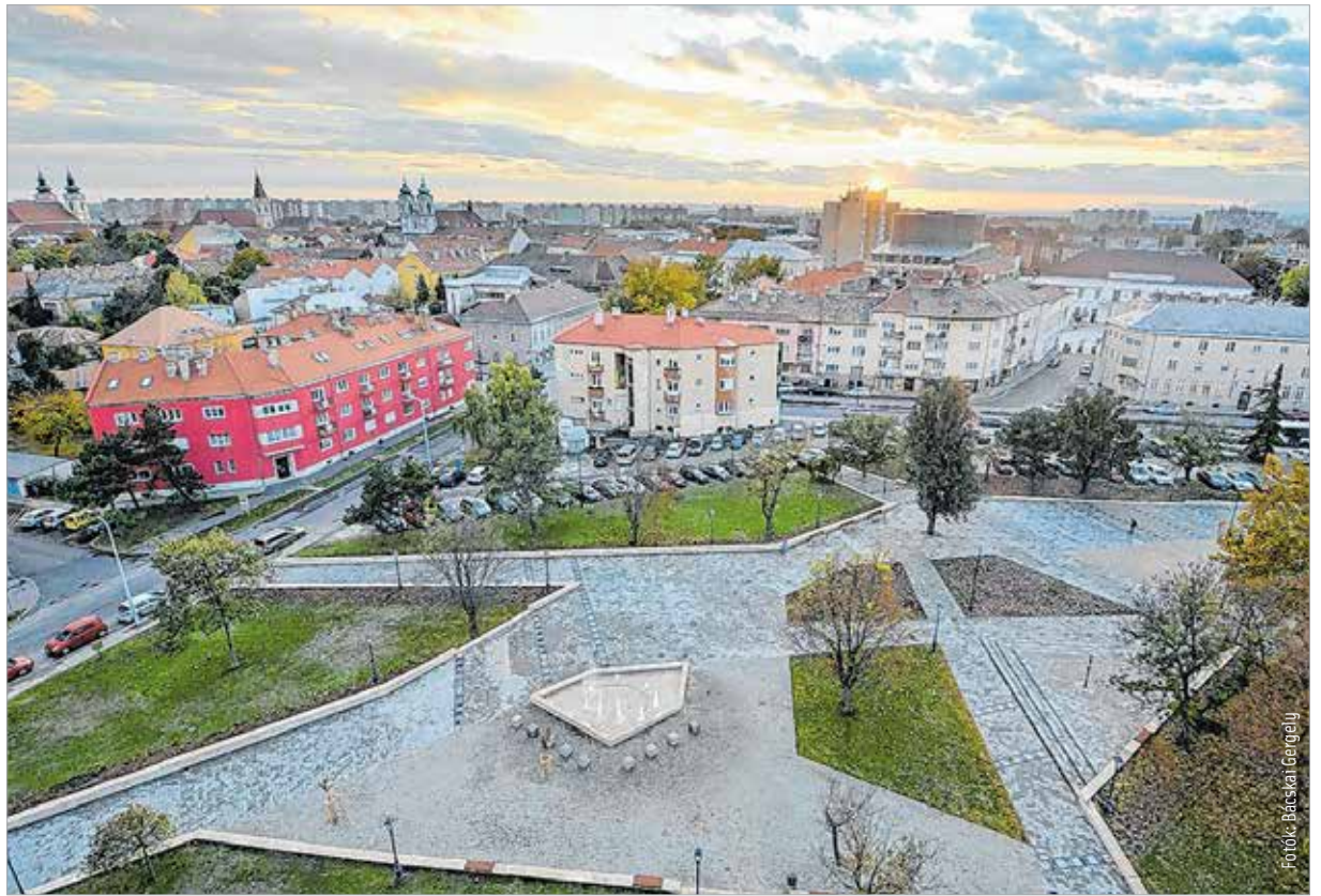
A modern formát öltő terület immár alkalmas ünnepek, rendezvények lebonyolítására

A régi vörös murvás sétautak helyén mostanra mészkő burkolatú támfalakkal szegélyezett térköves sétányok, füves felületek épültek, az emlékművek környezetében pedig évelőket, díszfüveket és rózsákat is ültettek. A Jávor Ottó tér megújításával újabb színfolttal gazdagodott a város. A parkban lévő növények fenntartását segíti az újonnan kiépített öntözőrendszer és a fák körül kialakított locsolópontok. A felújítás során a közvilágítás is megújult, az emlékművek méltó környezetbe kerültek. Melléjük évelőket, hagymásokat, díszfüveket és rózsákat is ültettek, a tér közepén kialakított nagy méretű ágyásba különböző cserjéket helyeztek el. De a park ékköve a születek parkja, ahol az előző évben születtek tiszteletére fákat ültetnek majd. A tér a téli időszakban már bekapcsolódik az adventi fényáradatba is, így az erre járóknak a város ezen részén is szemet gyönyörködtető látványban lehet részük. A parkfelújítás önkormányzati forrásból, kétszázötvenmillió forintból valósult meg.